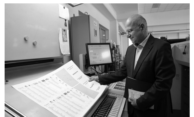
2026: Οι εκλογές της 24ης Μαΐου 2026 έχουν αποκτήσει νέα χαρακτηριστικά, ποιοτικά και ποσοτικά. Το σενάριο μιας εννεακομματικής Βουλής δεν φαίνεται απομακρυσμένο. Μαζί με τα παραδοσιακά κόμματα φαίνεται πως στη νέα Βουλή θα εισέλθουν και νέοι κομματικοί σχηματισμοί, αποτελέσματα ενός κοινωνικού μετασχηματισμού.