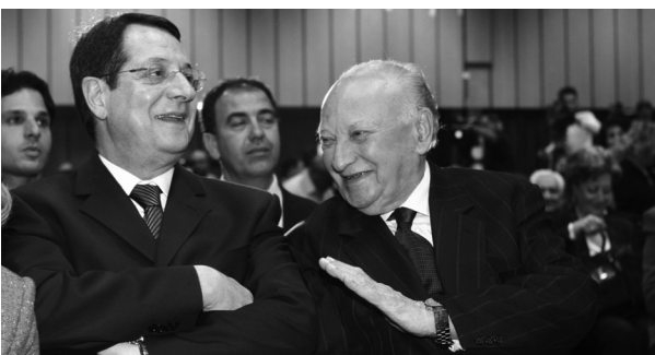
2006: Ο Γλαύκος Κληρίδης και ο Νίκος Αναστασιάδης στο έκτακτο Παγκύπριο Συνέδριο του ΔΗΣΥ, το Μάρτιο του 2006, κατά την παρουσίαση του ψηφοδέλιου του κόμματος για τις βουλευτικές εκλογές του 2006.