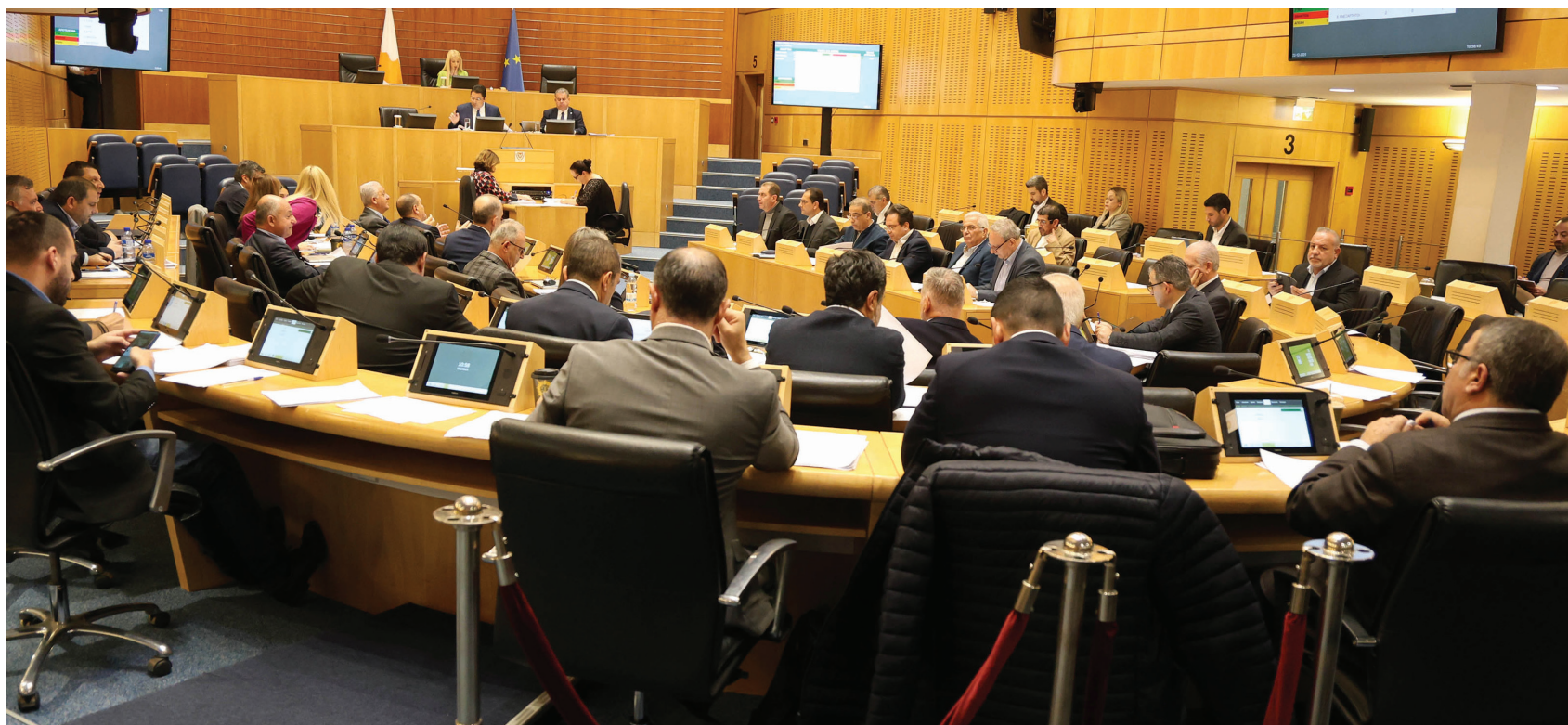
Η απελθούσα Βουλή είχε περιορίσει ακόμα και το κονδύλι των 5,7 εκατομμυρίων ευρώ κατά 5% και είχε φτάσει στα 5,4 εκατομμύρια ευρώ. Ωστόσο είναι δεδομένο πως θα ζητηθεί πρόσθετο κονδύλι το οποίο και θα προσεγγίζει το ποσό των 6 εκατ. ευρώ.