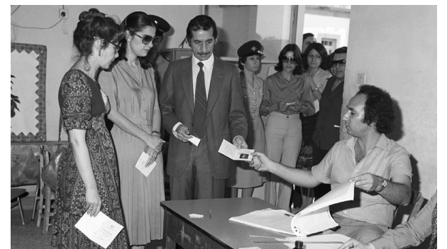
1981: Οι πρώτες εκλογές της νέας δεκαετίας, αυτές της 24ης Μαΐου 1981 ήταν οι πρώτες που διεξήχθησαν με το σύστημα της ενισχυμένης αναλογικής. Σε αυτές τις εκλογές εξελέγη με το ΔΗΚΟ στην επαρχία Κερύνειας η Ρίνα Κατσελλή ήταν η πρώτη γυναίκα βουλευτής από την ε/κ κοινότητα. Στη φωτογραφία ο Τάσος Παπαδόπουλος ασκεί το εκλογικό του δικαίωμα.