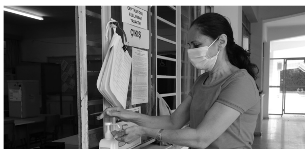
2021: Οι βουλευτικές εκλογές του 2021 έγιναν με τα μέτρα για την επιδημία του κορωνοϊού να είναι σε πλήρη εφαρμογή. Τότε προβλέφθηκαν ειδικά μέτρα για τα πρόσωπα που βρισκόταν σε κατ' οίκον περιορισμό.