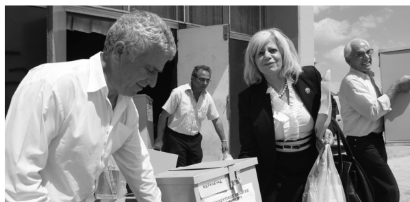
2011: Στις εκλογές της 22ας Μαΐου 2011 έλαβαν μέρος δέκα κόμματα/κινήματα. Μετά την εκλογή του Νίκου Αναστασιάδη στο αξίωμα του Προέδρου, κατήλθοντα βουλευτή ανέλαβε, στις 7 Μαρτίου 2013, ο Ανδρέας Θεμιστοκλέους, ως πρώτος επιλαχών στην εκλογική περιφέρεια Λεμεσού.