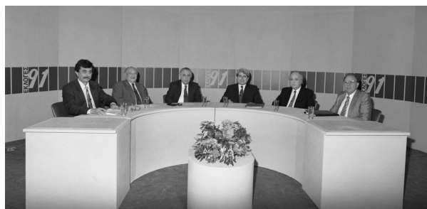
1991: Οι αρχηγοί των κομμάτων: Γλαύκος Κληρίδης ΔΗΣΥ, Σπύρος Κυπριανού ΔΗΚΟ, Δημήτρης Χριστόφιας ΑΚΕΛ, Βάσος Λυσσαρίδης ΕΔΕΚ και Παύλος Δίγκλης ΑΔΗΣΟΚ, σε συζήτηση στο Ραδιοφωνικό Ίδρυμα Κύπρου, με συντονιστή τον δημοσιογράφο Δημήτρη Αντρέου.