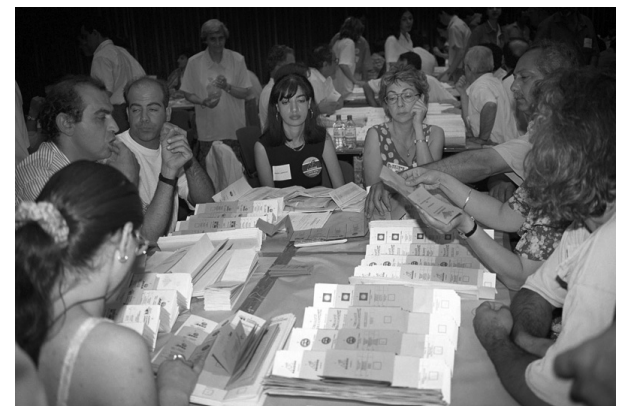
1996: Οι εκλογές της 26ης Μαΐου 1996 διεξήχθησαν με ένα σύστημα που προσομοιάζει στην απλή αναλογική, το οποίο εισήχθη έπειτα από τροποποίηση του εκλογικού νόμου τον Ιούνιο του 1995. Στις εκλογές κατήλθαν έξι κόμματα (ΑΔΗΣΟΚ, ΑΚΕΛ-Αριστερά-Νέες Δυνάμεις, ΔΗΚΟ, Κίνημα Ελευθέρων Δημοκρατών, Νέοι Ορίζοντες, Σ.Κ. ΕΔΕΚ) και ένας συνασπισμός κομμάτων (Συνασπισμός ΔΗΣΥ-Κόμμα Φιλελευθέρων). Επίσης, στην εκλογική αναμέτρηση έλαβε μέρος για πρώτη φορά και το Κίνημα Οικολόγων Περιβαλλοντιστών (ιδρύθηκε τον Φεβρουάριο του 1996).