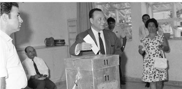
1970: Ο Γλαύκος Κληρίδης ασκεί το εκλογικό του δικαίωμα στις δεύτερες βουλευτικές εκλογές της Κυπριακής Δημοκρατίας. Οι εκλογές διεξήχθησαν στις 5 Ιουλίου του 1970 και έλαβαν μέρος 5 συνδυασμοί κομμάτων και 18 ανεξάρτητοι υποψήφιοι.

οι μεμονωμένοι υποψήφιοι). Οι γυναίκες που διεκδικούν ψήφο είναι 224 ή ποσοστό 29,7%. Από τα δύο κόμματα λοιπόν φτάσαμε στα 19, με το σενάριο μιας εννεακομματικής βουλής να είναι πολύ πιθανό, και από τις γυναίκες υποψήφιες που μετρούντο μετά βίας στα δάκτυλα του ενός χεριού να έχουμε 224, ποσοστό που δεν είναι ακόμη ικανοποιητικό, μιας και είμαστε κατά πολύ κάτω από τον ευρωπαϊκό μέσο όρο, σύμφωνα με τα στοιχεία του Ευρωπαϊκού Ινστιτούτου για την Ισότητα των Φύλων. Πιο κάτω μία μικρή φωτογραφική αναδρομή από εκλογικές αναμετρήσεις.