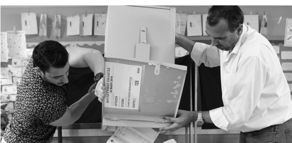
2016: Εγιναν στις 22 Μαΐου 2016 και έλαβαν μέρος 13 κόμματα/κινήματα και 5 ανεξάρτητοι υποψήφιοι. Μετά από αυτές τις εκλογές προέκυψε το λεγόμενο πρόβλημα της 56ης έδρας, με την αποποίηση της βουλευτικής έδρας που κέρδισε στη Λεμεσό η πρόεδρος του Κινήματος Ελένη Θεοκάρους.