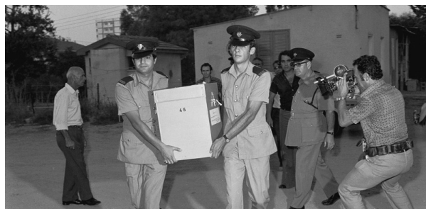
1976: Στις εκλογές της 5ης Σεπτεμβρίου 1976, δύο χρόνια μετά την εισβολή, κατήλθαν δύο συνδυασμοί κομμάτων, ο Δημοκρατικός Συναγερμός - Δημοκρατικών Εθνικών Κόμματα και τα συνεργαζόμενα κόμματα Α.Κ.Ε.Λ.-Αριστερά, Σοσιαλιστικό Κόμμα ΕΔΕΚ και η Δημοκρατική Παράταξη.