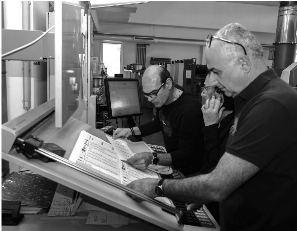
Δικαίωμα συμμετοχής στις εκλογές έχουν συνολικά, 568.587 ψηφοφόροι, με τους 859 να είναι Τουρκοκύπριοι, ενώ στον εκλογικό κατάλογο βρίσκονται και 595 εγκλωβισμένοι που δεν περιλαμβάνονται στον συνολικό αριθμό.

Ανάμεσα στους 568.587 ψηφοφόρους, συμπεριλαμβάνονται και 859 Τουρκοκύπριοι οι οποίοι είναι κάτοχοι δελτίου ταυτότητας της Κυπριακής Δημοκρατίας, ενώ επιπλέον δικαίωμα ψήφου έχουν και 595 εγκλωβισμένοι. Αναφορικά με τους αριθμούς ανά εκλογική περιφέρεια, στη Λευκωσία