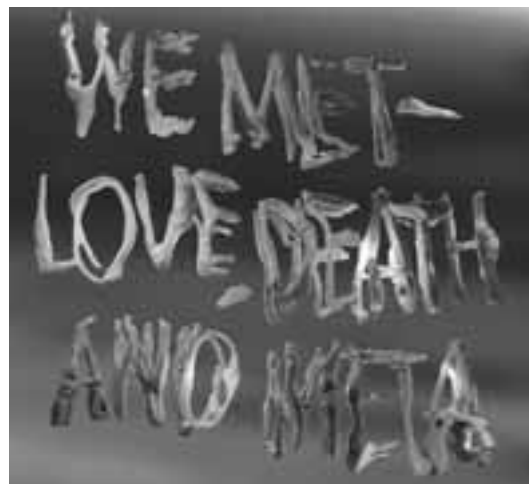
Στο Κυπριακό Μουσείο, στην Αίθουσα Περιοδικών Εκδόσεων...