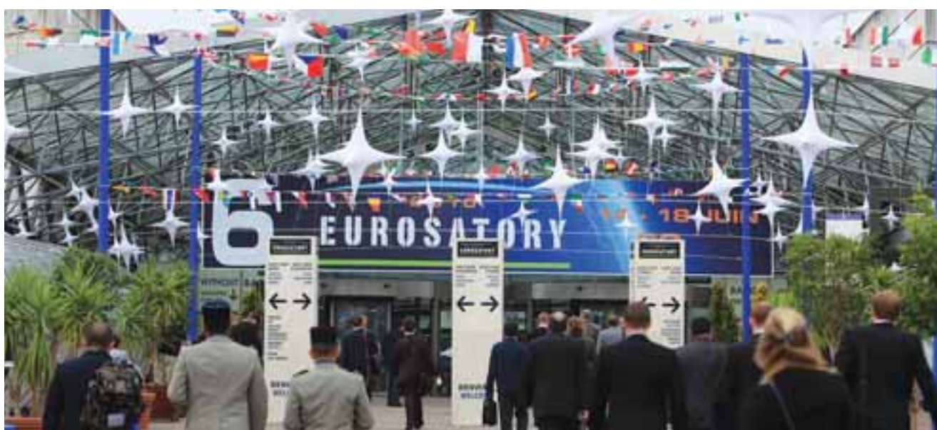
Η έκθεση συγκεντρώνει πάνω από 60.000 επισκέπτες και 250 επίσημες αντιπροσωπείες από 96 κράτη από τον χώρο της άμυνας της ασφάλειας και των εξοπλιστικών τεχνολογιών εταιρειών αμυντικής βιομηχανίας.

τομείς έρευνας, ανάπτυξης και καινοτομίας με προϊόντα που έχουν επιτυχή παρουσία και εφαρμογή στους τομείς της άμυνας και της ασφάλειας. Φέτος, συγκεκριμένα, στη Eurosatory εκθέτουν