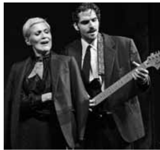
Το Θέατρο «ΔΙΟΝΥΣΟΣ» σε συνεργασία με το GRIS Festival...