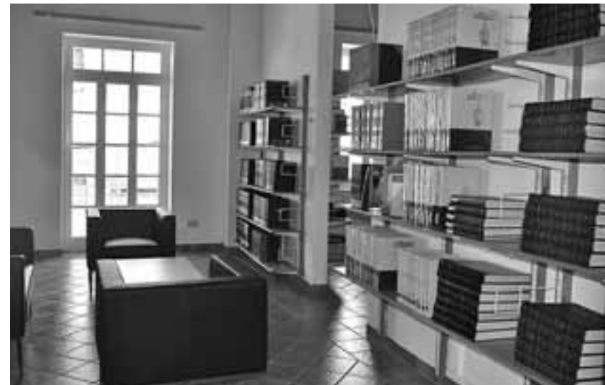
Οι χώροι της Αχιλλείου Δημοτικής Βιβλιοθήκης έχουν ανακαινιστεί πλήρως...