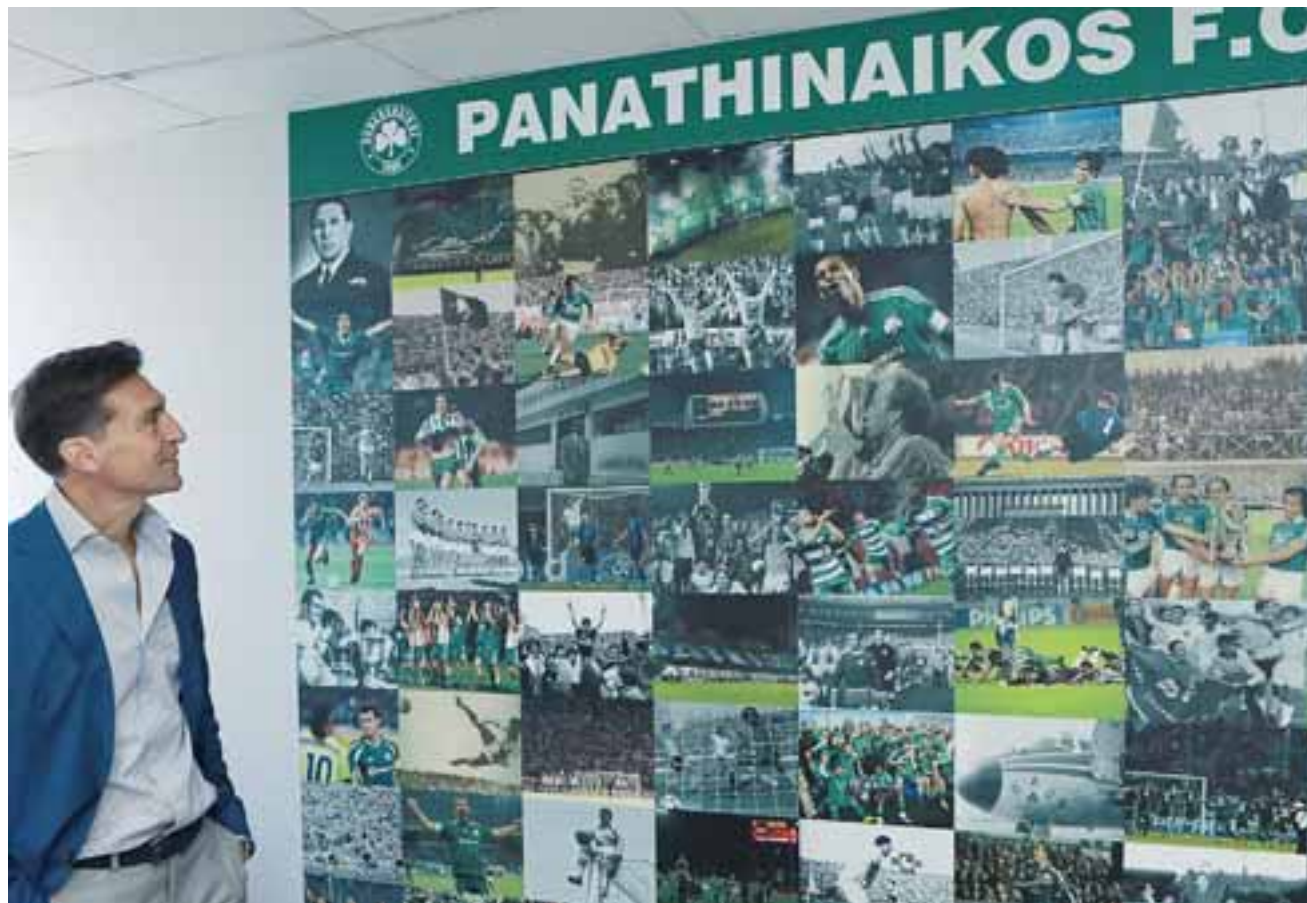
Ο Ντιέγκο Αλόνσο κοιτάζει ένα κολάζ με τις μεγάλες στιγμές του Παναθηναϊκού. Ο Ουρουγουανός τεχνικός θεωρεί ότι ο Παναθηναϊκός έχει δουλέψει καλά τα τελευταία τρία χρόνια και ότι μπορεί να επιστρέψει ξανά στις επιτυχίες.

Τι είδους ποδόσφαιρο θέλει να φέρει ο Αλόνσο στον Παναθηναϊκό; Το είπε ο ίδιος κατά την παρουσίασή του με έναν πολύ ξεκάθαρο τρόπο: «Είδα όλα τα παιχνίδια του Παναθηναϊκού και υπήρχαν πολλά πράγματα που μου άρεσαν. Γι' αυτό είμαι εδώ, αισθάνομαι πως η ομάδα είναι καλή. Όμως θέλω να κάνω και κάποια πράγματα όπως αρέσουν σε μένα. Μου αρέσουν οι επιθετικές ομάδες, αυτές που πιέζουν ψηλά και θεωρώ πως μπορούμε να καταφέρουμε να γίνουμε μια ομάδα που ανακτά γρήγορα την κατοχή, όντας πολύ πεστική στην επίθεσή της. Σας μιλώ περισσότερο για το μέλλον παρά για το παρελθόν. Πίσει ψηλά, ένταση και κάθετο ποδόσφαιρο, αυτό είναι το στυλ που θέλω να παίξει η ομάδα μου. Οποιο σύστημα κι αν επιλέξουμε από παιχνίδια σε παιχνίδια, αυτά τα χαρακτηριστικά δεν θα τα χάσουμε, θα