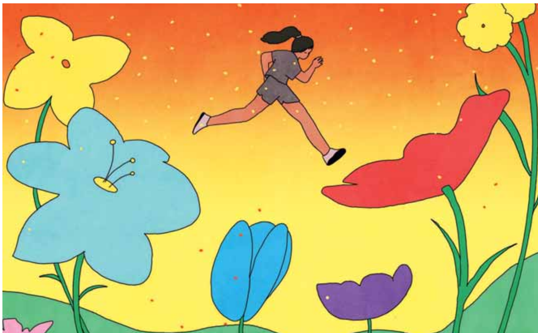
Το «κλειδί» στην αντιμετώπιση των αλλεργιών είναι το να αποτραπεί εξαρχής η εκδήλωση των αντιδράσεων, καθώς όταν δημιουργηθεί η φλεγμονή μπορεί να είναι δύσκολο να ελεγχθεί.

Οι ειδικοί συνιστούν να χρησιμοποιείτε τακτικά μη συνταγογραφούμενα κορτιζονούχα σπρέι, ξεκινώντας έως και δύο εβδομάδες πριν από την εποχή της γύρης. Μπορείτε επίσης να πάρετε αντιισταμινικά από το στόμα, τουλάχιστον μία ώρα πριν από την άσκηση,