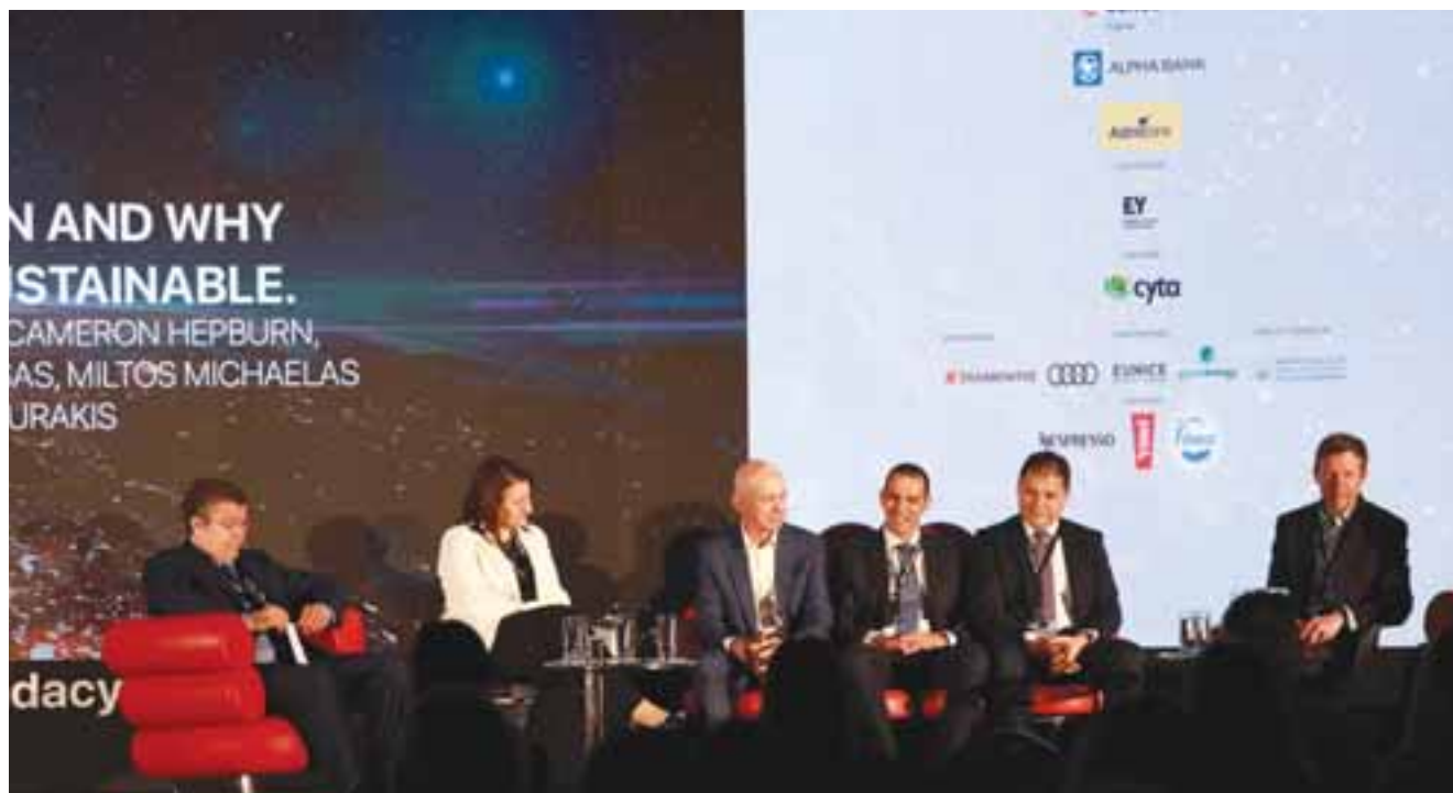
Στο πρότζεκτ της πράσινης μετάβασης οι κυβερνήσεις θα πρέπει να έχουν κύριο λόγο στο «μείγμα της επιτυχίας», με ειδικά προγράμματα υποστήριξης.

Στο περιθώριο του συνεδρίου «Green Agenda Cyprus Summit 2024» που αφιερώθηκε εξ ολοκλήρου στο «χοι κέικ» της σημερινής εποχής, δηλαδή της πράσινης μετάβασης (ESG), οι τραπεζιτές εξέφρασαν την άποψη στην «Κ» πως, οι επόπτες θα πρέπει να κάνουν ουσιαστικές κινήσεις προς την μετάβαση αυτή. Περιέγραψαν μια κατάσταση κατά την οποία ναι μεν η ΕΚΤ θέλει οι τράπεζες να διαδραματίζουν κομβικό ρόλο στην πράσινη μετάβαση με χρηματοδοτήσεις, όμως αυτές υπάγονται στο «απλό» πλαίσιο του «αυστηρού» εξυπηρετούμενου και μη εξυπηρετούμενου δανεισμού. Όπως εξήγησαν στην «Κ» στο περιθώριο του συνεδρίου ανώτατα και ανώτερα τραπεζικά στελέχη από τις κυπριακές