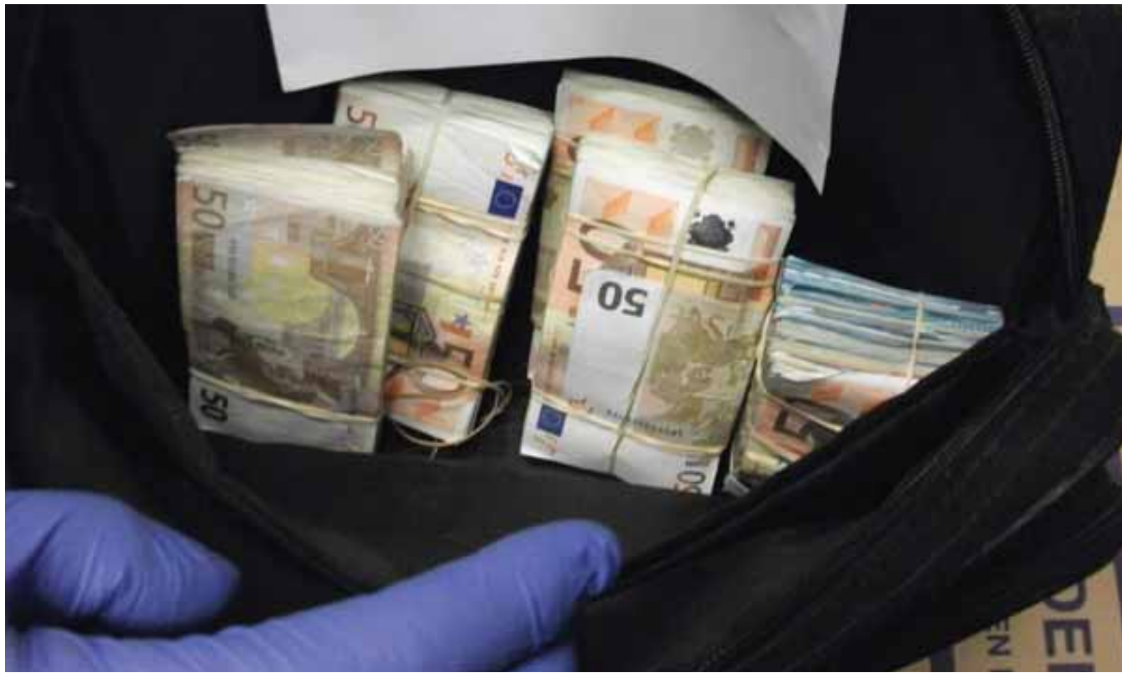
Την ύπαρξη κυκλώματος μεταφοράς μεγάλων ποσών στην Κύπρο διερευνούν οι Αρχές της Δημοκρατίας με αφορμή το περιστατικό ληστείας στη Λεμεσό.

Εάν ευσταθούν τα πρώτα στοιχεία που έχουν εντοπιστεί, η 31χρονη Ουκρανή ενδεχομένως να ήταν ο «ταχυδρόμος» που μετέφερε τις €420 χιλιάδες για λογαριασμό τρίτων. Τα στοιχεία