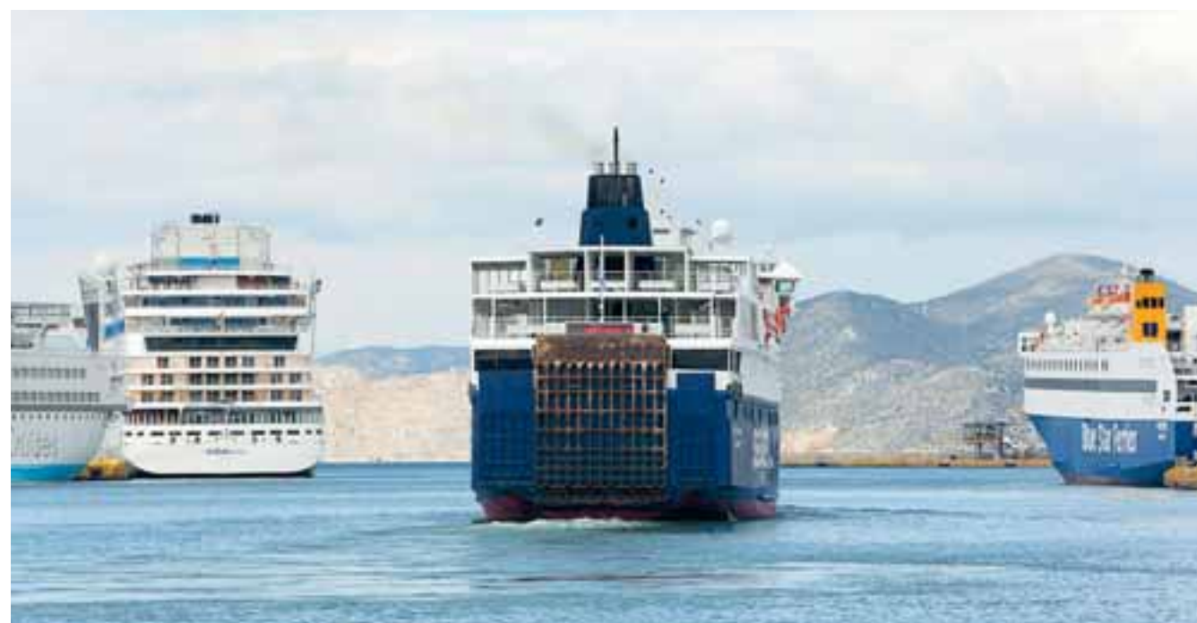
Από το 2029 και μετά το σύνολο της ελληνικής ακτοπλοΐας εντάσσεται στο ευρωπαϊκό σύστημα εμπορίας ρύπων (ETS), που σημαίνει ότι οι εταιρείες θα πρέπει να αγοράζουν δικαιώματα προκειμένου να συνεχίσουν να χρησιμοποιούν ναυτιλιακό πετρέλαιο.

Επιλέξιμες θα είναι εκείνες οι επιχειρήσεις που θα συμμετάσχουν και θα κερδίσουν μια σειρά διαγωνισμών για την εκτέλεση δημοσίων συμβάσεων που