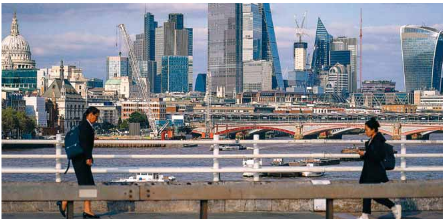
Το London Councils, το οποίο εκπροσωπεί τους 32 δήμους και το City of London Corporation, προβλέπει μείωση 7,6% στον αριθμό των μαθητών σε όλη την πόλη μεταξύ 2022-23 και 2026-27, που ισοδυναμεί με περίπου 243 τάξεις.

Ενα μέλλον με λιγότερα παιδιά ωστόσο αντιμετωπίζουν πολλές πόλεις στον κόσμο, όπως το Σαν Φρανσίσκο, το Σιάτλ και η Ουάσιγκτον. Στο Χονγκ Κονγκ, για κάθε ενήλικο άνω των 65 ετών «αντιστοιχούν» 0,7 παιδιά, ενώ στο Τόκιο η αντιστοιχία είναι ακόμη μικρότερη (0,5). Για την προοπτική μιας άτεκνης πόλης έγραφε πριν από μια δεκαετία ο Τζόελ Κότκιν, συγγραφέας του «The Human City», λέγοντας ότι οι πόλεις των ΗΠΑ «ξεκίνησαν ένα πείραμα