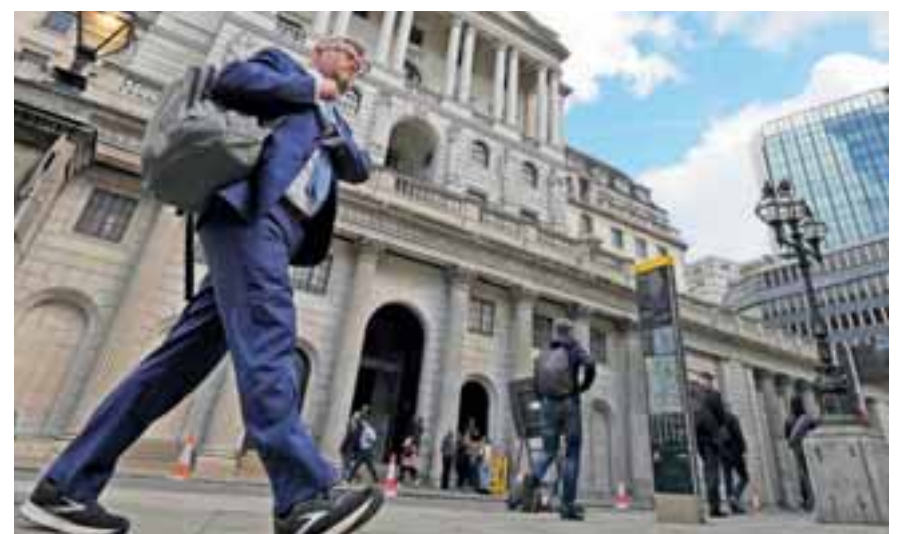
Το Ηνωμένο Βασίλειο έχει τη μεγαλύτερη αγορά συντάξεων στην Ευρώπη, αξίας άνω των 3,2 τρις. δολαρίων.

Η απόφαση τον Μάρτιο από την κατασκευαστή μικροσιπ (ημιαγωγό) ARM, το «στολίδι» του βρετανικού τεχνολογικού τομέα, να εισέλθει στο Χρηματιστήριο της Νέας Υόρκης, αποτέλεσε οδυνηρό πλήγμα για τη βρετανική οικονομία.