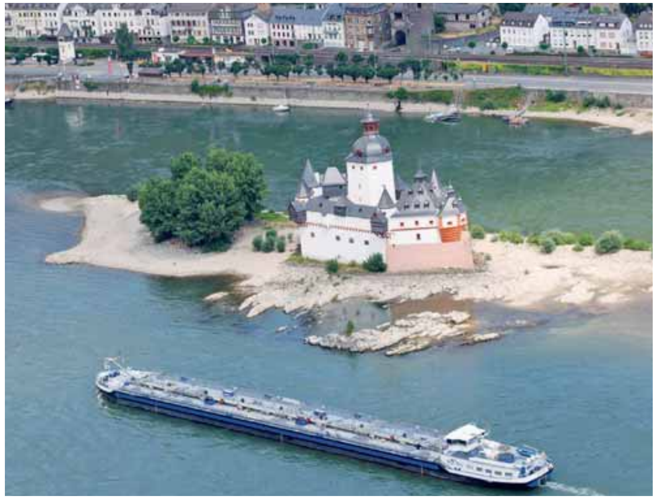
Η υποχώρηση των υδάτων στον Ρήνο έχει αυξήσει το κόστος μεταφοράς του ντιζελ από το κέντρο εμπορίας πετρελαίου του Ρότερνταμ.

Η Maxar Technologies αναμένει ότι το κύμα καύσωνα της Γερμανίας θα υ-