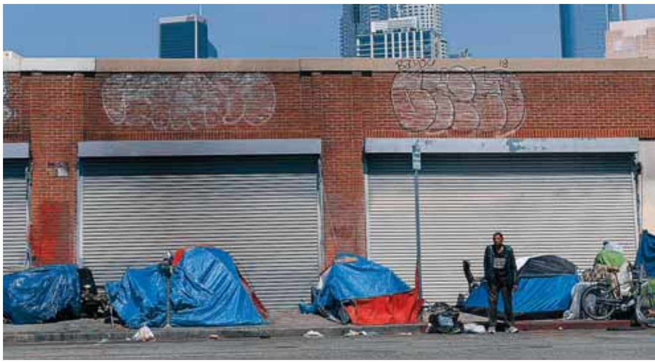
Το αμερικανικό υπουργείο Παιδείας υπολογίζει ότι περίπου 1,1 εκατ. παιδιά ήταν άστεγα κατά τη διάρκεια της πανδημίας.

σε στοιχεία που συλλέχθηκαν από πόλεις όπου πραγματοποιήθηκε καταμέτρηση των ανθρώπων που διαμένουν σε καταφύγια ή στους δρόμους και δείχνουν μια επιδεινούμενη κατάσταση ενόψει της κυβερνητικής έκθεσης που αναμένεται στο τέλος του έτους. Το υπουργείο Στέγασης και Αστικής Ανάπτυξης (HUD) δημοσιεύει συνήθως τον Δεκέμβριο μια ολοκληρωμένη καταμέτρηση. Γενικός είναι ότι οι εκτιμήσεις αυτές καταδεικνύουν την ανησυχητική κατεύθυνση προς την οποία οδηγεί η έλλειψη στέγης στις οικογένειες. Οι λόγοι είναι πολλοί, όπως ο τερματισμός των απαγορεύσεων στις εξώσεις, ο περιορισμός των μέτρων για την τόνωση της οικονομίας και των