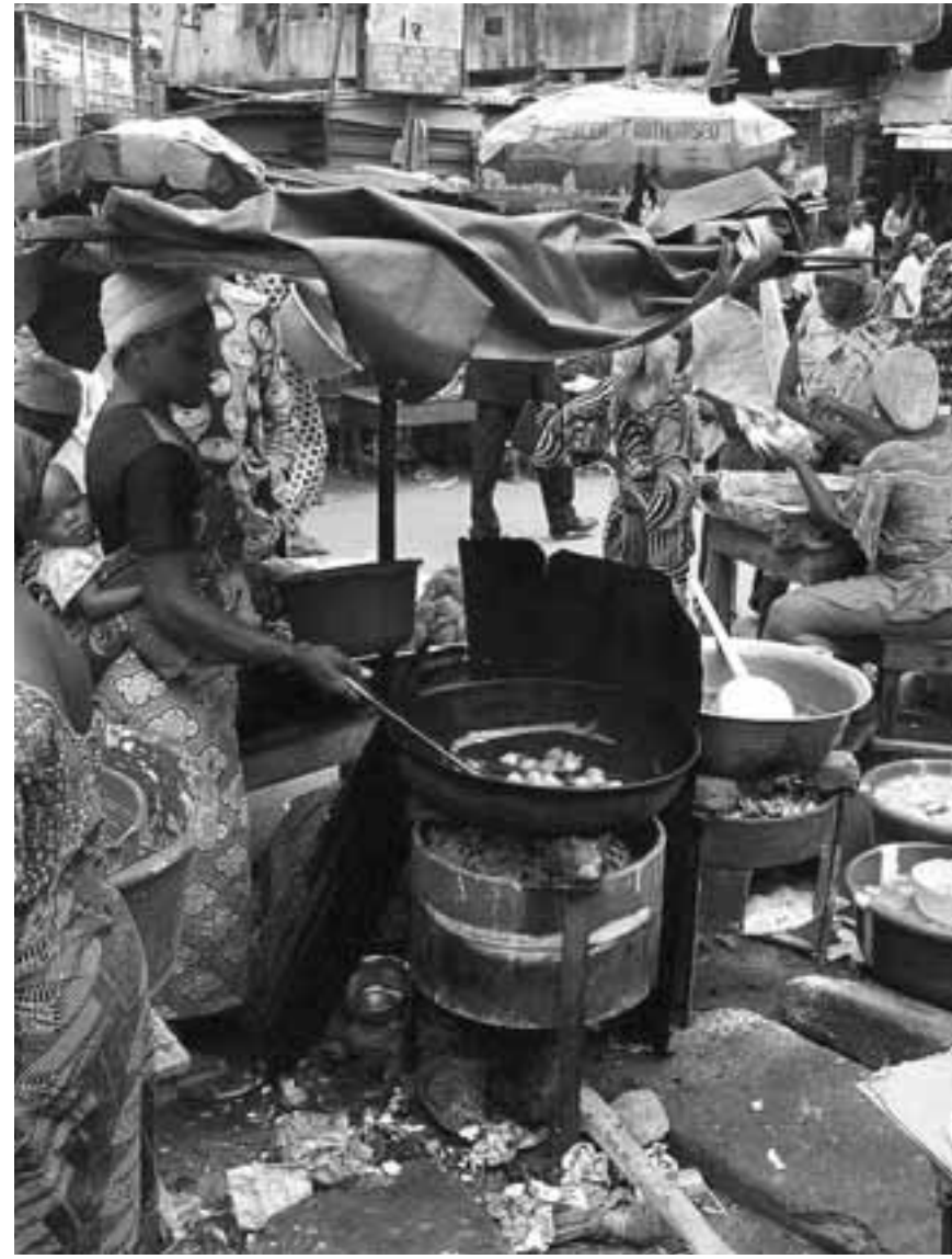
Δεκάδες κυβερνήσεις –οι περισσότερες στην Αφρική και στη Μέση Ανατολή– ξοδεύουν περισσότερο από το διπλάσιο των εσόδων τους για την αποπληρωμή του χρέους απ' ό,τι σε κοινωνικά προγράμματα. Εκτιμάται ότι 3,3 δισ. άνθρωποι ζουν σε χώρες που ξοδεύουν περισσότερο για πληρωμές τόκων σε τράπεζες ή επίσημους δανειστές από όσα αφιερώνουν στην εκπαίδευση ή στη φροντίδα των πολιτών τους.

«Οι φτωχότεροι υποφέρουν περισσότερο και τα εισοδήματά τους το 2023 προβλέπεται να παραμείνουν κάτω από τα προ πανδημίας επίπεδα», αναφέρει η έκθεση από το UNDP, με τίτλο «Το ανθρώπινο κόστος της αδράνειας: Φτώχεια, κοινωνική προστασία και εξυπηρέτηση του χρέους, 2020-2023». «Οι χώρες που θα μπορούσαν να επενδύσουν σε δίκτυα ασφαλείας τα τελευταία τρία χρόνια εμπόδιαν σημαντικό αριθμό ανθρώπων να διολίσθησει στη φτώχεια», δήλωσε ο επικεφαλής του UNDP, Αχίμ Στάινερ. «Στις υπερκρεωμένες χώρες υπάρχει συσχέτιση μεταξύ υψηλών επιπέδων χρέους, ανεπαρκών κοινωνικών δαπανών και ανισοκυπητικής αύξησης των ποσοστών κρατικών χρεών στις χώρες που είναι υποχρεωμένες να επιλέξουν μεταξύ του να εξυπηρετούν τα χρέη τους ή να βοηθήσουν τους πληθυσμούς τους. Κατά τους υπολογισμούς της έκθεσης, για να βγουν αυτοί οι 165 εκατ.