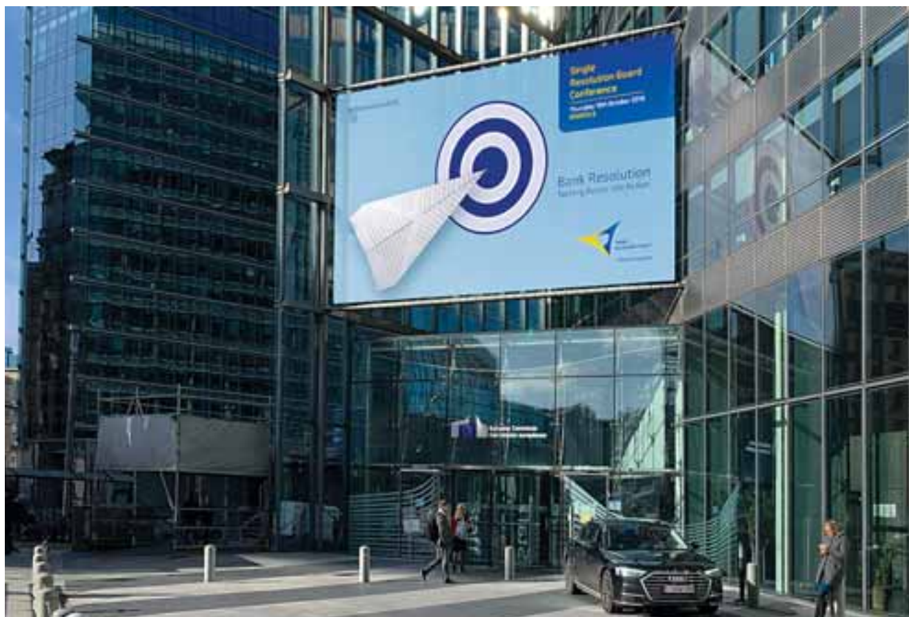
Από τον Ιανουάριο 2016, τα κράτη-μέλη της Ε.Ε. έχουν την υποχρέωση να εφαρμόζουν τις διατάξεις της Οδηγίας για Ανάκαμψη και Εξυγίανση Πιστωτικών Ιδρυμάτων και Επιχειρήσεων Επενδύσεων (BRRD).

Βάσει των αποτελεσμάτων, η έκδοση είχε σημαντική ζήτηση, προσελκύοντας το ενδιαφέρον από περισσότερους από 90 θεσμικούς επενδυτές, με το βιβλίο προσφορών να ανέρχεται μέχρι 950 εκατ. ευρώ και με την τελική τιμολόγηση