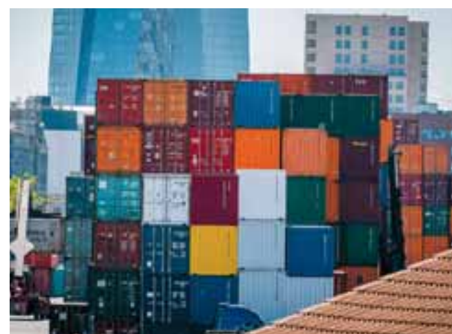
Οι εξαγωγές της Ε.Ε. και οι εισαγωγές από τη Ρωσία έχουν μειωθεί περισσότερο από 50% σε σύγκριση με το 2021, με αποτέλεσμα «μία άνευ προηγουμένου αποσύνδεση» των δύο οικονομιών, αναφέρει έκθεση της Κομισιόν.

«Πολύ πέρα από τον άμεσο αντίκτυπο τους, οι περιορισμοί των εισαγωγών της Ε.Ε. διεισδύουν βαθιά στον ιστό της ρωσικής οικονομίας», αναφέρεται στο έγγραφο.