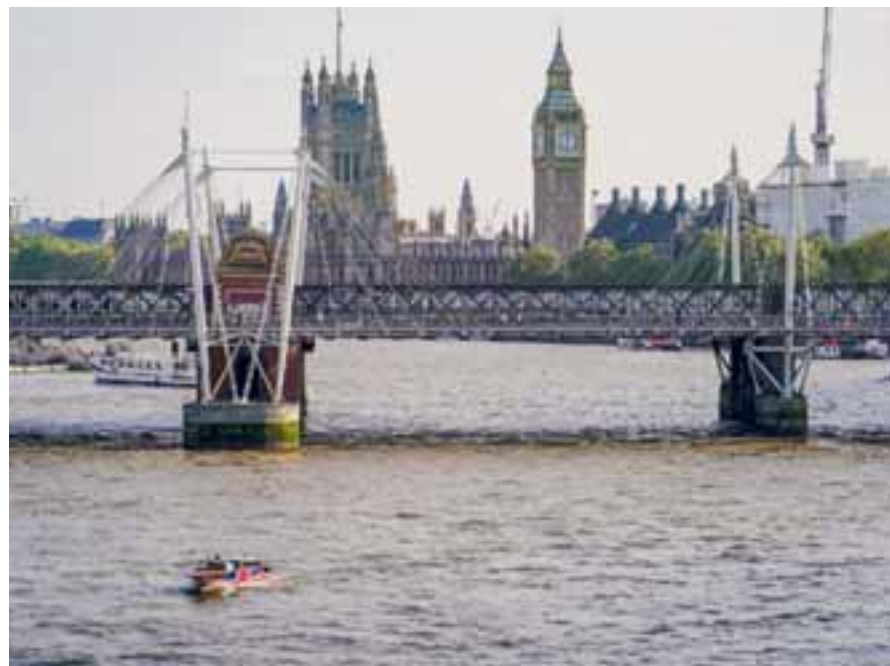
Πριν από δύο εβδομάδες ήρθε στην επιφάνεια η κρίση της μεγαλύτερης, βρετανικής εταιρείας ύδρευσης, της Thames Water, που εξυπηρετεί 15 εκατ. άτομα στο Λονδίνο και την περιφέρειά του και έχει χρέη ύψους περίπου 14 δισ. στερλινών.

Για να το επιτύχει πρέπει να πείσει τις επιχειρήσεις να βελτιώσουν τη φερεγγυότητά τους, ώστε να πείσουν τους μετόχους να τους διαθέσουν κεφάλαια με προσिता επιτόκια. Θα πρέπει όμως και να αυξηθούν οι λογαριασμοί του νερού. Οι Βρετανοί πολιτικοί, όμως, δεν μπορούν να υπερασπισθούν την αύξηση των λο-