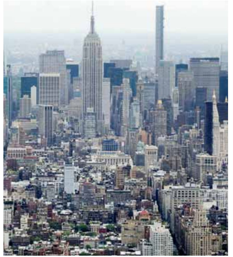
Στη Νέα Υόρκη, όπου το ποσοστό των κενών γραφείων ανέρχεται στο 15,5% του συνόλου, ο δήμαρχος Ερικ Ανταμς ανακοίνωσε τον Ιανουάριο σχέδιο για τη δημιουργία 500.000 νέων κατοικιών. Αντίστοιχα προγράμματα έχουν ανακοινώσει, μεταξύ άλλων, το Πίττσμπουργκ, η Βοστώνη και η Ουάσιγκτον.

Η δήμαρχος της Ουάσιγκτον, Μιούριελ Ελίζαμπεθ Μπάουζερ, έχει αναγάγει τις μετατροπές γραφείων σε ακρογωνιαίο λίθο του σχεδίου της για αναθέρμανση της ζωής και της οικονομικής δραστηριότητας στο κέντρο της πόλης. Το σχέδιό της που ανακοινώθηκε στις αρχές του έτους, έχει στόχο να προσελκύσει 15.000 νέους κατοίκους στο κέντρο της πόλης, όπου τώρα ζουν