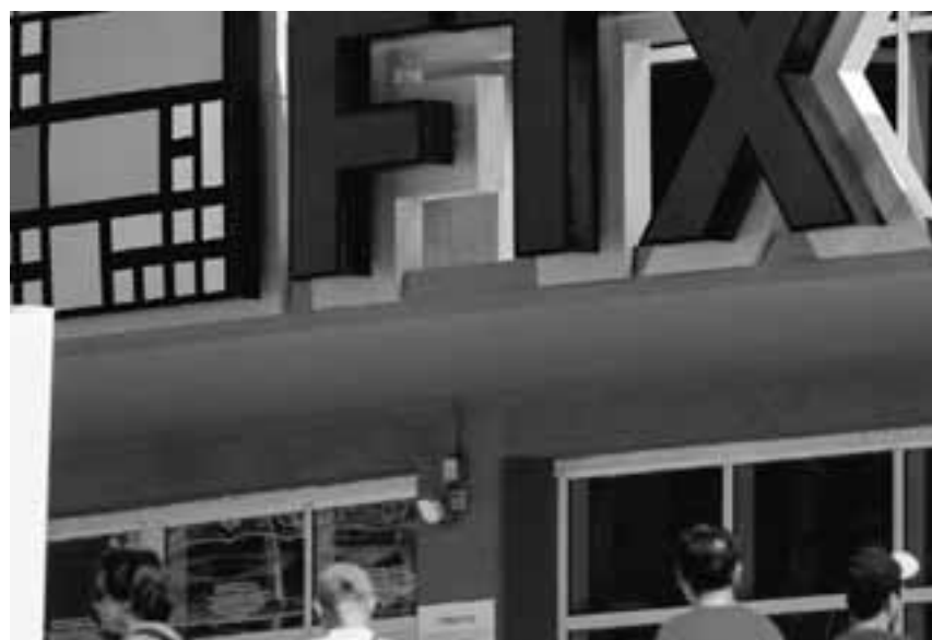
Τον περασμένο μήνα, ένα κύμα μαζικών αναλήψεων έφερε στο φως μια «τρύπα» 8 δισ. δολαρίων στα οικονομικά του FTX. Μέσα σε μία εβδομάδα η εταιρεία πτώχευσε και η αμερικανική Επιτροπή Κεφαλαιαγοράς από κοινού με το υπουργείο Δικαιοσύνης διεξήγαγε έρευνες και ανακρίσεις.

Τον περασμένο μήνα, όμως, οι κινήσεις μιας και μόνον εταιρείας κρυπτονομισμάτων, του FTX αξίας 32 δισ. δολαρίων, οδήγησαν όλον τον κλάδο σε μια κρίση ανάλογη εκείνης του 2008. Ενώ είχε θεωρηθεί ασφαλές για όσους ενδιαφέρονταν για συναλλαγές κρυπτονομισμάτων, το FTX πτώχευσε έπειτα από ένα κύμα μαζικών αναλήψεων και ανάγκασε επιχειρηματίες, επενδυτές και οπαδούς να προσπαθούν να καταλάβουν πως η τεχνολογία που σχεδιάστηκε για να διορθώσει τις ατέλειες του παραδοσιακού χρηματοπιστωτικού συστήματος κατέληξε να τις μιμείται. Στελέχη που μόλις πριν από ένα χρόνο κόμπαζαν για την αδιάκοπη ανάπτυξη του κλάδου, σήμερα προσπαθούν να πείσουν πως θα διδαχθούν από τα λάθη και θα επιστρέψουν στις αρχικές αξίες του. Το μεγαλύτερο στον κόσμο χρηματιστήριο κρυπτονομισμάτων, το Binance, ανακοίνωσε ότι θα δημοσιεύει εφεξής περισσότερες πληροφορίες για τα οικονομικά του και θα προσλάβει ανεξάρτητους λογιστές για να εξετάζουν τις ανακοινώσεις του. Και το Coinbase, το μεγαλύτερο του είδους στις ΗΠΑ, παραδέχθηκε πως είχε εμπλακεί σε ένα «αποκεντρωμένο σύστημα που δεν προϋπέθετε εμπιστοσύνη». Πολλοί από τους