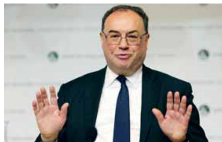
Ο διοικητής της Τράπεζας της Αγγλίας Αντριου Μπέλι τονισε πως οι επιχειρήσεις της Βρετανίας πρέπει να επιβάλουν «συγκράτηση» στις διαπραγματεύσεις για τις αμοιβές ώστε να βοηθήσουν να ανακοπεί ο πληθωρισμός, που βρίσκεται στα υψηλά 30 ετών.

για να ανακόψει τον πληθωρισμό, που αναμένεται να εκτοξευθεί τον Απρίλιο στο 7,25%. Ζητούμενο είναι να τον επαναφέρει σταδιακά στον στόχο του 2%. Τα σχόλια του διοικητή της Τράπεζας της Αγγλίας υποδηλώνουν, πάντως, παράλληλα πως οι εργαζόμενοι πρέπει να επιδείξουν προνοητικότητα. Προκάλεσαν, όμως, αντιδράσεις καθώς το τελευταίο ετήσιο πακέτο των αποδοχών του κ. Μπέλι έφτασε στο ποσό των 575.000 στερλινών, που αντιστοιχεί σε 777.115 δολάρια, δηλαδή 18 φορές ένας μέσος μισθός στη Βρετανία για εργαζόμενο πληρους απασχόλησης.