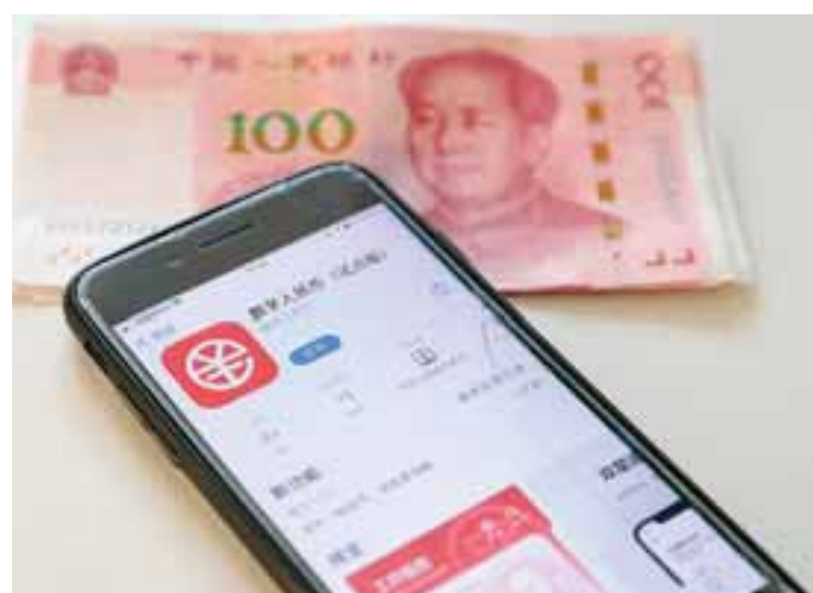
Το ψηφιακό γουάν θα μπορούσε να ενισχύσει περαιτέρω τον έλεγχο της κυβέρνησης επί του χρηματοοικονομικού συστήματος της χώρας.

Bloomberg, Wall Street Journal, BusinessInsider, Fortune