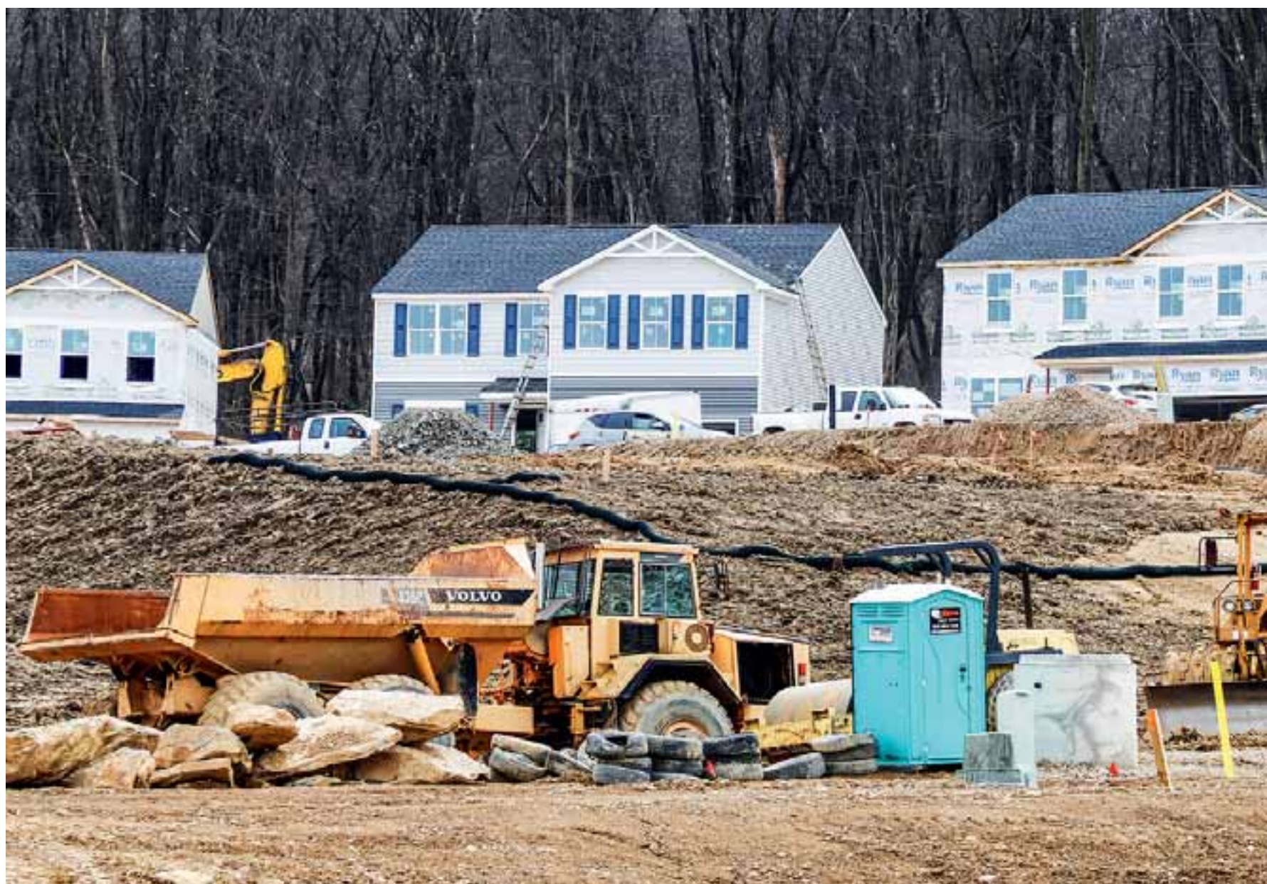
Στα τέλη του 2021 υπήρχε έλλειψη περίπου 411.000 κατοικιών μόνο για την κυρίως εισοδηματική κατηγορία Αμερικανών που ορίζονται ως μεσαία τάξη, δηλαδή για νοικοκυριά με ετήσιο εισόδημα από 75.000 έως 100.000 δολάρια. Η κατάσταση επιδεινώνεται διαρκώς, καθώς οι εργολάβοι δεν βρίσκουν βασικές πρώτες ύλες για την ανέγερση κατοικιών, όπως ο χάλυβας. Το αποτέλεσμα είναι να καθυστερεί η κατασκευή 5,24 εκατ. κατοικιών.

Ρεπορτάζ της ιστοσελίδας BusinessInsider επικαλείται στοιχεία της βάσης δεδομένων Redfin, σύμφωνα με τα οποία τον Ιανουάριο η μέση τιμή κατοικίας στις ΗΠΑ έφτασε τις 365.000 δολάρια καταγράφοντας ιστορικό υψηλό ρεκόρ. Σημειώτεον ότι μόλις τον Ιανουάριο του 2019, προτού εισβάλει η πανδημία στις δυτικές οικονομίες, η μέση τιμή μιας κατοικίας στις ΗΠΑ δεν υπερέβαινε τις 285.000 δολάρια. Στις αρχές Ιανουαρίου, 41% των κατοικιών πουλήθηκαν σε τιμές υψηλότερες από την αρχική τιμή που ζήτησαν οι πωλητές, ενώ πολλά σπτικά παραμένουν υποψήφια για πώληση μόλις για μία εβδομάδα, αφού η ζήτηση υπερβαίνει κατά πολύ την προσφορά. Η ανεπάρκεια κατοικιών εξωθεί τους επιδόρους αγοραστές σε εσπευσμένες επιλογές και στη σχετική έρευνα του BusinessInsider, το 82% των εργαζομένων αγοραστών κατοικιών δήλωσε πως έχει μετανιώσει εν μέρει για την επιλογή του και συνήθως αυτό αφορά