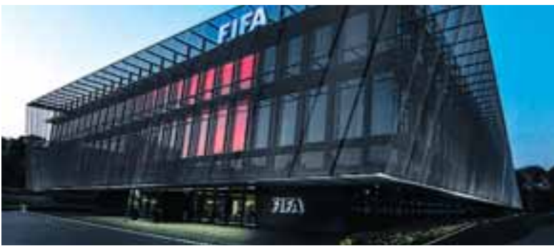
Κλιμάκιο της FIFA αναμένεται στην Αθήνα για συζητήσεις με κυβερνητικά στελέχη, αλλά και με την ΕΠΟ.