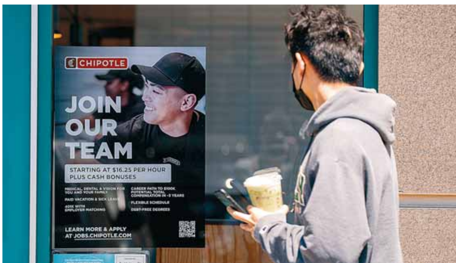
Για την επιτυχία, παρά τις κρίσεις, των Αμερικανών ηλικίας σήμερα μεταξύ 28 και 43 ετών ευθύνεται εν μέρει η ισχυρή αγορά εργασίας στις ΗΠΑ, όπως διαμορφώθηκε μετά την πανδημία.

Βέβαια, είναι αναμενόμενο η γενιά που μπαίνει στα πιο παραγωγικά χρόνια της να δει άλμα στον πλούτο της. Ωστόσο, η γενιά αυτή επιβαρύνθηκε με δυσανάλογα υψηλά φοιτη-