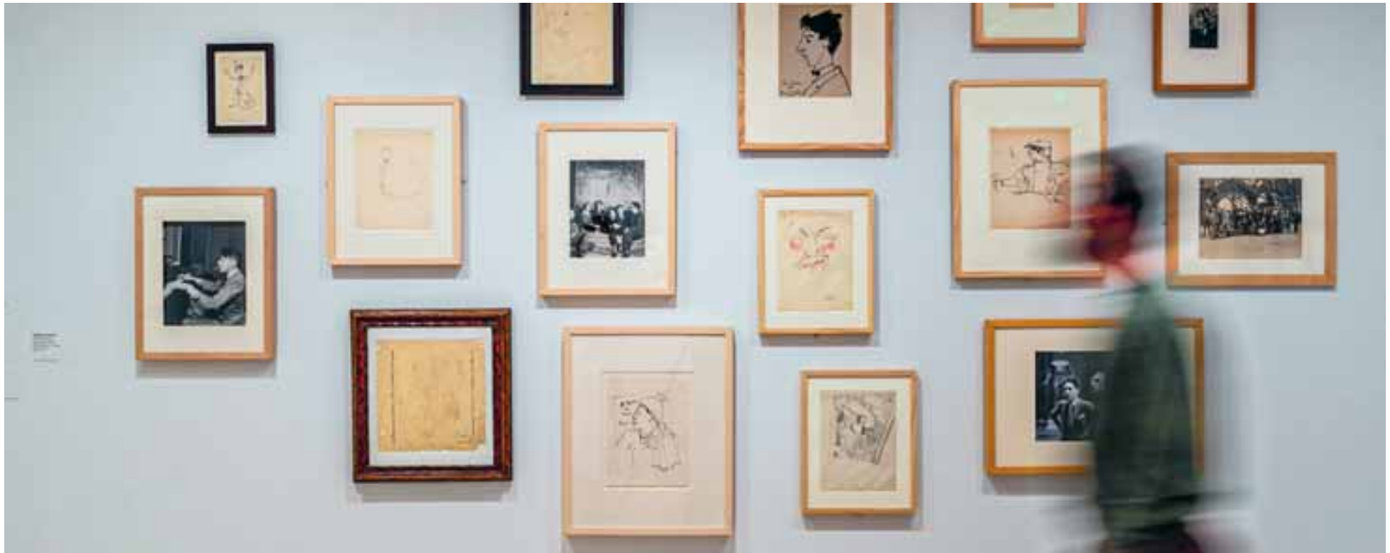
Η έκθεση «Ζαν Κοκτώ: Η εκδίκηση του ταχυδακτυλουργού» εγκαινιάστηκε στο επίσημο άνοιγμα της 60ής Μπιενάλε Βενετίας. Πρόκειται για τη μεγαλύτερη αναδρομική έκθεση που διοργανώθηκε ποτέ στην Ιταλία, αφιερωμένη στο τρομερό παιδί της γαλλικής σκηνής του 20ού αιώνα και διερευνά τα κύρια θέματα του έργου του, όπως Ορφείας και ποίηση, έρωτας, κλασικισμός στην τέχνη, κινηματογράφος.