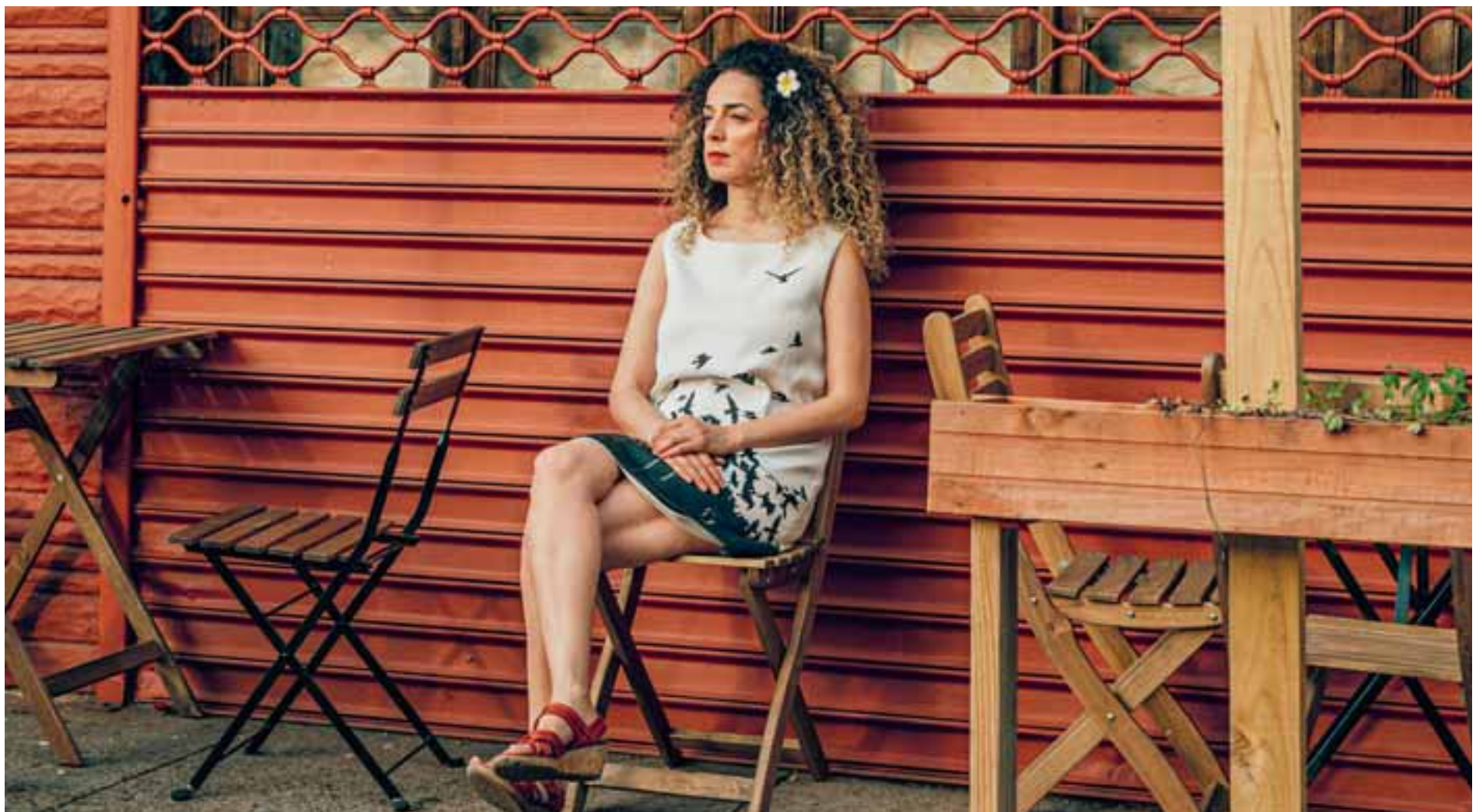
Η Μασίχ Αλινετζάντ απολαμβάνει μία από τις πιο απλές μορφές ελευθερίας, τη δυνατότητα να είναι ντυμένη όπως επιθυμεί, κοντά στο σπίτι της στη Νέα Υόρκη, το 2018. Σήμερα, η Ιρανή ακτιβίστρια βρίσκεται υπό την προστασία του FBI, αφού έχει γίνει στόχος δολοφονικών επιθέσεων, ενώ ακόμη δέχεται χιλιάδες απειλητικά μηνύματα.