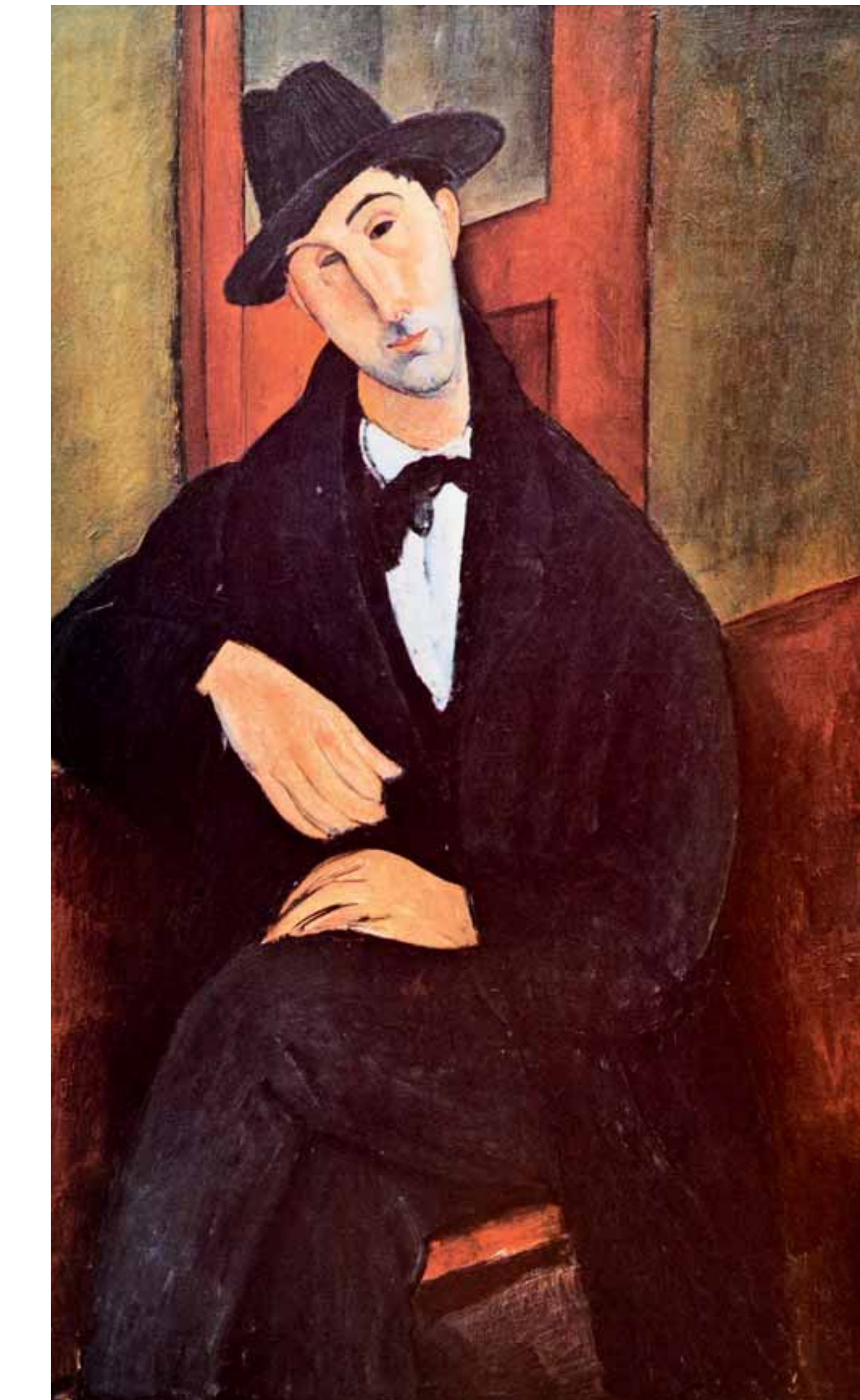
Το πορτρέτο του συνθέτη Μάριου Βάρβογλη, το τελευταίο έργο του Αμεντέο Μοντιλιάνι. Ο Ιταλοεβραίος ζωγράφος με το θεαλλώδες ταμπεραμέντο γνώρισε και συγχρωτίστηκε με αρκετούς Έλληνες, όχι μόνο στο Παρίσι αλλά και στη γενέτειρά του, Λιβόρνο, με την ανθηρή ελληνορθόδοξη κοινότητα των εμπόρων του 19ου αιώνα.

Όσο για τον αστυνομικό, τον επιφορτισμένο να περιφρουρεί