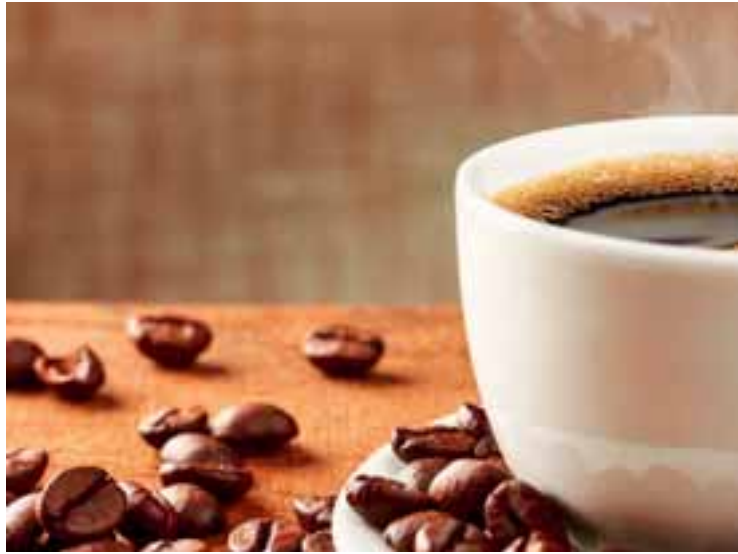
Ανατιμήσεις ακόμη και 20% στον καφέ αναμένονται μετά το Πάσχα εξαιτίας της ξηρασίας που πλήττει το Βιετνάμ, κύρια παραγωγό χώρα της ποικιλίας Ρομπούστα που εισάγεται σε μεγάλες ποσότητες στην Ελλάδα.

Ετσι, μπορεί να μη μας νοιάζει εάν μια πεταλούδα τίναξε τα φτερά της στον Αμαζόνιο, μας ενδιαφέρει, όμως, εάν θα είναι καλή παραγωγή καφέ στη Βραζιλία. Και μπορεί να μην έχει προκληθεί τυφώνας στην Κίνα, αλλά η παρατεταμένη ξηρασία στο Βιετνάμ -χώρα που στο μυαλό μας έχουμε συνδέσει όλοι με το ακριβώς αντίθετο- πλήττει την εκεί παραγωγή καφέ. Οι σοκολατοβιομηχανίες -και όχι μόνο- κοιτούν με τρόμο το ράλι τιμών του κακάο, η τιμή του οποίου έφτασε σε 12.261 δολάρια/τόνο στο Χρηματιστήριο Εμπορευμάτων της Νέας Υόρκης, τιμή που αποτελεί ρεκόρ όλων των εποχών, ενώ πριν από δύο χρόνια η χαμηλή παραγωγή σκληρού σιταριού στον Καναδά, λόγω των υψηλών