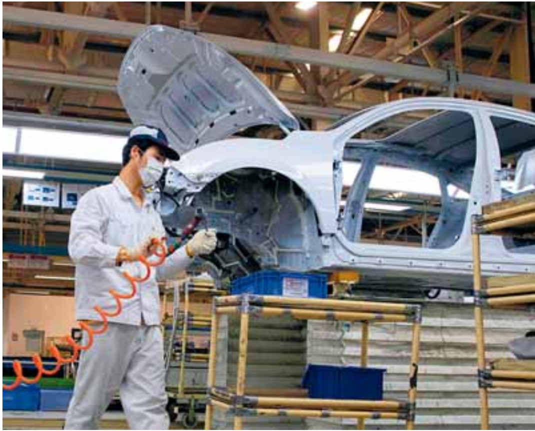
Το μερίδιο αγοράς των κινεζικών εμπορικών σημάτων αναμένεται να φθάσει φέτος στο 11% της ευρωπαϊκής αγοράς και στο 20% το 2027.

Το μοντέλο Seal U της BYD, για παράδειγμα, πωλείται 20.500 ευρώ στην Κίνα και 42.000 ευρώ στην Ε.Ε. Το εκτιμώμενο κέρδος είναι 1.300 και 14.300 ευρώ αντίστοιχα, δίνοντας ένα ισχυρό κίνητρο για εξαγωγές, επισημαίνει η Rhodium. Στις εν λόγω εισαγωγές στην Ε.Ε. ήδη επιβάλλεται δασμολόγιο 10%, όπερ ισοδυναμεί με σχεδόν 2.100 ευρώ ανά μονάδα. «Σύμφωνα με