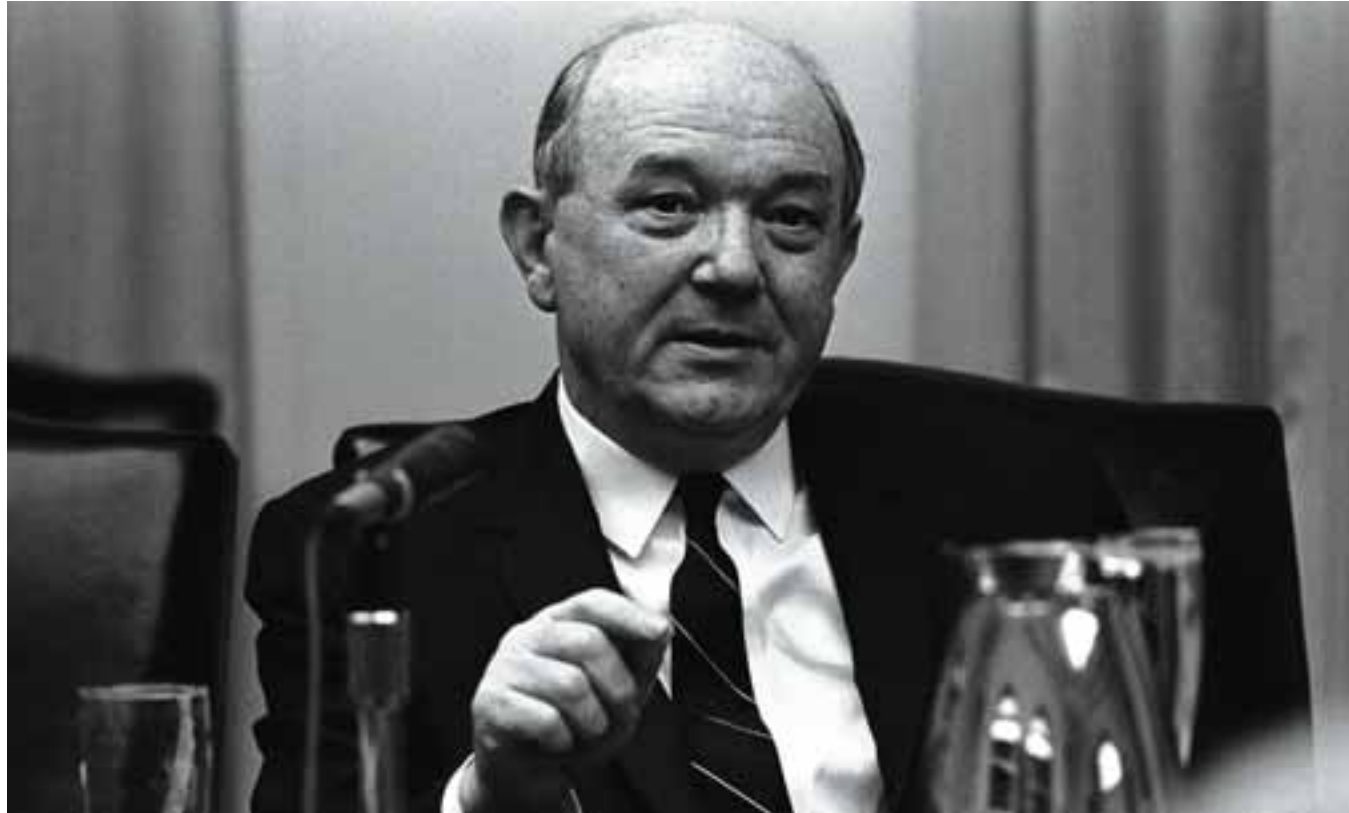
Τον Αύγουστο του 1964 σε τηλεγράφημά του προς αμερικανικές διπλωματικές αποστολές ο Αμερικανός υπουργός Εξωτερικών Ντιν Ρασκ εξέφραζε την έντονη δυσφορία του για την αποτυχία του σχεδίου Άτσεσον.

Μία εκρηκτική επιστολή για συνεργασία ελληνικών δυνάμεων και αμερικανικών μυστικών υπηρεσιών, σε ένα συνωμοτικό κίνημα