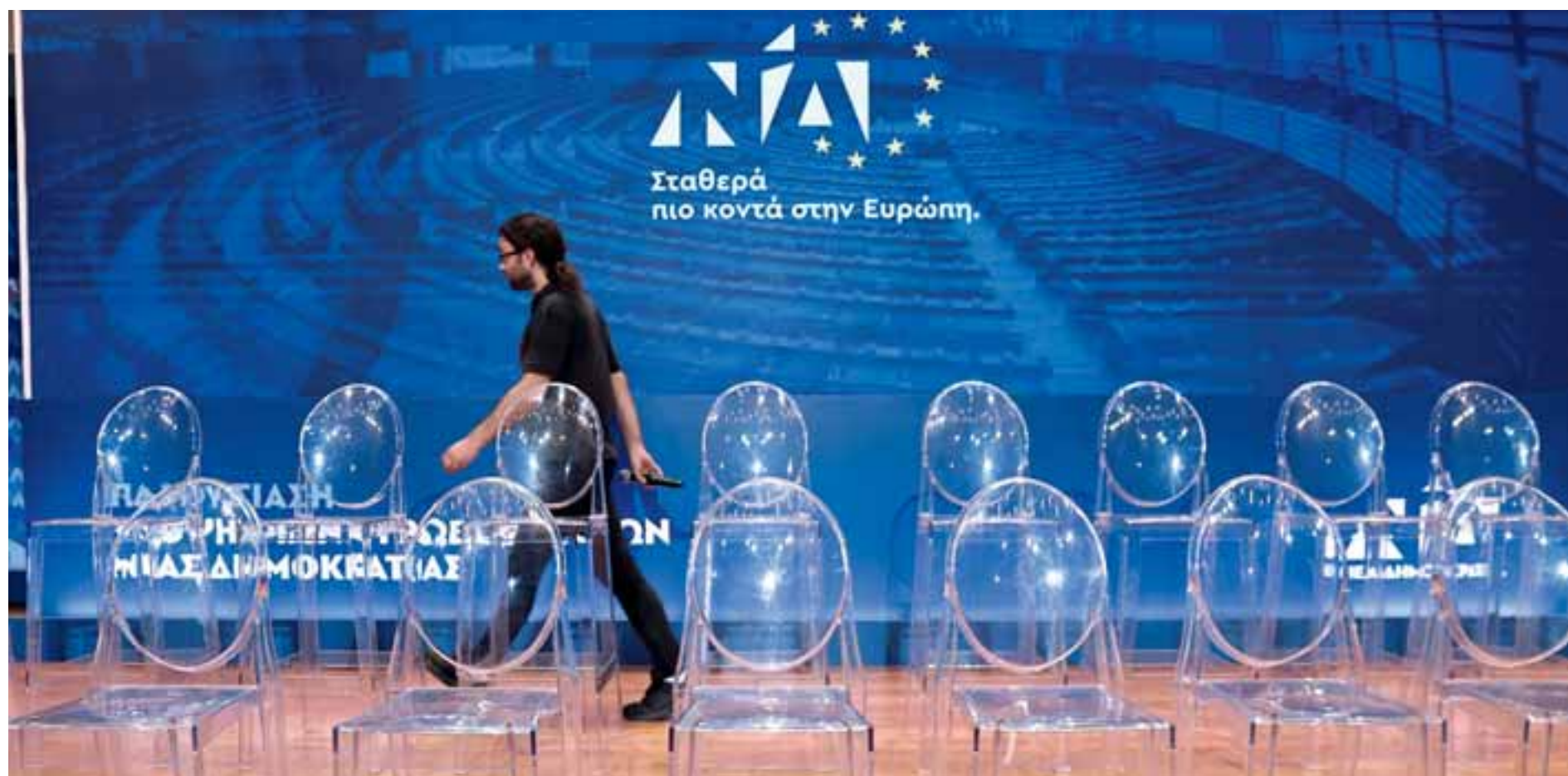
Η «καρέκλα» του υποψήφιου ευρωβουλευτή της Ν.Δ. έχει απαιτήσεις, ειδικά στην τελική ευθεία προς τις κάλπες, όπου δημόσιες εμφανίσεις, δηλώσεις και λάθη θα περνούν από το κόσκινο των αντιπάλων.

Πέραν όλων αυτών, η μάχη των εντυπώσεων θα κριθεί και από τη σαφήνεια των απαντήσεων και την καλή γνώση των ζητημάτων. Για να αποφευχθούν τυχόν αιφνιδιασμοί, με εντατικούς ρυθμούς εργάζεται η ομάδα τεκμηρίωσης, που είναι επιφορτισμένη με το καθήκον να ενημερώνει βουλευτές και στελέχη όχι μόνο για τα θέματα που αναδεικνύουν οι πολιτικοί αντίπαλοι, αλλά και για όσα επιπροσθέτως μπορούν να προβληθούν για την ενίσχυση του θετικού μηνύματος που θα επιδιωχθεί να εκπέμπεται σε κάθε ευκαιρία.