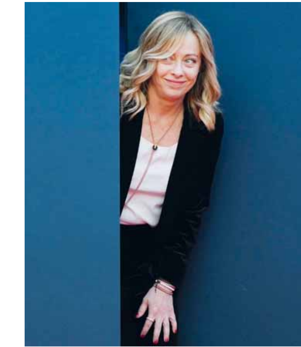
Η Τζόρτζια Μελόνη στο πολιτικό φρεστιάβλ Ατρείμ, που διοργάνωσε το κόμμα της FdI τον περασμένο Δεκέμβριο. Μολονότι η Ευρώπη υποδέχθηκε μουδιασμένη την εκλογή της το 2022, πλέον η πρωθυπουργός της Ιταλίας έχει κατακτήσει τον «τίτλο» της αξιόπιστης εταιρού, από τις Βρυξέλλες έως την Ουάσιγκτον.

Σίγουρα πέτυχε το δεύτερο, καθώς όχι μόνο δεν συγκρούστηκε με τους θεοσμίους, αλλά έπαιξε «σωστά όλα τα ευρωπαϊκά