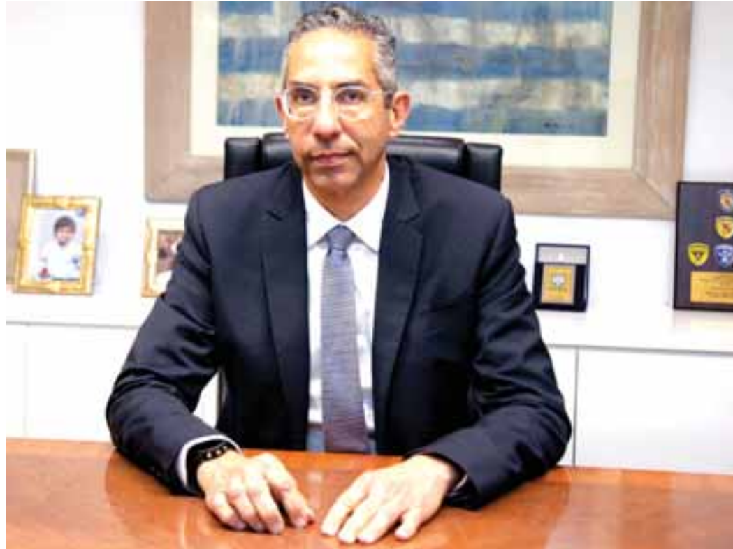
«Ο γενικός ελεγκτής και ο εκπρόσωπος Τύπου της Ελεγκτικής, χωρίς να έχουν αρμοδιότητα, αναλύουν την απόφαση της Αρχής [...], αφήνοντας σαφέστατες αιχμές ότι δεν αποκλείεται να υπάρχει κατάχρηση εξουσίας από εμένα».

Η μόνη διαθέσιμη επιλογή είναι να αξιολογηθεί από τους εκ του Συντάγματος καθ' ύλην αρμόδιους, ήτοι τα μέλη του Δικαστικού Συμβουλίου