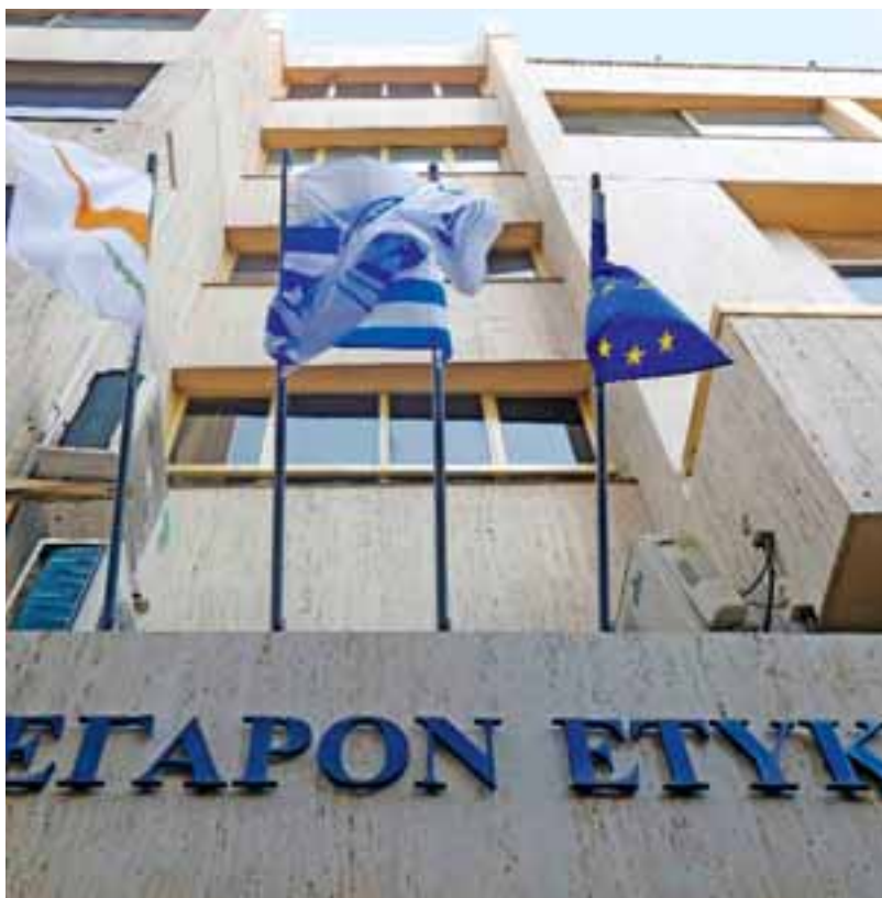
Από εδώ και πέρα ενδιαφέρον θα έχουν οι συζητήσεις μεταξύ Συνδέσμου Τραπεζών και της ETYK για τη σύμβαση 2023-2025.