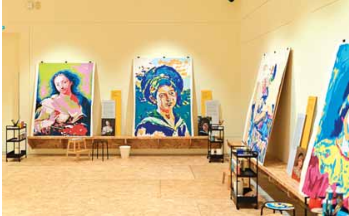
Ο στόχος της έκθεσης «1, 2, 3... Ζωγράφισε!», όπως μας εξηγείται από τη Λεβέντειο Πινακοθήκη, είναι να ξαναϊδωθούν οι τις Συλλογές της Πινακοθήκης με νέα μάτια, και για τους πιο τολμηρούς, να προβληματιστούν με ερωτήσεις, αναζητώντας την ουσία που εμπεριέχεται γενικά στην καλλιτεχνική δημιουργία.

μηνούς, να προβληματιστούν με ερωτήσεις, αναζητώντας την ουσία που εμπεριέχεται γενικά στην καλλιτεχνική δημιουργία. Η συμμετοχική αυτή έκθεση πραγματοποιείται στην παρακαταθήκη του μοντερνισμού που συνδέθηκε άρρηκτα με την αμφισβήτηση του ρόλου του καλλιτέχνη ως «δημιουργού». Μία ακόμη πολύ ενδιαφέρουσα πτυχή της έκθεσης και της φιλοσοφίας της εν γένει είναι ο πειραματισμός με τον μύθο της καλλιτεχνικής ιδιοφυΐας, της συνεργατικής κουλτούρας και της μηχανιστικής τέχνης που γέννη-