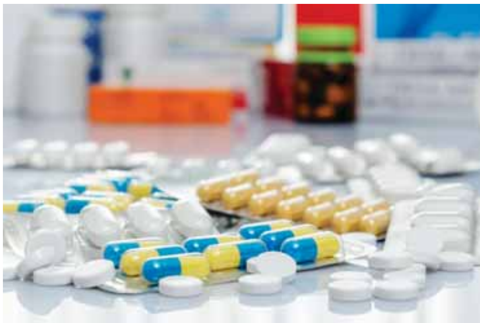
Η εστίαση στη φαρμακευτική βιομηχανία μπορεί να προσφέρει μακροπρόθεσμη οικονομική σταθερότητα και ανάπτυξη.

Η ελληνική κυβέρνηση με δημιουργική φαντασία και απλά εργαλεία, βολήθηκε στην ενίσχυση της εγχώριας βιομηχανίας και κατάφερε να προσελκύσει επενδύσεις εντυπωσιακού μεγέθους (εκατοντάδων εκατομμυρίων) ακόμα και από τους «γίγαντες» του τομέα. Οι επενδύσεις αυτές δεν αφορούν μόνο στην αύξηση της παραγωγικής δυνατότητας γενόσημων, αλλά και πρώτων υλών, προϊόντων βιοτεχνολογίας κ.ά. Παράλληλα, εν-