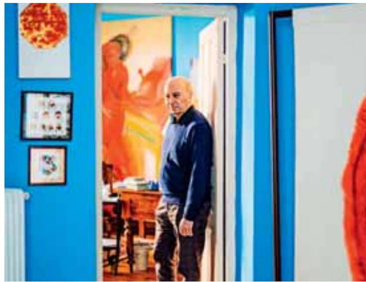
«Δούλεμα εξαντλητικά έτρεχα από παράσταση σε παράσταση με λιγη αδrenalίνη για καύσιμο», λέει ο Θεόδωρος Τερζόπουλος, ο οποίος θέλει να μείνει στη χώρα μας το επόμενο διάστημα και να το αφιερώσει στον εαυτό του.

Ωστόσο δηλώνει πως έχει μεγάλη πίστη στους νέους. «Η γενιά που γεννήθηκε μετά το 2000 είναι αλληλωτική, πολύ δυναμική, με νητική – αυτή θα φέρει την ανατροπή. Εμείς οι μεγάλοι δεν προετοιμάσαμε τίποτα για εκείνους, δεν εξασφαλίσαμε καμία δημιουργική θέση εργασίας, μόνο θέσεις σκλάβου. Αυτό θα πει μίσος, θα πει ότι δεν βλέπουμε με προοπτική, αδιαφορούμε για το μέλλον. Τους παραδίδουμε ένα κράτος βασισμένο στο ψεύδος, στην αισχροκέρδεια,