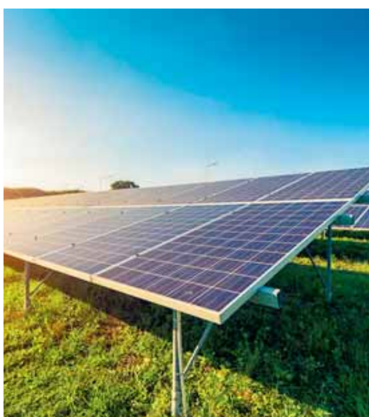
Η Κίνα προγραμματίζει επέκταση της βιομηχανίας φωτοβολταϊκών, αν και ήδη κατέχει το 80% της διεθνούς παραγωγής.

Αυτή τη στιγμή πάντως, η Κίνα προγραμματίζει επέκταση της βιομηχανίας, αν και ήδη κατέχει το 80% της διεθνούς παραγωγής.