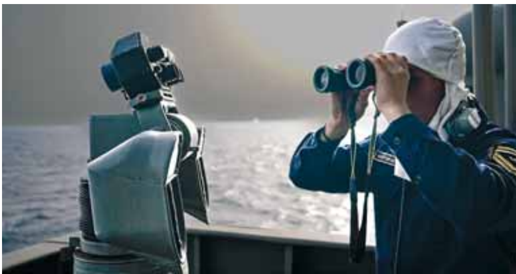
Στέλεχος του Πολεμικού Ναυτικού κατά τη διάρκεια της άσκησης «Αίλιψ 2024». Η τουρκική πλευρά διατυπώνει ενστάσεις σχεδόν κάθε φορά που διενεργούνται στρατιωτικά γυμνάσια στο Αιγαίο, επαναλαμβάνοντας τους ισχυρισμούς περί υποτιθέμενης αποστρατιωτικοποίησης των νησιών.