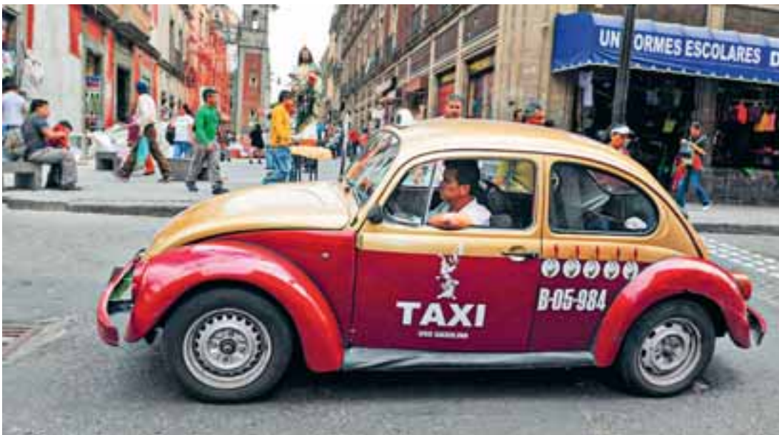
Πόλη του Μεξικού. Ακόμη και ο ήχος κάποιων (λιγοστών σε σχέση με το παρελθόν) ταξί είναι ξεχωριστός για την εποχή μας. Εκείνος του αερόψυκτου κινητήρα που σχεδίασε ο Φέρντιναντ Πόρσε.

Ξεφυλλίζω το τλαιπωρημένο σημειωματάριο. Οι πρώτες σελίδες είναι πυκνογραμμένες. Ωστόσο, σταδιακά αραιώνουν, για να γίνουν σκόρπιες λέξεις στο χαρτί, μέχρι να καταλήξουν σε μουντζούρες και κακόγευχα σχέδια. Το πρόβλημα, βέβαια, είναι πάντα το ίδιο. Δεν βγάζω τα γράμματά μου. Γράφω βιαστικά και με τέτοιο τρόπο, λες και θέλω να ξεχάσω κάθε σκέψη, γεγονός ή εικόνα που καρφώνεται στο μυαλό μου, λες και θέλω να αποθηκεύσω άτσαλα το περι-