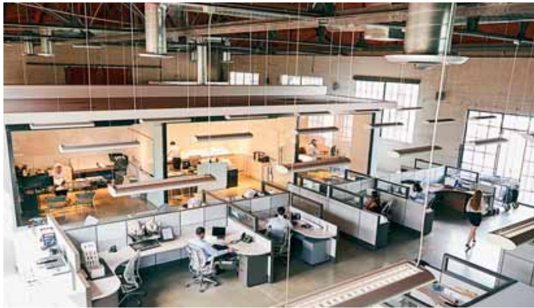
Η μεγάλη πλειονότητα χρηστών και επενδυτών αναζητεί πλέον αειφορία και ψηφιοποιημένα - αυτοματοποιημένα συστήματα, σημειώνει η εταιρεία πιστοποιημένων εκτιμητών Geoaxis. Ζήτηση που δεν μπορεί να καλυφθεί, καθώς τα νεόδμητα ενεργειακά πιστοποιημένα κτίρια γραφείων αποτελούν μόλις το 10% της αγοράς.