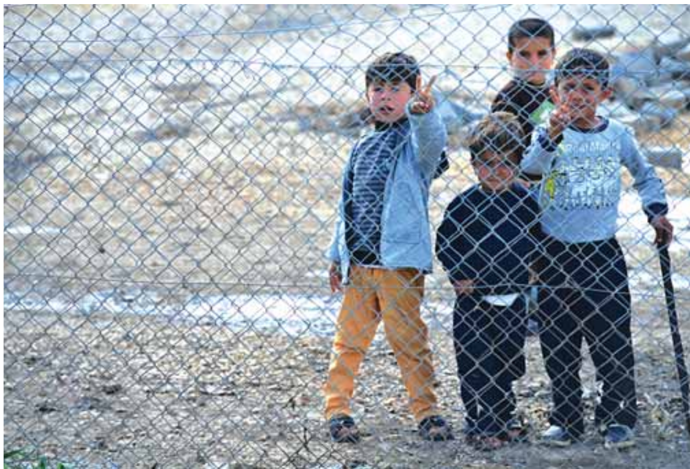
Η παράταση της δυνατότητας της Δημοκρατίας να εξετάζει αιτήσεις προσφύγων από τη Συρία, η οποία στην Κύπρο παρουσιάζεται και εφαρμόζεται ως αναστολή της εξέτασης αιτήσεων, είναι εκ των πραγμάτων προσωρινή και περιορισμένης διάρκειας.

Περίπλοκη εξίσωση και σε αρχικό στάδιο οι προσπάθειες για τη χρηματική στήριξη Ε.Ε. προς τη Βηρυτό