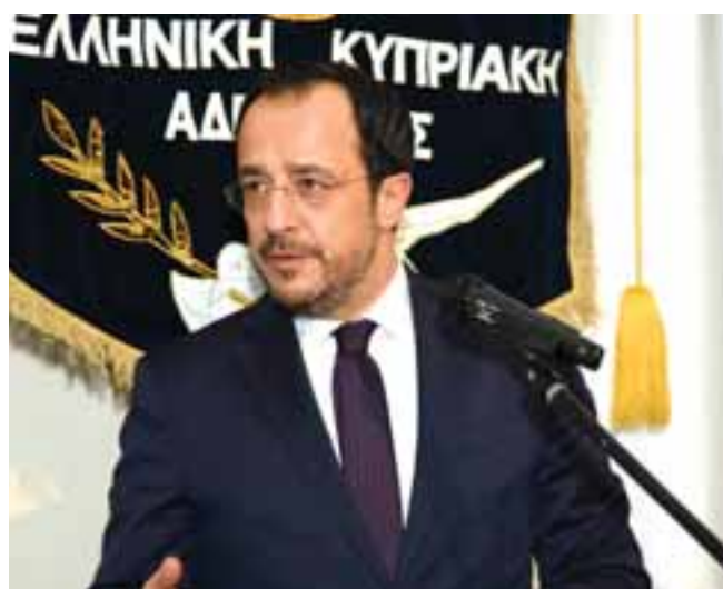
Καμία παραπλήνση δεν έκανα τον Φεβρουάριο του 2023.