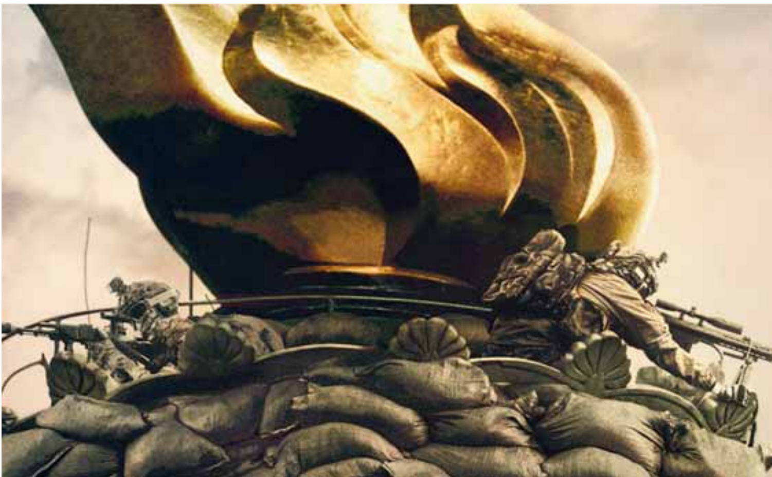
Ελεύθεροι σκηνοθετές στον πυρσό του Αγάλματος της Ελευθερίας. Ο Αλεξ Γκάρλαντ περιγράφει ένα χάος με έντονους συμβολισμούς.

Στις καλές στιγμές της, η ταινία του Γκάρλαντ και της A24 είναι ακριβώς αυτό: μια τραβηγμένη στα άκρα μεγέθυνση αληθινών προβλημάτων με εύστοχες παρατηρήσεις, πάνω σε μια ξεκάθαρα διχασμένη χώρα, η οποία ετοιμάζεται για άλλον ένα γύρο καθοριστικών εκλογών. Από την άλλη, συχνά οι συμβολισμοί γίνονται υπερβολικά χοντροκομμένοι και οι καταστάσεις σχηματικές, ενώ η ανάγκη-επιλογή για περισσότερη καθαρή δράση, ειδικά προς το τέλος, στερεί στην πραγματικότητα κάτι από τη δραματική κορύφωση και την αληθοφάνεια των τεκταινόμενων.