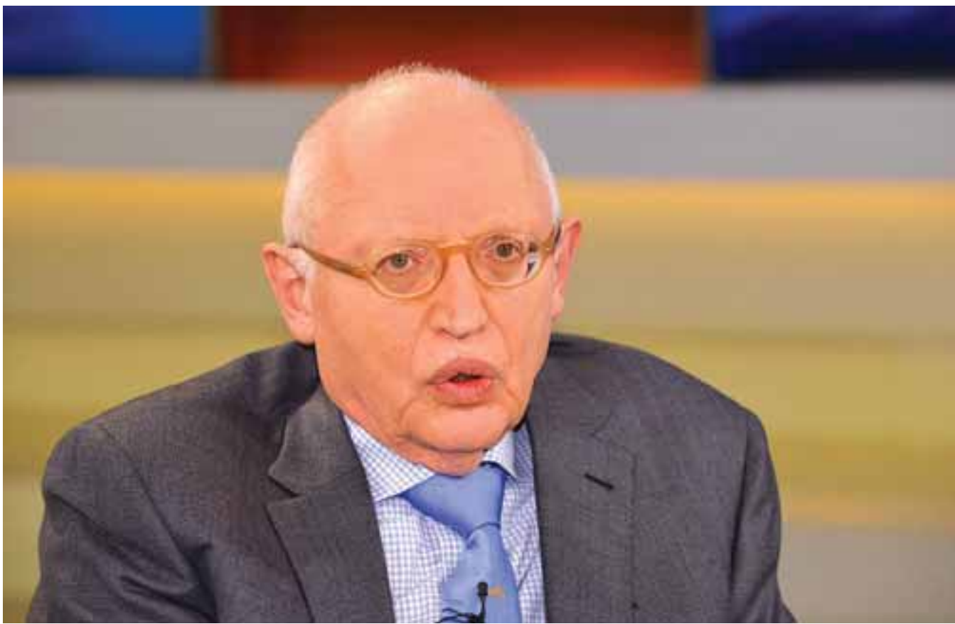
Ο Γκίντερ Φερχόιγκεν με αφορμή τα 20 χρόνια από το δημοψήφισμα για το Σχέδιο Ανάν μιλάει στην «Κ» για τις τότε διαπραγματεύσεις και την ενταξιακή πορεία της Κύπρου.