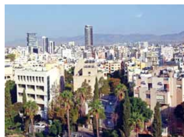
Η ενεργειακή αναβάθμιση των γερασμένων κτιρίων πρέπει να είναι προτεραιότητα. Η παρούσα κατάσταση φαίνεται να είναι στον αυτόματο πιλότο.

Αναφέρωμια πιο πάνω σε σχέδια βραχείας έκτασης. Ενωώ πως σε αυτά τα σχέδια τίθενται τέτοιες προϋποθέσεις που στην τελική έχουν μικρό πεδίο εφαρμογής. Για παράδειγμα, στο κίνητρο για την παραγωγή προσιτών κατοικιών παραχωρείται αύξηση στον συντελεστή δόμησης 25%, εκ της οποίας το 15% θα διοχετεύεται προς την κατασκευή προσιτών στέγης και το υπόλοιπο 10% είναι το μόνους/καρότο προς τον ιδιοκτήτη. Καλοπροαίρετο το μέτρο, δεν αντιλέγω, εφόσον θέλουμε προσιτή στέγη. Η πρώτη μου μικρή ένσταση είναι στο ύψος του 25% στην αύξηση του συντελεστή δόμησης: είναι το 15% αρκετό για παραγωγή προσιτών στέγης. Πιστεύω πως είναι λίγο. Έπρεπε η συνολική αύξηση να είναι μεγαλύτερη για να δούμε αξιοσημείωτο αποτέλεσμα στην αγορά. Αλλά αυτό είναι δευτερεύον. Η μεγάλη μου ένσταση είναι στην πρώτη προϋπόθεση που τίθεται: «Ελάχιστο Καθαρό Εμβαδόν ιδιοκτησίας 4.000 τ.μ.».