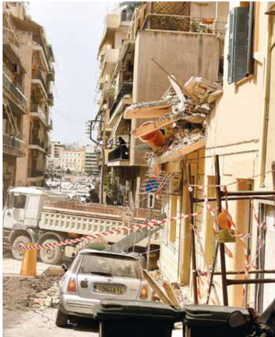
Η κατάρρευση του υπό ανακαίνιση κτιρίου την περασμένη Τρίτη στον Πειραιά και η καταπλάκωση του 31χρονου ειδικού φρουρού που εργαζόταν εκεί επανέφεραν με δραματικό τρόπο στην επικαιρότητα το ζήτημα της παράνομης παράλληλης απασχόλησης αστυνομικών.

Ένας εκ των αστυνομικών που μίλησαν υπό τον όρο της ανωνυμίας στην «Κ» είναι άνω των 40 ετών και από το 2022 εργάζεται και στην οικοδομή. Το περασμένο Σάββατο μετέφερε λαμαρίνες σε ένα εργοτάξιο για 40 ευρώ. «Σκέφτομαι τουλάχιστον ότι δεν κλώφω φυλάξεις με όπλο, αλλά κάτι πιο τίμιο. Ντρέπομαι, όμως, να πω στον πατέρα μου ότι έχω και δεύτερη δουλειά», λέει. «Αν γύριζα τον χρόνο πίσω μπορεί να επέλεγα κάποιο άλλο επάγγελμα. Είναι μεγάλη η κούραση, να είσαι στην οικοδομή και μετά εάν έχεις νυχτερινή βάρδια πηγαίνεις στην υπηρεσία πτώμα. Δεν υπάρχει διαύγεια, τα κάνει όλα μηχανικά. Υπάρχει πάντοτε και ο φόβος μη με πιάσουν, αλλά έχουν προκύψει επιπλέον έξοδα, τα ενοίκια έχουν αυξηθεί, πρέπει να βγάλω περισσότερα».