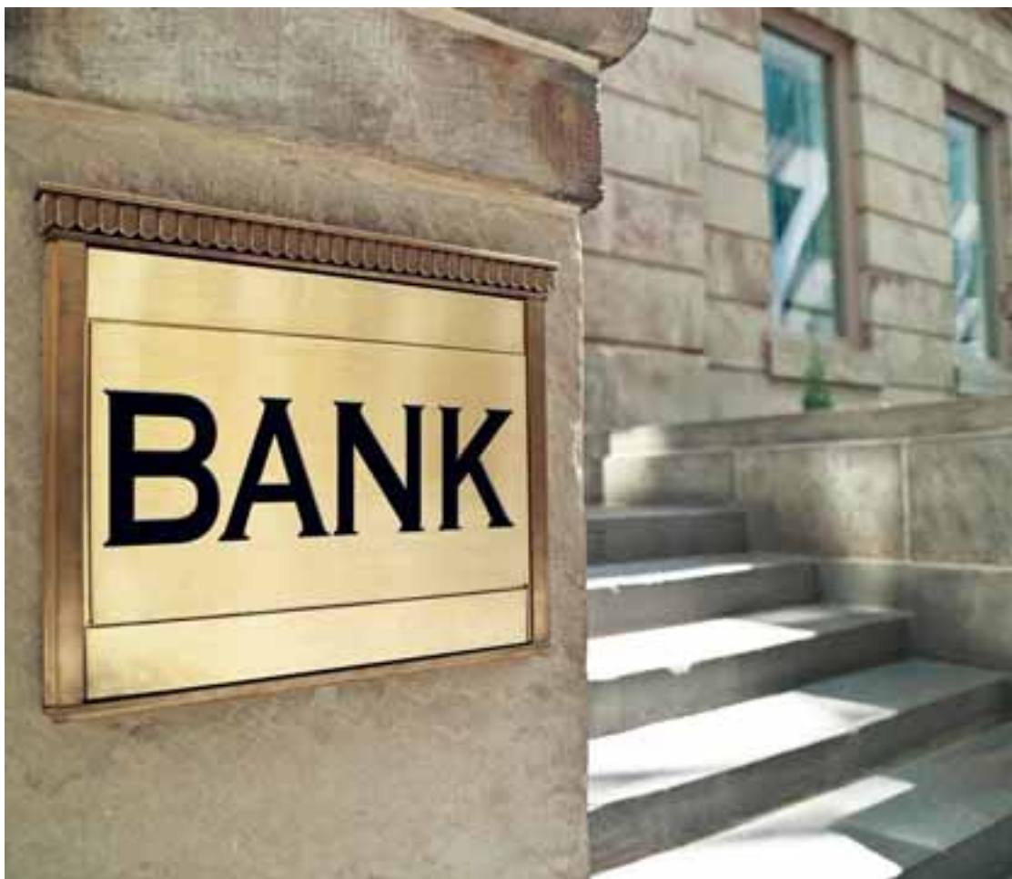
Οι δείκτες που παρουσίασαν οι κυπριακές τράπεζες το 2023 στα αποτελέσματά τους είναι οι καλύτεροι που έχουν παρουσιάσει τουλάχιστον εδώ και μία 15ετία.

Για την Τράπεζα Κύπρου, τα καθαρά έσοδα από τόκους για το 2023 ανήλθαν σε 792 εκατ. ευρώ, σε σύγκριση με 370 εκατ. ευρώ για το 2022, αυξημένα κατά 114% σε ετήσια βάση. Επωφελήθηκαν από την