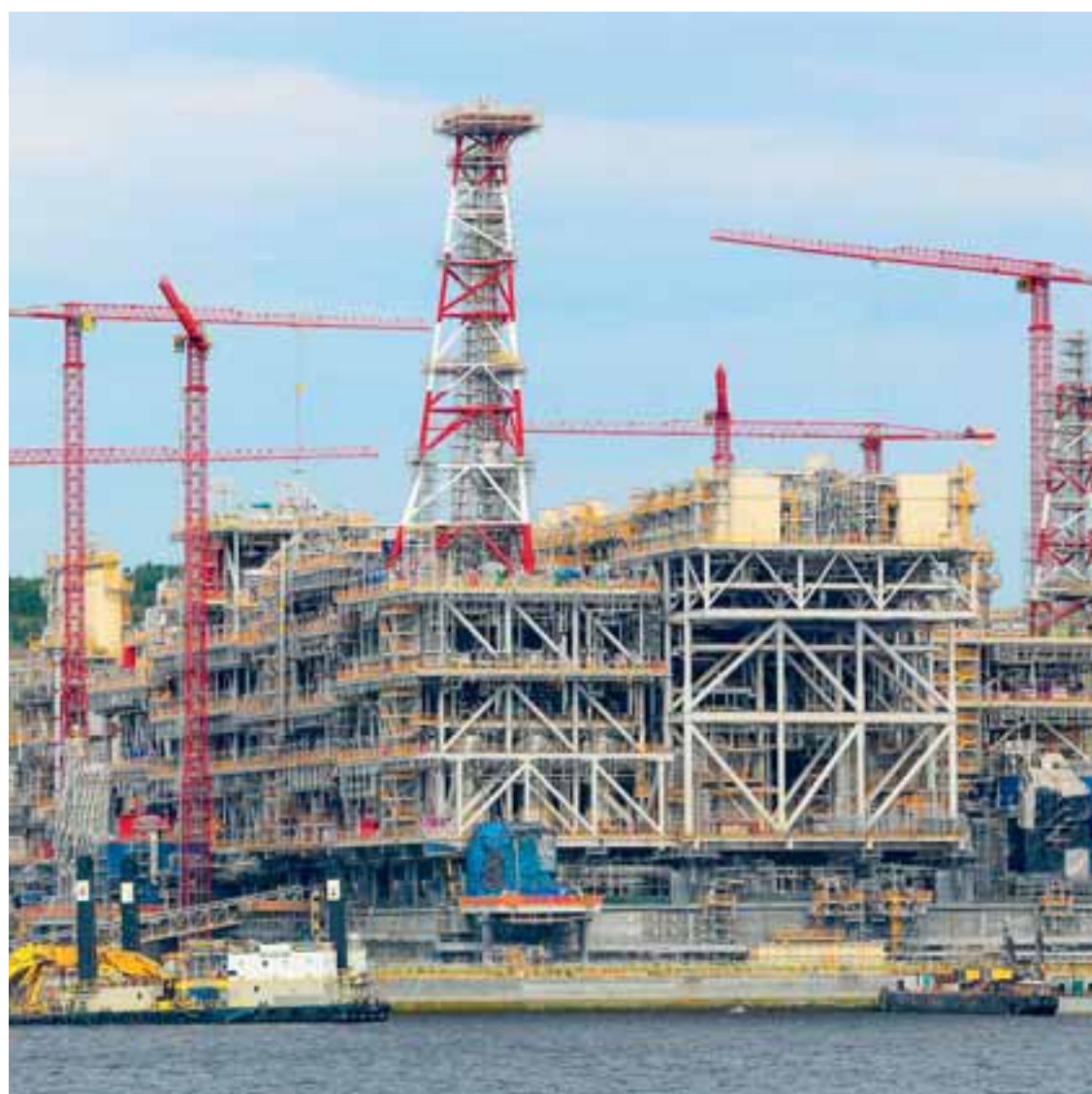
Η Ρωσία κατασκευάζει στην Αρκτική εργοστάσια παραγωγής υδροποιημένου αερίου με στόχο να υπερτριπλασιάσει τις εξαγωγές LNG τα επόμενα χρόνια.

Το Κρεμλίνο χρησιμοποιεί εδώ και καιρό τις εξαγωγές ενέργειας ως μοχλό πίεσης. Το 1990, για παράδειγμα, η Σοβιετική Ένωση διέκοψε τις προμήθειες πετρελαίου στη Βαλτική για να παρακωλύσει τα κινήματα ανεξαρτησίας, ενώ ακόμη και πριν εισβάλει στην Ουκρανία, η Μόσχα μείωσε τις προμήθειες φυσικού αερίου στην Ευρώπη, προκαλώντας αύξηση τιμών. Τον Δεκέμβριο του περασμένου έτους, το πρώτο από τα τρία εργοστάσια υδροποίησης, γνωστά στη βιομηχανία ως «τρένα», ολοκληρώθηκε στο Arctic LNG 2 και η εγκατάσταση άρχισε να παράγει LNG. Οι εξαγωγές έπρεπε να ξεκινήσουν το πρώτο τρίμηνο, όμως τα ειδικά κατασκευασμένα πλοία που