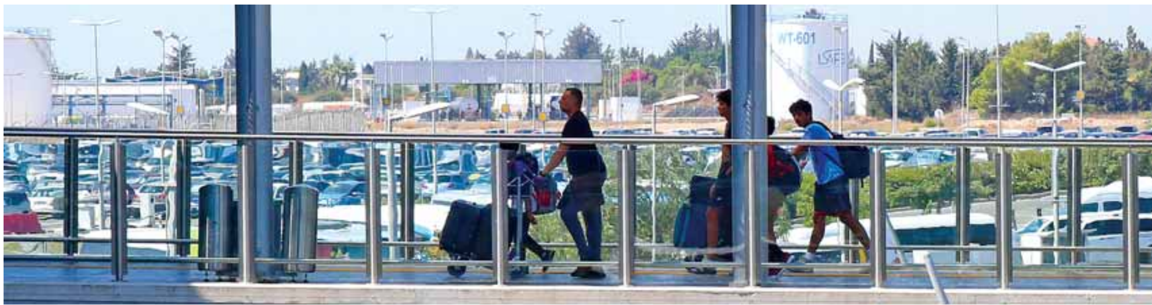
Προς το παρόν δεν υπήρξαν ακυρώσεις πτήσεων προς την Κύπρο, χωρίς αυτό να αποκλείεται λόγω της συνεχούς μεταβαλλόμενης έντασης στην Ανατολική Μεσόγειο.