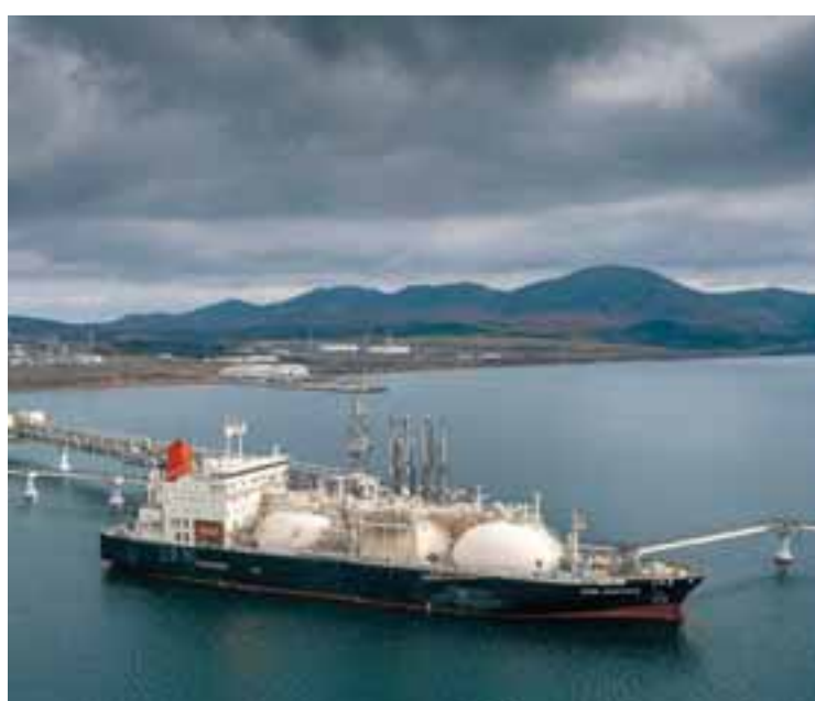
Τα θαλάσσια και σιδηροδρομικά δίκτυα μέσω Ιράν και το θαλάσσιο πέρασμα στην Αρκτική θα μπορούσαν να ενισχύσουν ακόμη περισσότερο τους δεσμούς της Μόσχας με την Κίνα και την Ινδία. Με αιχμή τις ρωσικές πωλήσεις πετρελαίου το εμπόριο με την Κίνα έφτασε πέρυσι στο ρεκόρ των 240 δισ. δολαρίων, υπερδιπλάσιο από τα 108 δισ. δολάρια το 2020, ενώ με την Ινδία αυξήθηκε σε σχεδόν 64 δισ. δολάρια πέρυσι, έναντι περίπου 10 δισ. δολαρίων τρία χρόνια νωρίτερα.

Η Ρωσία εξέδωσε δάνειο ύψους 1,3 δισ. ευρώ στο Ιράν τον περασμένο Μάιο για την κατασκευή μιας ζωτικής σημασίας σιδηροδρομικής σύνδεσης που θα εκτείνεται σε 162 χιλιόμετρα συνδέοντας την πόλη Ραστ κατά μήκος της ακτής της Κασπίας Θάλασσας