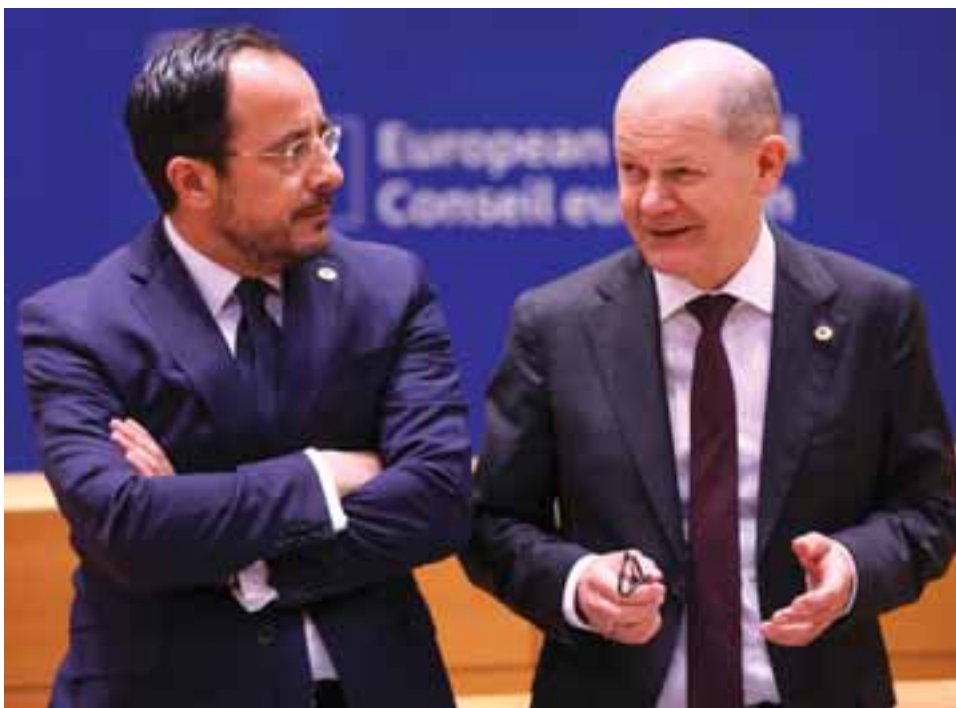
Ο Νίκος Χριστοδουλίδης και η υφυπουργός Ευρωπαϊκών Θεμάτων Μαριλένα Ραουά επεδίωξαν να περιληφθεί αναφορά στα Συμπεράσματα, σύμφωνα με την οποία, το Κυπριακό θα αποτελούσε «προϋπόθεση» για την υλοποίηση της «νέας μακρόπνοης ευρωπαϊκής σχέσης». Στη φωτογραφία ο κ. Χριστοδουλίδης με τον Γερμανό καγκελάριο Ολαφ Σολτς.

Τι επεδίωξε, τι πήρε και τι απώλεσε ο πρόεδρος Χριστοδουλίδης σε ευρωπαϊκά και Κυπριακά