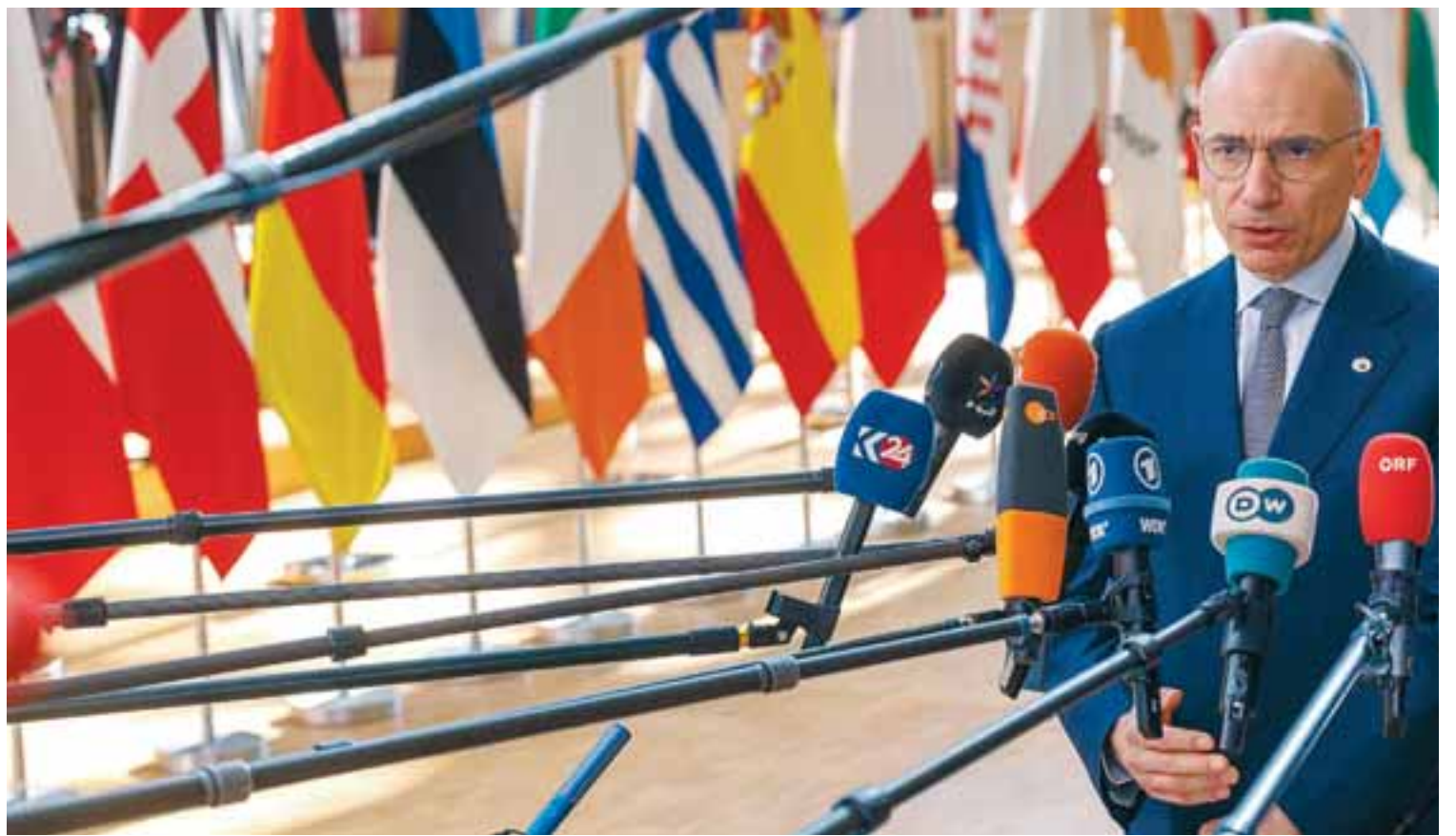
Ο πρώην πρωθυπουργός της Ιταλίας Ενρικό Λέτα επί της ουσίας προτείνει την ένωση αποταμιεύσεων και επενδύσεων (Savings and Investment Union), που θα εξασφαλίσουν την παραμονή ιδιωτικών κεφαλαίων στην Ευρώπη, με άμεση προτεραιότητα την πράσινη και ψηφιακή μετάβαση, καθώς και την εισαγωγή ενός νέου ευρωπαϊκού συστήματος κρατικών ενισχύσεων σε ευρωπαϊκό επίπεδο.

Παράλληλα, όμως, η έκθεση Λέτα «απαντά» στις ανησυχίες της Ε.Ε. ότι εν μέσω των νέων γεωπολιτικών ανακατατάξεων με δύο πολέμους στη γειτονιά της και την πιθανή επιστροφή του Ντόναλντ Τραμπ στις ΗΠΑ, η Ευρώπη θα μείνει όχι μόνο «πίσω» αλλά και μόνη της. Στο πλαίσιο αυτό, οι «27» κατέληξαν μετά κόπων και βασάνων σε ένα «νέο σύμφωνο για την ευρωπαϊκή ανταγωνιστικότητα» προκειμένου η Ε.Ε. να μη μείνει «πίσω» από τους βασικούς ανταγωνιστές της και να δώσει νέα πνοή στη βιομηχανική πολιτική της. Όμως για να συμβεί αυτό «χρειάζεται να κινητοποιήσουμε περισσότερα χρήματα, περισσότερα εργαλεία, να επενδύσουμε σε στρατηγικούς τομείς», σημείωσε ο πρόεδρος του Ευρωπαϊκού Συμβουλίου Σαρλ Μισέλ. «Στη διάρκεια της συνεδρίασης όλοι μας αντιληφθήκαμε ότι είναι σημαντικό να επιταχύνουμε, να αυξηθούμε, δίνοντας όμως προσοχή στις μικρομεσαίες επι-