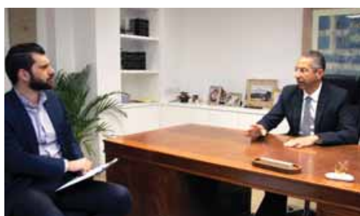
«Από την πρώτη στιγμή του διορισμού μου γνώριζα ότι δεν θα παραμείνω στην υπηρεσία μέχρι την ηλικία αφηρητότητός μου».

–Δεν υπάρχει κανένας ανταγωνισμός για επικράτηση της Νομικής Υπηρεσίας έναντι της Ελεγκτικής Υπηρεσίας. Είμαστε δύο ανεξάρτητες Υπηρεσίες της Δημοκρατίας με εντελώς διαφορετικές αρμοδιότητες. Αυτό που κατά την άποψή μου πρέπει να ξεκαθαρίσει, μέσα από την ενδεδειγμένη διαδικασία, είναι το ζήτημα σε σχέση με τη συμπεριφορά του γενικού ελεγκτή. Και αυτή η συμπεριφορά δεν περιορίζεται στα