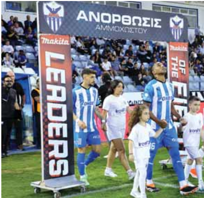
Τα λεφτά που ξόδεψε η διοίκηση για να καλύψει παλιές «αμαρτίες» σε συνδυασμό με το υψηλό μπάτζετ που δημιουργήθηκε, οδήγησαν την ομάδα στο αδιέξοδο.

φάση το αγωνιστικό κομμάτι έρχεται σε δεύτερη μοίρα, καθώς επικρατεί οικονομικό και διοικητικό αδιέξοδο, μιας και μεσούσης της εβδομάδας παραιτήθηκε η διοίκηση Σάντη με το τίποτα να είναι θολό. Πιο συγκεκριμένα η διοίκηση του σωματίου παραιτήθηκε, με σκοπό να ανοίξει τον δρόμο σε όποιον επιθυμεί να εμπλακεί στα διοικητικά της Ανόρθωσης