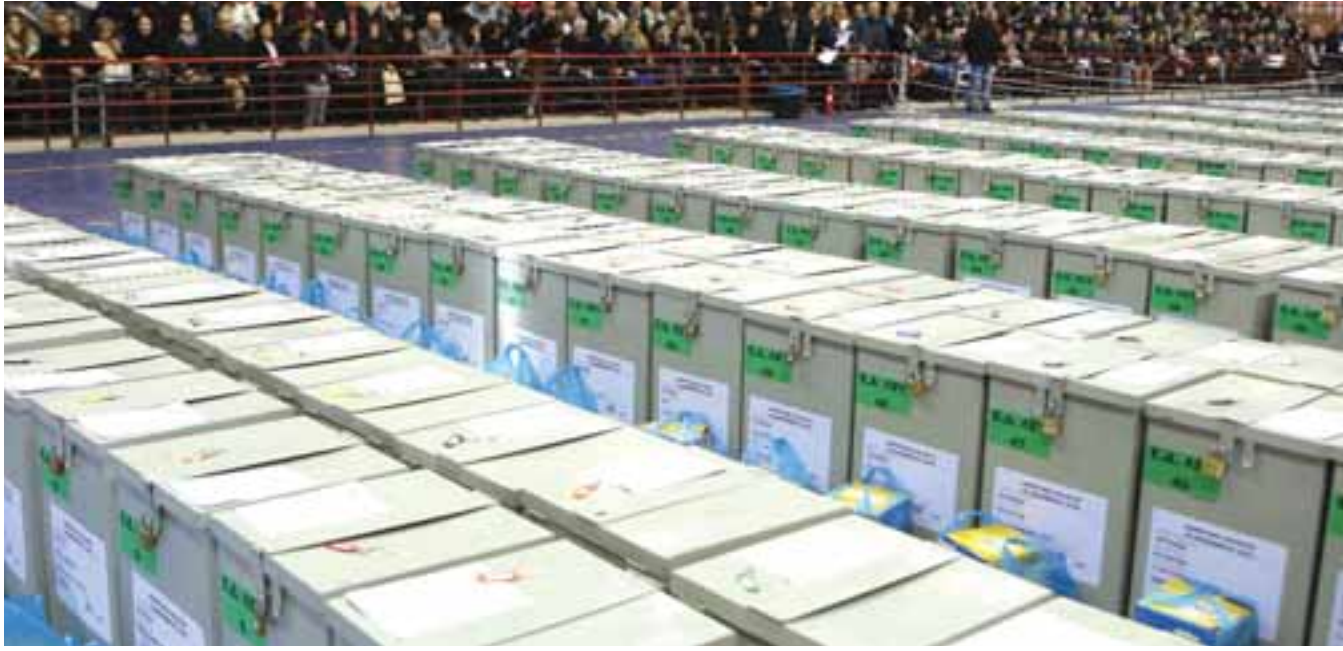
Στο ερώτημα εάν το κράτος είναι σε θέση να διαβεβαιώσει ότι, μετά τον έλεγχο των ενστάσεων, έχει αποτρέψει το ενδεχόμενο αλλοίωσης αποτελέσματος, από πλευράς υπουργείου Εσωτερικών είναι παραδεκτό ότι αυτό δεν μπορεί να ειπωθεί.

Οι ενέργειες των αρχών και οι τοποθετήσεις ΑΚΕΛ - ΔΗΣΥ για τη Λακατάμια