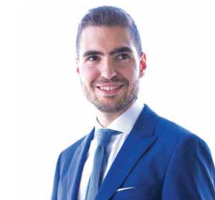
Ο επιχειρηματικός βραχίονας της Eric παρέχει όλες τις απαραίτητες υπηρεσίες καθώς και εξειδικευμένους επιχειρηματικούς συμβούλους, και είναι δίπλα στις επιχειρήσεις και τις ανάγκες τους.

σκοπτη πρόσβαση στο Internet μέσω κλιμακωτών οπτικών ινών (100%), προηγμένη σταθερή τηλεφωνία με υπηρεσίες τηλεφωνικού κέντρου, τη βραβευμένη εφαρμογή Webex by CISCO για collaboration η οποία σου επιτρέπει έξεις το σταθερό σου τηλέφωνο και το τηλεφωνικό σου κέντρο με όλες τις λειτουργίες σε όλες τις συσκευές (κινητό, υπολογιστή, τάλμπλετ) τόσο εντός όσο και εκτός γραφείου και πλάνο κινητής 5G Unlimited Max για απεριόριστα δεδομένα, SMS και λεπτά ομιλίας. Όλες αυτές οι υπηρεσίες προσφέρονται μέσω του Eric Business One σε ένα πλάνο με χαμηλό μηνιαίο κόστος. Επιπλέον, μπορούν να προσαρμοστούν στο μέγεθος και τις ανάγκες κάθε επιχείρησης, μειώνοντας το λειτουργικό κόστος και αυξάνοντας την παραγωγικότητα. Όλα αυτά δείχνουν το ανταγωνιστικό πλεονέκτημα του Eric Business καθώς φέρνει σημαντικά χαρακτηριστικά χωρίς να απαιτεί υψηλές επενδύσεις από τις επιχειρήσεις