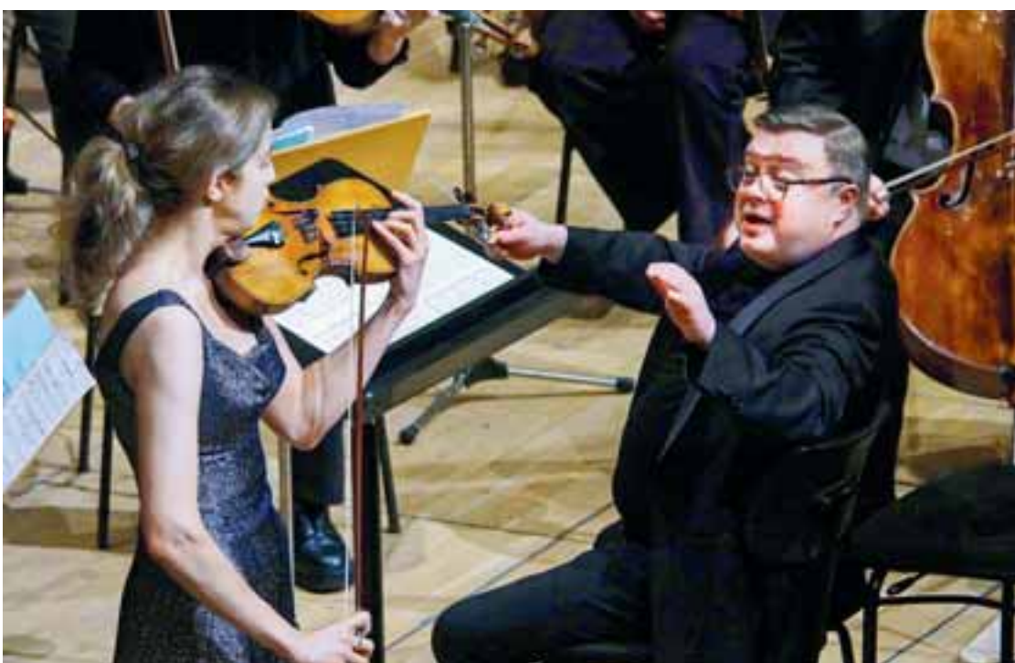
Η Νορβηγίδα βιολονίστρια Βίλντε Φρανγκ δεν φοβόταν να αναδείξει τα σκοτάδια της μουσικής του Σοστακόβιτς.

του Στραβίνσκι. Ο Φρανκ και η ορχήστρα ανέδειξαν τις ατμόσφαιρες του μπαλέτου μέσα από τη μουσική: την ανάλαφρη, ανέμελη διάθεση καρναβαλιού με το