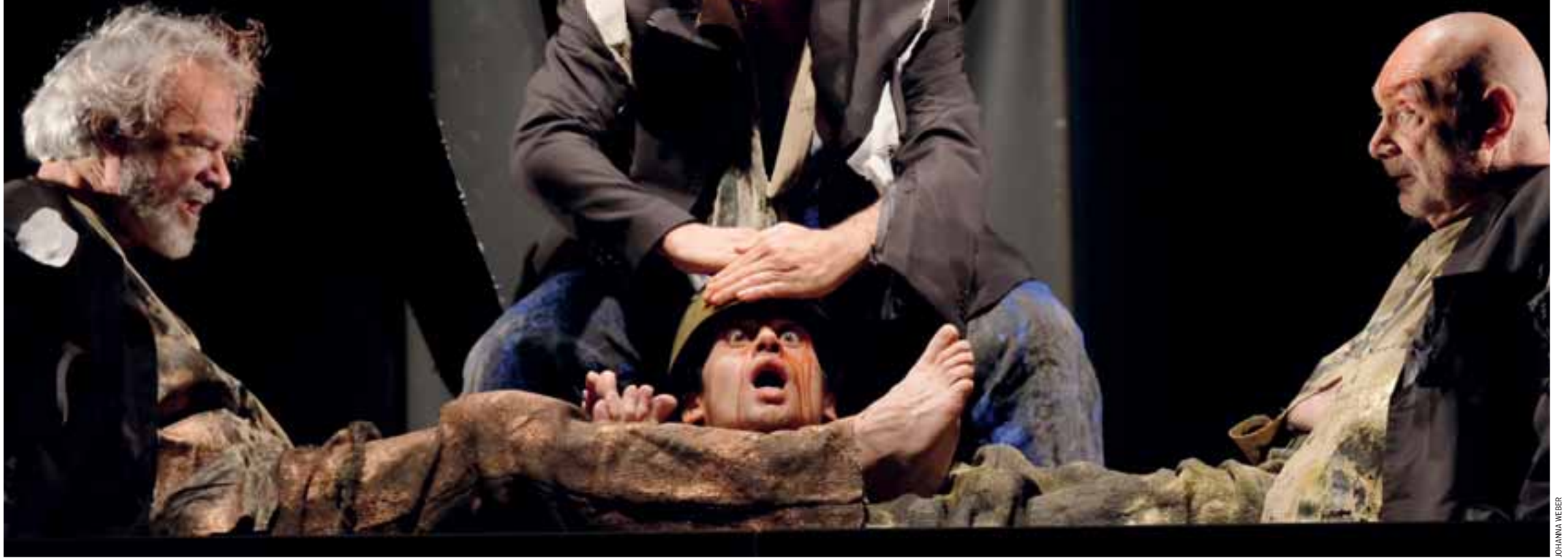
Σκηνή από την παράσταση «Περιμένοντας τον Γκοντό», του Σάμιουελ Μπέκετ. «Εσύ είσαι εδώ και το κείμενο έχει πάει πιο κάτω και εκεί που πας να πλησιάσεις το νόημα, αυτό έχει μεταφερθεί πάλι αλλού. Όπως και με τις αρχαίες τραγωδίες, έτσι και η "ποίηση" του Μπέκετ χαρακτηρίζεται από την αιώρηση των πραγμάτων», λέει ο Θεόδωρος Τερζόπουλος.