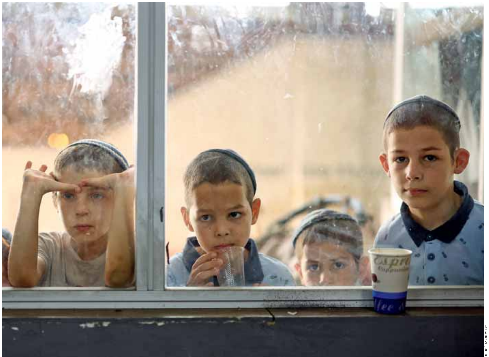
Παιδιά ορθόδοξων Εβραίων παρακολουθούν από το παράθυρο προετοιμασίες για το Πάσχα, ο εορτασμός του οποίου αρχίζει αύριο. Η ατμόσφαιρα, ωστόσο, με τις επιχειρήσεις στη Γάζα σε εξέλιξη, τους ομήρους στα χέρια της Χαμάς και τους ιρανικούς πυραύλους να χαράζουν τον ουρανό, προφανώς και δεν μπορεί να είναι εορταστική.