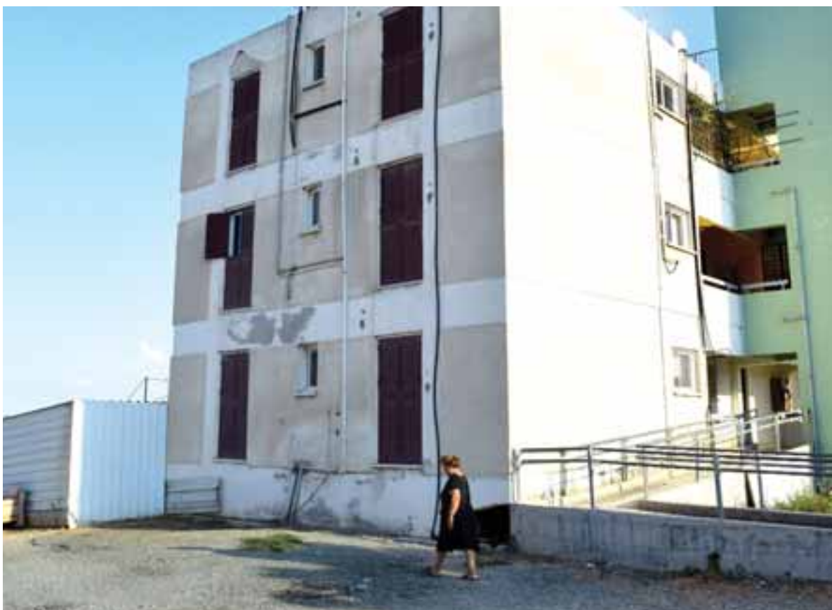
Είκοσι χρόνια μετά που η λύση δεν ήρθε ακόμα, είκοσι χρόνια μετά, που ελάχιστοι έμειναν να ελπίζουν, ακόμα, περπατώντας στους συνοικισμούς βλέπω και ακούω ανθρώπους που θωρούν όρομα τα χωρικά τους.

κυλος μοιάζει ανίκανος να αποσείσει τους εισβολείς, μα πώς να τα καταφέρει, όταν ξεκουφίζεται, από τους εκκαφεείς των επιχειρηματιών γης της άλλης πλευράς. Στη Χάρτζια, στη Βασιλεία, στον Άγιο Επίκτητο, στη Λάπηθο, και αλλού πληγώνεται οσημέρα ο Πενταδάκτυλος και οι πολιτικοί μας δίνουν τον δικό τους αγώνα... μα δεν ξέρω αν ποτέ άκουσαν για κάποιον με το όνομα Ονήσιλος. Δεν ξέρω αν ποτέ είδαν ή αισθάνθηκαν μέλισσες να τουςτσιμπούν... Δεν είδα επίσης ποτέ κανέναν να φρυάξει. Μάνες και πατεράδες, άσημων ανδρών μόνο είδα να κλαίει και να ολοφύρονται. Γυναίκες άσημων ανδρών, μετά θάνατον αγάλματα και χαράγματα, είδα μόνο να κλαίει γοερά.