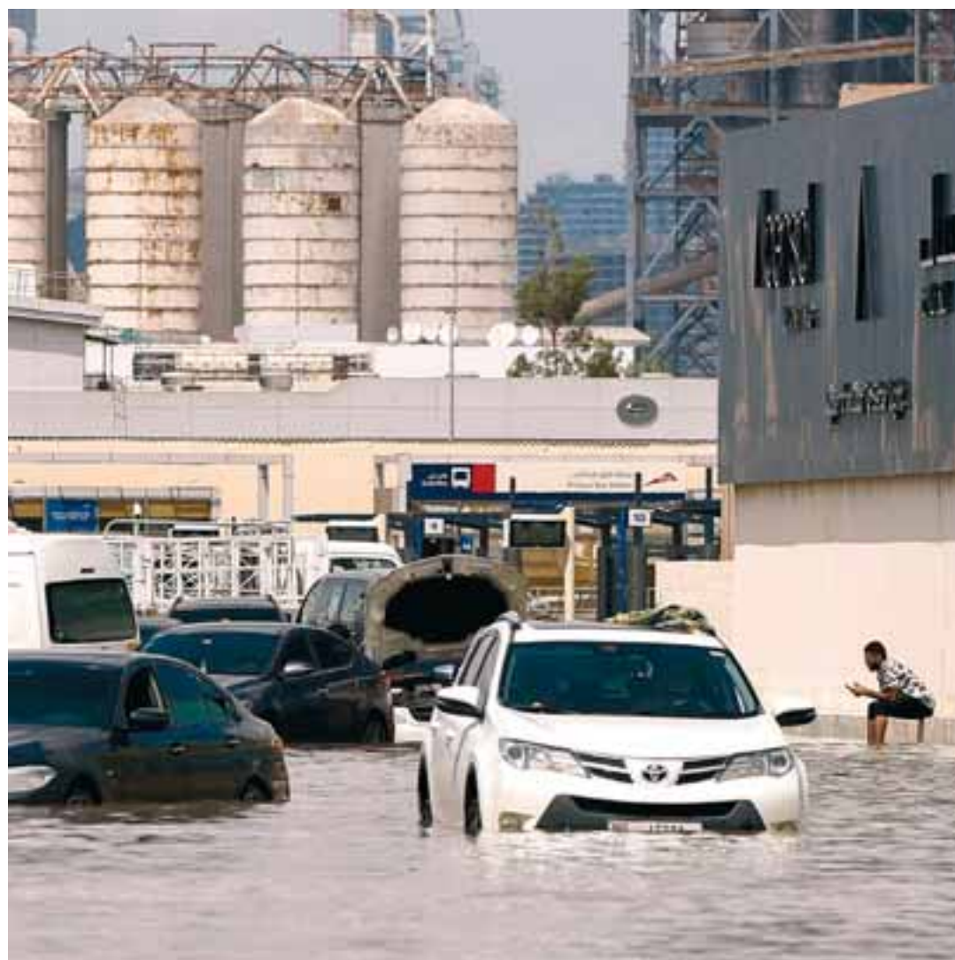
Ο οικονομικός αντίκτυπος των ακραίων καιρικών φαινομένων δεν θα είναι ίδιος για όλα τα κράτη. Η Βόρεια Αμερική και οι χώρες της Ευρώπης θα πληγούν λιγότερο, αφού θα μειωθεί το εισόδημά τους κατά 11%, όταν στη νότια Ασία και στην Αφρική η αντίστοιχη μείωση θα φτάσει στο 22%. Η φωτογραφία είναι από τις πρόσφατες πλημμύρες που έπληξαν το Ντουμπάι.

Και όπως συνήθως συμβαίνει, το κόστος δεν θα είναι ίδιο για όλες τις χώρες, αλλά θα πλήξει περισσότερο τις φτωχές και αναπτυσσόμενες. Η Βόρεια Αμερική και οι χώρες της Ευρώπης θα πληγούν λιγότερο αφού θα μειωθεί το εισόδημά τους κατά 11%, όταν στη νότια Ασία και στην Αφρική η αντίστοιχη