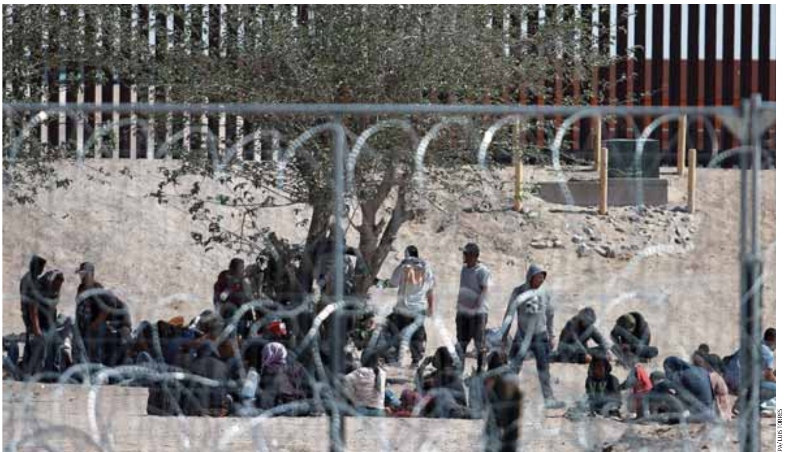
Μετανάστες συγκεντρώνονται στα σύνορα με τις Ηνωμένες Πολιτείες, στο Σιουδάδ Χουάρες του Μεξικού. Περίπου 400 μετανάστες κατάφεραν να περάσουν τον φράχτη μεταξύ Χουάρες και Ελ Πάσο στις 18 Απριλίου.

ioannoug@kathimerini.com.cy Twitter: @JohnPikpas