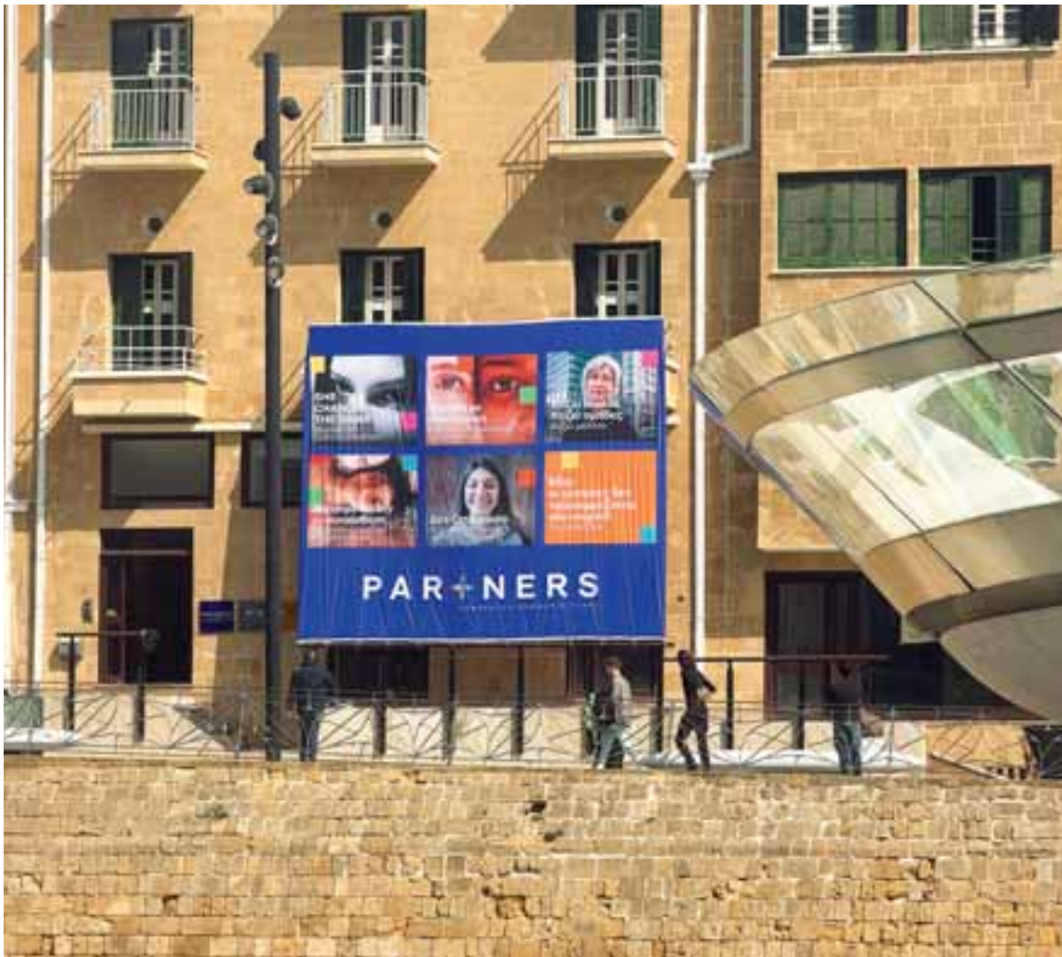
Η παρουσία γυναικών στην ηγεσία είναι θέμα καλύτερων αποφάσεων, πιο ολοκληρωμένης σκέψης, πιο δίκαιης ανάπτυξης και τελικά πιο υγιών και αποτελεσματικών οργανισμών και κοινωνιών.

θύνη και δύναμη του δικού μας χώρου. Γιατί η επικοινωνία δεν είναι απλώς ένας μηχανισμός προβολής, ούτε μια διαδικασία που απλώς «ντύνει» ένα μήνυμα πιο ελκυστικά. Είναι ένας χώρος με πραγματική επιρροή. Ένας χώρος που διαμορφώνει τάσεις, επηρεάζει συνήθειες, νομιμοποιεί συμπεριφορές και, πολλές φορές, καθορίζει τον τρόπο με τον οποίο μια κοινωνία σκέφτεται και βλέπει τον εαυτό της. Ακριβώς γι' αυτό πιστεύω βαθιά ότι όσοι εργαζόμαστε στην επικοινωνία δεν είμαστε απλοί παρατηρητές των αλλαγών. Έχουμε ευθύνη για το πώς αυτές οι αλλαγές εκφράζονται, επιταχύνονται και τελικά ριζώνουν.