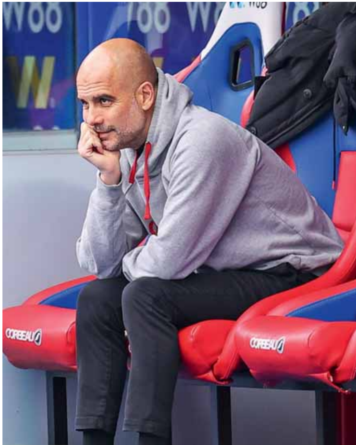
Ηδη, η Μάντσεστερ Σίτι, έπειτα από πέντε χρόνια με τον Γκουαρδιόλα στον πάγκο της, δεν αναφέρεται πια ως «η ομάδα των Αράβων», αλλά «η ομάδα του Πεπ».

Η λαοφιλέστερη ομάδα του Μάντσεστερ άλλαξε επίπεδο πολύ γρήγορα, πληρώνοντας βέβαια το ανάλογο τίμημα. Ξοδεύοντας αλόγιστα ποσά, έμαθε να κάνει πρωταθλητισμό, βγήκε από τη σκιά της συμπολίτισσας Γουινάιτεντ, κατέκτησε τα πρωταίμα στο Νησί. Στην Ευρώπη, όμως, κάθε προσπάθεια διακρίσις έμενε ημιτέλης με μοναδικά γλυ-