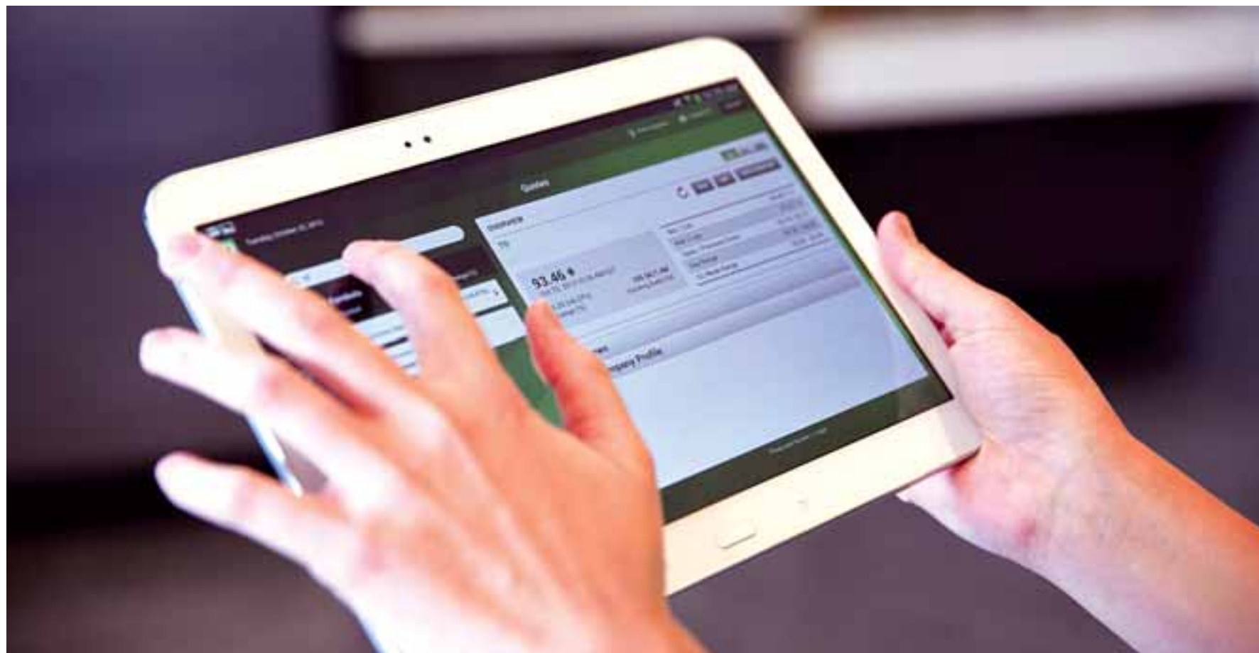
Υπάρχει μία προκαταρκτική άσκηση μεταξύ συγκεκριμένων τραπεζών, ενώ ερωτηματικά προκύπτουν για το τι θα πράξουν οι τράπεζες που θα παραμείνουν μικρές.

τράπεζα, αλλά με γνώμονα την δημιουργία ενός σχήματος που θα έχει αρκετή δύναμη και μέλλον στο νησί. Πίσω από κλειστά δωμάτια των τραπεζικών ιδρυμάτων, έγιναν και το 2020 και όπως πληροφορείται η «Κ» και το 2021 ασκήσεις για το ποιο υγιές σχήμα θα μπορούσε να απορροφήσει ένα άλλο εξίσου υγιές, αλλά ίσως που να έχει απέναντί του κάποιες προκλήσεις, για να υπερπηδήσει. Μεγάλο εμπόδιο σε μία συνένωση μεγάλων τραπεζικών σχημάτων στην Κύπρο μπορεί να γίνει η αντιμονοπωλιακή ευρωπαϊκή μονάδα, με τις αντιμονοπωλιακές εγκρίσεις να είναι απαραίτητες για να γίνει μια τέτοια πράξη. Δουλεύουν ήδη κάποιες μικρές ομάδες τραπεζικών ιδρυμάτων σε τέτοιες πράξεις, δηλαδή πώς θα μπορούσε να γίνει εφικτό να μία τράπεζα να απορροφήσει την άλλη.