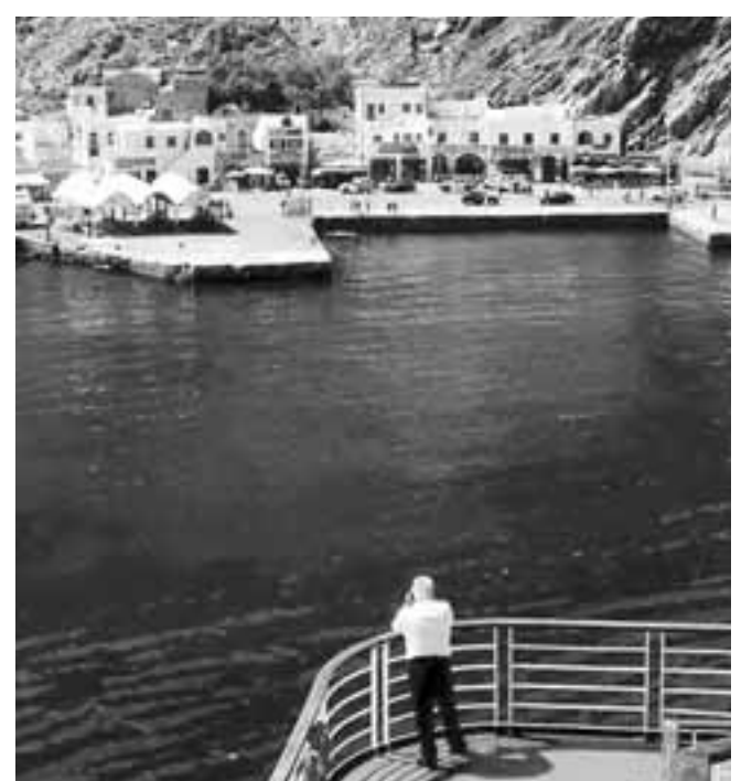
Οι πόροι θα διοχετευθούν σε δημόσια έργα υποδομών, σε μικρομεσαίες νησιωτικές επιχειρήσεις και στους κλάδους ενέργειας και μεταφορών.

Το τρίτο πρόγραμμα είναι το «Ταμείο Θαλάσσιας - Γαλάζιας Οικονομίας», με σκοπό τη μέγιστη δυνατή αξιοποίηση των χρηματοδοτικών μέσων για την ανάπτυξη και προώθηση της καινοτόμου επιχειρηματικότητας στον τομέα της θαλάσσιας οικονομίας και της γαλάζιας ανάπτυξης, καθώς και στους τομείς ναυτιλιακής τεχνολογίας, ναυτιλιακού και ναυπηγικού εξοπλισμού, ανάπτυξης εφαρμογών και για τη χρήση τεχνολογίας, πληροφορικής και επικοινωνιών στους τομείς αυτούς. Αυτό το τρίτο ταμείο θα χρηματοδοτείται με εθνικούς και ευρωπαϊκούς πόρους, σύμφωνα με τη νομοθεσία που διέπει τη σύσταση ταμείων με πόρους του ΠΔΕ ή του ΕΣΠΑ κατά περίπτωση.