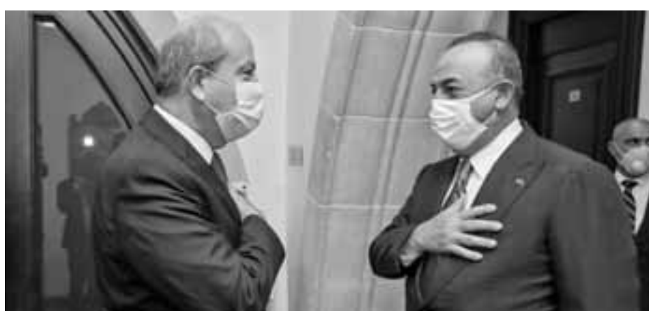
Στο Κραν Μοντάνα χάθηκε και η τελευταία πιθανότητα για ομοσπονδιακή λύση, υποστήριξαν Τσαβούσογλου και Τατάρ.

Στο περιθώριο των επαφών του με τους τ/κ αξιωματικούς, ο Τσαβούσογλου φρόντισε να στείλει μηνύματα για την επικείμενη πενταμερή διάσκεψη στο Κυπριακό. Ως γνωστόν, το τελευταίο διάστημα ο ΟΗΕ έχει εντατικοποιήσει τις προσπάθειες για την σύγκληση μιας άτυπης διάσκεψης, η οποία εκτός απρόοπτου θα πραγματοποιηθεί στις ΗΠΑ στις αρχές του επόμενου μηνός. Ο Τσαβούσογλου επανέλαβε την επίσημη θέση της Άγκυρας για το μέλλον της ΔΔΟ. Αναφέρθηκε επίσης στην ατζέντα της διάσκεψης, στην οποία θα συμμετάσχουν μαζί με τις δυο κοινότητες και τον ΟΗΕ οι τρεις γειγυριτές