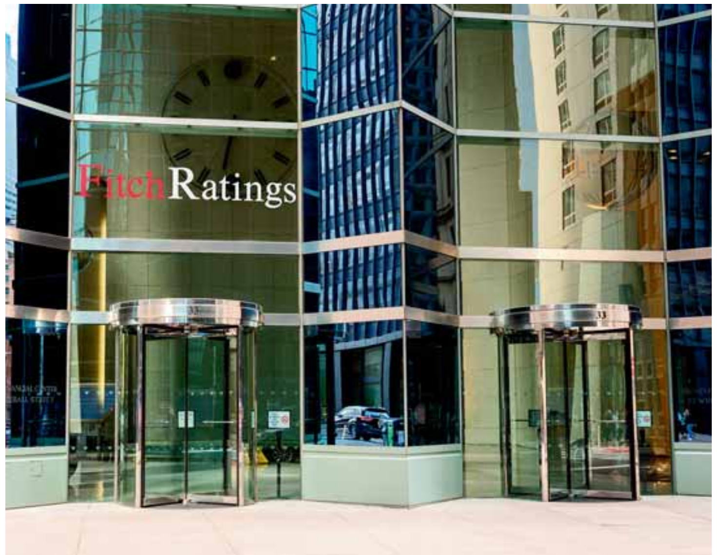
Η Fitch, η οποία διατήρησε σταθερή τη βαθμολογία της Ελλάδας στο BB (σταθερές προοπτικές), σημείωσε ότι αναμένει ισχυρή οικονομική ανάκαμψη την επόμενη διετία.

Η DBRS σημειώνει πως η Ελλάδα όπως και άλλες χώρες του Νότου αντιμετώπισαν την τελευταία 20ετία σημαντικές δομικές αδυναμίες και χαμηλά επίπεδα δημόσιων επενδύσεων. Το κατά κεφαλήν εισόδημα στην Ελλάδα διαμορφωνόταν στο 89% του μέσου όρου της E.E. το 2000, ωστόσο η θέση της χώρας έχει επιδεινωθεί κατά 22% από τότε.