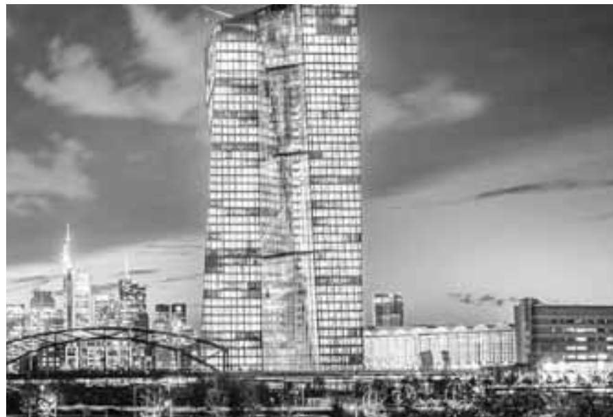
Τα ελληνικά ομόλογα αναφοράς που είναι σε κυκλοφορία διαμορφώνονται σε περίπου 57 δισ. ευρώ και η ΕΚΤ ήδη κατέχει το ένα τρίτο αυτών.

Σύμφωνα με αναλυτές και οικονομολόγους που μίλησαν στην «Κ», ο ρόλος της ΕΚΤ είναι όντως καταλυτικός σε αυτή την κρίση, ωστόσο σημαντικό μέρος της «επιτυχίας» της διατήρησης των υψηλών ταμειακών διαθεσίμων οφείλεται και στη διαχείριση που έχει κάνει η ίδια η Ελλάδα. Αξίζει να σημειωθεί πως σε ό,τι αφορά το «μαξιλάρι» ο στόχος είναι να διατηρηθεί σε υψηλά επίπεδα και φέτος, αν και αναμένεται να κλείσει κατά 6-8 δισ. χαμηλότερα