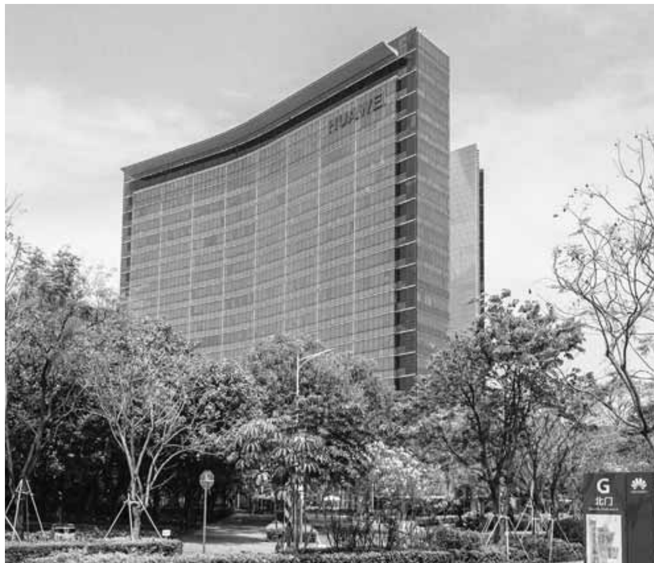
Οι ΗΠΑ σκοπεύουν να λάβουν τολμηρά μέτρα προκειμένου να προστατεύσουν τα δικτύά τους από την επιρροή της Κίνας ή οποιασδήποτε εταιρείας, είτε αυτή είναι η Huawei είτε η ZTE.

Όπως αναφέρει σχετικό δημοσίευμα του Bloomberg, η κ. Ραϊμόντο και η ομάδα της κληρονομού από την προηγούμενη διοίκηση ορισμένα μέτρα κατά των κινεζικών εταιρειών υψηλής τεχνολογίας. Ανάμεσά τους το διάταγμα του Ντόναλντ Τραμπ, με το οποίο απαγόρευσε στις αμερικανικές επιχειρήσεις να εγείνουν αμερικανική τεχνολογία και τεχνονογία στον κινεζικό