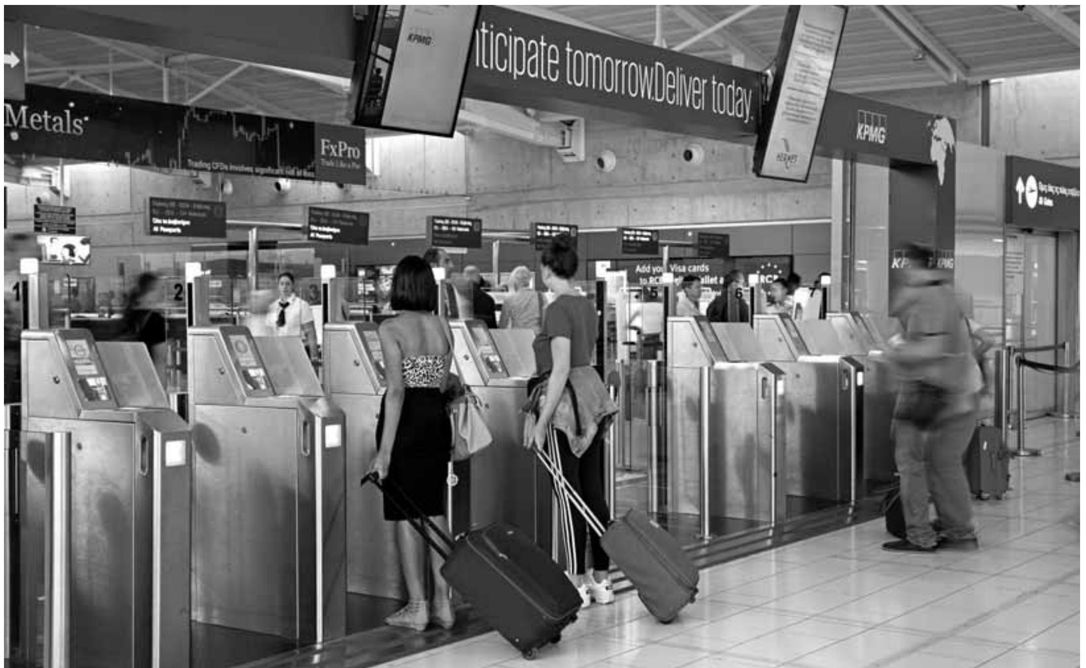
Κατηγορηματικός ως προς το αν θα είναι προϋπόθεση ο εμβολιασμός για τους επισκέπτες στο νησί ήταν ο Υφυπουργός Τουρισμού, σημειώνοντας ότι δεν υπάρχει ακόμα επίσημη τοποθέτηση του Παγκόσμιου Οργανισμού Υγείας.

Υπάρχει ένα τρίτο σενάριο το οποίο περιγράφεται ως το πιο ρεαλιστικό από τον κ. Ρουσσουινίδη ότι το ρεαλιστικό σενάριο είναι να περιμένουμε οτιδήποτε μεταξύ 35-50%. «Πάντοτε υπό την αίρεση των επιδημιολογικών δεδομένων που μπορεί να ανατρέψουν τα πάντα ανά πάσα στιγμή», σημειώνει. Καταγράφεται πάντως ένα θετικό κλίμα μέσω των επαφών των συνδέσμων ξενοδόχων με τουριστικούς πράκτορες και οργανωτές ταξιδιών, που αναμένουν και θέλουν να προγραμματιστούν για να κάνουν κρατήσεις. Σε εξέλιξη είναι και οι επαφές με τις αεροπορικές εταιρείες. Μεταφέροντας το κλίμα ο ΠΑΣΥΣΕ αναφέρει ότι υπάρχει θέληση εκ μέρους των αεροπορικών εταιρειών για να ενταχθούν την Κύπρο στα δρομολόγια τους και συνεχίζονται οι συζητήσεις με μεγάλους οργανωτές ταξιδιών όπως η TUI, η JET2 και η TUI Russia, που αναμένουν τις εξελίξεις ώστε να μπορέσουν να συμπεριλάβουν την Κύπρο ως προορισμό. Ωστόσο, όλα τα παραπάνω παραμένουν μέχρι στιγμής σε θεωρητικό επίπεδο. Στα θετικά καταγράφεται το γεγονός ότι η Wizz Air ανακοίνωσε άλλα τρία δρομολόγια από και προς το αεροδρόμιο Λάρνακας (Όλο, Τελ Αβίβ και Χάρκοβο), και επαναφορά τρίτου αεροσκάφους στην βάση της στο νησί.