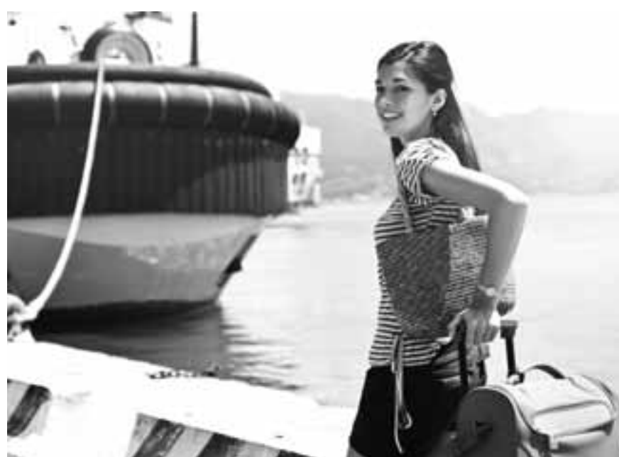
Το εμβόλιο μπορεί να λειτουργήσει ως μια fast lane για τον ταξιδιώτη που θα το έχει κάνει, θα τον απαλλάξει από άλλες υποχρεώσεις, λέει ο κ. Ρέτσος.

είναι αυξημένος. Το γεγονός, πάντως, ότι θα δίνεται η δυνατότητα στους καταναλωτές να δοκιμάσουν τα είδη ένδυσης και υπόδησης, όπως και ότι το νέο μερικό κλείσιμο δεν εφαρμόζεται σε όλη τη χώρα, μετρίασε ελαφρώς τις αντιδράσεις. «Είναι γεγονός πως οι συνεχείς μεταπτώσεις από τα ανοικτά καταστήματα σε υβριδικά και πολύπλοκα πλαίσια λειτουργίας προκαλούν σύγχυση σε εμπόρους και καταναλωτές και νέο σοβαρό πλήγμα στα ταμεία των επιχειρήσεων. Ούτε το click in shop ούτε ακόμη περισσότερο το click away συνιστούν λύση για το εμπόριο. Τα δεχόμαστε περισσότερο ως αναγκαίο κακό», δήλωσε ο πρόεδρος της Ελληνικής Συνομοσπονδίας Εμπορίου και Επιχειρηματικότητας (ΕΣΣΕ) Γιώργος Καρανίκας, κάνοντας λόγο για «πενιχρό αντίκρισμα στο ταμείο».