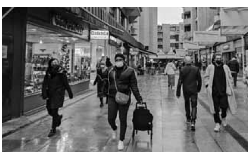
Λόγω του κινδύνου που ενέχουν οι μεταλλάξεις του κορωνοϊού, καθώς και της αργής εφαρμογής του εμβολιασμού στην Ευρωζώνη, εξακολουθεί να είναι δύσκολη η πρόβλεψη του πότε θα χαλαρώσουν τα μέτρα και θα εκκινήσει η ανάκαμψη.

μία γενικότερη και σταδιακή από τον Απρίλιο και μετά. Ο καιρός θα βελτιώνεται, επιβραδύνοντας την εξάπλωση και θα προχωρά ο μαζικός εμβολιασμός. Αναθεωρήσαμε προς τα κάτω τις προβλέψεις μας για το ΑΕΠ της Ευρωζώνης το πρώτο τρίμηνο του 2021 από -0,5% στο -2% σε τριμηνιαία βάση. Εντούτοις, υπάρχουν και καλές ειδήσεις. Εν μέσω δεύτερου κύματος της πανδημίας