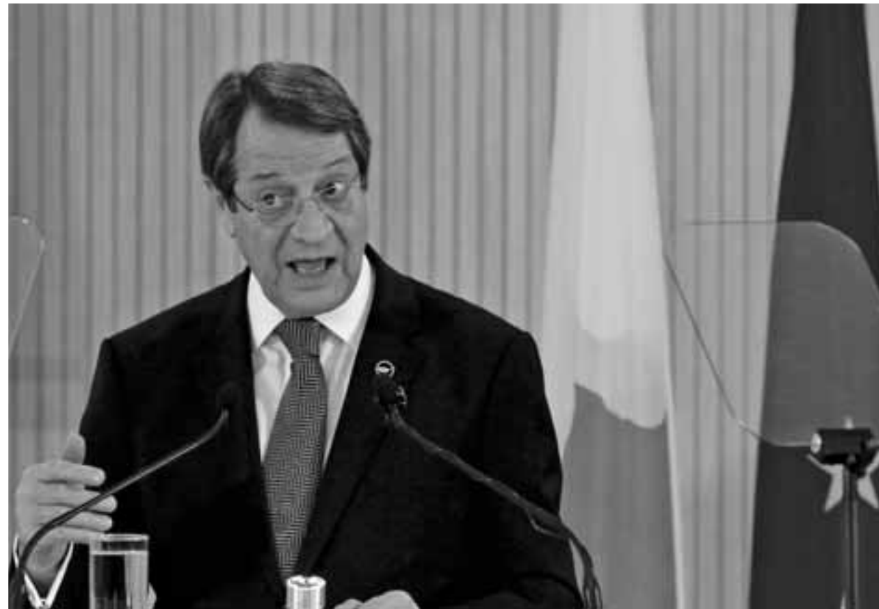
-Όταν λέω δεσμευόμαι χρειάζεται και να υπογράψω;

Μεγάλη συζήτηση είχαν πριν από λίγες ημέρες δύο πολιτικοί από τα δύο μεγάλα κόμματα για τη διαφθορά και τις επιθέ-