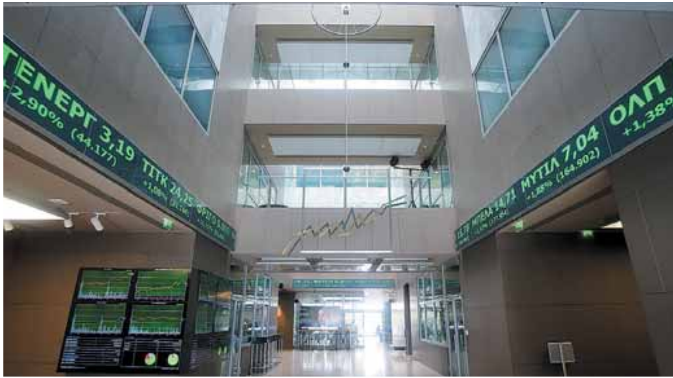
Εγχώριοι αναλυτές είχαν επισημάνει τις τελευταίες ημέρες πως η διόρθωση στο Χ.Α. μπορεί να αποτελέσει ευκαιρία νέων τοποθετήσεων, κάτι που πιθανόν να επιβεβαιώνεται από τη χθεσινή κίνηση, αν και το χαρακτηριστικό της υψηλής «ευσαιθσίας» που έχει η ελληνική αγορά δεν αφήνει πολλά περιθώρια εφρουασμού.

Μεικτές τάσεις επικράτησαν στις τράπεζες, με τον κλαδικό δείκτη να ενισχύεται κατά 0,71% στις 450,14 μονάδες και την