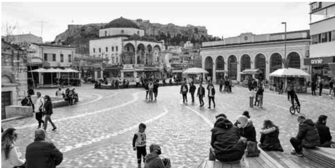
Ψυχραιμία και πιστή τήρηση των υφιστάμενων μέτρων ζητεί η κυβέρνηση.