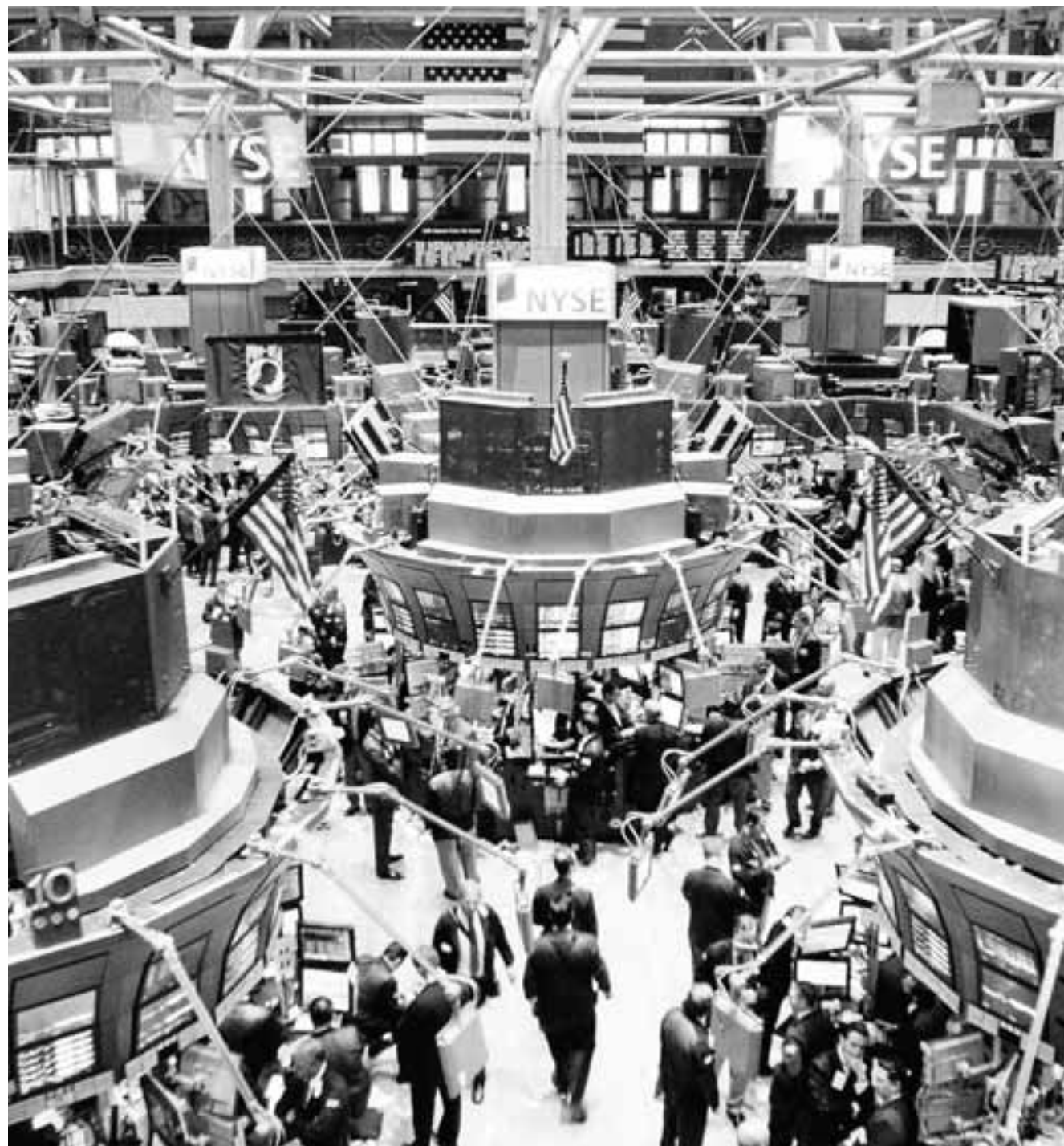
Οι εταιρείες παγκοσμίως επιχειρούν να ενισχύσουν τη ρευστότητα τους λόγω κρίσης και εκμεταλλεύονται το θετικό κλίμα στα χρηματιστήρια. Ενδεικτική περίπτωση ο δείκτης εταιρειών υψηλής τεχνολογίας Nasdaq, ο οποίος βρίσκεται σε διπλάσια επίπεδα από εκείνα του περασμένου Μαρτίου.

Καθοριστικό ρόλο έχει παίξει η θεαματική άνοδος που έχουν σημειώσει τα χρηματιστήρια μετά τη ραγδαία πτώση τους τον Μάρτιο του περασμένου έτους. Ενδεικτική περίπτωση ο δείκτης εταιρειών υψηλής τεχνολογίας Nasdaq, στον οποίο εντάσσονται πολλές αμερικανικές εταιρείες υψηλής τεχνολογίας, αλλά και εταιρείες υπηρεσιών υγείας, που σήμερα βρίσκεται σε διπλάσια επίπεδα από εκείνα του περασμένου Μαρτίου. Όπως χαρακτηριστικά υπογραμμίζει ο Τζεφ Τόμας, υψηλόβαθμο στέλεχος της εταιρείας που διαχειρίζεται τον Nasdaq, «όταν ρίχνεις τόσο χρήματα στο σύστημα, πρέπει να εισρεύσουν κάπου». Ο ίδιος αναφέρει ότι είτε πολλές εταιρείες να λένε «κοιτάξτε, ως επωφεληθούμε από τις υψηλές χρηματιστηριακές αξίες ώστε να αντλήσουμε κεφάλαια».