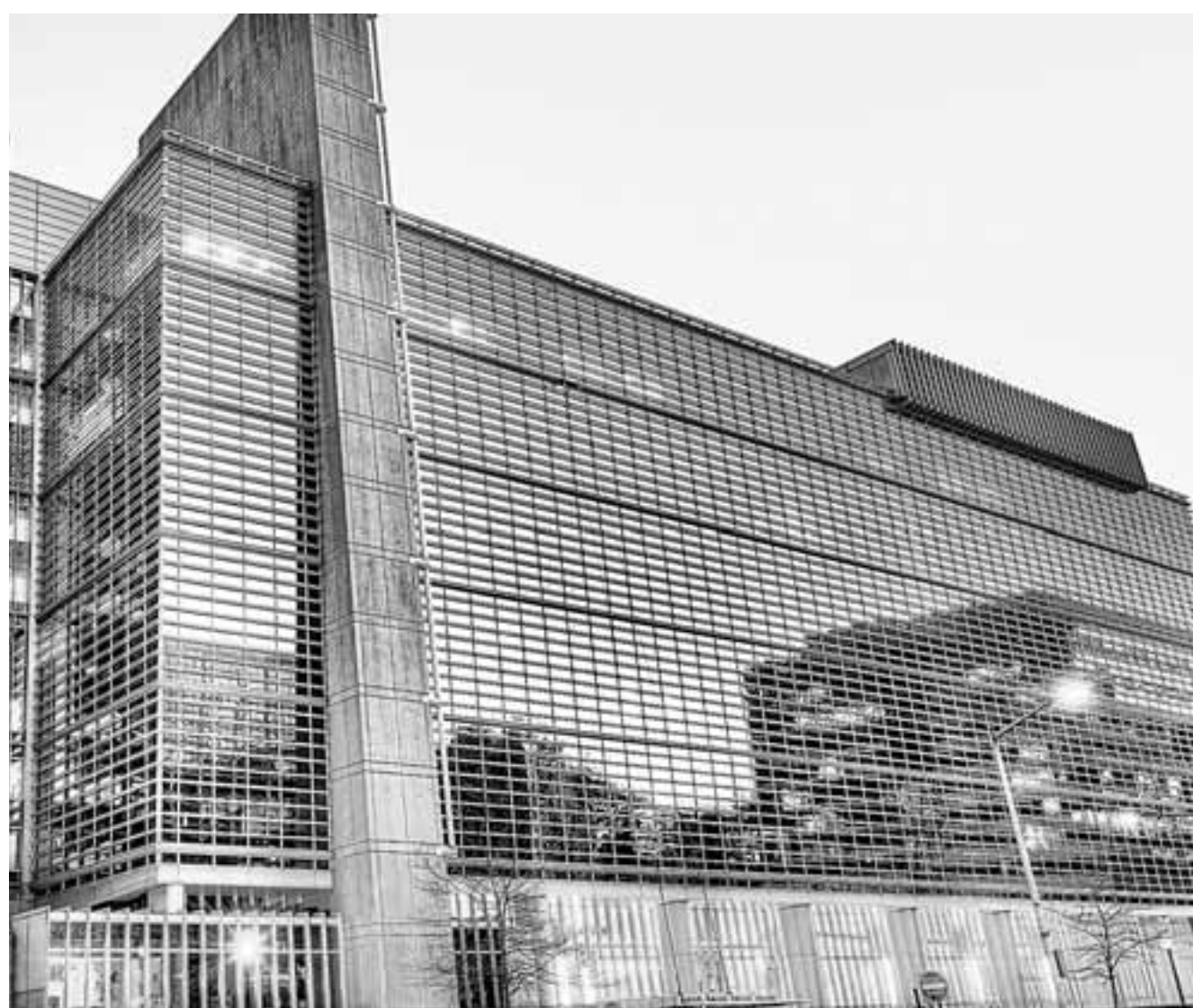
Σύμφωνα με την Παγκόσμια Τράπεζα, όλα δείχνουν πως θα χρειαστεί μεγαλύτερο χρονικό διάστημα για να αρχίσει η ανοδική πορεία της παγκόσμιας οικονομίας και, επιπροσθέτως, μάλλον δεν θα είναι τόσο στιβαρή η ανάκαμψη όσο είχε αρχικά εκτιμηθεί.

Ο δρόμος προς την ανάκαμψη φαίνεται όταν καταγράφει κανείς πόσες μεγάλες οικονομίες γνωρίζουν ήδη διπλή ύφεση, καθώς τα περιοριστικά μέτρα έχουν επιστρέψει και σε πολλές ηλικιακές ομάδες. Η Τζάφι υποστηρίζει ότι το να διασφαλίσει κάποιος ένα αντιστάθμισμα μεταξύ πάθους και αμοιβής γίνεται ολοένα και δυσκολότερο. Το να ανακαλύψετε ένα νόημα στην οικογένεια, στα κόμμι ή στον εθελοντισμό θα μπορούσε να είναι πιο ικανοποιητικό από το να το ψάχνετε στον χώρο εργασίας.