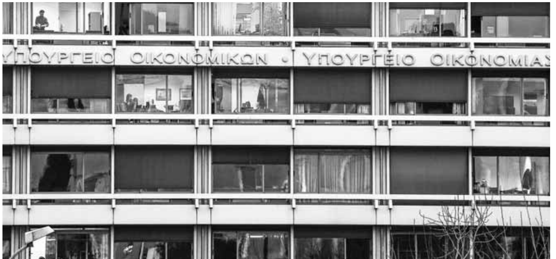
Με το click away και τον περιορισμό του μόνο στην Αττική και στις «κόκκινες» περιοχές, το κόστος υπολογίζεται από το οικονομικό επιτελείο σε περίπου 500 εκατ. ευρώ τον μήνα. Μόνο η Αττική κοστίζει 100 εκατ. ευρώ τον μήνα.

Η κυβέρνηση συντάζει τον προϋπολογισμό του 2021 με βάση σενάριο μερικού lockdown για το πρώτο τρίμηνο, δηλαδή με ανοικτό το λιανεμπόριο και κλειστή την εστίαση. Τον Απρίλιο θα άρχιζε το άνοιγμα. Στη βάση αυτή, ο προϋπολογισμός έχει ενσωματώσει ένα κόστος 1,5 δισ. ευρώ τον μήνα για τους τρεις πρώτους μήνες του έτους. Έτσι, αν έκλεινε εντελώς το λιανεμπόριο τώρα, το επιπλέον κόστος, εκτός προϋπολογισμού, θα ήταν 1,5 δισ. ευρώ τον μήνα. Αυτό δεν έγινε τελικά, περιορίζοντας κάπως τη ζημία. Αλλάωστε, τα στοιχεία που είχε στη διάθεσή του το οικονομικό επιτελείο, σύμφωνα με πηγή του, δείχνουν ότι το λιανεμπόριο δεν ενοχοποιείται ιδιαίτερα ως χώρος διάδοσης του ιού. Προηγούνται τα σουπερ μάρκετ, οι λαϊκές αγορές, τα μέσα μαζικής μεταφοράς και στη συνέχεια, στην τέταρτη