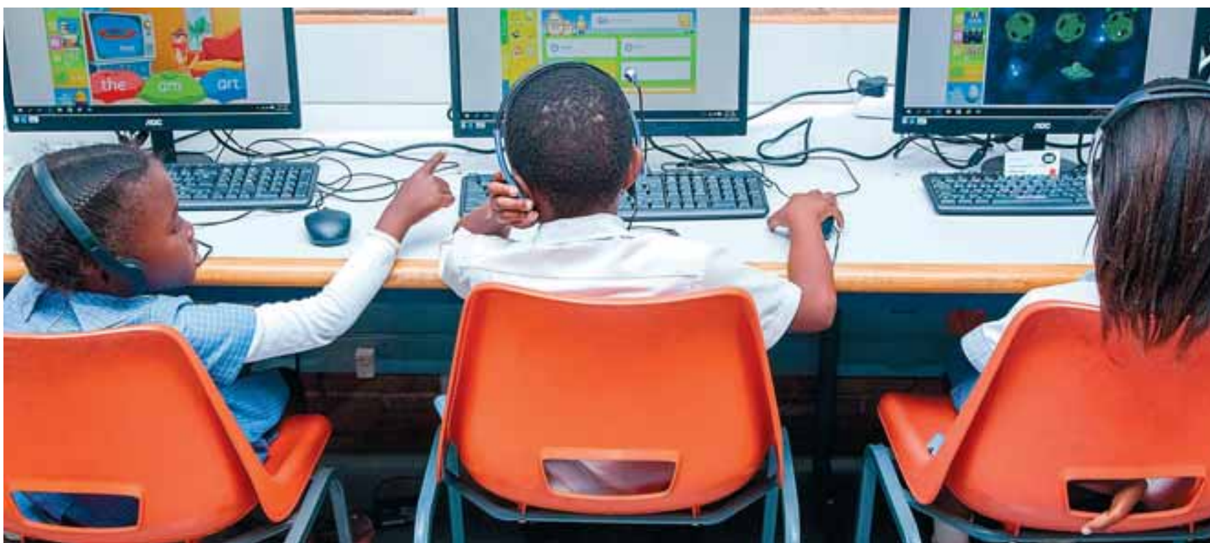
Τα δίκτυα Ιντερνετ που διαθέτει η Αφρική είναι υπερβολικά αργά και ακριβά αν θέλει κανείς να κάνει εντατική χρήση, όπως, για παράδειγμα για τις εφαρμογές βίντεο και τηλεδιάσκεψης.