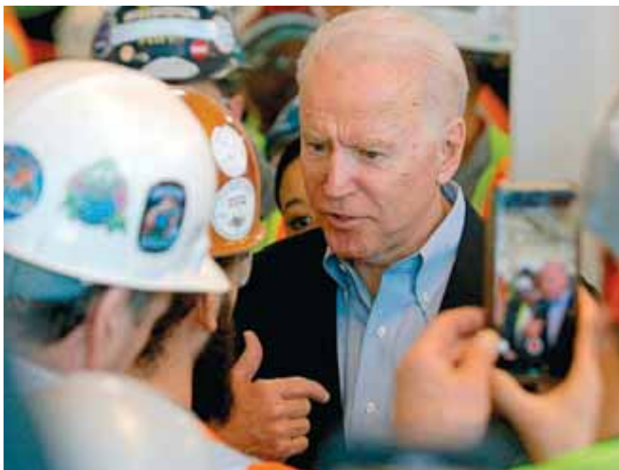
Σύμβουλοι και βοηθοί του Μπάιντεν πιστεύουν ότι οι επιταγές θα κοστίσουν τόσο πολύ, ώστε δεν θα μείνουν αρκετά χρήματα για να χρηματοδοτηθούν άλλες προτάσεις του νέου προέδρου.

Τόσο η Μπούσεϊ, που είναι μέλος των Οικονομικού Συμβουλίου του προέδρου όσο και ο Κάμιν, αναληρωτής διευθυντής του Εθνικού Οικονομικού Συμβουλίου, απέφυγαν να απαντήσουν σε σχετικές ερωτήσεις δημοσιογράφων. Στο μεταξύ, την Κυριακή μερίδα Ρεπουμπλικανών αντιπρότεινε πρόγραμμα επιταγών ύψους 600 δολαρίων που εμπεριέχει και ένα τμήμα επιταγών ύψους 1.000 δολαρίων αλλά με αυστηρά εισοδηματικά κριτήρια. Πρόκειται για πρόγραμμα που προϋπολογίζει δαπάνες μικρότερες και από το 1/3 των δαπανών που προβλέπει το πρόγραμμα Μπάιντεν. Μέχρι την Κυριακή οι Ρεπουμπλικανοί παρέμεναν ουσιαστικά αρνητικά διακείμενοι προς την ιδέα οποιουδήποτε νέου πακέτου στήριξης και επανέφεραν διαρκώς την πρόταση για πλαίσιο στήριξης ύψους 900 δισ. δολαρίων