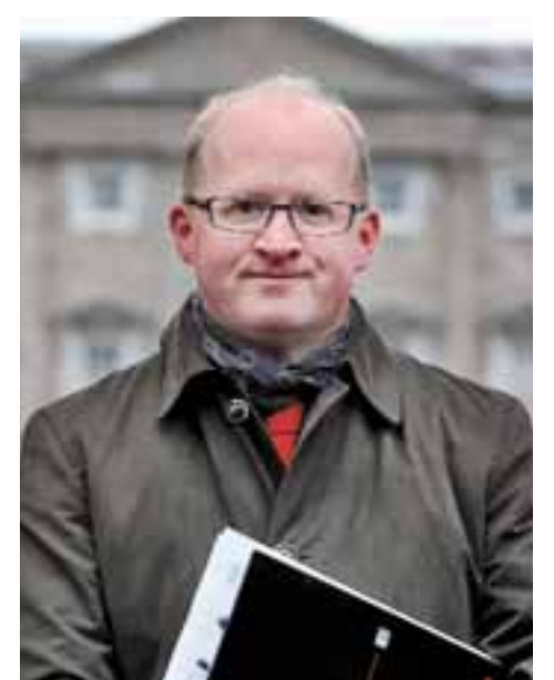
Την εκτίμηση για την Ελλάδα διατύπωσε ο επικεφαλής οικονομολόγος της ΕΚΤ Φίλιπ Λέιν.

«Η κατάσταση αυτή είναι προσωρινή», κατέληξε ο οικονομολόγος. «Ξέρουμε ότι οι βασικές επιπτώσεις της στην οικονομία θα διαρκέσουν το πολύ ένα με ενάμιση έτος ακόμη και ότι επομένως αυτά τα έκτακτα μέτρα που έχουν ληφθεί μπορούν να είναι βιώσιμα επειδή θα εφαρμοστούν μόνο για σχετικά σύντομη χρονική περίοδο σε σύγκριση με τον κανονικό οικονομικό ή δημοσιονομικό κύκλο».