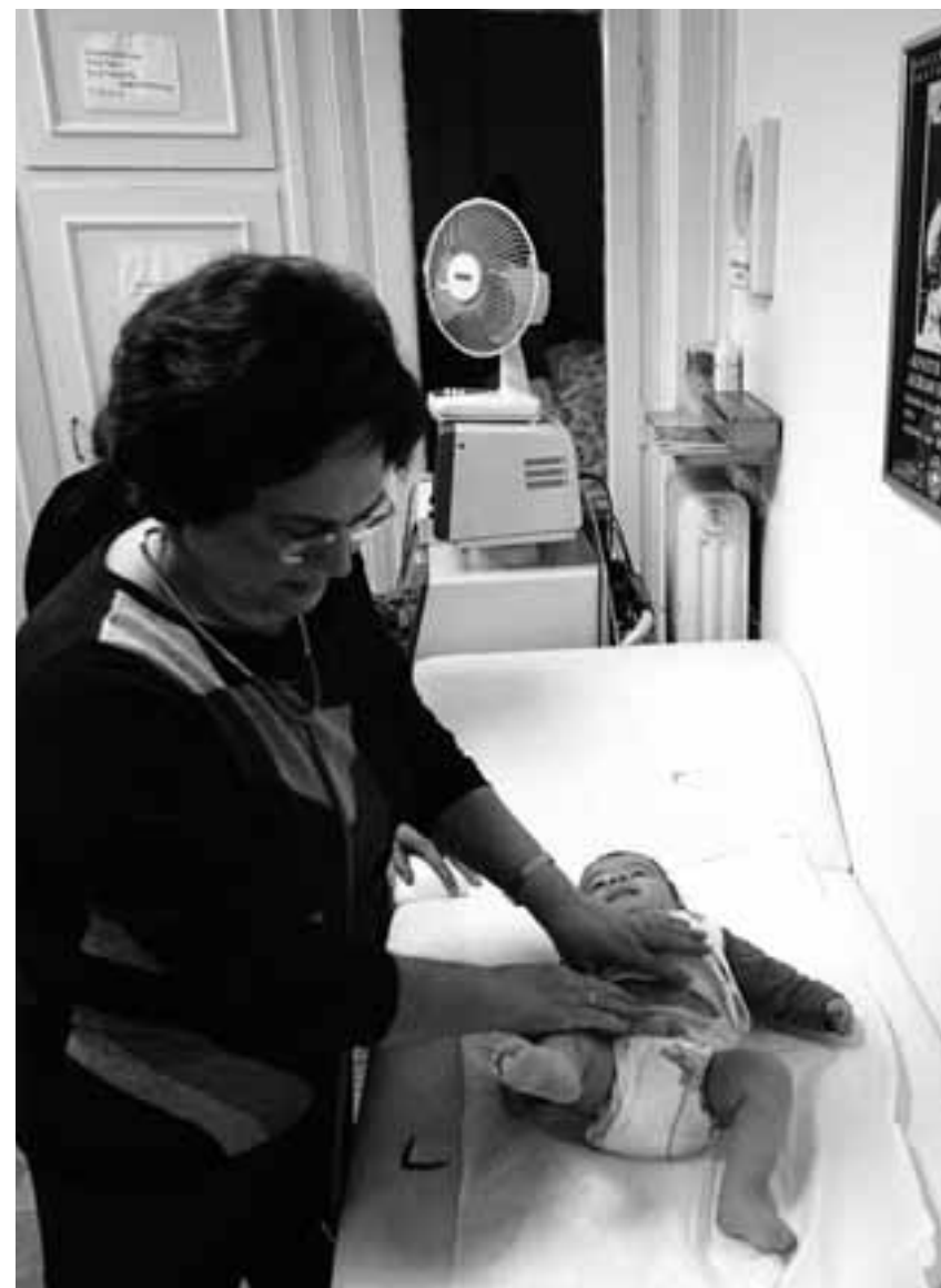
Ο αριθμός των θανάτων είναι κατά πολύ μεγαλύτερος από τις γεννήσεις για μία ακόμα χρονιά, με το χάσμα να διευρύνεται διαρκώς. Ετσι, το 2019 γεννήθηκαν 83.628 παιδιά, αλλά παράλληλα 124.101 άνθρωποι έχασαν τη ζωή τους.

1η Ιανουαρίου 2020 εκτιμάται ότι ήταν 10.718.565 άτομα, εκ των οποίων 5.215.488 άνδρες και 5.503.077 γυναίκες. Αντίστοιχα ένα χρόνο νωρίτερα, την 1η Ιανουαρίου 2019, ο μόνιμος πληθυσμός ήταν 10.724.599 άτομα.