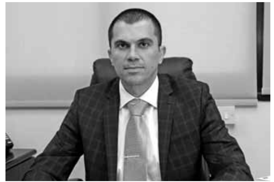
Ότι κατά διάνοια δεν θα φτάσουμε φέτος τους αριθμούς του 2019. Αυτό, όπως εκτιμά ο Υφυπουργός, θα χρειαστεί άλλα τρία με τέσσερα χρόνια για να επανέλθουμε σε αυτά που ξέραμε τουλάχιστον όσον αφορά τους αριθμούς.

Την ίδια ώρα, πληροφορίες στην «Κ» κάνουν λόγο για θετικές εξελίξεις στον τουρισμό από τον Ιούλιο και μετά, με ενδείξεις που επιτρέπουν να γίνεται λόγος μέχρι και για πληρότητες 70% σε ορισμένες περιπτώσεις κατά τους μήνες της τουριστικής αιχμής. Σύμφωνα με τους ξενοδόχους, ουσιαστική τουριστική κινητικότητα αναμένεται από τον Ιούνιο, ενώ υπάρχουν καλές ενδείξεις για τον Ιούλιο. Όλα αυτά υπό την αίρεση των εξελίξεων των επιδημιολογικών δεδομένων.