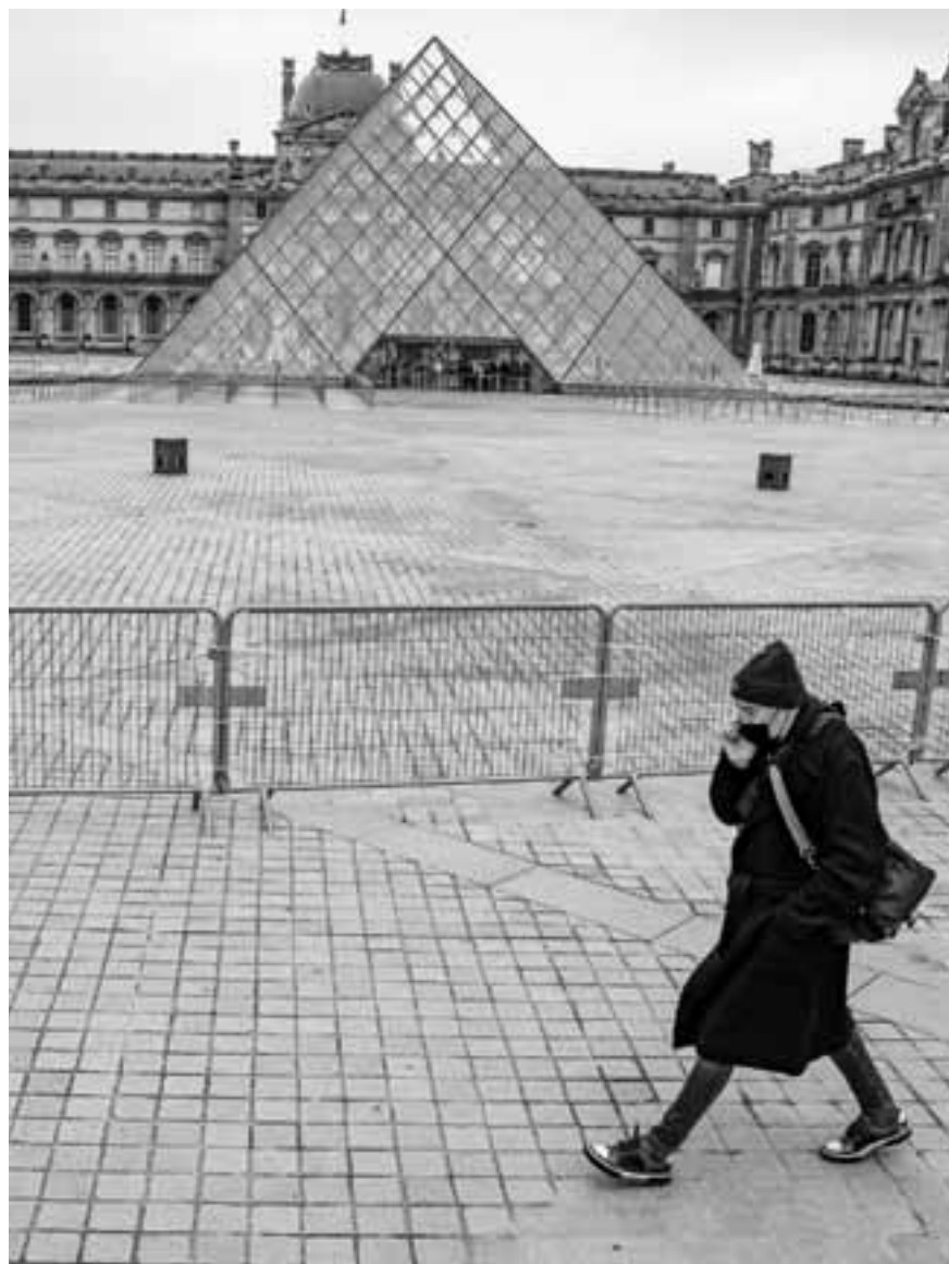
Μεταλλικές μπάρες αποτρέπουν την πρόσβαση πεζών στην πυραμίδα του Λούβρου, ωστόσο εντός του μουσείου γίνονται σημαντικά έργα συντήρησης, με ορίζοντα ολοκλήρωσής τους τα τέλη Φεβρουαρίου.

Στο μεταξύ, μικρός στρατός 250 τεχνιτών, συντηρητών και μελετητών εργάζεται πυρετωδώς πέντε ημέρες την εβδομάδα –αντί της μιας ημέρας (Τρίτη) που το Λούβρο παρέμεινε κλειστό– για την ολοκλήρωση σημαντικών έργων συντήρησης, με ορίζοντα ολοκλήρωσής τους τα τέλη