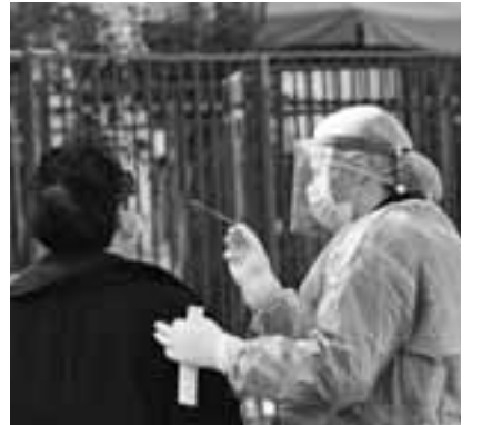
Διαρκών rapid tests σε εκπαιδευτικούς και μαθητές πραγματοποιήθηκαν χθες έξω από το Γενικό Λύκειο Ναυπλίου.

Στελέχη του υπουργείου Παιδείας ανέφεραν στην «Κ» ότι οι εκπαιδευτικοί προτιμούν και τους άλλους φορείς που οργανώνουν τεστ – πλν του υπ. Παιδείας σε συνεργασία με τον ΕΟΔΥ, φυσικά – διότι τα τεστ του υπ. Παιδείας οργανώνονται μεταξύ 2.30 μ.μ. και 4.30