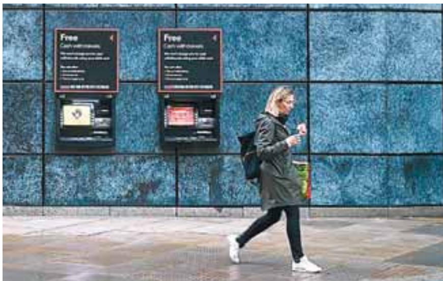
Συνολικά, οι επιπλέον αποταμιεύσεις του 2020-2021 σε σχέση με τα επίπεδα των αποταμιεύσεων του 2019 θα αγγίζουν τα 680 δισ. ευρώ.

Αυτό το ποσό είναι κατά 260 δισ. ευρώ χαμηλότερο από αυτό του 2020, με τη μείωση αυτή να αντιπροσωπεύει περίπου το μισό της ανάπτυξης του ΑΕΠ που αναμένεται για το 2021 στην Ευρωζώνη (4,3%), ενώ η αύξηση που θα σημειωθεί στη ζήτηση, λόγω της πτώσης των αποταμιεύ-