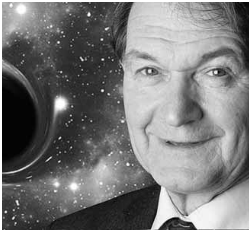
Ο Ρότζερ Πένρουζ ανέδειξε ότι στο εσωτερικό των μελανών οπών παύουν να ισχύουν οι νόμοι της φυσικής όπως τους ξέρουμε.

Η ενασχόλησή του με τις μαύρες τρύπες συνεχίστηκε μετά το 1965 σε συνεργασία με τον Στίβεν Χόκινγκ και, το 1970, κατέληξαν στο ιδιαίτερα γνωστό θεώρημα για τις ιδιομορφίες που φέρει και το ονόματά τους (Hawking and Penrose Singularity Theorem). Το θεώρημα αυτό προσδιορίζει τις συνθήκες ύπαρξης των ιδιομορφιών εφόσον ισχύει η γενική θεωρία της σχετικότητας του Αϊνστάιν. Παρά τη στενή συνεργασία τους, οι Χόκινγκ και Πένρουζ είχαν πολλές διαφορές στο πώς έβλεπαν το σύμπαν, όπως για παράδειγμα στο ζήτημα της απόλυτης πληροφοριών μέσα σε μαύρες τρύπες. Η κοσμολογική θεωρία του Πένρουζ – το ΑΕΟΝ όπως το ονομάζει – βασίζεται στην