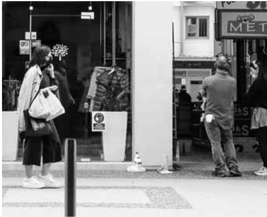
Τα «λουκέτα» θα προκαλέσουν ανακατατάξεις στην αγορά εργασίας: ένα μέρος των αυτοαπασχολούμενων και των εργοδοτών θα περάσει στην κατηγορία της μισθωτής εργασίας και ένα μέρος θα περάσει στη «μαύρη» οικονομία.

37,79 δισ. ευρώ το αντίστοιχο τρίμηνο του 2019. Τα τρία δισ. είναι έτσι κι αλλιώς σημαντικό ποσό, αλλά εάν αφαιρέσει κάποιος από τη ζυγαριά τον κλάδο των τροφίμων και ειδικά τον κλάδο των σουπερ μάρκετ που είδε τις πωλήσεις του να αυξάνονται περίπου 10% την προηγούμενη χρονιά, προκύπτει ότι η ζημία σε δεκάδες χιλιάδες επιχειρήσεις του υπόλοιπου λιανεμπορίου είναι αρκετά μεγαλύτερη, πάνω από 4 δισ. ευρώ. Επιπλέον, στα στοιχεία αυτά δεν συμπεριλαμβάνεται το κρίσιμο τέταρτο τρίμηνο του 2020, το οποίο παραδοσιακά συμβάλλει κατά 27% στον τζίρο του λιανεμπορίου καθώς περιλαμβάνει την περίοδο των Χριστουγέννων, τις ενδιάμεσες χειμερινές εκπτώσεις και την Black Friday. Μια ένδειξη για τις απώλειες μάς δίνουν τα στοιχεία της ΕΛΣΤΑΤ που φτάνουν μέχρι τον Νοέμβριο του 2020 και