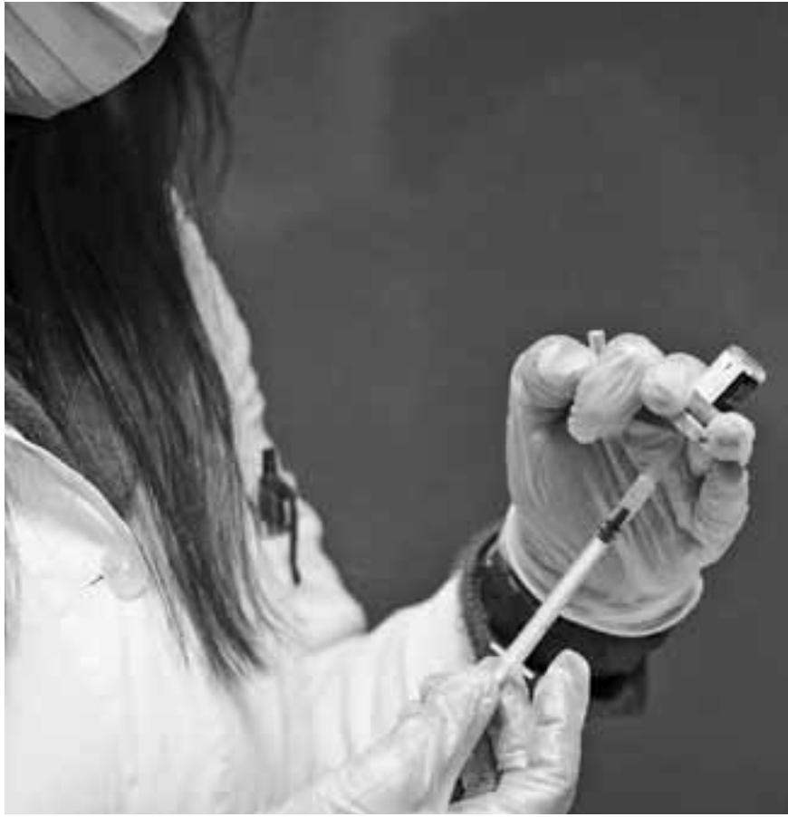
Εως χθες το μεσημέρι, σύμφωνα με πηγές του υπουργείου Υγείας, είχαν διενεργηθεί περίπου 93.000 εμβολιασμοί εργαζομένων στο ΕΣΥ και σε ιδιωτικές κλινικές.

Για «δυσάρεστη έκπληξη» έκανε λόγο η πρόεδρος της Εθνικής Επιτροπής Εμβολιασμών Μαρία Θεοδωρίδου, με αφορμή το νοσοκομείο της Πάτρας, η ο-