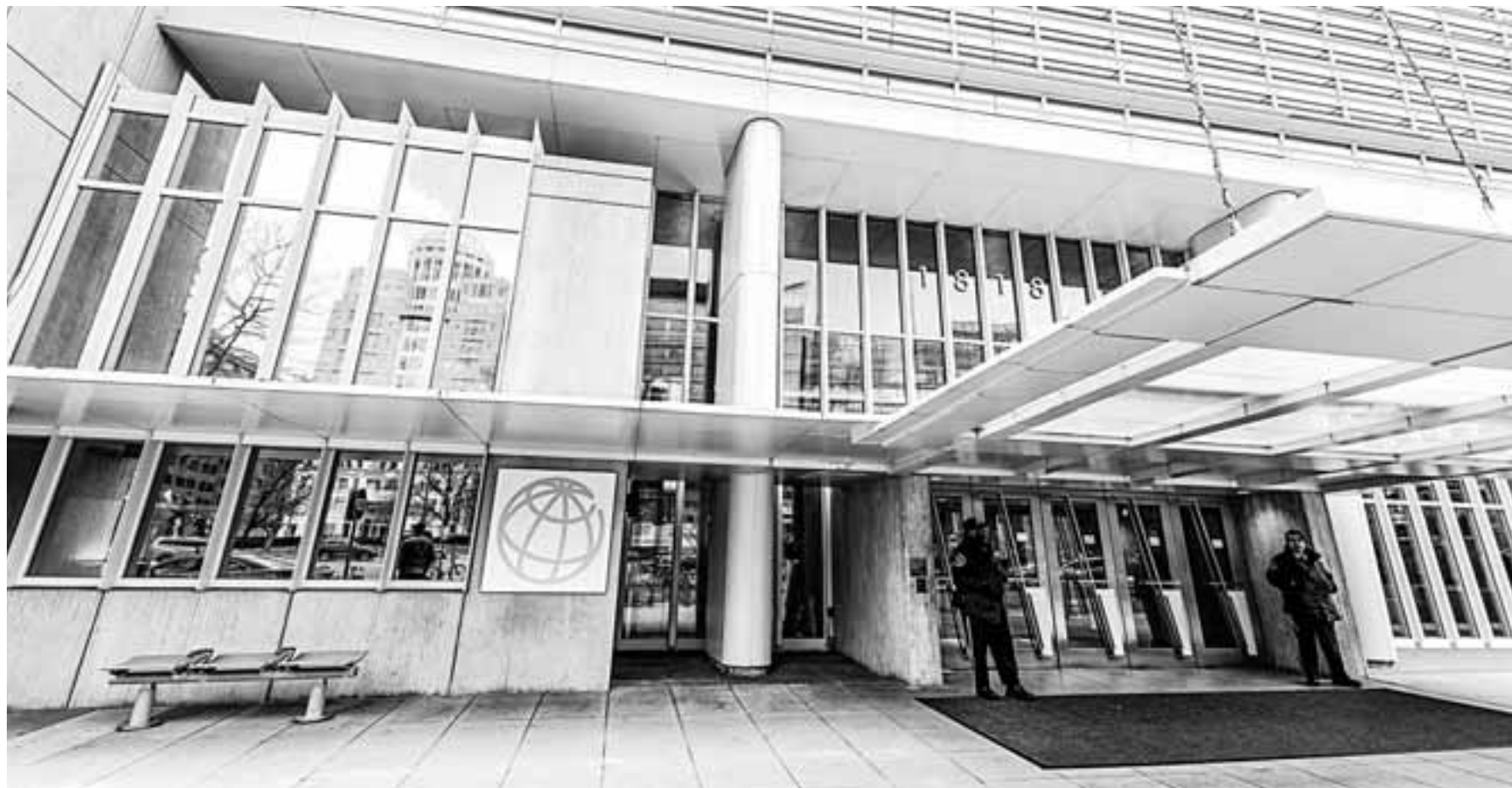
Η Παγκόσμια Τράπεζα εκφράζει φόβους πως οι νεκροζώντανες επιχειρήσεις ενδέχεται να συντελέσουν στο να υπάρξει μία «χαμένη δεκαετία» στασιμότητας.

Μιλώντας στην αμερικανική εφημερίδα, ο Καρλ Μπλντ, πρώην πρωθυπουργός της Σουηδίας και συμποροδρόνων στο Ευρωπαϊκό Συμβούλιο Εξωτερικών Υποθέσεων, τονίζει πως «πρέπει κάποια ημέρα να ξεφορτωθούμε ορισμένες από αυτές τις επιδοτήσεις, διαφορετικά θα καταλήξουμε να έχουμε μια νεκροζώντανη οικονομία». Στη διάρκεια του περασμένου έτους οι πτωχεύσεις μειώθηκαν κατά 40% στη Γαλλία και στη Βρετανία και στο σύνολο της Ε.Ε. κατά 25%. Σύμφωνα με το Εθνικό Γραφείο Οικονομικών Ερευνών των ΗΠΑ, ανεξάρτητο ιδιωτικό οργανισμό,