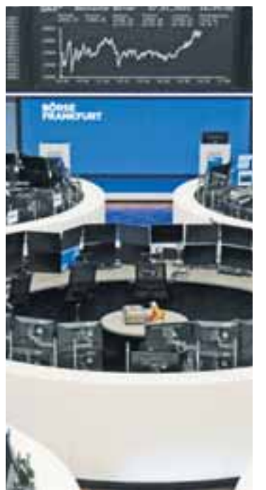
Χθες , ο δείκτης Xetra DAX της Φρανκφούρτης σημείωσε τη μεγαλύτερη άνοδο και έκλεισε με κέρδη 1,56%.

Σε ό,τι αφορά τους εθνικούς δείκτες, τη μεγαλύτερη άνοδο σημείωσε χθες ο δείκτης Xetra DAX της Φρανκφούρτης, που έκλεισε με κέρδη 1,56% αλλά και ο CAC 40 του Παρισιού που έκλεισε με κέρδη 1,16%. Με μικρά κέρδη 0,78% έκλεισε, άλλωστε, και ο δείκτης FTSE 100 του Λονδίνου.