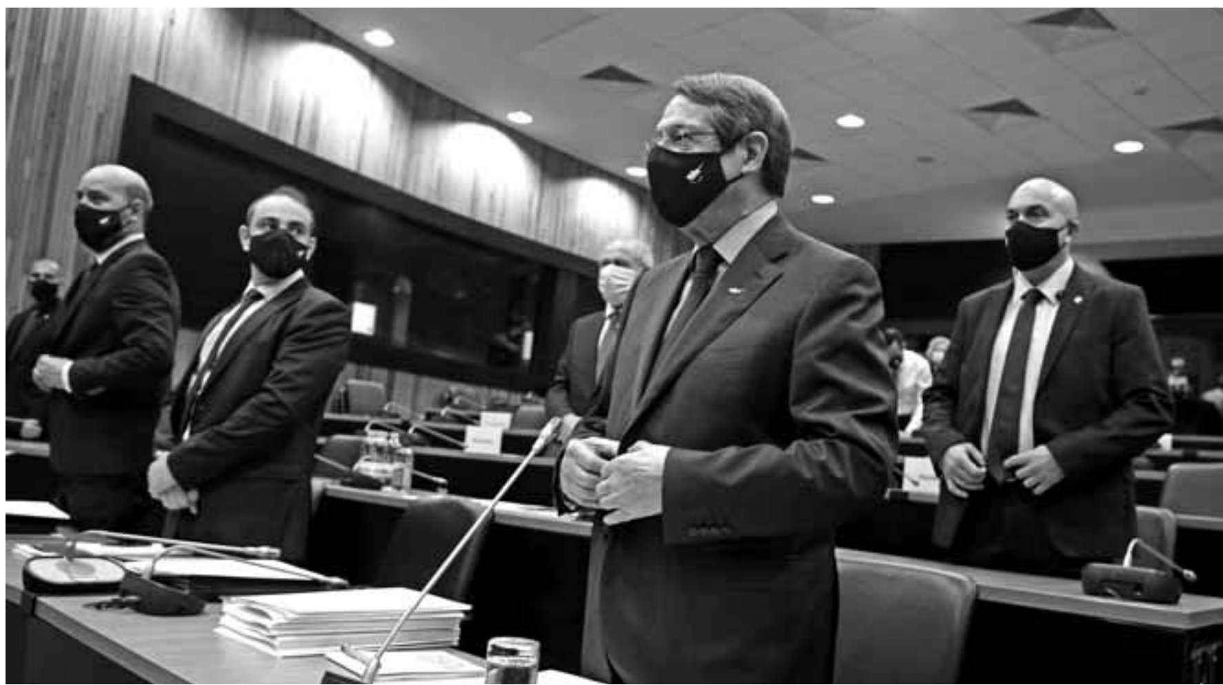
Η παρούσα του Προέδρου της Δημοκρατίας στην Ερευνητική Επιτροπή ήταν διάρκειας 2 ωρών. Ο Νίκος Αναστασιάδης στην κατάθεσή του δεν απέρριψε τις αθυανιές του προγράμματος κάτι που έκανε για τα περί ευνοϊκής μεταχείρισης κάποιων επενδυτών.

ΝΑ: Ουδέποτε υπήρξε δικηγόρος του συγκεκριμένου επιχειρηματία. Από τα έγγραφα του ΥΠΟΙΚ, αντί του ελαχίστου