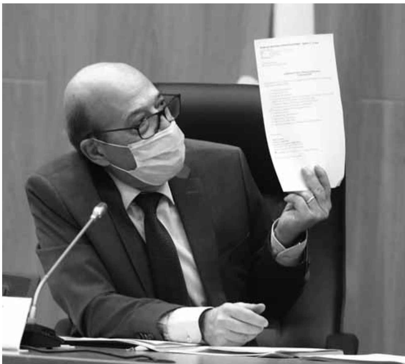
Ο Πρόεδρος της Βουλής Αδάμος Αδάμου θεωρεί την λίστα πρόχειρη αλλά μονόδρομο τη δημοσιοποίησή της.

πάρει δηλαδή δάνεια με ευνοϊκούς όρους, αναδιάρθρωσαν δάνεια με ευνοϊκούς όρους ή είχαν διαγραφές δανείων.