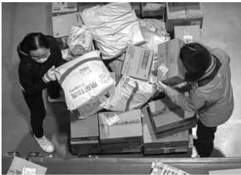
Φέτος, η Κίνα αναμένεται να γίνει η πρώτη χώρα στην ιστορία όπου πραγματοποιούνται περισσότερες πωλήσεις μέσω από τα ψηφιακά κανάλια παρά από τα φυσικά καταστήματα.