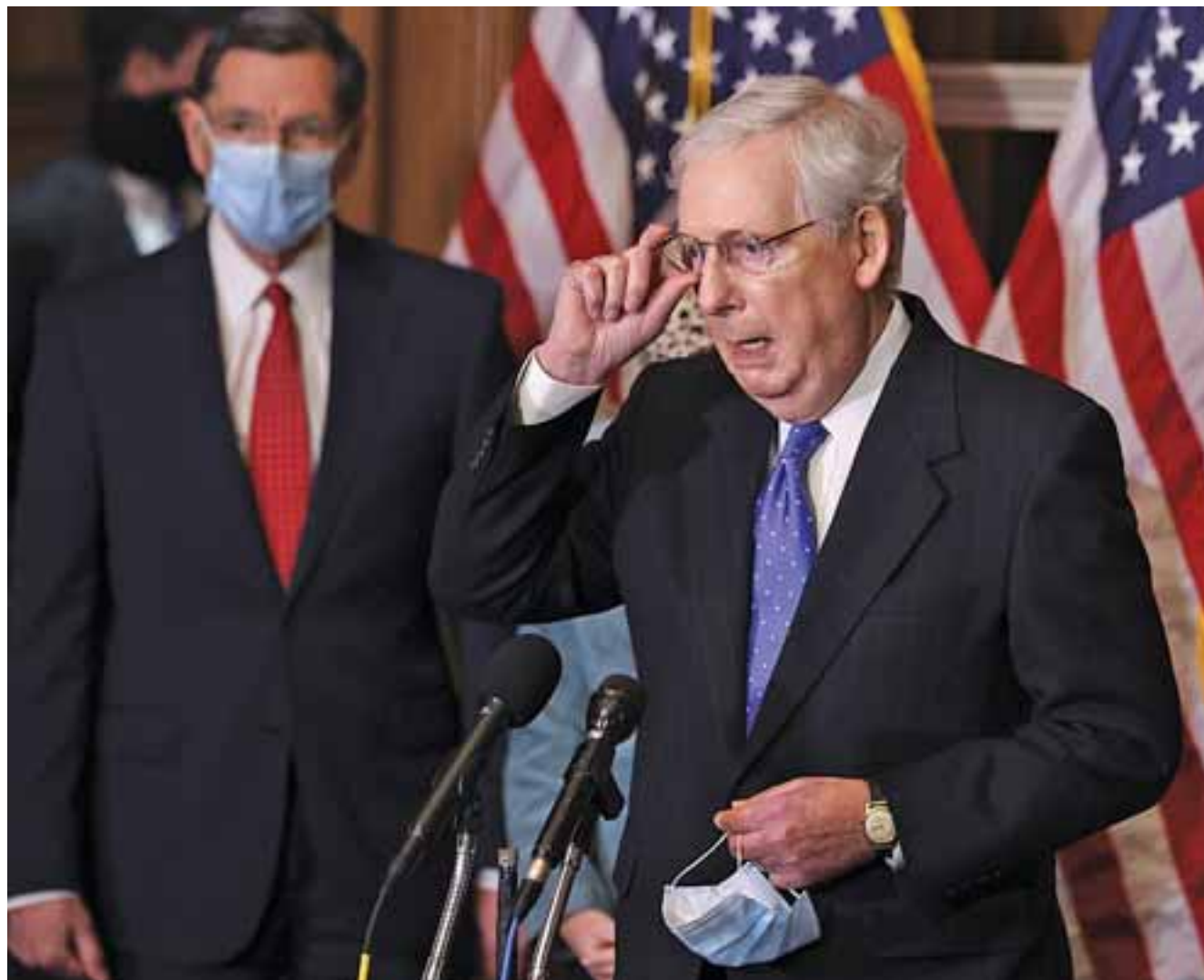
Ο ηγετής των Ρεπουμπλικανών στη Γερουσία, Μιτς Μακόνελ, υποκρίθηκε στη βασική του αξίωση εναντίον των Δημοκρατικών για δέσμευση ότι δεν θα καταργήσουν τη διαδικασία του «φιλιμπάστερ».

Πάντως, η αποχώρηση του 45ου προέδρου από τον Λευκό Οίκο φαίνεται ότι δυσκολεύει τη συγκρότηση ενός νομικού επιτελείου πρώτης γραμμής για την υπεράσπιση του. Στην περσινη δίκα του για την ουκρανική υπόθεση, ο Τραμπ είχε στο πλευρό του ορισμένα από τα μεγαλύτερα αστέρια του νομικού κόσμου, όπως τον σύμβουλο του Λευκού Οίκου Πάτ Σιπόλντε, τον Κεν Στάρ, ο οποίος είχε αναλάβει το ανακριτικό έργο στην παραπομπή του προέδρου Μπιλ Κλίντον, και τον Άλαν Ντέρσοβιτς, ειδικό του Συνταγματικού Δικαίου, που υπερασπίστηκε τον άσο του αμερικανικού φουτμπού Ο. Τζ. Σίμσον στην πολυκροτη δίκα του. Αυτή τη φορά, επικεφαλής των δικηγόρων του Τραμπ θα είναι ο Μπάτς Μπάουερς, ένας νομικός