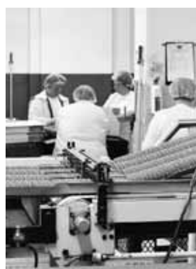
Ο δείκτης παραγωγής στη μεταποίηση σημείωσε υψηλό 10 μηνών τον Νοέμβριο.

Σύμφωνα με τους αναλυτές της τράπεζας, το αποτέλεσμα αυτό έδωσε ένα βαθμό ερμηνεύεται από τη σχετικά καλή επίδοση των εξαγωγών εμπορευμάτων. Παρόμοια πορεία, επισημαίνεται, ακολούθησε και ο δείκτης παραγωγής στη μεταποίηση, όπου τον Νοέμβριο σημειώθηκε υψηλό 10 μηνών. Οι αναλυτές σημειώνουν ότι λόγω της παράτασης του δεύτερου lockdown, σε σχέση με τον αρχικό προγραμματισμό, αλλά και της υψηλής συνεισφοράς των πετρελαιοειδών στην αύξηση της συνολικής παραγωγής στη βιομηχανία, τον Νοέμβριο, δεν αποκλείεται να καταγραφεί διόρθωση στα στοιχεία του Δεκεμβρίου 2020. Από την άλλη πλευρά, ωστόσο, το μερικό και βραχυβίο άνοιγμα της αγοράς, υπό τη μορφή παράδοσης/παραλαβής εκτός καταστήματος (click away) μπορεί να είχε θετική επίδραση στα επίπεδα παραγωγής. Ένα πρόσθετο θετικό στοιχείο, το οποίο επισημαίνουν οι αναλυτές, αναφορικά