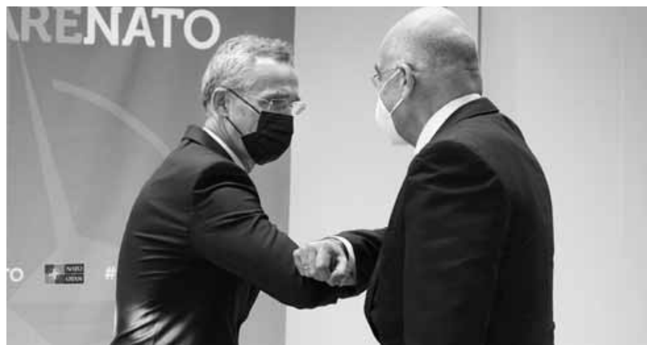
«Είμαι χαρούμενος που βλέπω ότι οι εντάσεις έχουν υποχωρήσει σημαντικά από τότε που επισκέφθηκα την Αθήνα και την Αγκυρα, τον περασμένο Οκτώβριο», ανέφερε ο γ.γ. του ΝΑΤΟ Γ. Στόλτενμπεργκ, που είχε συνάντηση με τον υπουργό Εξωτερικών Ν. Δένδια.

Μιλώντας για την κατάσταση στη Λιβύη, ο κ. Στόλτενμπεργκ τόνισε ότι η Συμμαχία παρακολουθεί πολύ στενά τις εξελίξεις και στηρίζει την πρόοδο που έχει επιτευχθεί στο πλαίσιο του Διευκρινιστικού Διαλόγου υπό την αιγίδα του ΟΗΕ. Ευχαρίστησε, τέλος, την Ελλάδα για τις σημαντικές συνεισφορές της στο ΝΑΤΟ, μεταξύ άλλων στις επιχειρήσεις στο Αφγανιστάν και στο Κό-