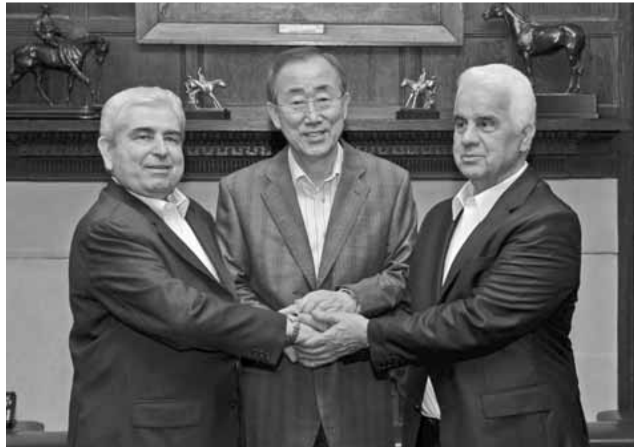
• Δεν είναι να σου σπκνέται η τρίχα;