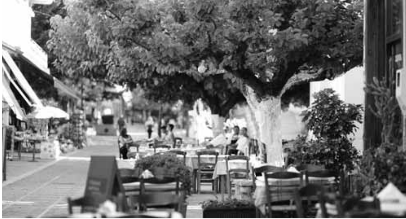
Δρομολογείται η επιδότηση «πάγιων δαπανών» επιχειρήσεων που είδαν τον τζίρο τους να μειώνεται και ήταν ζημιωμένες το 2020.

Η σταδιακή απόσυρση των μέτρων στήριξης, ωστόσο, που υπολογίζεται –κορωνοϊού επιτρέποντος– περίπου από τον Απρίλιο, ανησυχεί το οικονομικό επιτελείο, που δεν θα ήθελε να βρεθεί αντιμετώπιση με φαινόμενα μαζικών «λουκέτων» και ένα νέο κύμα ανέργων. Φόβοι που εντοπίζονται κυρίως στους τομείς του λιανικού και βελτίωσης του τουρισμού, όχι τόσο της βιομηχανίας, όπως διαμνύουν στελέχη του. Για το 2021, εξάλλου, ο στόχος