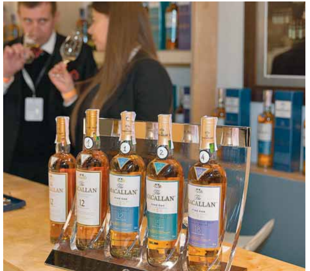
Ένα Macallan παλαιότητας 25 ετών, πριν από οκτώ χρόνια, πωλείτο προς 900 δολάρια. Σήμερα, όμως, το ίδιο μπουκάλι δεν πρόκειται να το βρείτε με λιγότερα από 2.000 δολάρια.

Και βέβαια, η αγορά των αυθεντικών σκωτσέζικων ουίσκι δεν είναι η μοναδική που γνωρίζει τέτοια ιλιγγιώδη άνοδο. Σχεδόν από την αρχή του εκκοσμού πρώτου αιώνα και των περισσότερων ετών που έχουν παρέλθει έκτοτε, κυριολεκτικά εκτοξεύονται οι τιμές ουσιαστικά όλων των παλαιωμένων αλκοολικών ποτών. Έτσι, ακόμη και ορισμένα επενδυτικά ταμεία που εντάσσονται στο χαρτοφυλάκιό τους τέτοιες