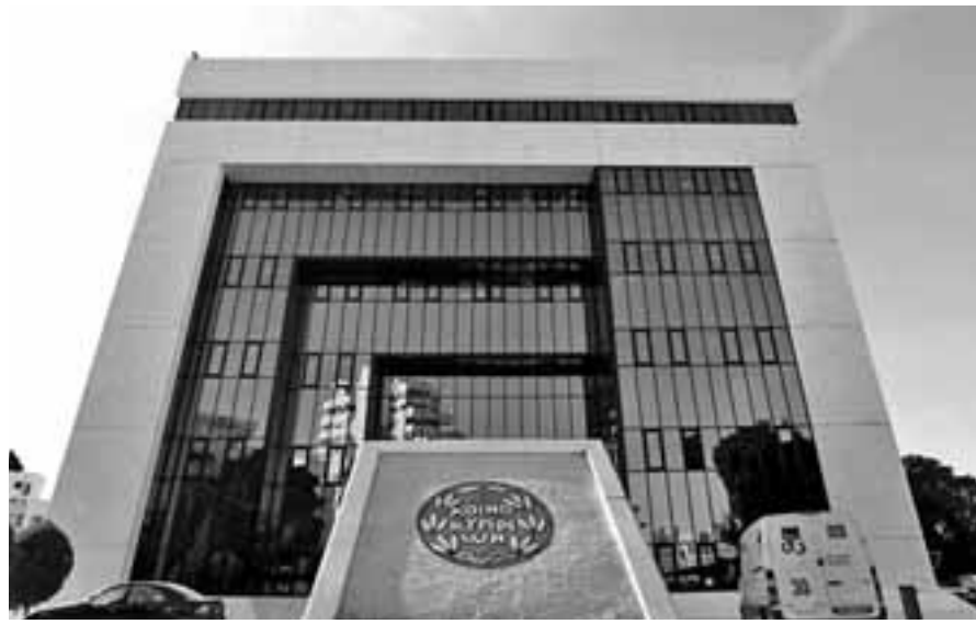
Το να πουλάς δάνεια σε τέτοια περίοδο χρειάζεται ικανότητα. Και την Pimco.