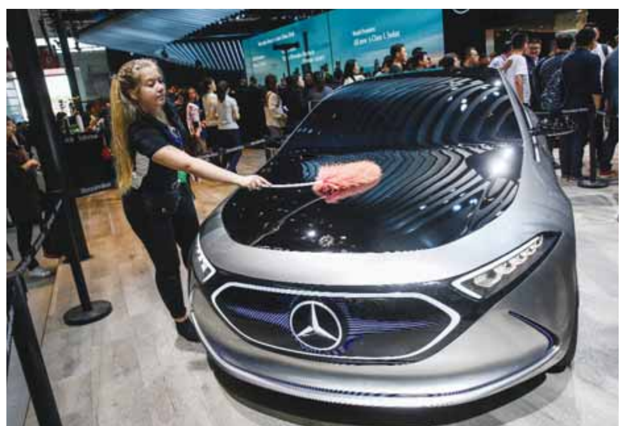
Κατά την εκτίμηση αναλυτών, η κερδοφορία των εν λόγω αμαζιγών πρώτης γενιάς θα παραμείνει χαμηλή, έως ότου η Mercedes κατορθώσει να αναπτύξει υποσυστήματα ειδικά για ηλεκτρικά οχήματα και οι τιμές των μπαταριών υποχωρήσουν.

Η Mercedes, ειδικότερα, τροποποίησε τα βασικά χαρακτηριστικά του μοντέλου GLA crossover, ώστε να περιορίσει την εμπροσθοβαρή επένδυση και να εξοικονομήσει χρόνο εν συγκρίσει με το πόσον καιρό θα απαιτούσε η δημιουργία ενός ηλεκτροκίνητου οχήματος εντέλει από την αρχή. Πρόκειται για μία διευθέτηση αντιστάθμισης δαπανών και χρόνου, η οποία συνήθως αποβαίνει εις βάρος της αυτόκρειας και της εξοικονομησης στο