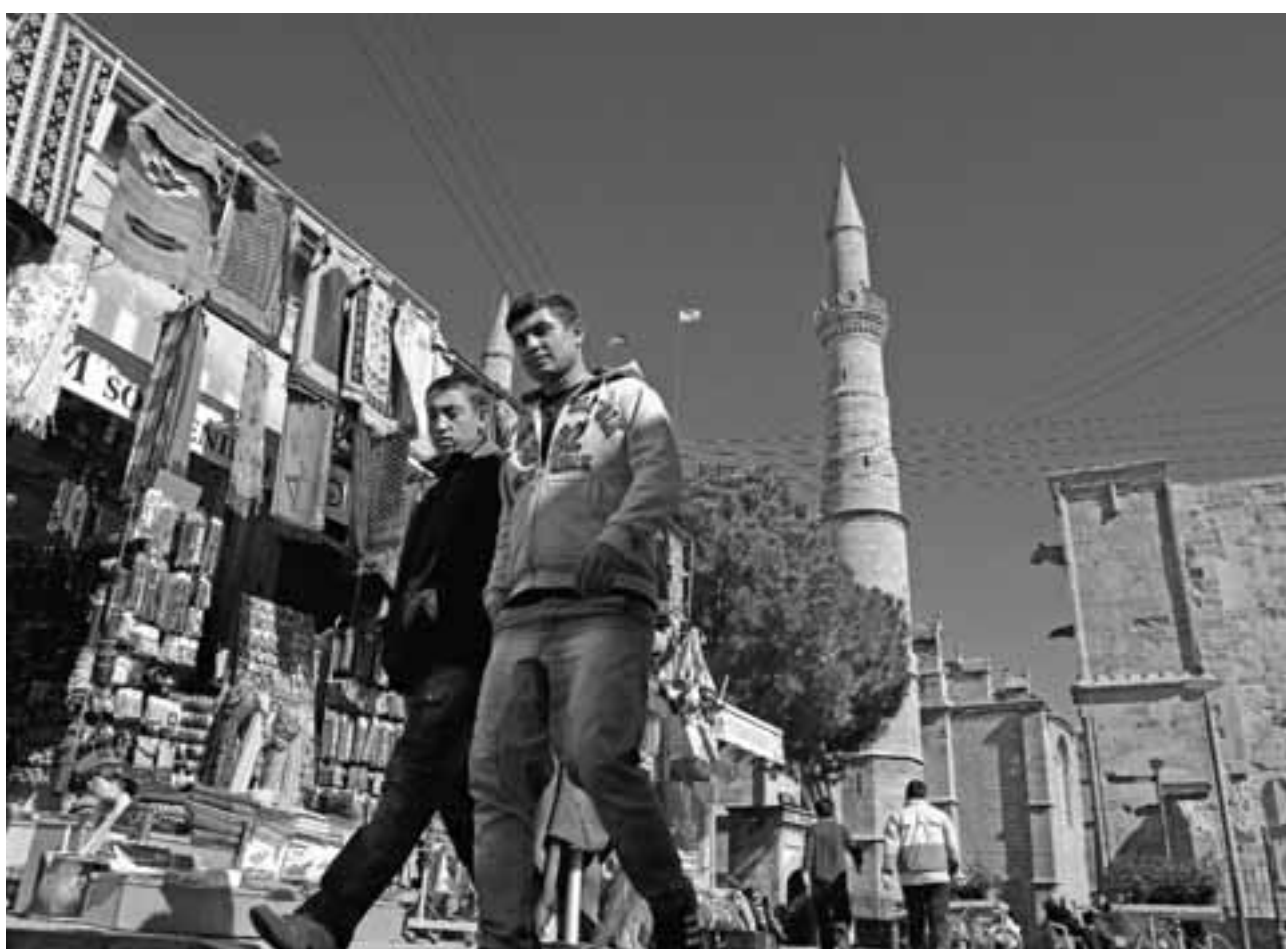
Η Λευκωσία βρίσκεται στην πρώτη θέση της λίστας των κατεχομένων επαρχιών της Κύπρου με τα περισσότερα σε ημερήσια βάση κρούσματα του κορωνοϊού και ακολουθεί η Κερύνεια.

Την αγανάκτηση του κ. Κοσέ και των Τ/κ ιατρών, επιστημόνων και νοσηλευτών συμμαρύνει ο Αλί Πιλλί, ο οποίος τις τελευταίες ώρες, στις δημόσιες παρεμ-