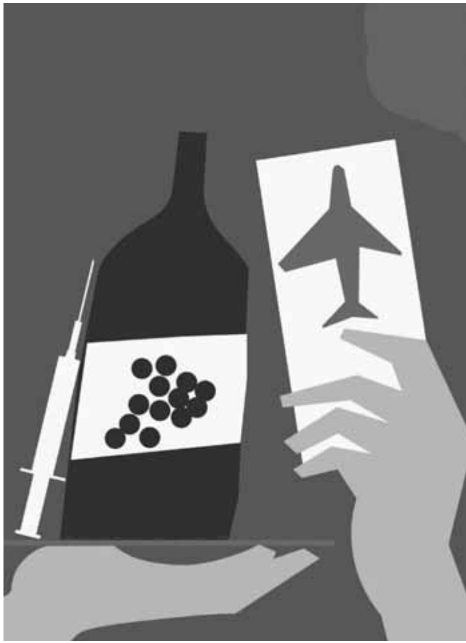
Βρετανική εταιρεία πολυτελών ταξιδιών θα αρχίσει να πωλεί έναντι 11.260 ευρώ τη δυνατότητα εμβολιασμού στα Ηνωμένα Αραβικά Εμιράτα.

Όσο ευχάριστη και αν είναι η έλευση των εμβολίων όσοι για οποιονδήποτε λόγο έχουν την τύχη να εμβολιαστούν πρώτοι οφείλουν να αποφεύγουν την άφρονα συμπεριφορά και να αυτοπεριοριστούν μέχρι να συγκεντρωθούν περισσότερα στοιχεία σχετικά με την ανοσία έναντι του κορωνοϊού και την αύξηση του ποσοστού του πληθυσμού που έχει εμβολιαστεί. Μόνο έτσι θα αποτραπούν τα χειρότερα σενάρια.