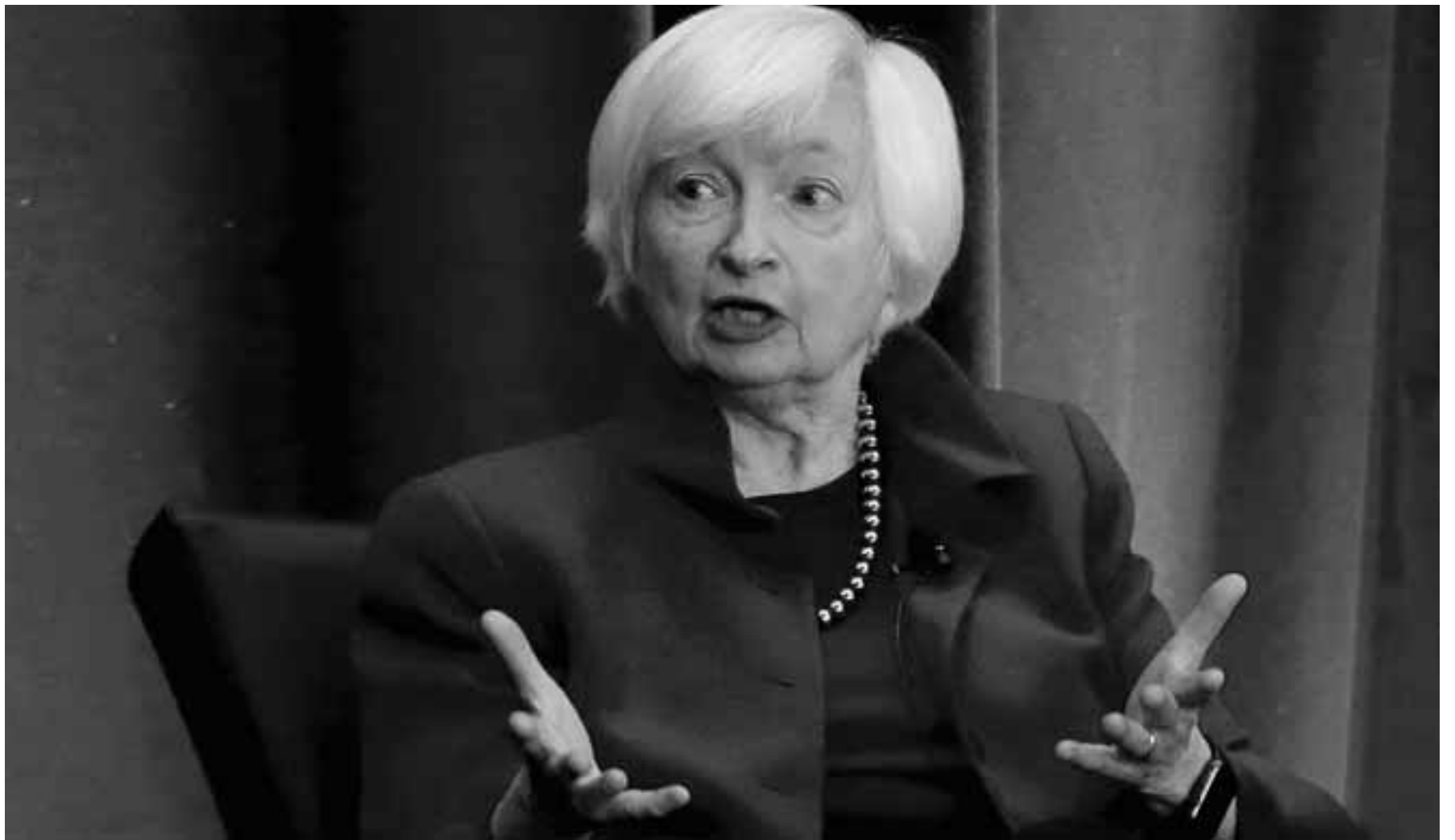
Η κ. Γέλεν αντέκρουσε τις επικρίσεις των Ρεπουμπλικανών κατά του προγράμματος Μπάιντεν, πως η αύξηση των εταιρικών φόρων στο 28% από το υφιστάμενο 21% θα υποβαθμίσει την ανταγωνιστικότητα των αμερικανικών επιχειρήσεων.

Σε ό,τι αφορά την πολιτική της ομοσπονδιακής τράπεζας των ΗΠΑ, της οποίας σημειωτέον διετέλεσε πρόεδρος επί προεδρίας Μπαράκ Ομπάμα, η κ. Γέλεν υπογραμμίζει πως δεν προτίθεται να ασκήσει πιέσεις για να επηρεάσει το εύρος του προγράμματος αγοράς ομολόγων. Το θέμα έχει προκαλέσει έντονη ανησυχία μεταξύ οικονομολόγων και πολιτικών, δεδομένης της κλίμακας και του αντικτύπου που έχει το επίμαχο πρόγραμμα της Federal Reserve. Τονίζει, μάλιστα, ότι αντιλαμβάνεται «για ποιο λόγο είναι τόσο σημαντικό να δια-