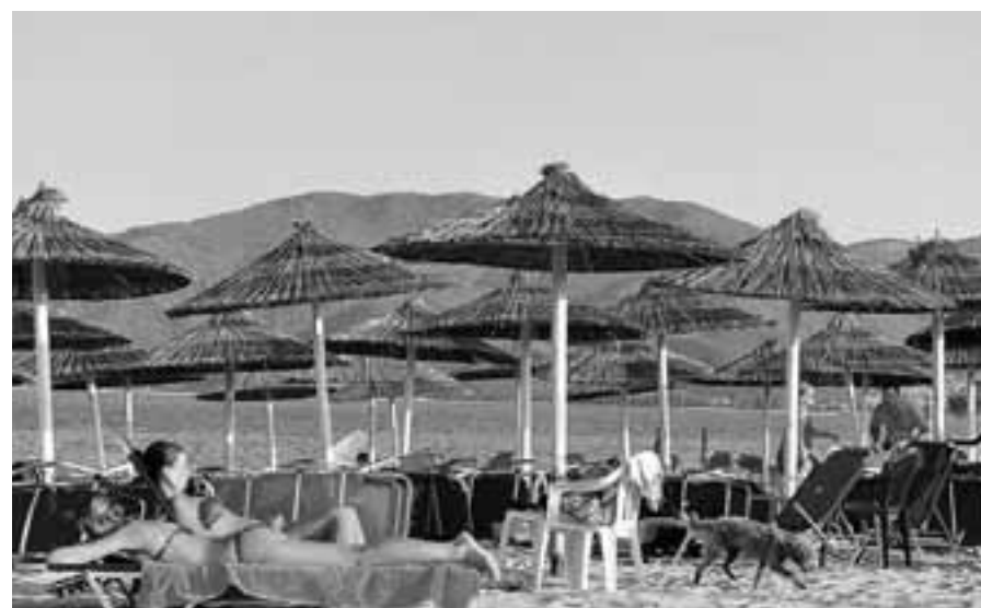
Η εισερχόμενη ταξιδιωτική κίνηση μειώθηκε κατά 76,3% και διαμορφώθηκε στα 7,278 εκατ. ταξιδιώτες, έναντι 30,656 εκατ. την αντίστοιχη περίοδο του 2019.

Στο ενδεκάμηνο οι ταξιδιωτικές εισπράξεις από τη Γερμανία, τη μεγαλύτερη αγορά για τον ελληνικό τουρισμό μαζί με τη βρετανική, μειώθηκαν κατά 61,4% και διαμορφώθηκαν σε 1,132 δισ., ενώ οι εισπράξεις από τη Γαλλία παρουσίασαν πτώση