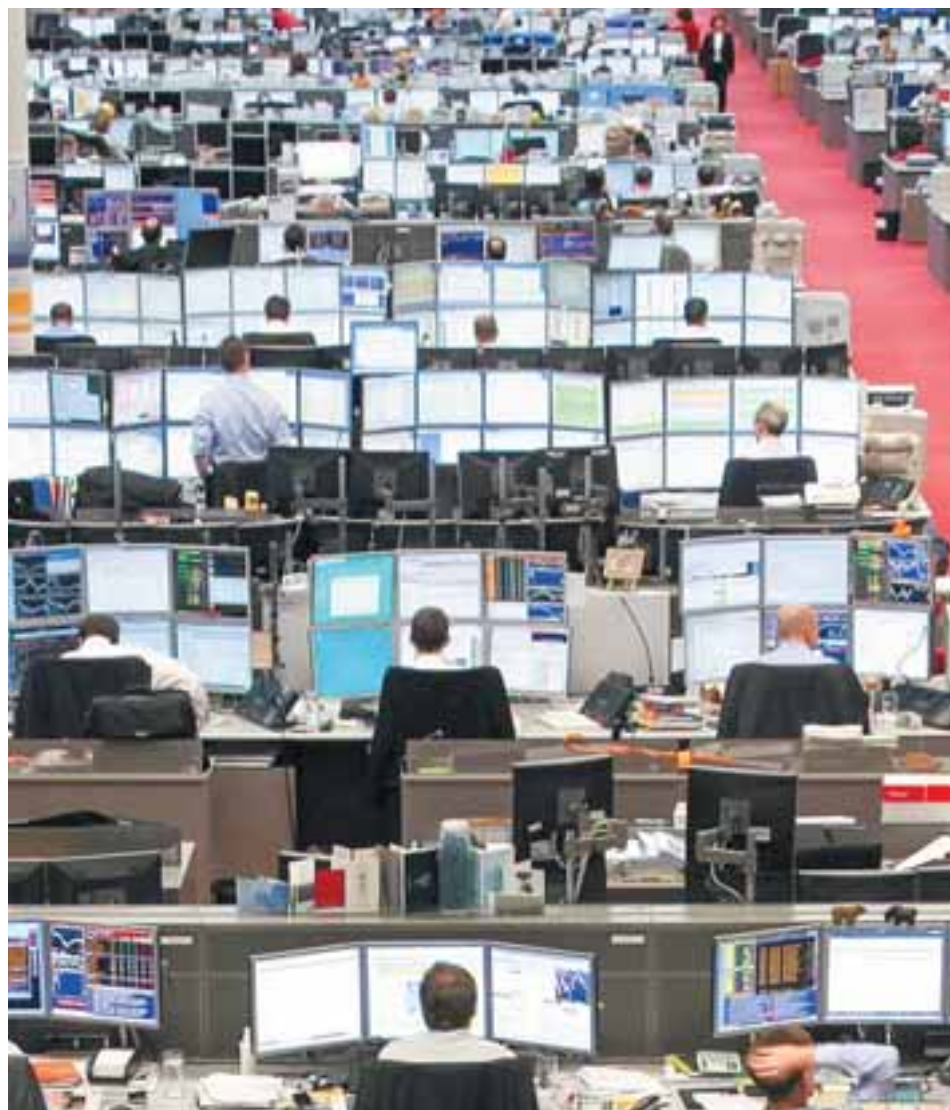
Οι αναλυτές εκτιμούν ότι ο ΟΔΔΗΧ στην επόμενη κίνησή του θα επιλέξει την «ασφάλεια» ενός νέου 10ετούς ομολόγου.

Από τον περασμένο Δεκέμβριο ο ΟΔΔΗΧ λειτουργεί έτσι σαν... broker, ανταλλάσσοντας και μεταφέροντας μεταξύ των ελληνικών τραπεζών ελληνικά ομόλογα διαφόρων διάρκειών, με βάση το ομόλογο 30ετούς διάρκειας (λήξης 2050) που εκδόθηκε τον Φεβρουάριο του 2020 με στόχο το swap τίτλων με την Εθνική Τράπεζα. Έτσι και την προηγούμενη εβδομάδα το ελληνικό Δημόσιο προχώρησε σε ανταλλαγή ομολόγων με τις δύο συστημικές τράπεζες, Πειραιώς και Εθνική, με το re-opening του 30ετούς ομολόγου καθώς και με το «άνοιγμα»