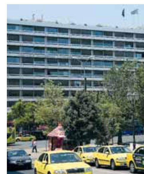
Οι δαπάνες του κρατικού προϋπολογισμού για την περίοδο Ιανουαρίου - Δεκεμβρίου 2020 ανήλθαν στα 70,169 δισ.