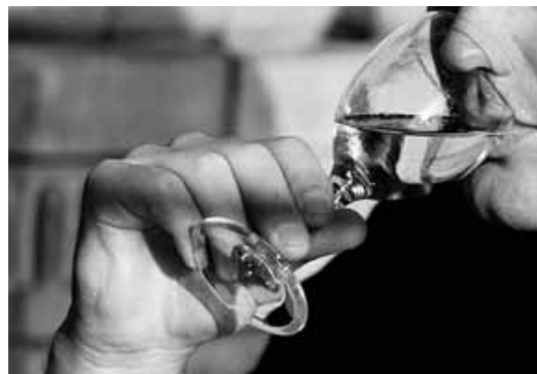
Κατά μέσον όρο, το 32,8% παγκοσμίως δήλωσε ότι μετάνιωσε που ήπιε σε τέτοιο βαθμό, με τους Αγγλους να είναι οι λιγότερο μετανωμένοι.