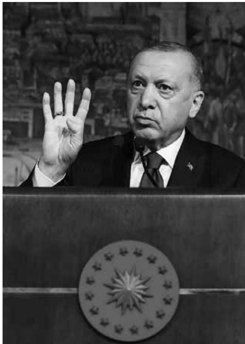
Σύμφωνα με έρευνα της τουρκικής εταιρείας δημοσκοπήσεων KONDA, τα ποσοστά της κυβερνητικής συμμαχίας του AKP του Ταγίπ Ερντογάν με το MHP αγγίζουν το 49,6%.

Πάντως, στον τουρκικό Τύπο θεωρούν θετικό βήμα την πραγματοποίηση των διερευνητικών επαφών. Η Cumhuriyet αναφέρει πως «οι δύο χώρες που έχουν σχέσεις έντασης αποφάσισαν να συνεχίσουν τις επαφές. Επιστροφή στο τραπέζι του διαλόγου από εκεί που είχαν μείνει». Η Hurriyet σχολιάζει πως «η πα-