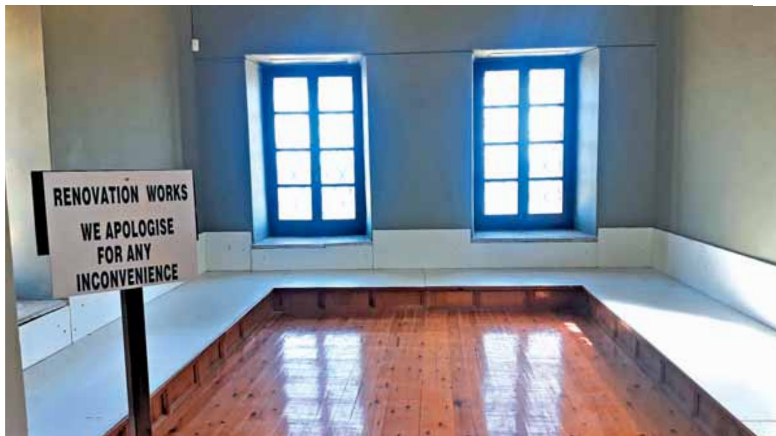
Στόχος του Υπουργείου είναι το Μουσείο Λάρνακας να προσελκύει περισσότερους επισκέπτες και σίγουρα περισσότερους από 3.500 που δεχόταν πριν κλείσει.

«Πλέον θα είναι στα χέρια των τοπικών αρχών να στηρίξουν τα μουσεία», και όπως τόνισε ο κ. υπουργός: «Ο στόχος είναι όταν ανοίξουν τα μουσεία σε μία κανονική τουριστική περίοδο να μην έχουμε 3.500 χιλιάδες επισκέπτες στη Λάρνακα και 5.000