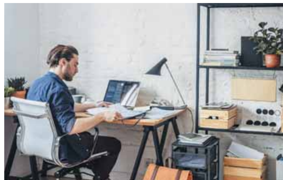
Χιλιάδες εργαζόμενοι στη Γερμανία εκφοβίζονται εδώ και εβδομάδες σε μέσα κοινωνικής δικτύωσης, αξιώνοντας να κατοχυρωθεί νομικά η τηλεργασία.

Στη Σκωτία η εξ αποστάσεως εργασία ορίστηκε ως υποχρεωτική προ ημερών, ενώ στην Πορτογαλία ισχύει από την περασμένη εβδομάδα ο υποχρεωτικός χαρακτήρας, «όπου αυτό είναι δυνατόν», χωρίς να απαιτείται προηγούμενος σχετική συμφωνία εργαζομένων και εργοδοτών, όπως αναφέρει η Deutsche Welle. Στην Ολλανδία και βάσει νόμου του 2016 για τις ευέλικτες μορφές εργασίας, ήδη προτού ξεσπάσει η πανδημία, πολλοί είχαν μπει σε καθεστώς τηλεργασίας. Ωστόσο, δεν είναι υποχρεωτική, εφόσον ο εργοδότης μπορεί να την απορρίψει, αρκεί να το αιτιολογήσει γραπτώς. Παρά ταύτα το ποσοστό των εργαζομένων εξ αποστάσεως είναι συγκριτικά υψηλό. Στην αρχή της πανδημίας το 45%-56% των εργαζομένων στην Ολλανδία είχε μεταθέσει τον χώρο εργασίας του στο σπίτι. Ακόμη και το καλοκαίρι το ποσοστό βρισκόταν στο 35%.