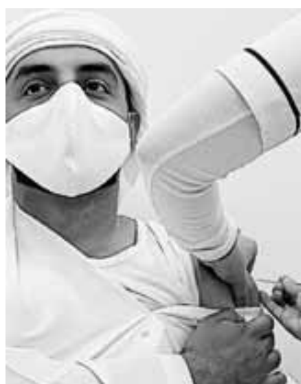
Εμβολιασμός στο Ντουμπάι, όπου πάνω από 2 εκατ. κάτοικοι έχουν ήδη λάβει την πρώτη δόση.

Τέσσερα εστιατόρια στο Ντουμπάι προσφέρουν εκπτώσεις σε όσους κατοίκους έχουν εμβολιαστεί κατά του κορωνοϊού. Τα εστιατόρια «Publique, Reform Social, Grill και Ultra Brasserie», του ομίλου Gates Hospitality, ανακοίνωσαν πως κάτοικοι του εμιράτου θα λάβουν 10% έκπτωση στον λογαριασμό τους αν έχουν ήδη κάνει την πρώτη δόση του εμβολίου και 20% αν έχουν κάνει και τις δύο. Για να τύχουν της έκπτωσης, οι πελάτες θα πρέπει να επιδεικνύουν αποδεικτικό ότι εμβολιάστηκαν. Στην πρωτοβουλία αυτή εντάχθηκε και το «Bistro des Arts», του ίδιου ομίλου. Με το μήνυμα «Σκορπίστε αγάπη, όχι κορωνοϊό», η προσφορά έχει αναρτηθεί στις σελίδες των εστιατορίων στο Instagram, προκαλώντας ποικίλες αντιδράσεις από τους πολίτες και τους χρήστες των μέσων κοινωνικής δικτύωσης. «Η απόφασή μας είναι να συμπαραστήσουμε στις Αρχές Υγείας του Ντουμπάι στις προσπάθειές τους να καταπολεμήσουν την πανδημία και να ενθαρρύνουμε τους