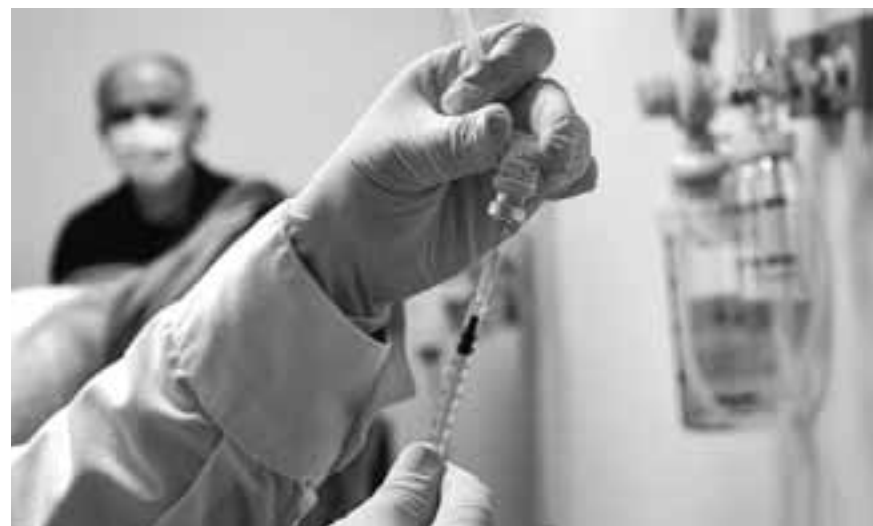
Μέχρι σήμερα, έχουν εμβολιαστεί πάνω από 10 εκατομμύρια άνθρωποι στον πλανήτη, χωρίς να παρουσιάσουν σοβαρές παρενέργειες.

– Ναι, σε σημαντικό αριθμό ανθρώπων και με τη σωστή μεθοδολογία του placebo που κάνουμε για όλα τα φάρμακα. Για να σου φύγει κάθε ενδοιασμός ως προς την