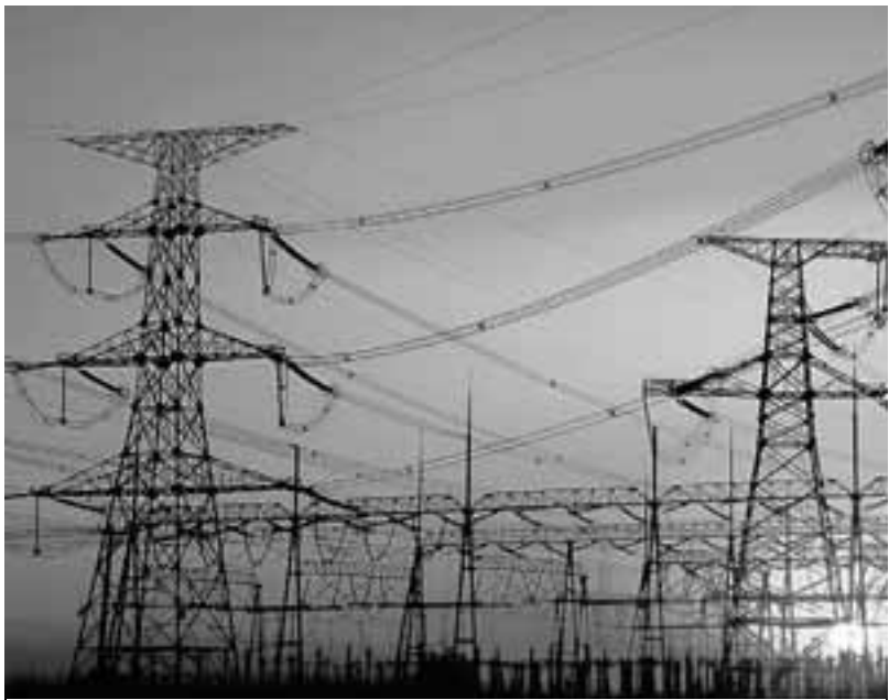
Η ενίσχυση της κατανάλωσης ηλεκτρικής ενέργειας ήταν αποτέλεσμα της απότομης πτώσης της θερμοκρασίας και της αύξησης των εξαγωγών προς τις αγορές της Δυτικής Ευρώπης.

Ευρώπης, όπου οι τιμές διαμορφώθηκαν σε υψηλότερα επίπεδα από τις τιμές στο ελληνικό σύστημα. Στον αντίποδα, στη συγκράτηση των τιμών στην ελληνική αγορά συνέβαλαν τα υψηλά επίπεδα παραγωγής τόσο των μονάδων ΑΠΕ όσο και των υδροηλεκτρικών. Η εγχώρια εβδομαδιαία ζήτηση ηλεκτρισμού ξεπέρασε την 1 TWh, με το ωριαίο φορτίο να