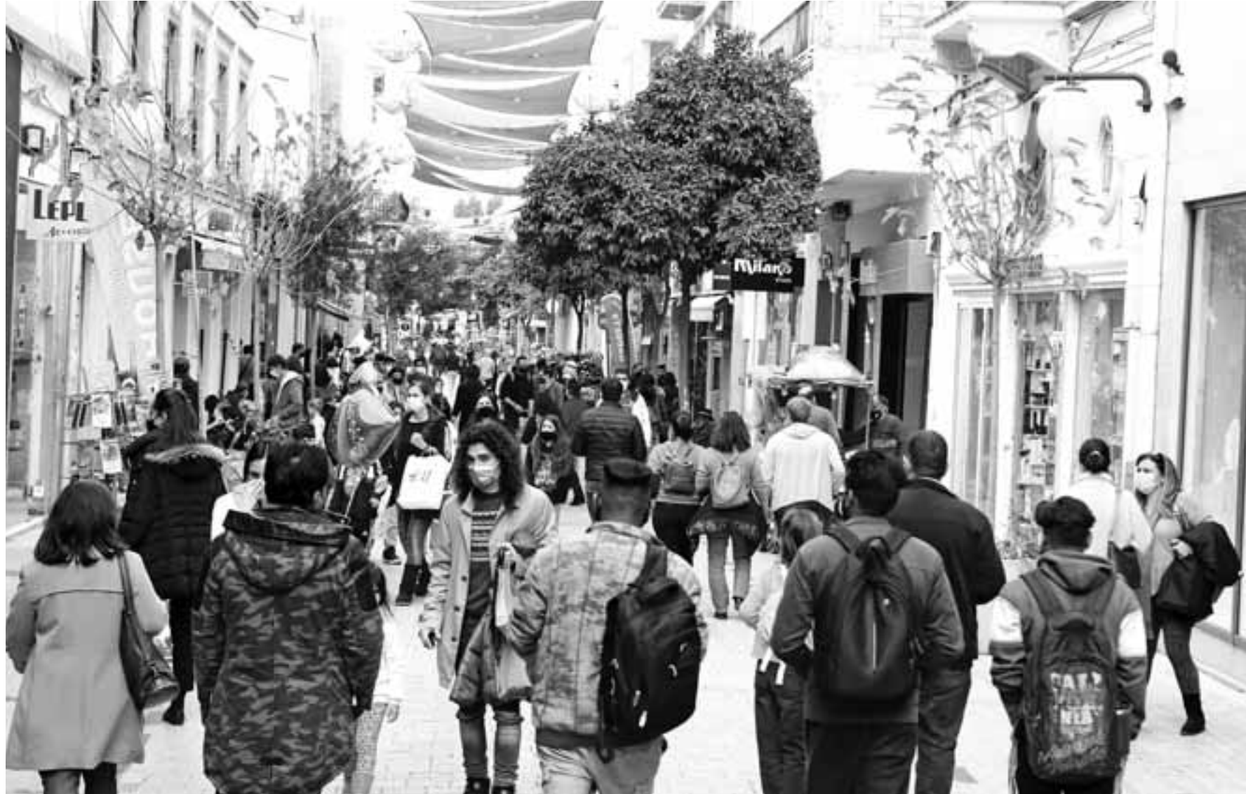
Οι εισηγήσεις που τέθηκαν από την επιστημονική συμβουλευτική ομάδα για την αντιμετώπιση της πανδημίας, είχαν κλειδί την χρησιμοποίηση των rapid tests.

Δεν θα επανεκκινήσει όλο το λιανικό εμπόριο, θα ανοίξει μόνο ένα κομμάτι του. Θα ανοίξουν καταστήματα τα οποία είναι κάτω των 500 τετραγωνικών μέτρων, άρα τα δεδομένα τα οποία παρουσιάζονται ισχύουν για όλο το λιανικό, αν λειτουργούσαν για παράδειγμα και τα mall. Σύμφωνα