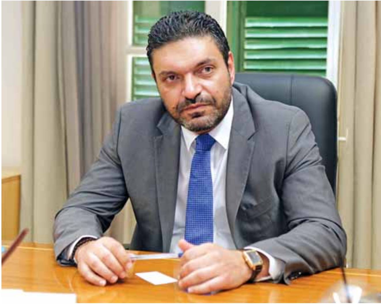
Ο υπουργός Οικονομικών Κωνσταντίνος Πετρίδης στην κατάθεσή του περιέγραψε μια ζοφερή εικόνα για το πρόγραμμα πολιτογραφήσεων όταν πήγε στο Υπουργείο Εσωτερικών. Αναφέρθηκε σε συγκεκριμένες περιπτώσεις που δέχθηκε παρεμβάσεις.

Στις συγκεκριμένες υποθέσεις, όπως ανέφερε ο πρόην ΥΠΕΣ, οι αιτήσεις είχαν απορριφθεί. Ο κ. Πετρίδης, κληθείς να κατονομάσει τον ευρωβουλευτή, βουλευτή και το δικηγορικό γραφείο, είπε ότι «ο ευρωβουλευτής δεν γνώριζε συγκεκριμένα πράγματα, κάποιοι τον είχαν εννοχλήσει και έκριναν σκόπιμα να τον εννοχλήσουν». Ο κ. Πετρίδης αναφέρθηκε σε δικηγόρους-εκπαιστωμένους των αιτητών, λέγοντας πως σε μια περίπτωση ένας προσπάθησε να πάει και στο Προεδρικό. «Προσπαθούσαν μέσω των γραφείων τούτων, εντάξει, ποιος έχει τις παραπάνω πολιτικές, πα-