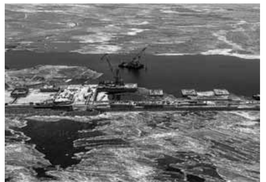
Το κρατίδιο στη βορειοανατολική ακτή της Γερμανίας, όπου θα καταλήξει ο αγωγός, ίδρυσε περιβαλλοντική οργάνωση την οποία χρηματοδοτεί η Gazprom.

ρολίνο υποστηρίζει ότι πρόκειται για ένα έργο αμιγώς επιχειρηματικής συνεργασίας με τη Ρωσία. Η ένταση στις σχέσεις Ουάσινγκτον - Βερολίνο αναθερμαίνεται σε μια ιδιαίτερα ευαίσθητη στιγμή, καθώς η κυβέρνηση Μπάιντεν θα επιδιώξει να θέσει σε νέα βάση τις σχέσεις της με την Ε.Ε. και τις χώρες-μέλη της, οι οποίες είχαν κλονιστεί στη διάρκεια της θητείας Τραμπ και του εμπορικού πολέμου. Η υπόθεση θυμίζει περίοδο Ψυχρού Πολέμου, καθώς στο κρατίδιο Μεκλεμβούργου-Δυτικής Πομερανίας και γενικότερα στην Ανατολική Γερμανία η Ρωσία εξακολουθεί να είναι δημοφιλής τόσο όσο χρειάζεται για να διατηρείται το έθιμο της «ήμερας της Ρωσίας», ενώ η Ουάσινγκτον αντιμετωπίζεται με επιφυλακτικότητα. Οι τοπικές αρχές του κρατιδίου, άλλωστε, ενστερνίζονται τη θέση που υποστηρίζει το Βερολίνο πως όλες αυτές οι παρεμβάσεις της Ουάσινγκτον δεν στοχεύουν παρά στο πώς να διασφαλίσουν ότι η Ε.Ε. θα αγοράζει αμερικανικό υγροποιημένο αέριο (LNG).