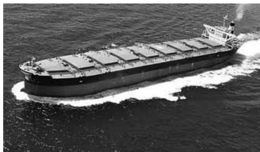
Η έντονη επενδυτική δραστηριότητα των Ελλήνων πλοιοκτητών εντάσσεται στον κύκλο ανανέωσης και εκσυγχρονισμού του ελληνικού εμπορικού στόλου, του μεγαλύτερου παγκοσμίου για μία ακόμη χρονιά.

Η έντονη επενδυτική δραστηριότητα εντάσσεται στον κλασικό κύκλο ανανέωσης και εκσυγχρονισμού του ελληνικού εμπορικού στόλου, του μεγαλύ-