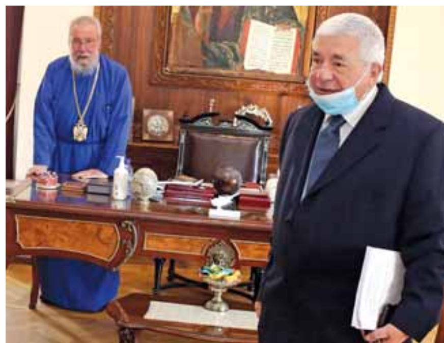
Η κατάθεση του Αρχιεπισκόπου Χρυσόστομου Β΄ κράτησε περίπου δυο ώρες. Ο Μακαριότατος μίλησε για το πρόγραμμα πολιτογραφήσεων, το Κυπριακό, τον Πρόεδρο της Δημοκρατίας και τον Χριστόδουλο Βενιαμίν λέγοντας πως δεν πήρε ουδέποτε χρήματα σε σκατούλες.

ΑΡΧΙΕΠΙΣΚΟΠΟΣ: Δεν ξέρω, μπορεί. Έχω στείλει πολλές επιστολές. Σήμερα κάποιος Ρώσος ζήτησε να δει κάποια οικοπέδα μας στη Λεμεσό.