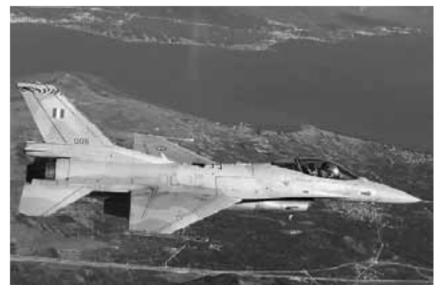
Το πρωτότυπο F-16 Block 52 Plus σε δοκιμαστική πτήση που πραγματοποιήθηκε το περασμένο Σάββατοκίριακα.