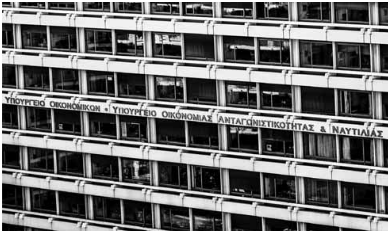
Αυτή τη στιγμή το υπουργείο Οικονομικών βαδίζει με δεδομένο πως τα μέτρα στήριξης των επιχειρήσεων και των εργαζομένων θα διαρκέσουν έως τον Μάρτιο - Απρίλιο.

Όπως δήλωσε ο αναπληρωτής υπουργός Οικονομικών Θεόδωρος Σκυλακάκης, «το καλύτερο του αναμενόμενου αποτέλεσμα διευκολύνει την άσκηση της δημοσιονομικής πολιτικής του 2021, επιβεβαιώνοντας