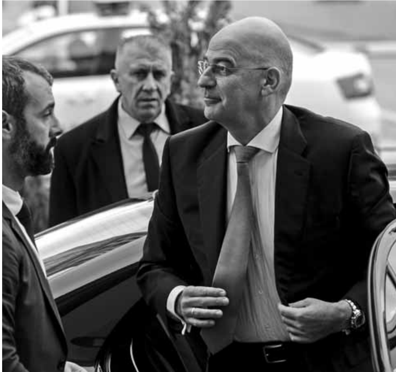
Η συνάντηση των κ. Δένδια και Στόλτενμπεργκ θα πραγματοποιηθεί την προσεχή Δευτέρα, ημέρα κατά την οποία θα ξεκινήσει ο 61ος γύρος των διερευνητικών επαφών.

Με αφορμή αναφορές του κ. Κατρούγκαλου στην επικριτική, κατά το πρόσωπο παρελθόν, της διπλωματικής συμβούλου του πρωθυπουργού με τον διπλωματικό σύμβουλο του Τούρκου προέδρου, τον κ. Καλίν, ο κ. Δένδιας σημείωσε ότι η διπλωματική συμβούλος του πρωθυπουργού «υπό τη διπλωματική της ιδιότητα είναι υφιστάμενη του εκάστοτε