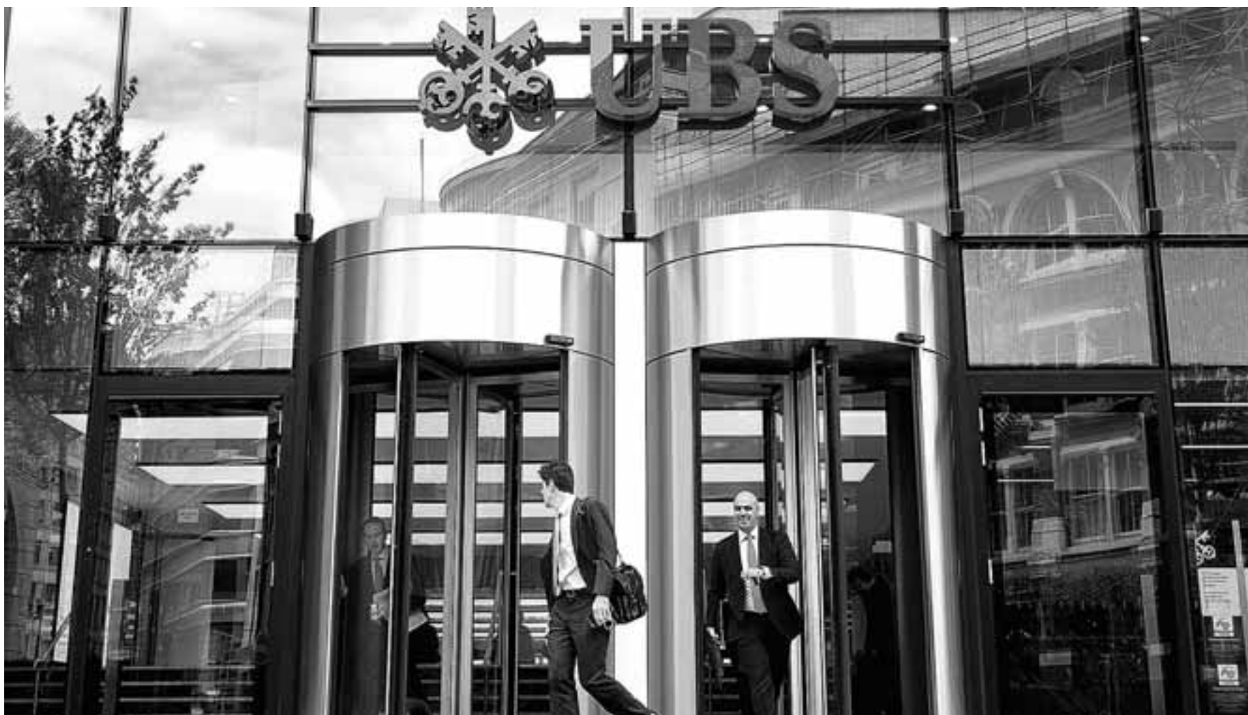
Η UBS θεωρεί πως το πρώτο τρίμηνο το ΑΕΠ της Ευρωζώνης θα μειωθεί κατά 0,4%, ενώ η προηγούμενη εκτίμησή της μιλούσε για ανάπτυξη 2,4%.

Οι οικονομολόγοι του Bloomberg προβλέπουν, άλλωστε, πως η οικονομία της