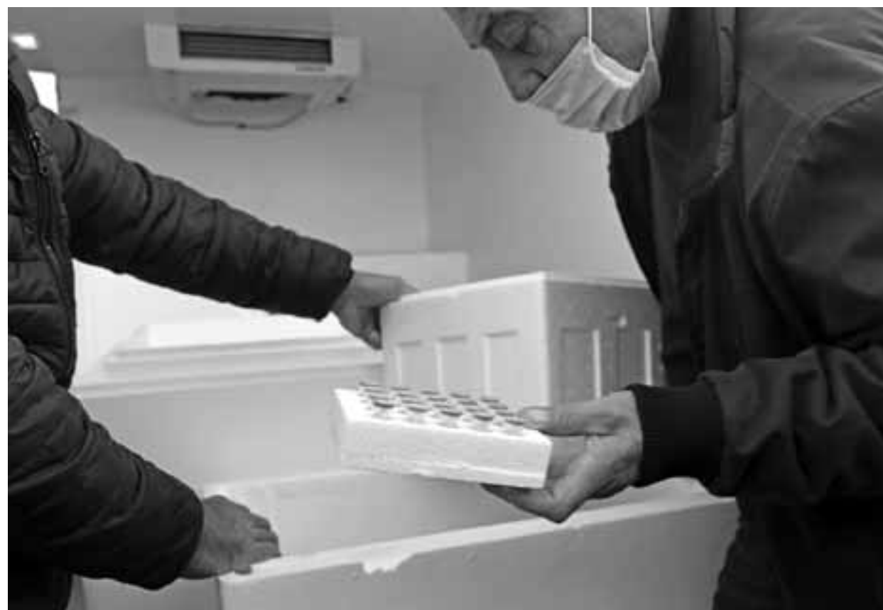
Η πρώτη δόση των εμβολίων της Pfizer, που δόθηκε στα Κατεχόμενα, θα χορηγηθεί σε άτομα άνω των 65 ετών και σε εργαζόμενους στον τομέα της υγείας.

Την Δευτέρα, ο τ/κ τύπος ανακίνησε την άφιξη της πρώτης δόσης του ευρωπαϊκού εμβολίου στα Κατεχόμενα. Το εμβόλιο της Pfizer έφτασε στα Κατεχόμενα διά μέσου του οδοφράγματος του Αγίου Δομητίου και παραδόθηκε από την ε/κ πλευρά σε τ/κ όχημα, το οποίο στη συνέχεια το μετέφερε στην