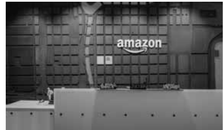
Σχεδιάζει να γίνει η έδρα της για την περιοχή της ΝΑ Ευρώπης.

«Το σημαντικότερο είναι πως οι σχεδιασμοί της Amazon για την Ελλάδα είναι ευρύτεροι και έτσι θα έρθουν και άλλα πράγματα από την πολυεθνική: το regional hub είναι μόνον η αρχή», υπογραμμίζουν από την κυβέρνηση.