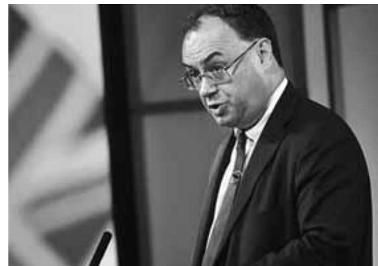
Ο διοικητής της Τράπεζας της Αγγλίας, Αντριου Μπέιλι, έχει δηλώσει ότι η χώρα δεν πρέπει να παραμείνει «δεμένη» στο κανονιστικό πλαίσιο της Ε.Ε. προκειμένου να «εξαγοράσει» ως αντάλλαγμα την πρόσβαση στην ενιαία αγορά υπηρεσιών.

Ως πρώτο βήμα, Βρετανία και Ε.Ε. εργάζονται επάνω σε ένα πλαίσιο συνεργασίας στον χρηματοοικονομικό τομέα, με τον στόχο αυτό να είναι έτοιμος έως τον Μάρτιο του 2021. Αυτή η διαδικασία είναι διαφορετική από τη διαπραγμάτευση για τη βρετανική πρόσβαση στην ενιαία αγορά, ξεκαθάρισε ο Ρουμπέν ντε Σερβέν, τονίζοντας ότι το μνημόνιο συνεργασίας των δύο μερών δεν θα δεσμεύει την Ε.Ε. σε ζητήματα ισοδυναμίας.