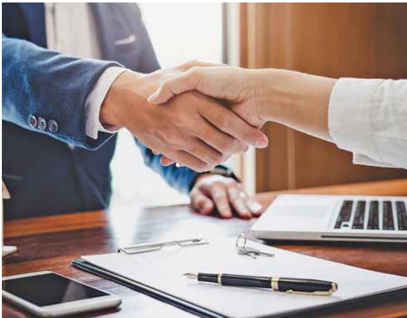
Το μορατόριουμ των δόσεων στο οποίο έλαβαν μέρος 12 δισ. δάνεια παγκυπρίως θα παίξει μεγάλο ρόλο για τις επόμενες αποφάσεις, δηλαδή αν θα δημιουργηθεί ή όχι κακή τράπεζα, και ποιος θα είναι ο πρωταγωνιστής.

Η Τράπεζα Κύπρου ανακοίνωσε τη Δευτέρα την πώληση και ενός συμπληρωματικού μικρότερου πακέτου μη εξυπηρετούμενων δανείων προς την Rimco ύψους 545 εκατ. ευρώ, δηλαδή την αγοράσή του Helix 2. Αντίστοιχη κίνηση για πώληση μικρού πακέτου μη εξυπηρετούμενων δανείων αυτή τη φορά (υπογραμμίζεται πως η ΚΕΔΙΠΕΣ ετοιμάζεται να πωλήσει ενήμερα δάνεια και όχι ΜΕΔ)