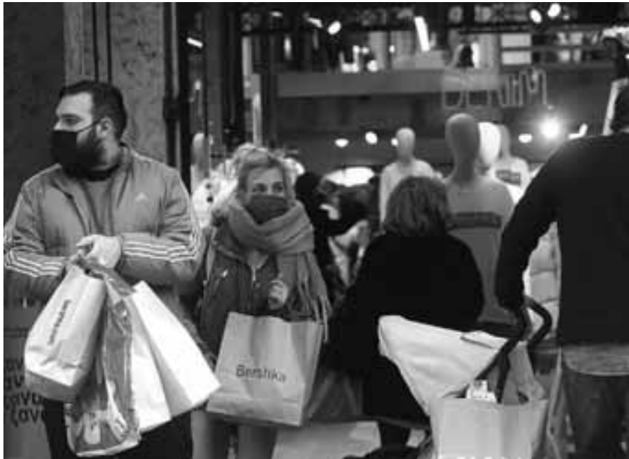
Τα καταστήματα που προσείλκυσαν την Δευτέρα τους περισσότερους καταναλωτές ήταν αυτά των ειδών ένδυσης και υπόδησης και κυρίως αλυσίδες με νεανικά ρούχα.

Αυτό που είναι πιο σημαντικό για τη μεγάλη πλειονότητα των εμπόρων στην παρούσα φάση είναι να προλάβουν να πουλήσουν το εμπόρευμα και να μην μείνουν