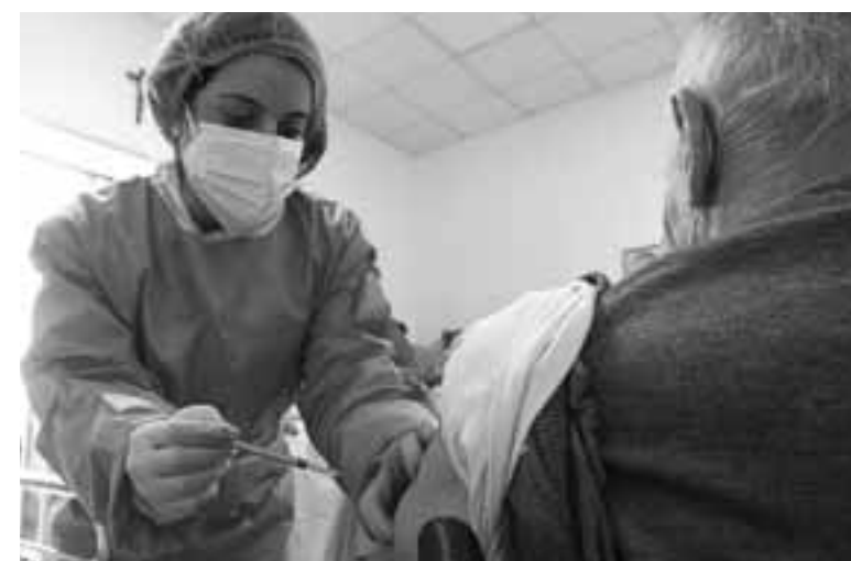
Στη Νορβηγία προτεραιότητα στην εμβολιαστική εκστρατεία δόθηκε, όπως και σχεδόν σε ολόκληρο τον κόσμο, σε όσους κινδυνεύουν περισσότερο από την COVID-19, δηλαδή στους ηλικιωμένους.