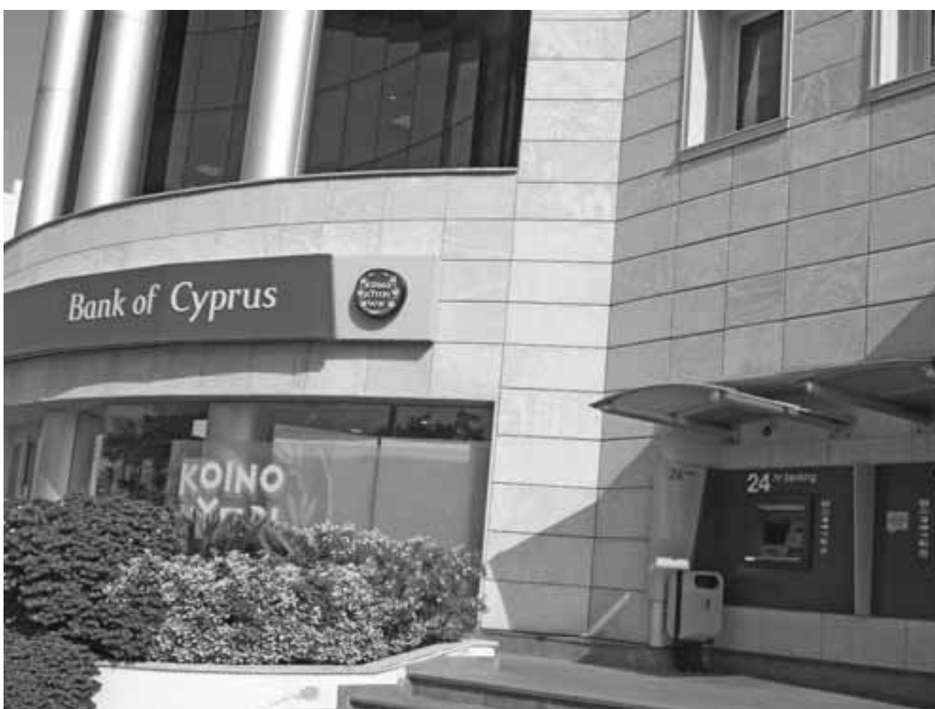
Τελευταία αγορά μετοχών της τράπεζας επιτεύχθηκε την Τρίτη από την Car Vallinvestors, η οποία απέκτησε το 3,11%.

Προηγουμένως, κατείχε επίσης μετοχές για λογαριασμό πελάτη της, στο 3%. Θα πρέπει να πιστώσουμε ωστόσο πως εν μέσω κρίσης η Τράπεζα Κύπρου έχει προχωρήσει σε κινήσεις που έκαναν καλύτερο το καρτοφυλλάκι της. Μέσα στην πανδημική κρίση κατάφερε να κλείσει το «deal» με την Pitco για την αγορά του Helix 2 ύψους 916 εκατ. ευρώ, αλλά και ενός συμπληρωματικού, με το ίδιο ταμείο, ύψους 545 εκατ. ευρώ. Καμία άλλη τράπεζα στο νησί δεν κατάφερε να κάνει τόσο μεγάλα βήματα εν μέσω κρίσης, παρά το ότι αν της ασκηθεί κριτική δεν είχε περιθώρια να μην γίνουν. Εποπτικά, είχε ακόμα χρόνο να παρατείνει το όποιο «deal».