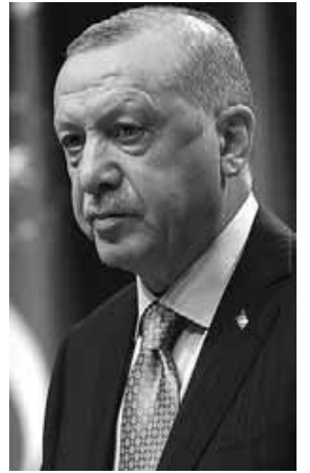
Οργανώσεις υπέρ της ελευθερίας της έκφρασης στην Τουρκία χαρακτήρισαν τον νόμο, που ψηφίστηκε τον Οκτώβριο, μέρος της προσπάθειας του Ταγίπ Ερντογάν να περιορίσει την ελευθεροτυπία.

«Η Τουρκία δεν επιθυμεί να αποκλείσει τους πολίτες από τις υπηρεσίες αυτές, αλλά η χώρα έχει δεσμευθεί να λάβει κάθε μέτρο για την προστασία των δεδομένων, της ιδιωτικής ζωής και των δικαιωμάτων όλων των Τούρκων. Δεν πρόκειται να επιτρέψουμε στον ψηφιακό φασισμό και την αναρχία να κυριαρχήσουν στην Τουρκία», ανέφερε ο Τούρκος υφυπουργός, αρμόδιος για θέματα ψηφιακών επικοινωνιών.