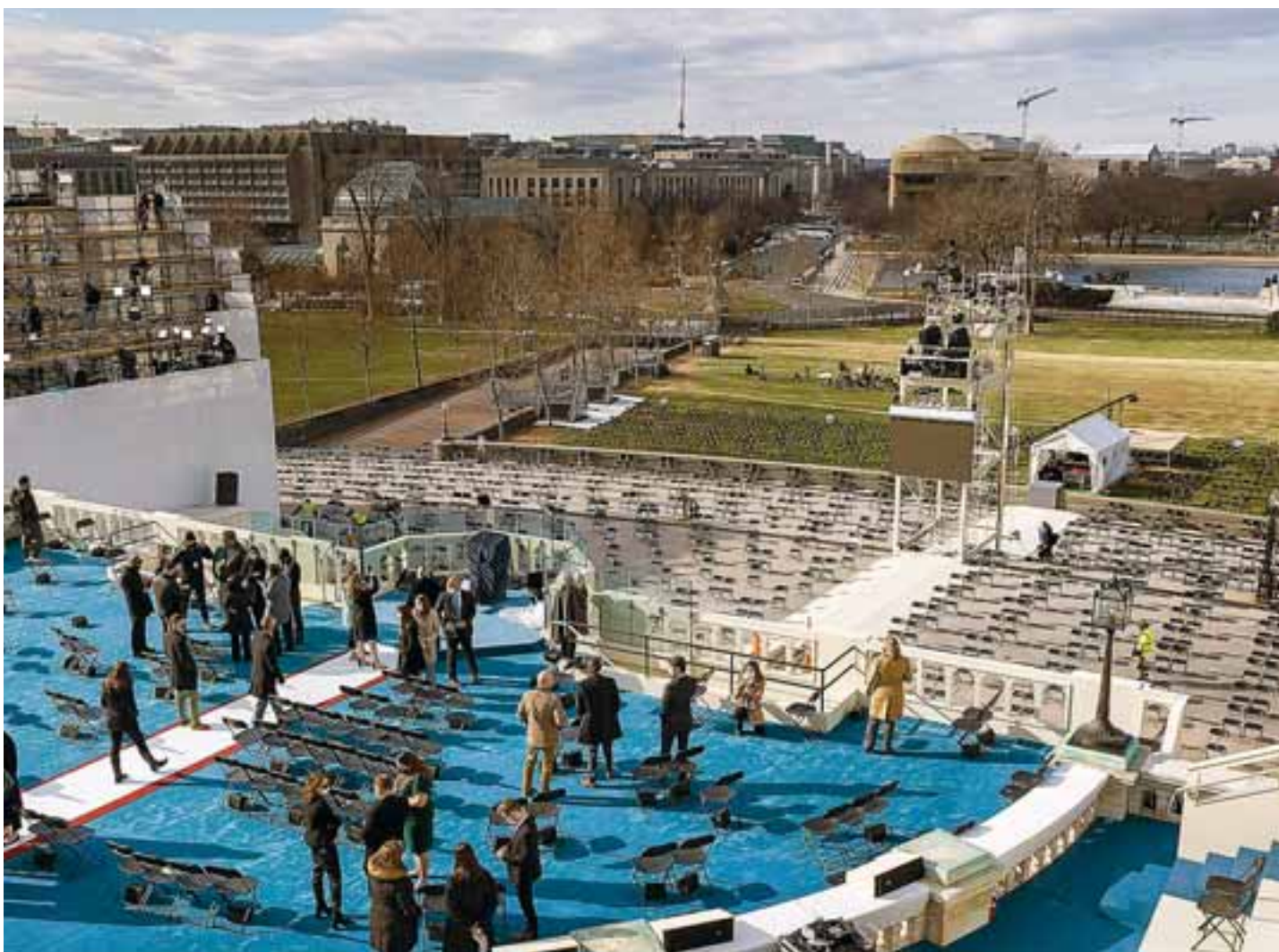
Στιγμιότυπο από την προετοιμασία για την τελετή ορκωμοσίας, η οποία θα πραγματοποιηθεί στις 12 το μεσημέρι, ώρα Ουάσιγκτον.