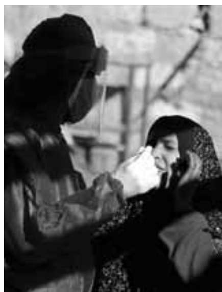
Παλαιστίνιοι πολίτες που διαμένουν από την άλλη πλευρά της αυθαίρετης διαχωριστικής γραμμής δεν θα εμβολιαστούν, όπως επισημαίνει σε δημοσίευσμά του το δίκτυο CNN.

«Οι διαχωρισμοί στην εμβολιαστική πολιτική ανάλογα με την αστυνομική ταυτότητα είναι ανεπίτρεπτοι», αναφέρουν οι ειδικοί της UNHCR στο πόρισμα τους. Σύμφωνα με αυτό, το Ισραήλ οφείλει να επεκτείνει τους εμβολιασμούς σε όλο τον παλαιστινιακό πληθυσμό. Αυτή τη στιγμή, Παλαιστίνιοι πολίτες που ζουν σε κοινότητες της Κατεχόμενης Ανατολικής Ιερουσαλήμ, εναντίον τους τείχους ασφαλείας, διαθέτουν ισραηλινές ταυτότητες και δικαιούνται εμβόλιο, ενώ όσοι διαμένουν από την άλλη πλευρά της αυθαίρετης διαχωριστικής γραμμής, δεν θα εμβολιαστούν, όπως επισημαίνει σε δημοσίευσμά του το δίκτυο CNN. «Ο ΟΗΕ ορίζει ότι ως δύναμη κατοχής,