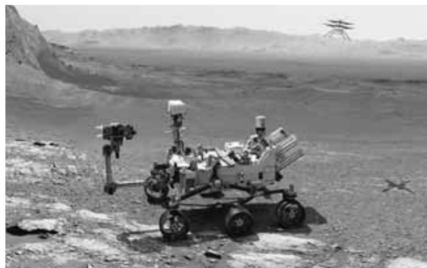
Το ρομποτικό όχημα «Perseverance» της NASA θα προσεδαφιστεί και θα ερευνήσει τον κρατήρα Γιεζέρο, κοντά στον Ισημερινό του πλανήτη Αρη.

• «Ματιά» στο εξώτερο Διάστημα: Τον Οκτώβριο θα εκτοξευθεί το διαστημικό τηλεσκόπιο «Τζέιμς Ουέμπ», μία συνεργασία της NASA, της Ευρωπαϊκής Υπηρεσίας Διαστήματος (ESA) και της αντίστοιχης καναδικής. Αυτό το διαστημικό τηλεσκόπιο νέας γενιάς θα μας επιτρέψει να ριζούμε μία ματιά στο απίταστο παρελθόν του σύμπαντος, καθώς θα «αιχμαλωτίσει» το αρχαιότερο φως του. Επίσης θα «δομήσει» τον σχηματισμό γαλαξιών και πλανητών, εκτός