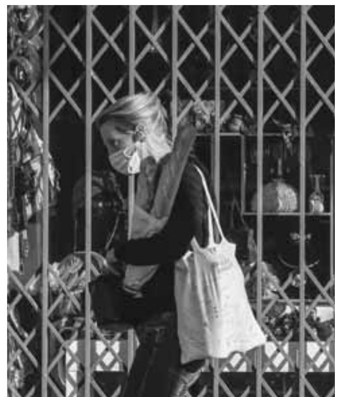
Οι επιπτώσεις στην οικονομία από το δεύτερο lockdown διαφέρουν από εκείνες του πρώτου.

Σημειώνουν επίσης τη δύσκολη άσκηση της άρσης των υποστηρικτικών μέτρων, η οποία περιλαμβάνει ρίσκα για διαθέσιμο εισόδημα των νοικοκυριών και των επιχειρήσεων, αν είναι απότομη, αλλά και για τον προϋπολογισμό, αν είναι πολύ αργή.