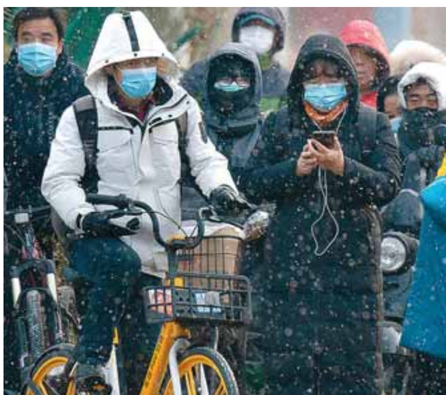
Η απειλή της COVID-19 επέστρεψε στην Κίνα. Η χθεσινή ήταν η έβδομη, κατά σειράν, ημέρα καταγραφής περισσότερων από 100 κρουσμάτων εντός 24 ωρών.

Τέλος, έρευνα που πραγματοποιήθηκε από την εταιρεία Ipsos Mori για λογαριασμό της Samsung Europe, σε 10.000 Ευρωπαίους πολίτες, διαπιστώνει ότι τα lockdowns άλλαξαν την προσέγγισή μας προς το οικιακό περιβάλλον. Το 39% των Ευρωπαίων βλέπει το σπίτι του ως τόπο έκφρασης και το 37% ενδιαφέρεται σήμερα περισσότερο για την εικόνα του. Το 64% των Ευρωπαίων το θεωρεί τον «ασφαλή του χώρο». Επίσης, οι πολίτες αντιμετωπίζουν πιο φιλική την τεχνολογία, που τους επέτρεψε να εργαστούν, αλλά και να διατηρήσουν ή να αναπτύξουν σχέσεις εν μέσω πανδημίας, με το 41% να δηλώνει ότι κάνει πλέον πράγματα στο σπίτι που δεν είχε κάνει ποτέ πριν και ότι έχει αναπτύξει χόμπι που θα διατηρήσει.