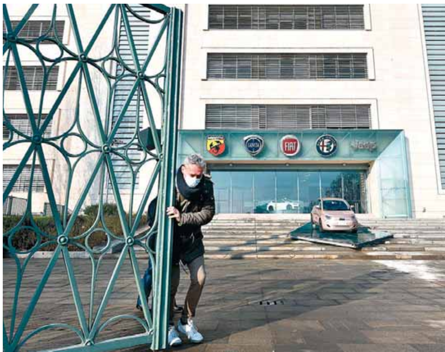
Ο νέος όμιλος που δημιουργήθηκε με τους σχεδόν 400.000 υπαλλήλους και τα 14 εμπορικά σήματα θα είναι σε θέση να περικοπεί κάθε χρόνο πέραν των 5 δισ. ευρώ χωρίς να κλείσει κανένα εργοστάσιό του.

Υπερδραστήριος και αεικίνητος, ο 62χρονος Ταβάρες ίσως να απασχολήσει τα πρωτοσέλιδα, αλλά αυτό θα εξαρτηθεί μόνον από το