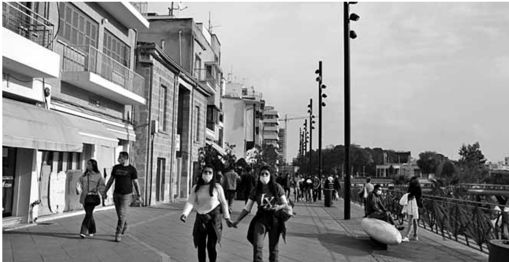
Τα γραπτά μηνύματα είναι άγνωστο εάν στο τέλος του μήνα θα καταργηθούν. Στην ομάδα που διαχειρίζεται το όλο θέμα υπάρχει προβληματισμός γενικότερης χαλάρωσης του πληθυσμού που θα οδηγήσει σε νέα επιδημιολογική επιδείνωση.

Εντός της Συμβουλευτικής Ομάδας είναι ξεκάθαρο πλήρως πως μια «γενναία» χαλάρωση, τέλος Ιανουαρίου εγκυμονεί κινδύνους νέας έξαρσης της επιδημίας αν ληφθεί υπόψη το τι έγινε σε άλλες ευρωπαϊκές χώρες. Επί τούτου ο επικεφαλής της Συμβουλευτικής Ομάδας Κωνσταντί-