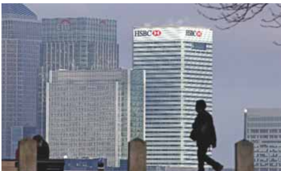
Δύσκολο θα είναι και η έξοδος από τα ισχυρά δημοσιονομικά μέτρα στήριξης, σημειώνει η HSBC.

Σε αυτό το πλαίσιο προχωρά σε σημαντική υποβάθμιση των προβλέψεών της για την πορεία των οικονομιών της περιοχής το 2021, μεταξύ των οποίων και της Ελλάδας, ωστόσο εκτιμά πως το 2022 θα είναι ένα πολύ ισχυρό έτος για την ελληνική οικονομία, η οποία θα σημειώσει την υψηλότερη ανάκαμψη στην Ευρωζώνη αλλά και στην Ευ-