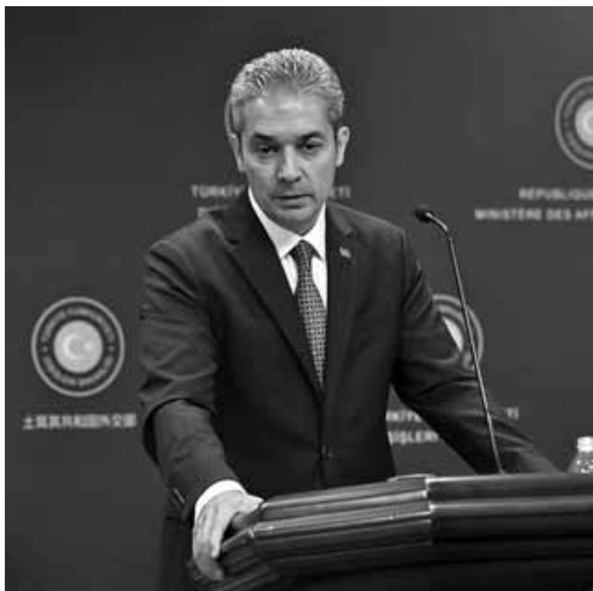
«Πριν προβεί σε τέτοιες δηλώσεις (σ.σ. για τα μειονοτικά δικαιώματα), ο Έλληνας υπουργός Εξωτερικών πρέπει να κοιτάξει στον καθρέφτη», ανέφερε ο εκπρόσωπος του υπουργείου Εξωτερικών της Τουρκίας Χαμί Ακσού.

«Πριν προβεί σε τέτοιες δηλώσεις, ο Έλληνας υπουργός Εξωτερικών πρέπει να κοιτάξει στον καθρέφτη», προσθέτει ο κ. Ακσού.