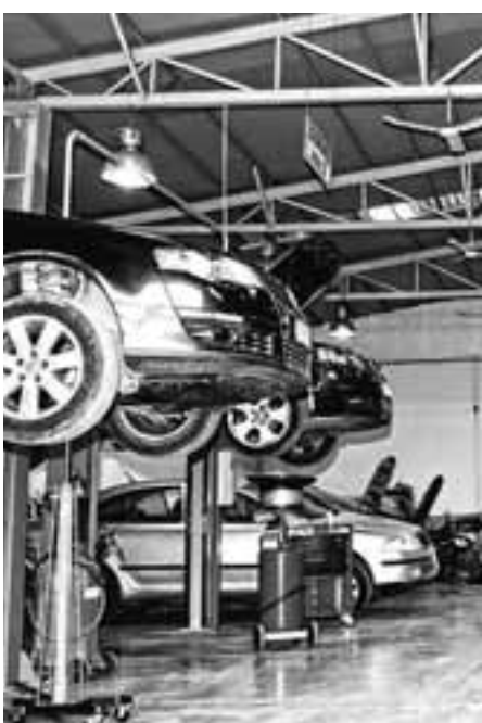
Μεταξύ των επιχειρηματικών δραστηριοτήτων που μπορούν να ξεκινήσουν με γνωστοποίηση στο σχετικό πληροφορικό σύστημα του υπουργείου Ανάπτυξης είναι τα συνεργεία επισκευής και συντήρησης αυτοκινήτων, μοτοσικλετών και μοτοποδηλάτων.

Η πρακτική της απλής γνωστοποίησης προτείνεται, σύμφωνα με το νομοσχέδιο,