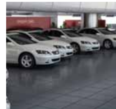
Μειώθηκαν στις 80.977 από 14.109 το 2019, υποχωρώντας κατά 29% σε σύγκριση με το 2019.

Συνολικά, σύμφωνα με τα στοιχεία της Ελληνικής Στατιστικής Αρχής (ΕΛΣΤΑΤ) την περίοδο Ιανουαρίου - Δεκεμβρίου 2020 κυκλοφόρησαν για πρώτη φορά στην Ελλάδα 136.015 επιβατικά αυτοκίνητα. Από αυτά, 79.597 (σ.σ. υπάρχει πάντα μια μικρή διαφορά με τα στοιχεία του ΣΕΑΑ, ο οποίος επεξεργάζεται τα πρωτογενή στοιχεία της ΕΛΣΤΑΤ) ήταν καινούργια και 56.418 μεταχειρισμένα, εισαγόμενα από το εξωτερικό. Οι πωλήσεις των τελευταίων σε σύγκριση