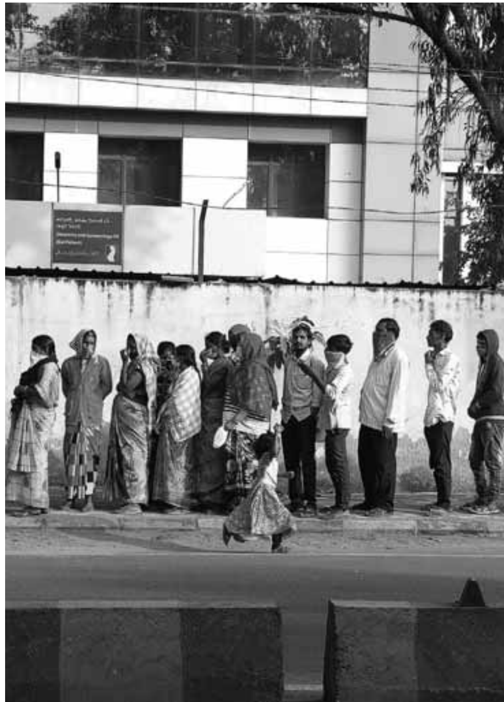
Στην Ινδία ξεκίνησε το Σάββατο το πιο φιλόδοξο σχέδιο εμβολιασμού 1,3 δισ. ανθρώπων (τα 300 εκατ. πριν από τον Ιούλιο) κατά της COVID-19 με δύο εμβόλια ινδικής παρασκευής (Covishield και Covaxin).