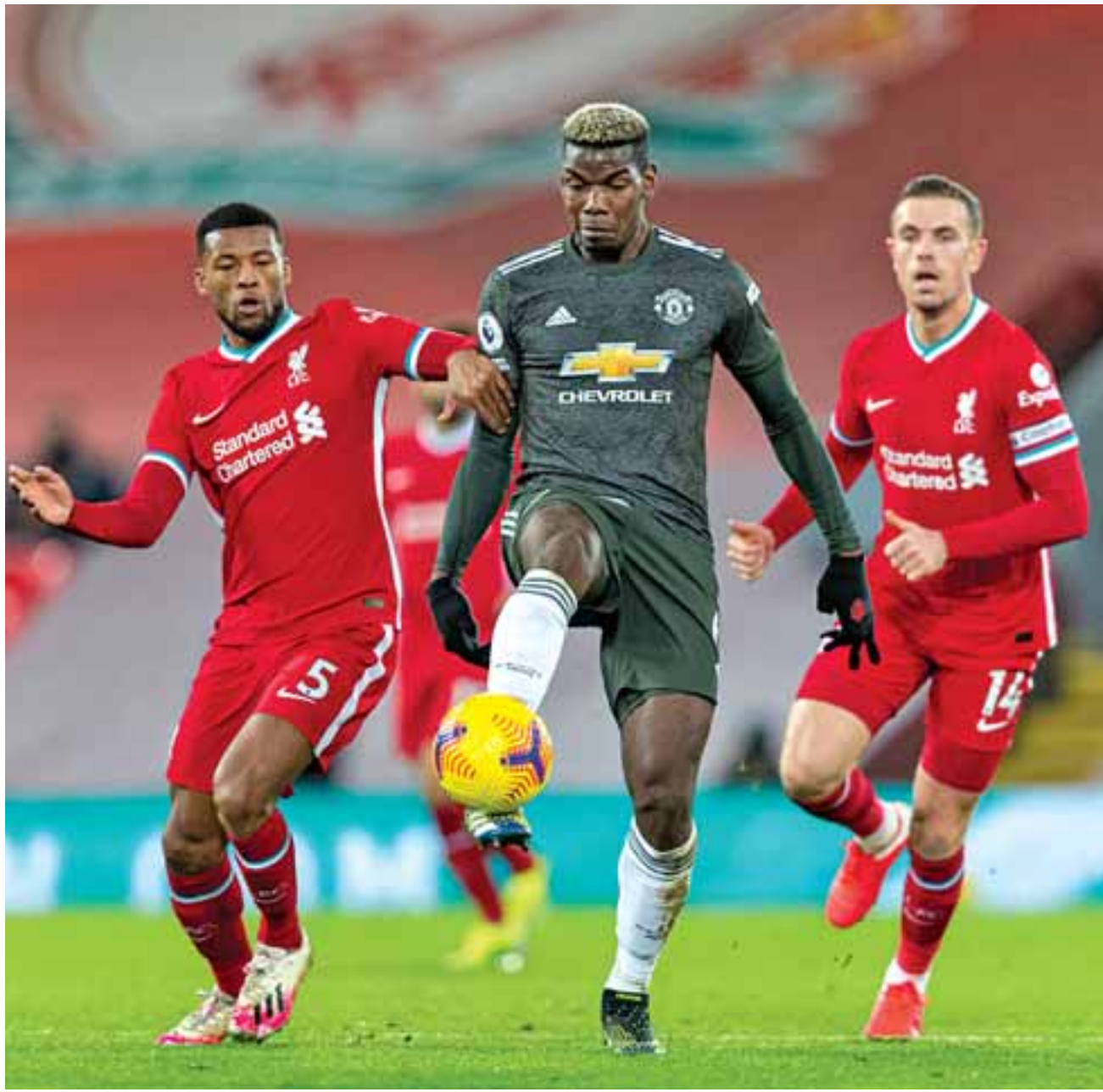
Μετά και τη λευκή ισοπαλία την Κυριακή στο ντέρμπι της πρωταθλήτριας Λίβερπουλ με την πρωτοπόρο Μάντσεστερ Γιουνάιτεντ, στριμώχνονται πλέον μέσα σε οκτώ βαθμούς εννέα ομάδες.

Πέρα από το γεγονός ότι η πανδημία έχει... ανακατέψει πολύ τα πράγματα, όχι