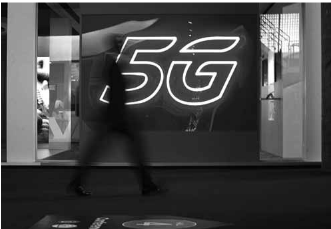
Σύμφωνα με εκτιμήσεις, η δημοπράτηση του φάσματος που απαιτείται για την ανάπτυξη δικτύου 5G πραγματοποιήθηκε σε χρόνο-ρεκόρ για τα ελληνικά δεδομένα.

Αρχή Τηλεπικοινωνιών και Ταχυδρομείων (ΕΕΤΤ) υπέγραψαν τις συμβάσεις παραχώρησης σε ειδικά διαδικτυακά εκδίδωσα. Από το ποσό των 3 δισ. ευρώ, που πρόκειται να επενδύσουν οι τρεις πάροχοι, 372 εκατ. ευρώ αντιστοιχούν στο τίμημα για την εξασφάλιση του φάσματος (700 MHz, 2 GHz, 3.400-3.800 MHz και 26 GHz), με την Cosmote και τη Vodafone να έχουν καταβάλει τους μετρητούς το τίμημα, ύψους 123 εκατ. ευρώ και 130 εκατ.