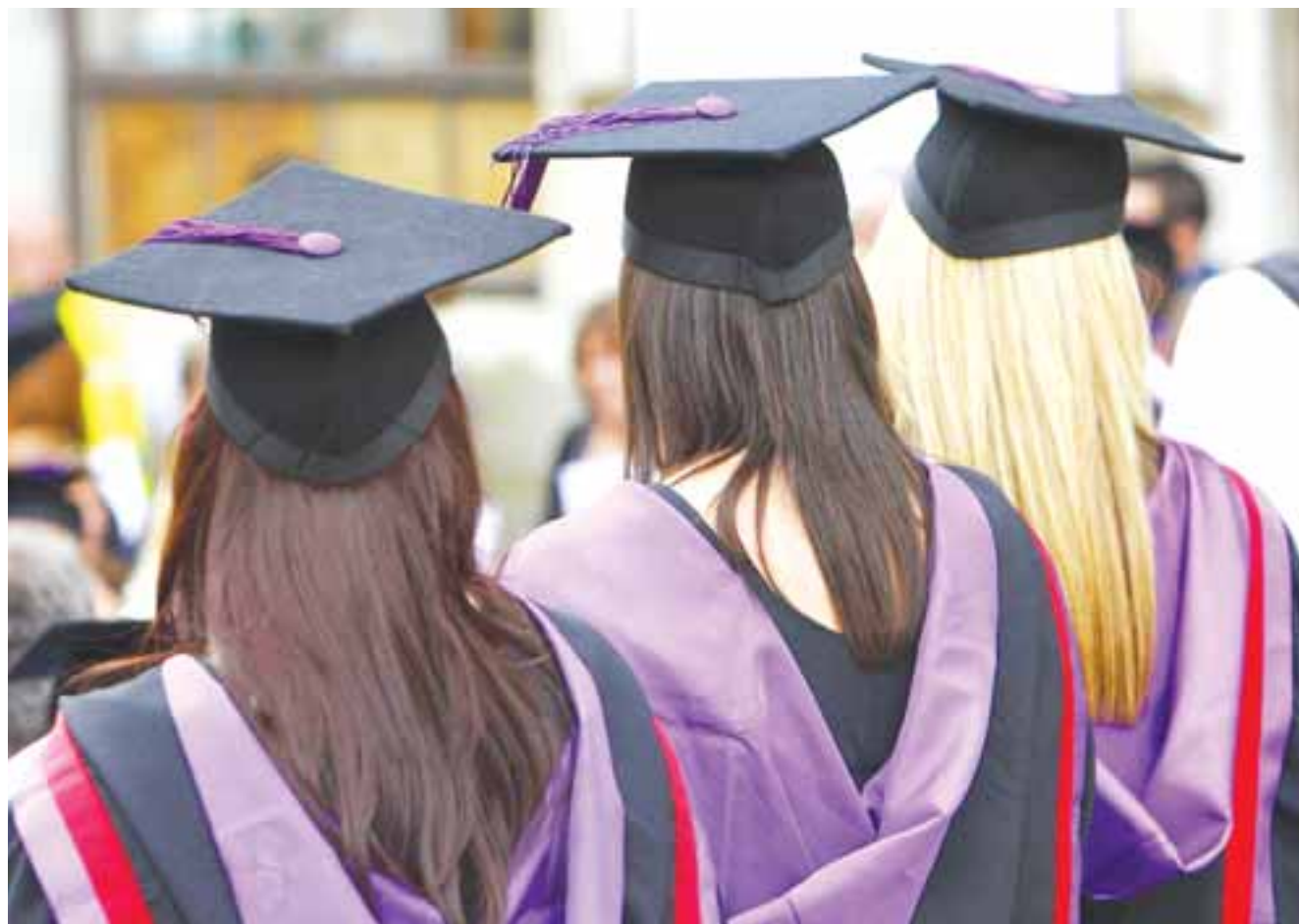
Ανεππρέαστοι παραμένουν οι φοιτητές που θα εγγραφούν μέχρι και τον Φεβρουάριο του 2021 σε αγγλικό πανεπιστήμιο, αλλά όσοι θα εγγραφούν τον ερχόμενο Σεπτέμβριο δεν θα απολαύσουν του σπουδαστικού δανείου και των χαμηλότερων διδάκτρων.

Όπως ήταν γνωστό από το καλοκαίρι, όταν είχε τεθεί εντονότερα το πρόβλημα