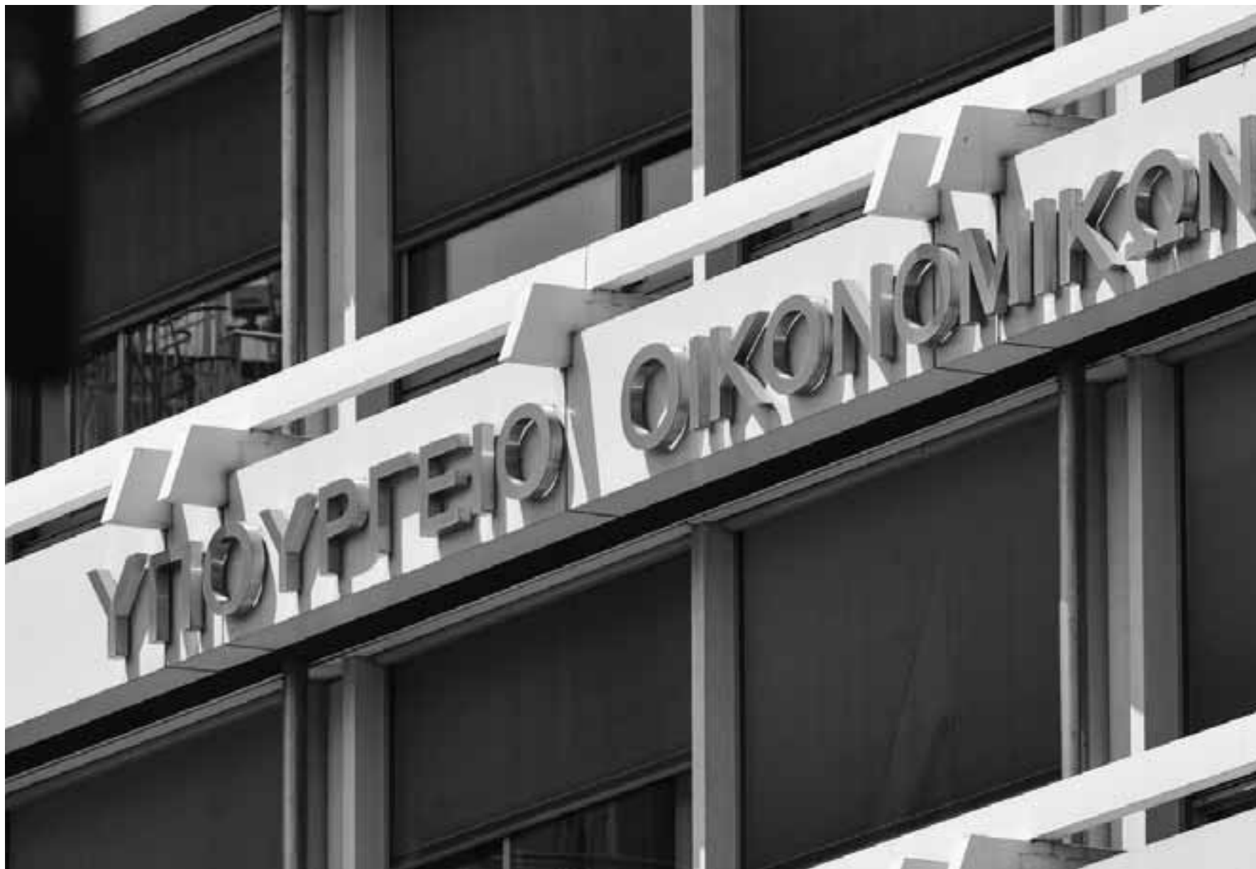
Το υπ. Οικονομικών αναμένεται να προχωρήσει σε μία νέα επιστρεπτέα προκαταβολή στα μέσα Ιανουαρίου. Όπως και στον τέταρτο κύκλο, το 50% του δανείου δεν θα επιστραφεί. Το ποσό υπολογίζεται να φθάσει στο 1,5 δισ. ευρώ. Τον Μάρτιο εκτιμάται ότι θα υπάρξει και ένας ακόμα κύκλος, με ποσό περίπου 700 εκατ. ευρώ.

• Κρατικά δάνεια. Νέα επιστρεπτέα προκαταβολή η οποία αναμένεται να ξεκινήσει στα μέσα Ιανουαρίου. Όπως και στον τέταρτο κύκλο το 50% του δανείου δεν θα επιστραφεί. Το ποσό υπολογίζεται να φθάσει στο 1,5 δισ. ευρώ και αναμένεται τον Μάρτιο ο έκτος κύκλος με ποσό περίπου 700 εκατομμύρια ευρώ. Πριν από τον έκτο κύκλο, η κυβέρνηση θα θέσει σε εφαρμογή ένα ακόμα εργαλείο για την ενίσχυση μεγάλων επιχειρήσεων οι οποίες δεν καλύφθηκαν επαρκώς από την επιστρεπτέα προκαταβολή. Το σχέδιο της κυβέρνησης προβλέπει την ενίσχυση