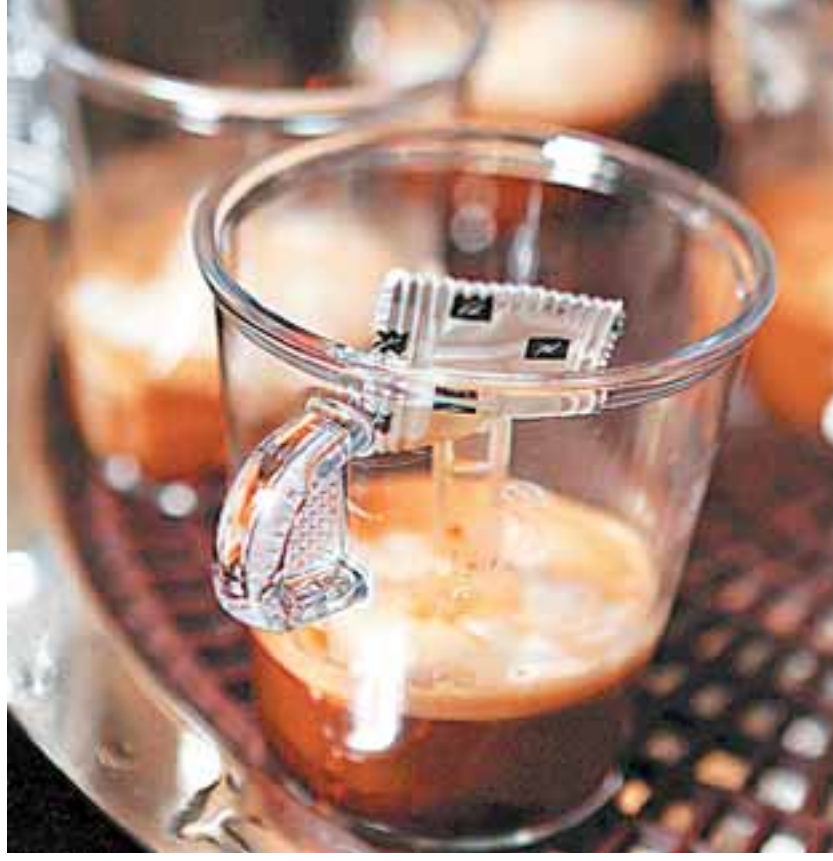
Η Nestle της οποίας η συνδρομητική υπηρεσία αγοράς του καφέ Nespresso είναι ήδη υπολογιστική δύναμη, πρόσφατα παρουσίασε νέο συνδρομητικό πρόγραμμα για θρεπτικά ροφήματα στην Ιαπωνία.

Η Unilever από τη δική της μεριά πρόκειται να λανσάρει το εμπορικό σύστημα περιποίησης Skisee στις ΗΠΑ. Τα προϊόντα αυτά παρέχουν εξατομικευμένη φροντίδα και αποτελούνται μέσω συνδρομής. Το 2018, επίσης, η εταιρεία εμπλούτισε το συνδρομητικό πρόγραμμα προϊόντων ξυρίσματος Dollar Shave Club, προσθέτοντας σε αυτό οδοντόκρεμες, κολόνιες και λάδι περιποίησης της γενειάδας. Η δε P&G, η μεγαλύτερη στον κλάδο περιποίησης, επέκτεινε το πρόγραμμά της για τις ξυριστικές μηχανές από τις ΗΠΑ και στον Καναδά. Η απευθείας πώληση δίνει τη δυνατό-