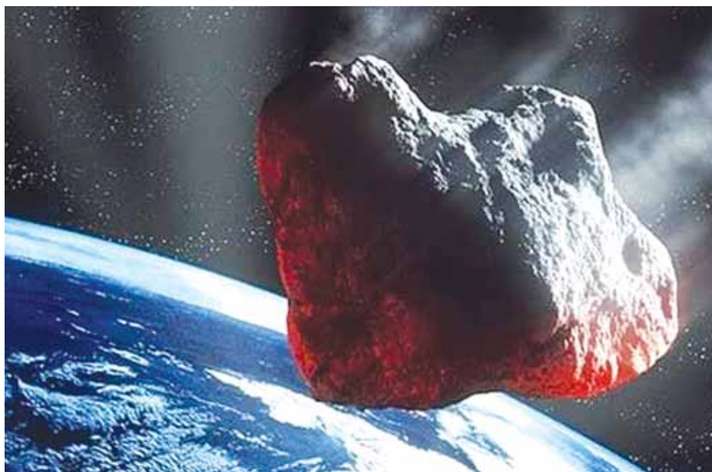
Μύθος αποτελεί επίσης η θεωρία ότι είναι εξαιρετικά δύσκολο να διασχίσει κανείς τη ζώνη των αστεροειδών, καθώς ότι γίνεται καύση στην καρδιά του Ήλιου.

Τα όρια ταχύτητας κάνουν την εμφάνισή τους στο Google Maps από τον περασμένο Ιούλιο, η Google με την εταιρεία να υποστηρίζει την σχετική λειτουργία μόνο στο Σαν Φρανσίσκο και το Ρίο ντε Τζανέιρο στη Βραζιλία. Ήδη η λειτουργία έχει ενεργοποιηθεί ακόμα στη Νέα Υόρκη, το Λος Άντζελες και τη Μινнесότα. Η εμφάνιση των ορίων ταχύτητας έχει προστεθεί στην Android και iOS έκδοση της εφαρμογής, χωρίς κάποια αναβάθμιση αλλά με προσθήκη που έγινε σε επίπεδο server, κάτι που σημαίνει ότι η Google μπορεί να επεκτείνει τη σχετική υποστήριξη όποτε το επιθυμεί -on the fly- χωρίς να χρειάζεται να ανανεώνει την εφαρμογή.