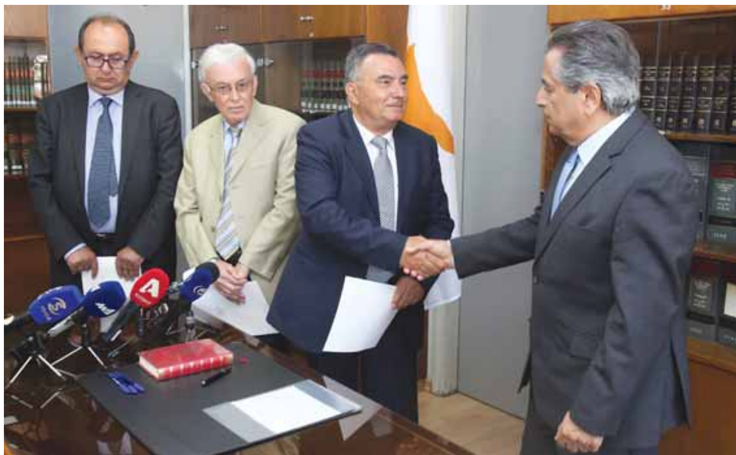
Το πόρισμα της ερευνητικής επιτροπής για την κατάρρευση του Συνεργατισμού υπολογίζεται πως θα παραδοθεί στον Γενικό Εισαγγελέα της Δημοκρατίας περί τα τέλη Φεβρουαρίου για μελέτη και αξιολόγηση.

δεχομένη να οδήγησαν τον Συνεργατικό πιστωτικό τομέα στην κατάρρευση. Στο συγκεκριμένο ερώτημα ουδείς από τα μέλη της επιτροπής μπορεί να απαντήσει με βεβαιότητα. Πέρα από τη γενική θεώρηση των πραγμάτων, όπως προκύπτει από λήψη καταθέσεων, τεκμηριωμένα δεν μπορούν να γίνουν υποδείξεις. Όπως υποστηρίζεται, το τοπίο, ως προς το ζητούμενο των ερευνών, θα έχει ξεκαθαρίσει με την ολοκλήρωση της πρώτης φάσης σύνταξης του πορίσματος, προς το τέλος του πρώτου δεκαήμερου Φεβρουαρίου, αρχές του δεύτερου. Αυτό που φαίνεται να έχει ξεκαθαρίσει στα μέλη της επιτροπής είναι πως για την κατάσταση στην οποία περιήλθε ο Συνεργατισμός στοιχεία έχουν εντοπιστεί και στις δυο επιμέχειες