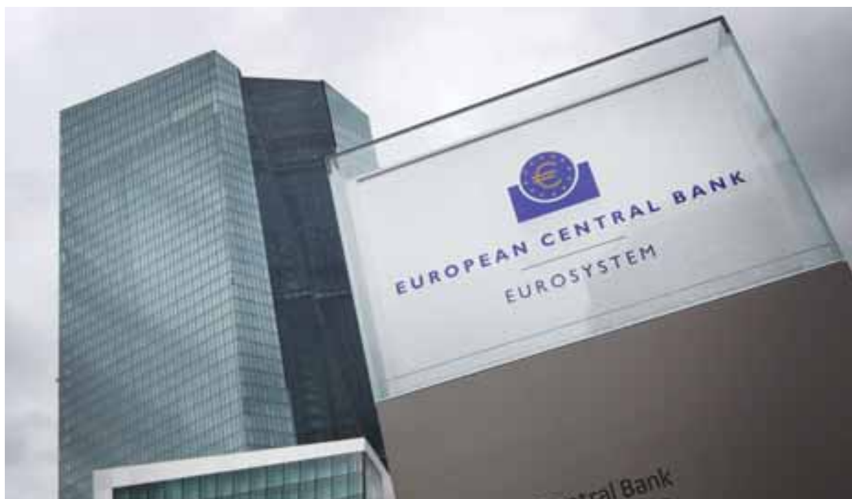
Η επιταγή για 100% κάλυψη των κόκκινων δανείων από προβλέψεις, από το επίπεδο του 50% που έχουν οι τράπεζες, εκτείνεται σε οριζόντια έως και το 2026, αλλά η απόφαση της ΕΚΤ τίθεται σε εφαρμογή από φέτος.

Η ανάληψη από την πλευρά της Eurobank της πρωτοβουλίας των κινήσεων για εμπροσθοβαρή μείωση του χαρτοφυλακίου των κόκκινων δανείων που έχει η τράπεζα, μέσα