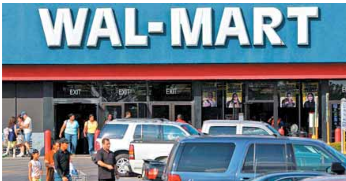
Οι αλυσίδες σούπερ μάρκετ, συμπεριλαμβανομένων των Walmart και Kroger, ήδη αντιλαμβάνονται μια πτώση των δαπανών σε προϊόντα δευτερευούσης σημασίας, όπως πατατάκια, σοκολάτες και μπαταρίες. Αλυσιδωτές αντιδράσεις στην οικονομία προκαλούνται, επίσης, από τη διακύβευση συμβάσεων ιδιωτών με το ομοσπονδιακό κράτος, με εκτιμήσεις για απώλεια εσόδων έως και 200 εκατ. δολαρίων, σε ημερήσια βάση.

Καυτηρήσεις ήδη υπάρχουν σε διάφορες λειτουργίες του ομοσπονδιακού κράτους από την πληρωμή