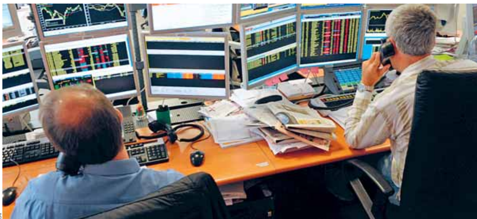
Το ήδη βεβαρημένο κλίμα από την επιβράδυνση της Κίνας στον χαμηλότερο ρυθμό ανάπτυξης των τελευταίων 30 ετών επείναν τα απογοητευτικά αποτελέσματα της UBS. Είχε, άλλωστε, προηγηθεί η έκθεση του ΔΝΤ, που υποβάθμισε τις προβλέψεις για την ανάπτυξη της παγκόσμιας οικονομίας.

τραπεζικές μετοχές. Τα νέα στοιχεία της Επιτροπής Κεφαλαιαγοράς έδειξαν πάλι αύξηση των shorts στη μετοχή της Eurobank από το Lansdowne (στο 1,81% από 1,72%) και το Oceanwood (στο 0,70% από 0,65%). Με εξαίρεση τη χθεσινή συνεδρίαση, τις τελευταίες ημέρες έχει εγκατασταθεί στο Χ.Α. δυαδικό σκηνικό, με τις τράπεζες να καταγράφουν διαδοχικές πτωτικές κινήσεις σε αντίδιαστολή με τις λοιπές δείκτοβαρείς μετοχές που διαφοροποιούνται από ταυτόχρονη καταγραφή ιστορικά χαμηλών επιδόσεων για τους τραπεζικούς δείκτες, προκαλώντας εύλογα ερωτήματα εάν οι τρέχουσες κεφαλαιοποιήσεις των τραπεζών είναι δικαιολογημένες (π.χ. Πειραιώς κάτω από 300 εκατ. ευρώ). Οι πολλές αβεβαιότητες του εξωτερικού περιβάλλοντος καθιστούν το εγχείρημα της αποτίμησης των συστημικών τραπεζών στα όρια της «αδύνατης αποστολής». Γι' αυτό, άλλωστε, και η S&P μετέθεσε χρονικά την αξιολόγηση της ελληνικής οικονομίας, περιορίζοντάς τη διατήρηση του θετικού outlook.