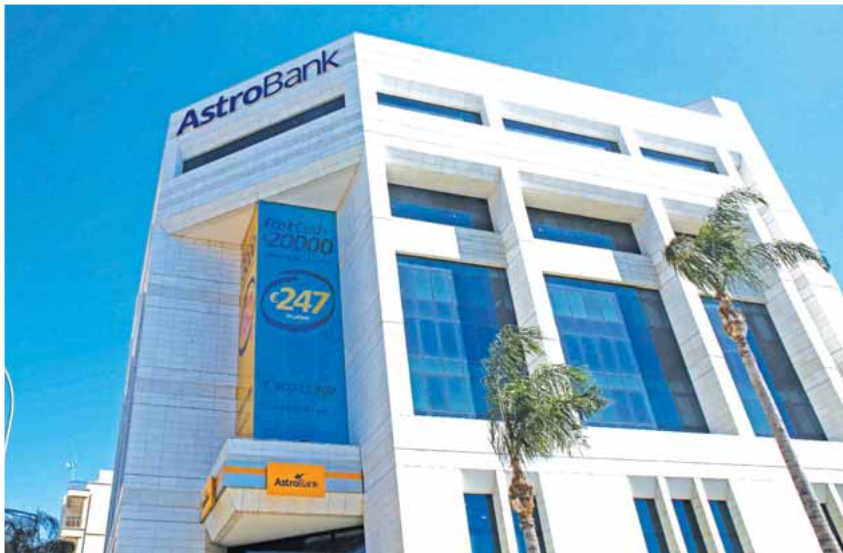
Επίσημα χείλη της Astrobank σημείωσαν πως η πώληση ή η συνεργασία με εταιρεία διαχείρισης δανείων είναι πιο κοντά στη φιλοσοφία της για αντιμετώπιση των τοξικών δανείων.

Το μεγάλο αγκάθι που πρέπει να αντιμετωπίσει, είναι τα Μν Εξυπηρετούμενα Δάνεια που διαθρέει πλέον. Αυτά φτάνουν στο 58,5% σύμφωνα με υπολογισμούς της «Κ», δηλαδή 2,3% περισσότερα από το ποσοστό των ΜΕΔ που