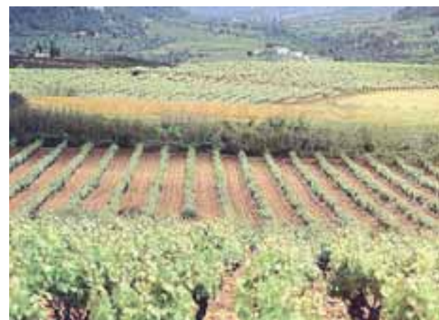
Στο οίνοπαραγωγικό Σαντ Σαντουρνί της Καταλονίας πολιτικοί παράγοντες λένε πως τα ιδιωτικά κεφάλαια μοιάζουν με μολυσματικό ιό. Στην περιοχή αυτή εξαγοράστηκαν από την αμερικανική Carlyle οι παμπάλαιοι αμπελώνες Κοντορνίου –έχουν ιστορία 500 ετών–, και απολύθηκαν 100 άνθρωποι.

Κατά τον πρόεδρο της ASCRI, Μιγκέλ Θουρίτα, τα ιδιωτικά επενδυτικά κεφάλαια στην Ισπανία αυξήσαν 7,6% τις θέσεις εργασίας τρία χρόνια μετά την απόκτηση της ντόπιας επιχείρησης έναντι του 2,3% σε εταιρείες, που δεν εξαγοράστηκαν. Όπως αναφέρει στους FT ο Λουττόβιτς Φαλίπου, καθηγητής Οικονομικών στη Σχολή Διοίκησης Επιχειρήσεων Σάιντ στην Οξφόρδη, «τα ιδιωτικά επενδυτικά κεφάλαια αποτελούν την πιο καθαρόαιμη έκφραση του καπιταλισμού με μοναδικό τους στόχο το κέρδος – κι εκεί είναι το σημείο τριβής με την κοινωνία».