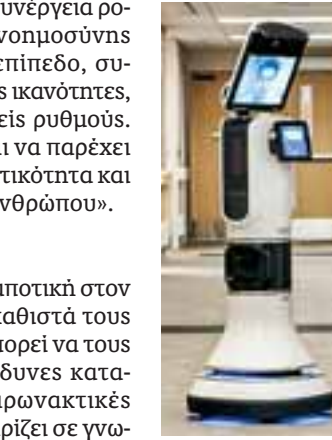
Ρομπότ σε νοσοκομείο των ΗΠΑ.

Θετικές επιδράσεις «Συνεπώς η ευφυής ρομποτική στον χώρο εργασίας δεν αντικαθιστά τους ανθρώπους, αντιθέτως μπορεί να τους προστατεύει από επικίνδυνες καταστάσεις ή κοπιακές χειρωνακτικές εργασίες, να τους υποστηρίζει σε γνωστικές εφαρμογές ψηφιακής αναζήτησης και ενημέρωσης με απόλυτα φυσικό τρόπο, να τους υποβοηθά εάν υπάρχουν κινητικά προβλήματα, να τους συντροφεύει μέσω επικοινωνίας που στηρίζεται σε αναγνώριση ομιλίας και χειρωνακικών. Όλες αυτές οι δυνατότητες μπορούν να επδράσουν θετικά και ενισχυτικά στην αγορά εργασίας