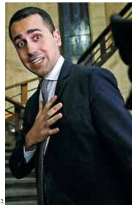
Ο Λουίτζι ντι Μάιο είχε ζητήσει από την Ε.Ε. να «τιμωρήσει» τη Γαλλία για την πολιτική της στην Αφρική.

Ο Ιταλός υπουργός Εξωτερικών συμφώνησε, αρνούμενος να «σμμιαζέψει» τις διλώσεις των δύο αντιπροέδρων. «Είναι τμήμα του πολιτικού διαλόγου που θα μας συνοδεύσει έως τις ευρωεκλογές. Ας συνηθίσουμε αυτούς τους τόνους», είπε ο Ιταλός υπουργός Εξωτερικών, Εντζο Μοάβερο-Μιλανέζι. Η διαμάχη, που υποκρέμασε το Παρίσι να ζητήσει προκθές