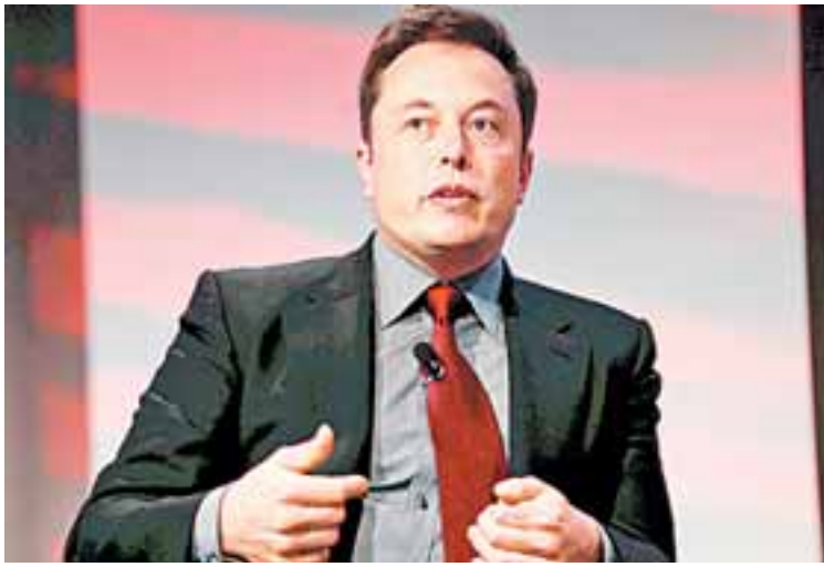
Ο επικεφαλής της Tesla, Ελον Μασκ, παραδέχθηκε πως, παρότι η εταιρεία του έχει σημειώσει τεράστια πρόοδο, τα προϊόντα της εξακολουθούν να φαίνονται εξαιρετικά ακριβά στους περισσότερους καταναλωτές.