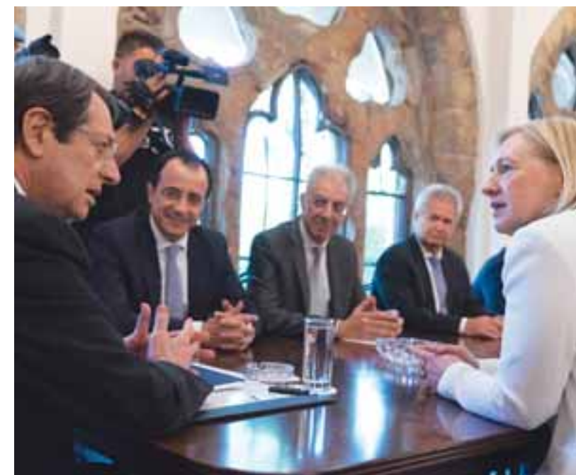
Αύριο το απόγευμα ενημερώνει η Σπέχαρτ το ΣΑ και τέλος του δρόμου η 30η του μήνα με υποθέτηση ψηφίσματος.

Μέσα σε αυτό το κλίμα, ξεκινά στα ΗΕ η συζήτηση για την ΟΥΝΦΙ-ΚΥΠ που θα έχει ως αποτέλεσμα την υποθέτηση του ψηφίσματος στις 30 του μήνα. Η αρχή γίνεται σύμφωνα με πληροφορίες αύριο το απόγευμα όπου η ειδικά αντιπρόσωπος των ΗΕ στην Κύπρο Ελιζαμπέτ Σπέχαρτ θα ενημερώσει τη συνεδρία του ΣΑ, ενώ την Πέμπτη ξεκινά η διαπραγμάτευση για το κείμενο.