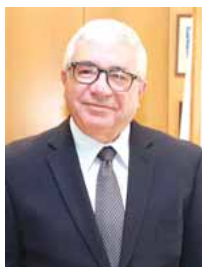
Στην Επιτροπή εκτός από τον Μύρωνα Νικολάτο έχουν κληθεί ο Υπ. Δικαιοσύνης, ο Γενικός Εισαγγελέας και εκπρόσωποι του Δικηγορικού Συλλόγου.

Δημοκρατίας Κώστας Κληρίδης και έχουν να κάνουν με τις σχέσεις Δικαστών με διάδικους σε υποθέσεις που δικάζουν. Στην προκειμένη περίπτωση οι σκοποί αντικειμενικής αμεροληψίας που επικαλέστηκε ο κ. Νικολάτος έχουν να κάνουν με τις δυο θυγατέρες τους. Η μια εργάζεται σε δικηγορικό γραφείο που εκπροσωπεί καταδικασθέντα στην υπόθεση της πρώην Λαϊκής Τράπεζας, ενώ η δεύτερη στη Νομική Υπηρεσία. Για πρώτη φορά από τότε που ξέσπασε ο θόρυβος ο πρόεδρος του Ανωτάτου θα κληθεί να δώσει απαντήσεις στα όσα έχουν λεχθεί δημοσίως. Την Τετάρτη στις 11.15 το πρωί ο κ. Νικολάτος έχει προσκληθεί να παραστεί σε συνεδρία της Επιτροπής Θεσμών Αξιών και Επιτρόπου Διοικήσεως της Βουλής με θέμα τις «καταγγελίες για διαπλοκή και οικογενειοκρατία στη κυπριακή δικαιοσύνη». Στη ίδια συνεδρία έχουν κληθεί να παραστούν ο Υπουργός Δι-