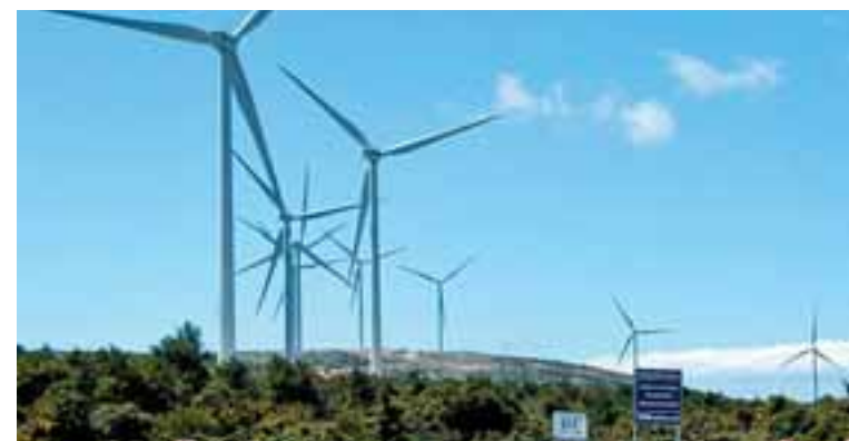
Εκπρόσωποι της Tesla παρουσίασαν στην ελληνική κυβέρνηση συνολική πρόταση για τα μη διασυνδεδεμένα νησιά.

Το προηγούμενο διάστημα, βρέθηκαν στη χώρα και είχαν συναντήσεις με αρμόδια κυβερνητικά στελέχη οι ιδρυτές της канаδικής εταιρείας Vitalis Extraction Technology η οποία δραστηριοποιείται στην ανάπτυξη τεχνολογίας για την εξαγωγή ελαίου κάνναβης μέσω της χρήσης διοξειδίου του άνθρακα. Οι ίδιοι, σύμφωνα με όσα είπαν στην «Κ», η οποία είχε την ευκαιρία να τους συναντήσει στην Αθήνα, δεν απέκλεισαν το ενδεχόμενο –και αναλόγως, βεβαίως, της πορείας της συγκεκριμένης αγοράς στην Ελλάδα– να δημιουργήσουν ένα κέντρο εξυπηρέτησης (service center) και μακροπρόθεσμα παραγωγική μονάδα σε κάποια ευρωπαϊκή χώρα.