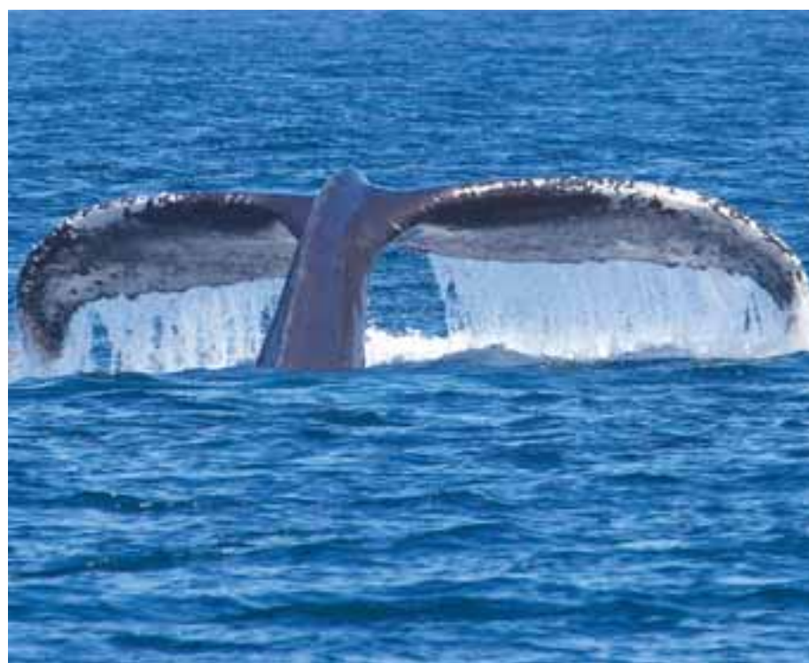
Μια μεγαλύτερη φάλαινα παίζει εκτοξεύοντας το βαρύ σώμα της έξω από τη θάλασσα.

τραγουδούν- το κάνουν προκειμένου να προσελκύσουν θηλυκά. Όμως, μπορεί να αλλάξουν τραγούδι όταν ένα άλλο αρσενικό βρίσκεται κοντά, σε μία προσπάθεια να αξιολογίσουν το μέγεθος και τη φυσική κατάσταση του αντιπάλου τους, επισημαίνει ο δρ Νόαντ, ο οποίος είναι συντάκτης μιας νέας μελέτης για τα τραγούδια της φάλαινας. Παραμένει άγνωστο γιατί τα τραγούδια των μεγαλύτερων φαλαινών είναι πιο περίπλοκα από αυτά των υπολοίπων ειδών. Ο δρ Νόαντ πιστεύει ότι αυτό μπορεί να είναι