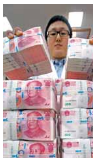
Η κίνηση αποτελεί μία ακόμη προσπάθεια των κινεζικών αρχών να αποτρέψουν περαιτέρω πτώσεις που θα μπορούσε να ασκήσει στην κινεζική οικονομία η πιστωτική ασφυξία.

Μία ημέρα μετά την ανακοίνωση του Πεκίνου ότι σκοπεύει να στηρίξει την κινεζική οικονομία και να θέσει σε προτεραιότητα την απασχόληση, η Λαϊκή Τράπεζα της Κίνας χορήγησε χθες ένεση ρευστότητας ύψους 83 δισ. δολαρίων στο χρηματοπιστωτικό σύστημα της χώρας. Η κίνηση αποτελεί μία ακόμη προσπάθεια των κινεζικών αρχών να αποτρέψουν περαιτέρω πτώσεις που θα μπορούσε να ασκήσει στην κινεζική οικονομία η πιστωτική ασφυξία. Διέψυξε, έτσι, όσους οικονομικούς αναλυτές προέβλεψαν πως το Πεκίνο θα αποφυγήσει τις θεαματικές κινήσεις και θα προημιήσει να στηρίξει τη δεύτερη οικονομία του κόσμου με έμμεσα μέτρα. Μέχρι στιγμής, όμως, τα πιο πρόσφατα μέτρα που έχει εισηγηθεί είναι κατά τη διάρκεια του περασμένου έτους δεν φαίνεται να αποφέρουν ικανοποιητικά αποτελέσματα και η οικονομική ανάπτυξη βρίσκεται στα χαμηλότερα επίπεδα των τελευταίων 28 ετών. Ανάμεσα στα μέτρα που εφαρμόσε το 2018 ήταν οι μεγάλες επενδύσεις