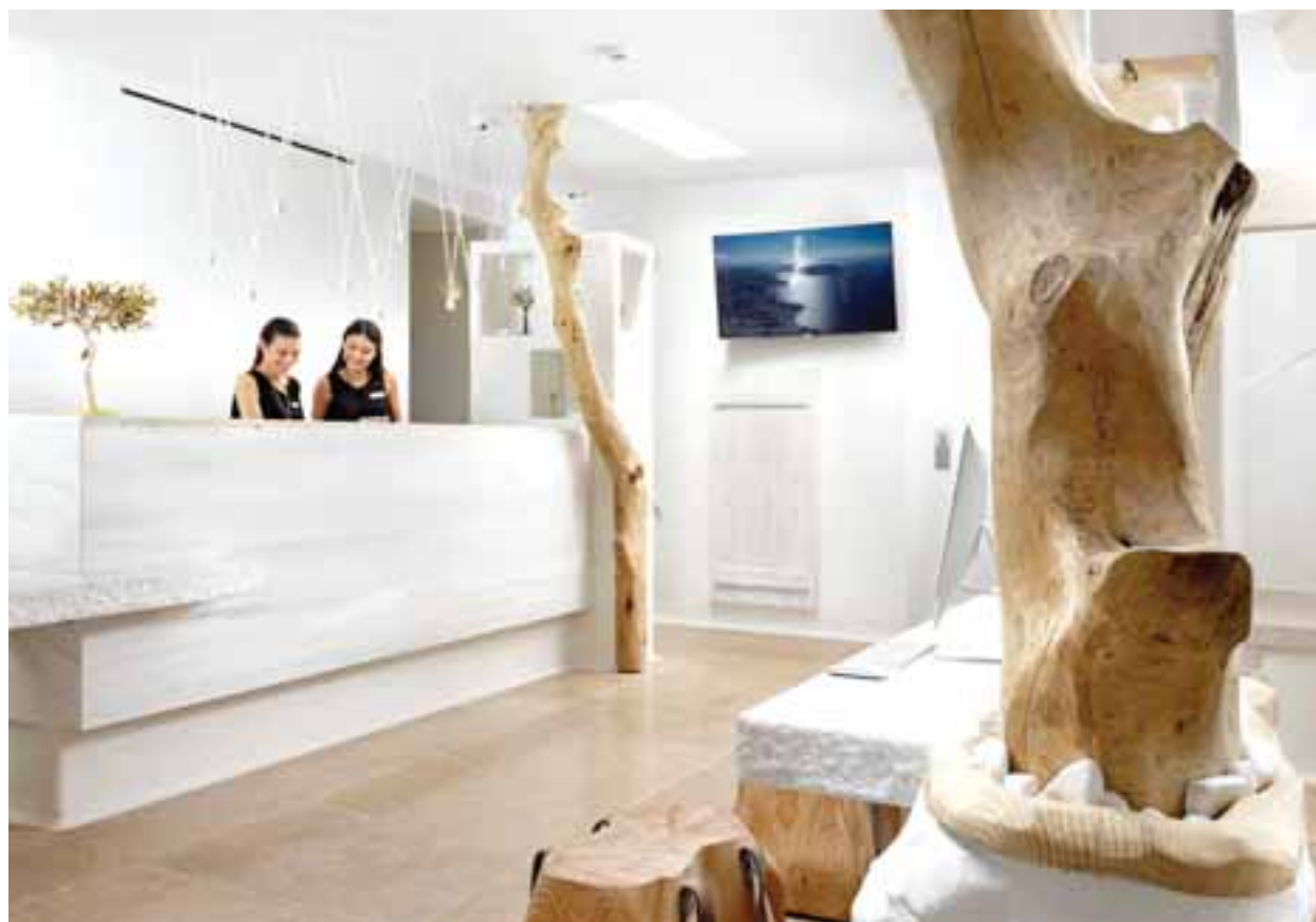
Για πρώτη φορά στην ξενοδοχειακή βιομηχανία θα χρησιμοποιούνται επίσημα οι χαρακτηρισμοί boutique και suite ξενοδοχεία. Οι προδιαγραφές για τέτοια ξενοδοχεία σχετίζονται με τον χαρακτήρα της διακόσμησης, της αρχιτεκτονικής και τον αριθμό των δωματίων.

διαπίστευση των οργανισμών κατάταξης διενεργείται από τον Κυπριακό Οργανισμό Πρόωθησης Ποιότητας, ο οποίος έχει οριστεί ως ο εθνικός οργανισμός διαπίστευσης, τον φορέα διαπίστευσης άλλου κράτους μέλους ή φορέα που συμμετέχει στην Πολυμερή Συμφωνία (Multilateral Agreement-MLA) με την Ευρωπαϊκή Συνεργασία για την Διαπίστευση (European Co-operation for Accreditation - EA). Ελάχιστη απαιτούμενη βαθμολογία βάσει προαιρετικών κριτηρίων για ξενοδοχεία πολυτελείας έχει οριστεί στους 2.200 βαθμούς, για τα ξενοδοχεία α' τάξης στους 1.500 βαθ-