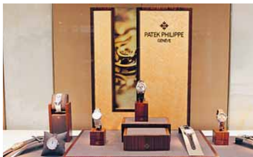
Μεταξύ των διασημών που φόρεσαν ένα Patek Philippe είναι η βασίλισσα Βικτωρία της Αγγλίας, η Μαρία Κιουρί, ο Λέων Τολστόι και οι Αλμπερτ Αϊνστάιν και Τζον Κένεντι.