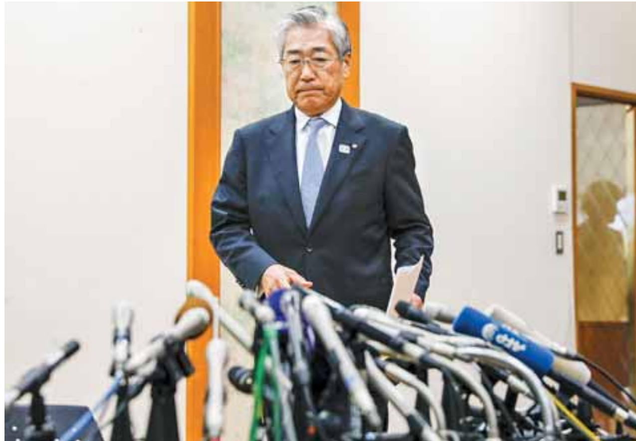
Ο επικεφαλής της ιαπωνικής ολυμπιακής επιτροπής, Τσουενεκάζου Τακέντα, κατηγορείται από τις γαλλικές αρχές για δωροδοκία ώστε το Τόκιο να αναλάβει τους Ολυμπιακούς του 2020.

Ενώ οι Ντιάκ αρνούνται οποιαδήποτε σχέση με το ποσό αυτό, ο κ. Τακέντα παραδέχεται την πληρωμή, αλλά λέει ότι δεν έχει καμία σχέση με εξαγορά ψήφων, παρά με την πληρωμή συμβουλευτικών υπηρεσιών «διά συμβολαίου που υπεγράφη με τις προβλεπόμενες διαδικασίες εγκρίσεως», όπως είπε σε συνέντευξη Τύπου ο μέχρι πρότινος υπεράνω πάσης υποψίας Ιάπωνας παράγοντας.