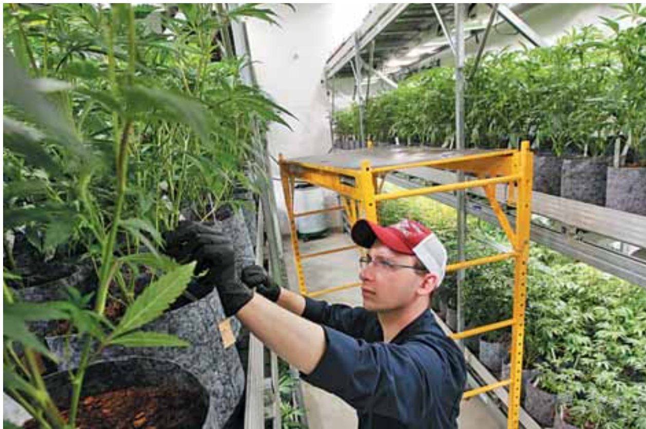
Οι αιτήσεις αφορούν επενδύσεις στις περιοχές: 7 στη Θήβα, 5 στο Κιλκίς, 3 στην Καστοριά, 2 στην Αττική και από μία σε Κορινθία, Σπάρτη, Ηλεία, Μεσολόγγι, Μαγνησία, Χαλκιδική, Φωκίδα και Πρέβεζα.

Σύμφωνα με ασφαλείς πληροφορίες της «Κ», πέραν των 12 φακέλων που ήταν υπό εξέταση τον περασμένο Νοέμβριο, όταν είχαν χορηγηθεί οι πρώτες άδειες, έχουν από τότε υποβληθεί στη Γενική Γραμματεία Βιομηχανίας άλλοι 14 νέοι φάκελοι, οι οποίοι αφορούν επενδύσεις συνολικού εκτιμώμενου ύψους 159,1 εκατ. ευρώ. Οι συνολικές επενδύσεις που προτείνονται στους 26 φακέλους –τους 12 παλαιότερους και τους 14 νέους– υπολογίζονται σε 344,1 εκατ. ευρώ και προβλέπουν τη δημιουργία 1.436 θέσεων εργασίας. Αφορούν δε αθροιστικά εκτάσεις άνω των 1.100 στρεμμάτων. Οι 26 αιτήσεις αφορούν επενδύσεις στις εξής περιοχές: 7 στη Θήβα, 5 στο Κιλκίς, 3 στην Καστοριά, 2 στην Αττική και από μία στην Κορινθία, τη Σπάρτη, την Ηλεία, το Μεσολόγγι, τη Μαγνησία, τη Χαλκιδική, τη Φωκίδα και