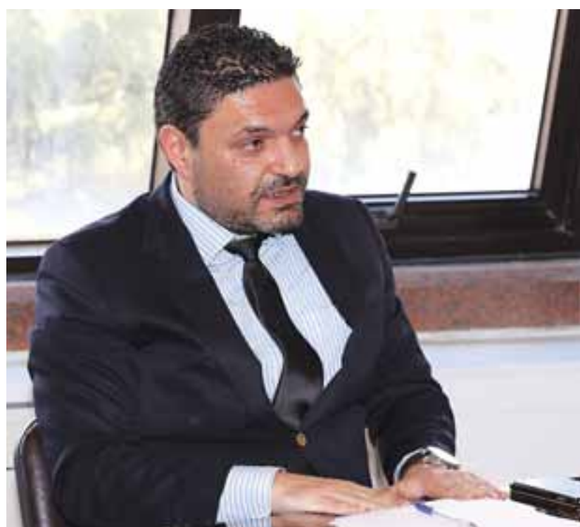
Είναι η πρώτη φορά που γίνεται μια τόσο δημιουργική και σοβαρή συζήτηση επί της ουσίας και επί όλων αυτών που αφορούν την Τοπική Αυτοδιοίκηση, τόνισε ο ΥΠΕΣ.

νομικά. Στο μέρος αυτό έχουν συμπεριληφθεί νέες διατάξεις που αφορούν στον ετήσιο προϋπολογισμό και στη διαδικασία έγκρισής του. Η βασικότερη διαφοροποίηση από το υφιστάμενο καθεστώς, αφορά μόνο στην απαίτηση της συμμόρφωσης για ισοσκελισμένους/πλεονασματικούς Προϋπολογισμούς, σύμφωνα με τον περί Δημοσιονομικής Ευθύνης και Δημοσιονομικού Πλαισίου Νόμο. Η εξέταση των Προϋπολογισμών των δήμων δεν θα επεκτείνεται και δεν θα αποτελεί έλεγχο σκοπιμότητας, ούτε σε σχέση με τα επί μέρους κονδύλια, ούτε σε σχέση με το Οργανόγραμμα του Δήμου. Ο Προϋπολογισμός του δήμου είναι ενιαίος, όμως το δημοτικό συμβούλιο με απόφασή του καθορίζει το ανώτατο ύψος του Προϋπολογισμού κάθε δημοτικού διαμερισματος. Περιλαμβάνεται επίσης σαφής διάταξη για την παραχώρηση της κρατικής χορηγίας και του τρόπου υπολογισμού της. Ο Προϋπολογισμός εγκρίνεται από τον Υπουργό Εσωτερικών με τη σύμφωνη γνώμη του Υπουργού Οικονομικών.