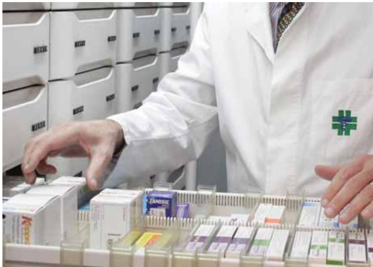
Ο Οργανισμός δεσμεύτηκε πως μετά την ολοκλήρωση εγγραφής των φαρμακείων στο ΓεΣΥ κατά τα επόμενα χρόνια, θα ελέγξει ποια θα ανοίγουν προκειμένου να κρατήσει τις ισορροπίες.

αναμονής περιμένοντας από την πολιτεία να κάνει κάποια ενέργεια προκειμένου να ανατραπεί η υφιστάμενη κατάσταση, αφού ως γνωστό θεωρεί πως ο προτεινόμενος σχεδιασμός εγκυμονεί πολλούς κινδύνους, ενώ παράλληλα συνεχίζεται ο «κορός» των ανακοινώσεων κατά του ΓεΣΥ από τις Επιστημονικές Εταιρείες. Επίσης, όπως αποκάλυψε η «Κ», ο Πανελλήνιος Ιατρικός Σύλλογος μέσω επιστολής στέλνει μήνυμα συμπαράστασης προς τον ΠΙΣ κλείνοντας την πόρτα στα όποια σεναρία ήθελε την κάθοδο γιατρών από την Ελλάδα στην Κύπρο για να καλύψουν τις όποιες ανάγκες υπάρχουν στο ΓεΣΥ. Όσον αφορά τις αντιδράσεις που προέκυψαν από Συντεχνίες και μη κυβερνητικές Οργανώσεις σε σχέση με τη διπλή συνεισφορά που θα κληθούν να καταβάλουν από την 1η Μαρτίου όλοι οι δημόσιοι υπάλληλοι για το ΓεΣΥ, όπως είναι σε θέση να γνωρίζει