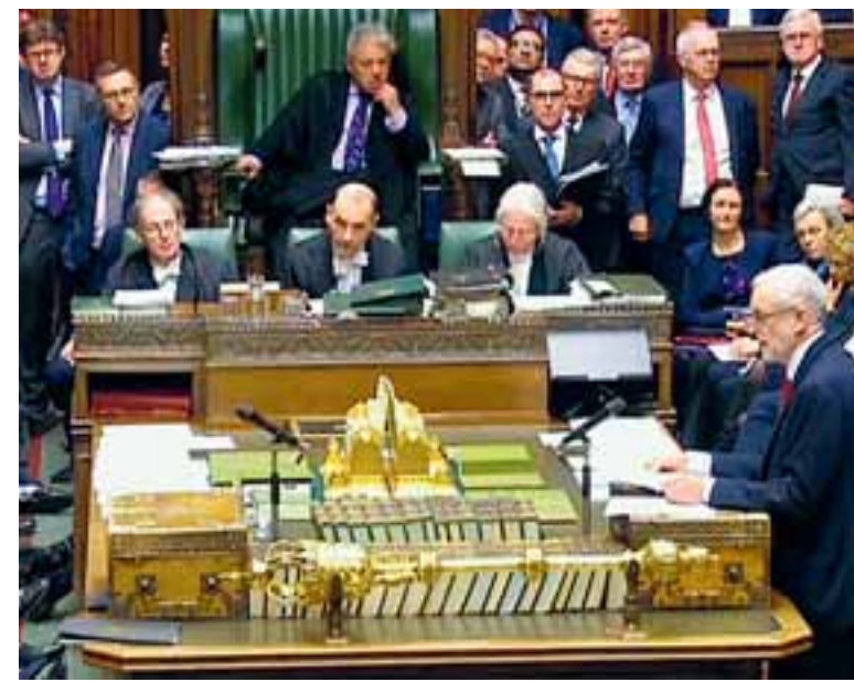
Ο Τζέρεμι Κόρμπιν κατέθεσε τροπολογία που ζητεί από την κυβέρνηση να προσανατολιστεί σε άλλες λύσεις, πλην της άτακτης εξόδου.

για το τι μπορεί να γίνει σε περίπτωση μη συμφωνίας, νομίζω ότι είναι προφανές», δήλωσε ο εκπρόσωπος της Κομισιόν Μαργαρίτας Σκοινάς. «Θα έχουμε σκληρά σύνορα». Με βάση τη Συμφωνία της Μεγάλης Παρασκευής, που έθεσε τέρμα στις συγκρούσεις ρωμαιοκαθολικών-προτεσταντών στο νησί, τα σύνορα