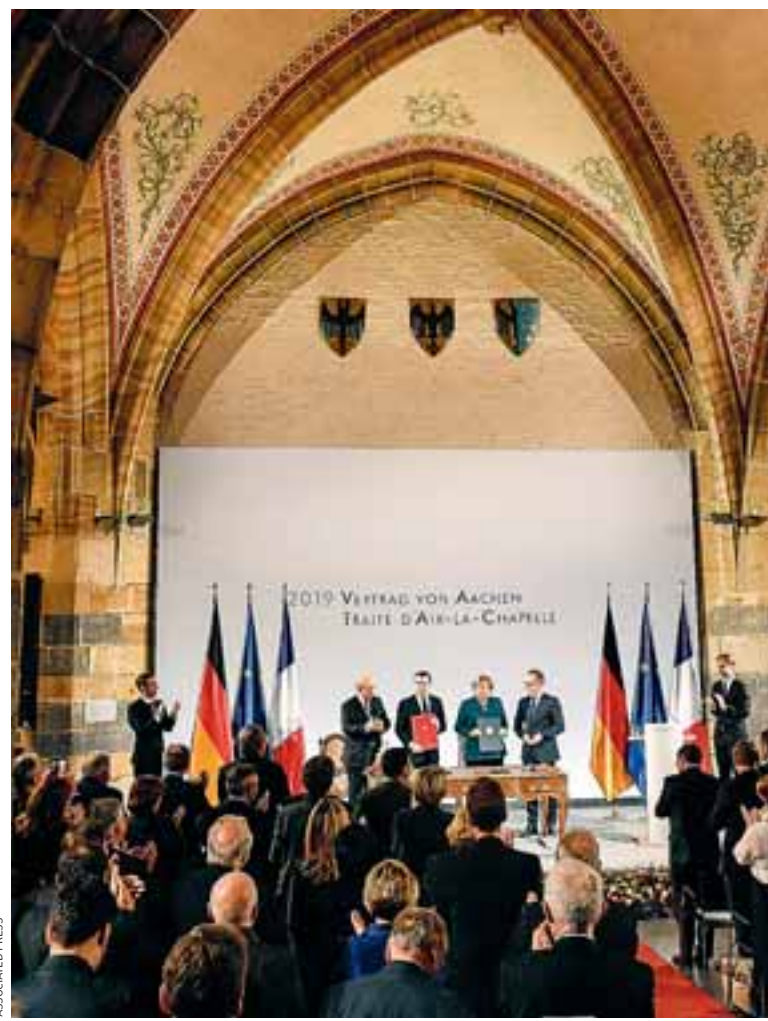
Οι ηγέτες και οι υπουργοί Εξωτερικών Γερμανίας και Γαλλίας στο ιστορικό δημαρχείο του Ααχεν, όπου οι Άγκελα Μέρκελ και Εμανουέλ Μακρόν υπέγραψαν νέα συνθήκη συνεργασίας.

Γεγονός είναι ότι από τη συμφωνία απουσιάζουν οι τολμυρές προτάσεις του Εμανουέλ Μακρόν για τη μεταρρύθμιση της Ευρωζώνης,