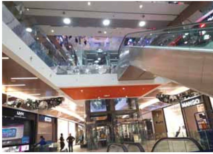
Στην έκταση 82 χιλιάδων τ.μ. του Mall φιλοξενοούνται 150 καταστήματα γνωστών διεθνών brands, εκ των οποίων κάποια ανοίγουν για πρώτη φορά στην Κύπρο.