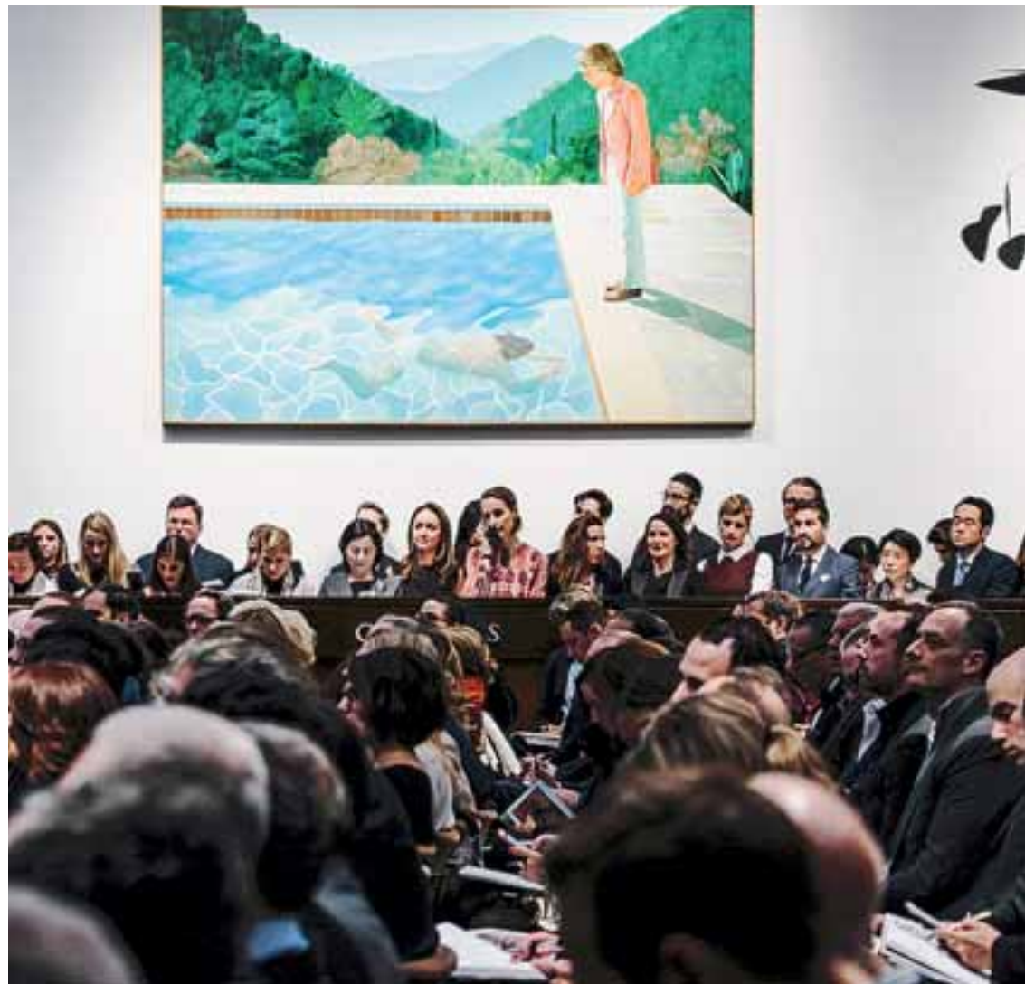
Το έργο «Το πορτρέτο ενός καλλιτέχνη» του Ντέιβιντ Χόκνεϊ εκτίθεται κατά τη διάρκεια της δημοπρασίας από τον οίκο Christie's.

Η προηγούμενη υψηλότερη τιμή για εν ζωή καλλιτέχνη ανήκει στο «Balloon dog» του Τζεφ Κουνς, που πωλήθηκε έναντι 58,4 εκατ. δολ. το 2013.