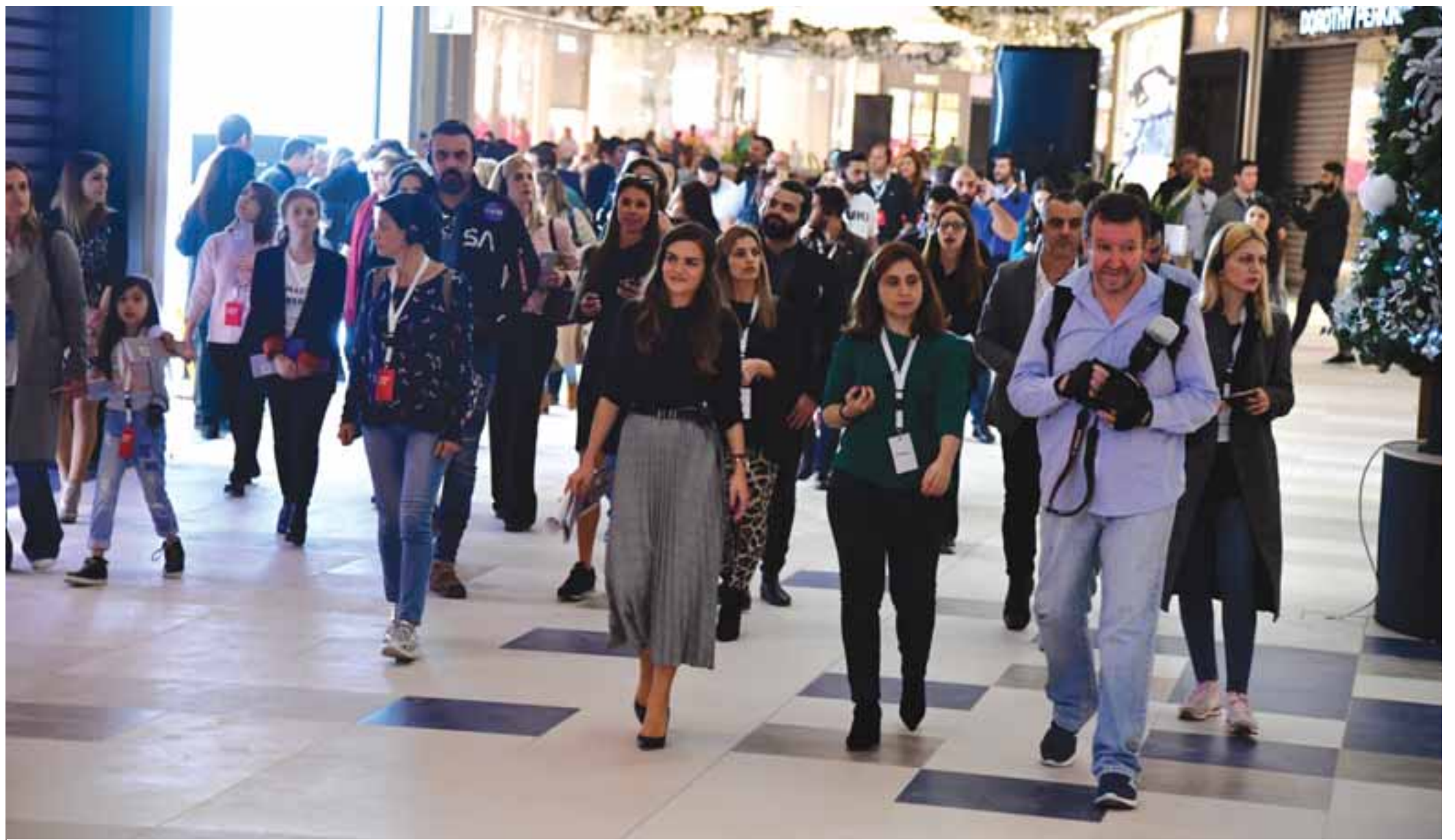
Το Nicosia Mall άνοιξε χθες τις πόρτες του για τους εκπροσώπους των ΜΜΕ, οι οποίοι ξεναγήθηκαν στους χώρους και τα νέα καταστήματα.

Όσον αφορά το υπόλοιπο 8% αυτό θα ανοίξει τις επόμενες δύο εβδομάδες. Στην περίπτωση της υπεραγοράς Αθηναϊτής, το άνοιγμα στο καταναλωτικό κοινό θα γίνει σταδιακά μέχρι την επόμενη εβδομάδα, οπότε και αναμένεται να λειτουργήσει κανονικά. Δηλαδή, αρχικά θα λειτουργήσουν όλα τα ράφια της υπεραγοράς ενώ σταδιακά θα λειτουργήσουν το κρεοπωλείο και το αρτοποιείο της υπεραγοράς. Στην περίπτωση του κινηματογράφου RIOCINEMAS, η πρεμιέρα του τοποθετείται χρονικά στις 14 Φεβρουαρίου.