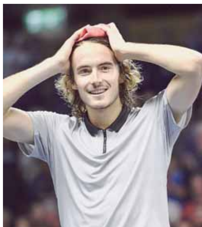
Ένα τεράστιο άλμα στην καριέρα του πραγματοποίησε ο σπουδαιότερος Έλληνας τενίστας και μάλιστα στην ηλικία των 20 ετών.