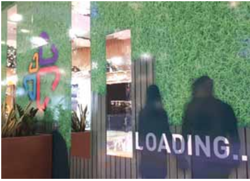
Ο κινηματογράφος Río θα προβάλει την πρώτη του ταινία 14 Φεβρουαρίου.