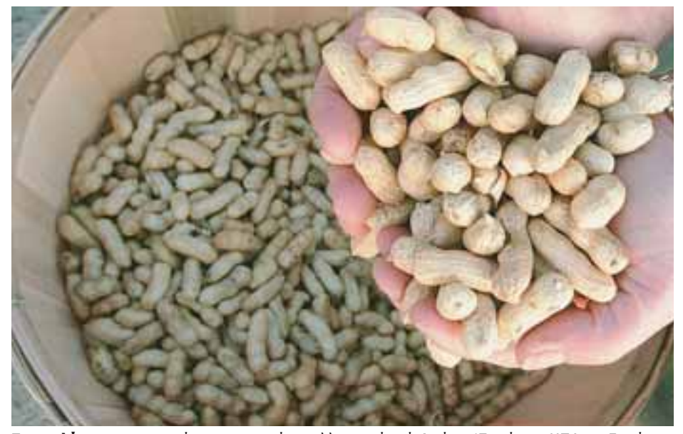
Στη μελέτη των επιστημόνων συμμετείχαν αλλεργικοί από 4 μέχρι 17 ετών σε ΗΠΑ και Ευρώπη.