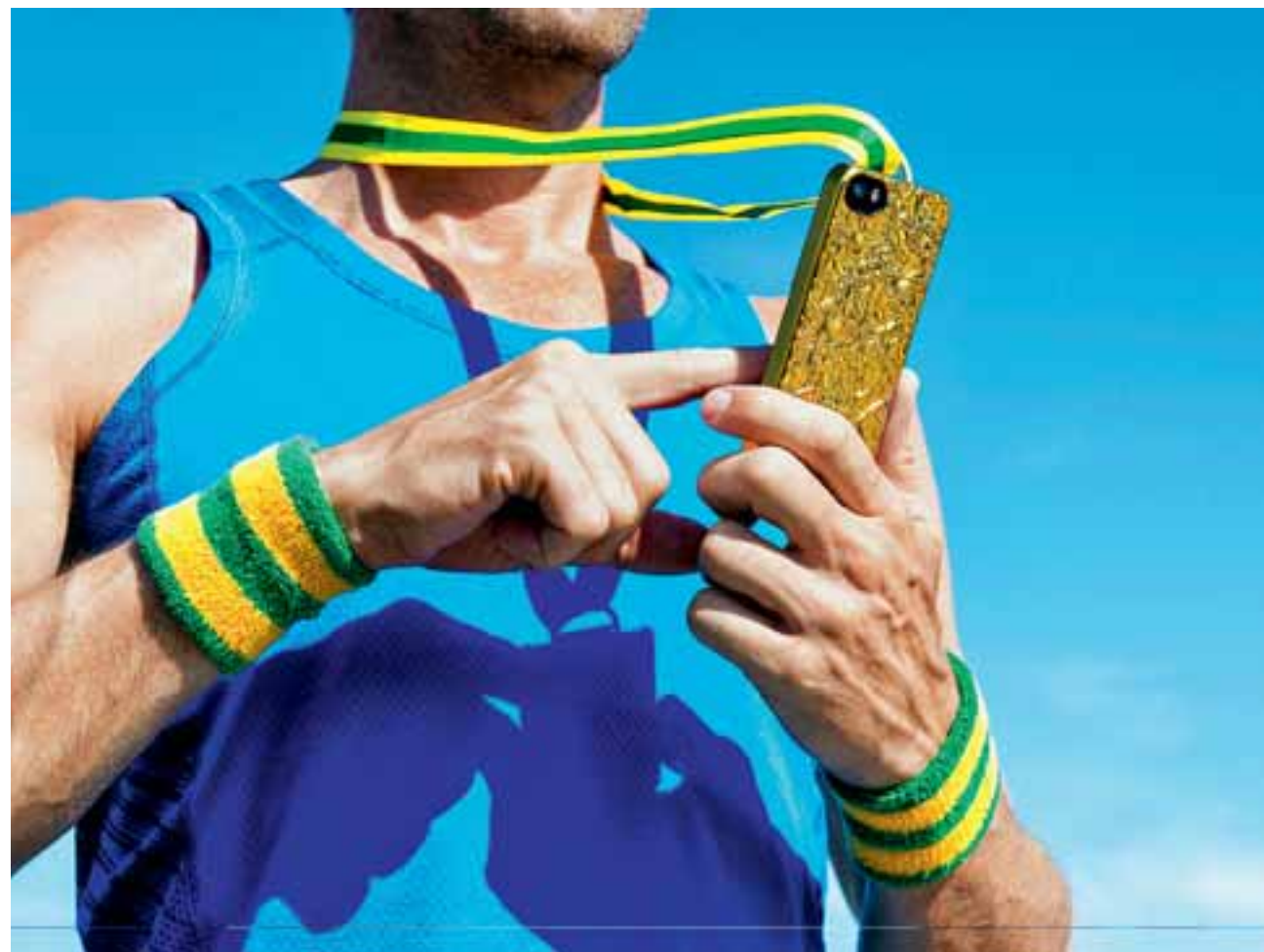
Στην εποχή που τα μέσα κοινωνικής δικτύωσης αποτελούν σημαντικό μέρος της καθημερινότητας, ο επαγγελματικός αθλητισμός συμμετέχει ενεργά σε μια διαδρομή που θυμίζει πολλές φορές μάχη επιβίωσης.

Κατερίνα Στεφανιδίδη δεν φαίνεται να δίνει τόσο μεγάλη σημασία. Το «χρυσό» κορίτσι του επί κοντώ, παρόλο που δεν «ανεβάζει» συνεχώς «ποστ», έχει 71.000 στο Instagram και 35.000 στο Facebook. «Έχει τύχει κάποιες εταιρείες να μας πουν ότι επειδή δεν έχουμε τις κατάλληλες αλληλεπιδράσεις, παρά τις διακρίσεις μας, δεν ενδιαφέρονται», αποκάλυψε στην «Κ» η Μαρία Μπόζη, η οποία μαζί με τη Ραφαλίνα Κλωναρίδου θεωρούνται οι κορυφαίες νέες ιστιοπλόοι της χώρας μας στα 470.