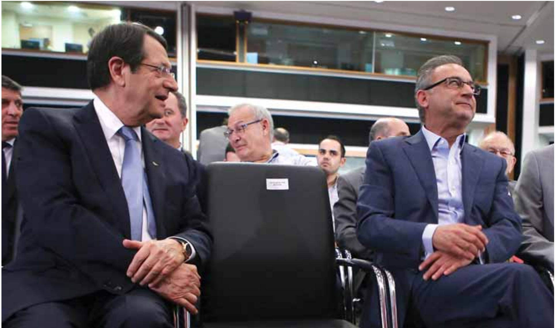
Ο Νίκος Αναστασιάδης και ο Αβέρωφ Νεοφύτου αποτελούν δύο διαφορετικούς χαρακτήρες, πολλές φορές συγκρούστηκαν, ωστόσο, όπως όλοι συμφωνούν και οι δύο ενώνονται όταν υπάρχει ανάγκη να διατηρήσει το κόμμα την ηρωιά.

Οι δύο πολιτικοί άνδρες έχουν δείξει πως είναι εκ διαμέτρου αντίθετοι χαρακτήρες. Και μπορεί όσο ο Νίκος Αναστασιάδης ήταν πρόεδρος του κόμματος και ο Αβέρωφ Νεοφύτου δεύτερο βιολί να βοηθούσε την κατάσταση αυτή η «ασυμφωνία» χαρακτήρων, όμως τώρα τι γίνεται; Ο Αβέρωφ Νεοφύτου άρχισε να δείχνει τη διαφωνία του σε ζητήματα που αφορούσαν το Κυπριακό από την πρώτη διακυβέρνηση. Αμέσως μετά τη διάσκεψη στο Κραν Μοντάνα, αποσύρθηκε—όχι και τόσο διακριτικά—από το προσκήνιο, σημειώνοντας στον περίγυρο πως είχε ανάγκη για διακοπές. Το κατά πόσο όμως η απόσυρσή του είχε να κάνει με