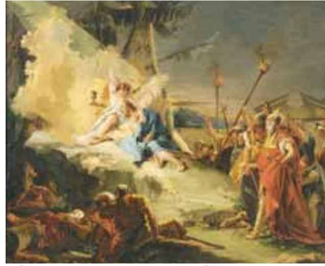
Τσιόλο Τζοβάννι-Μπαττίστα (1696-1770), «Η προσευχή στον κήπο της Γεθσημανής». Δωρεά Πολυτεχνείου.