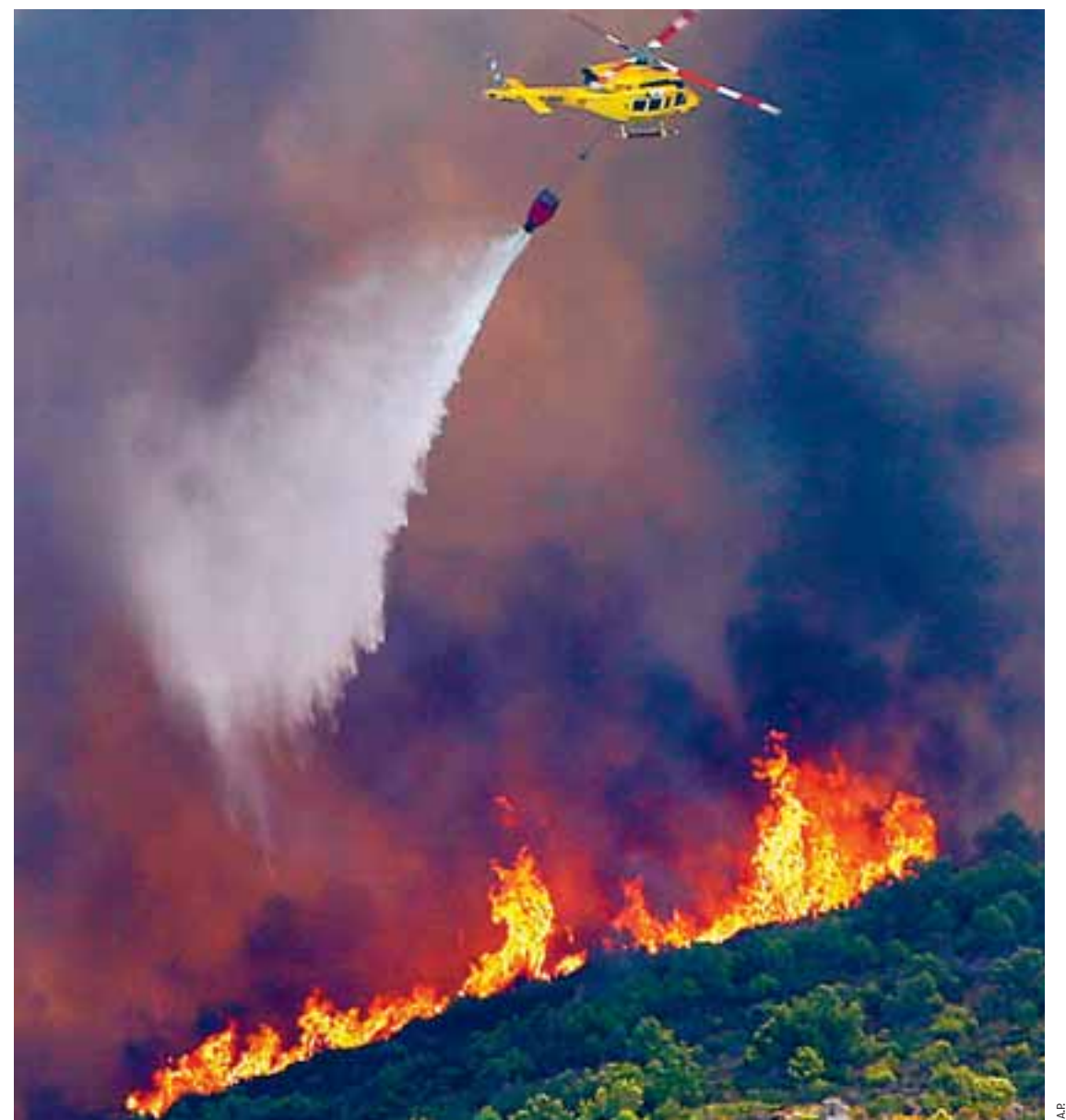
Οι ευρωπαϊκές χώρες του Νότου είναι περισσότερο ευάλωτες σε φαινόμενα ακραίας θερμότητας και πυρκαγιών εν αντιθέσει με τις βόρειες ευρωπαϊκές χώρες, που είναι περισσότερο ευάλωτες σε πλημμύρες.

Σύμφωνα με την κεντρική τράπεζα, όσοι μολύνουν περισσότερο το περιβάλλον αλλά και όσες επιχειρήσεις εδρεύουν σε περιοχές που είναι πιο εκτεθειμένες σε