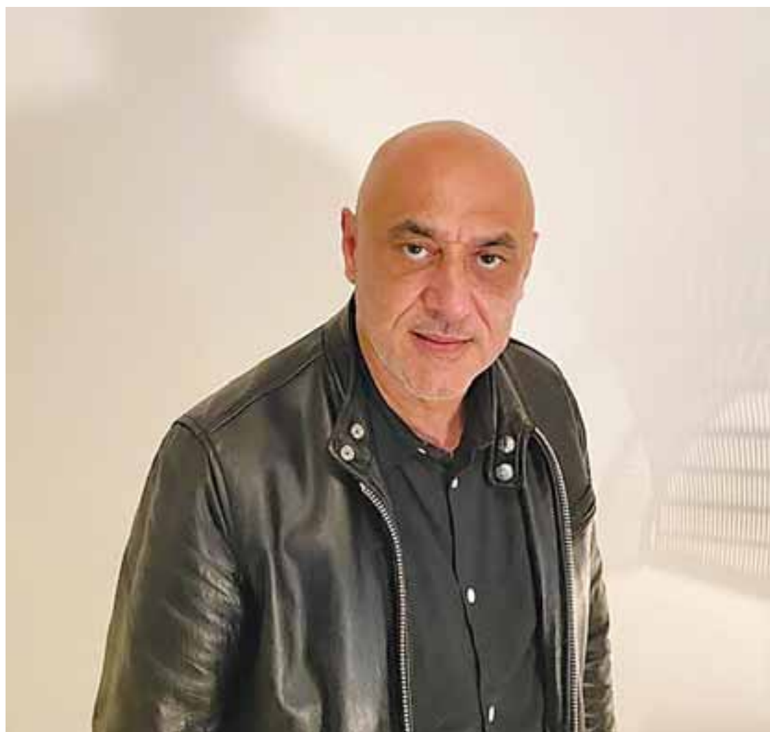
«Μπορεί σε παλαιότερες εποχές αλλά και έργα να αφιέρωνα περισσότερο χρόνο για τη δημιουργία του έργου, τώρα νιώθω αμέτρητα λυτρωμένος από το τεχνικό τμήμα του έργου» είπε ο καλλιτέχνης στην «Κ».

–Η διάρκεια δημιουργίας του έργου είναι το λιγότερο σημαντικό τμήμα της στοιχειοθέτησής του. Η επεξεργασία του έργου δεν έχει