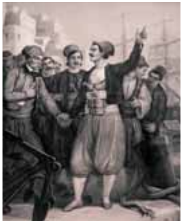
«Ο Οικονόμος κηρύττει εν Υδρα την ελευθερίαν». Από το λεύκωμα «Πάνθεο Ηρώων του '21», με σχεδιαστή τον Peter Von Hess και χαράκτη τον H. Kohler.