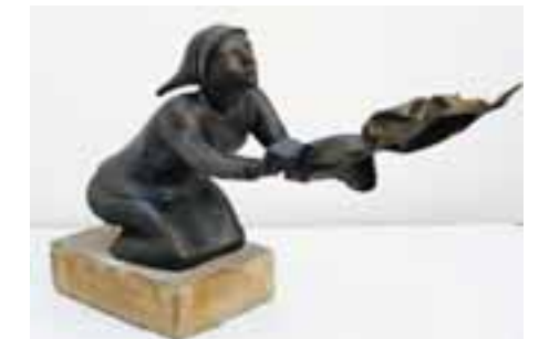
Καπράλος Χρήστος (1909-1993), «Η πλύστρα (παραλλαγή), 1970. Πρώην Ιδρυμα Χρήστου και Σούλης Καπράλου.