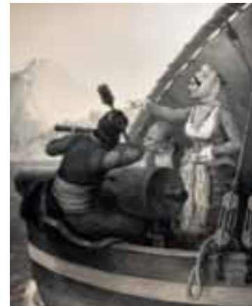
«Η Μπουμπουλίνα αποκλείει την Ναυπλία». Από το λεύκωμα «Πάνθεο Ηρώων του '21», με σχεδιαστή τον Peter Von Hess και χαράκτη τον H. Kohler.