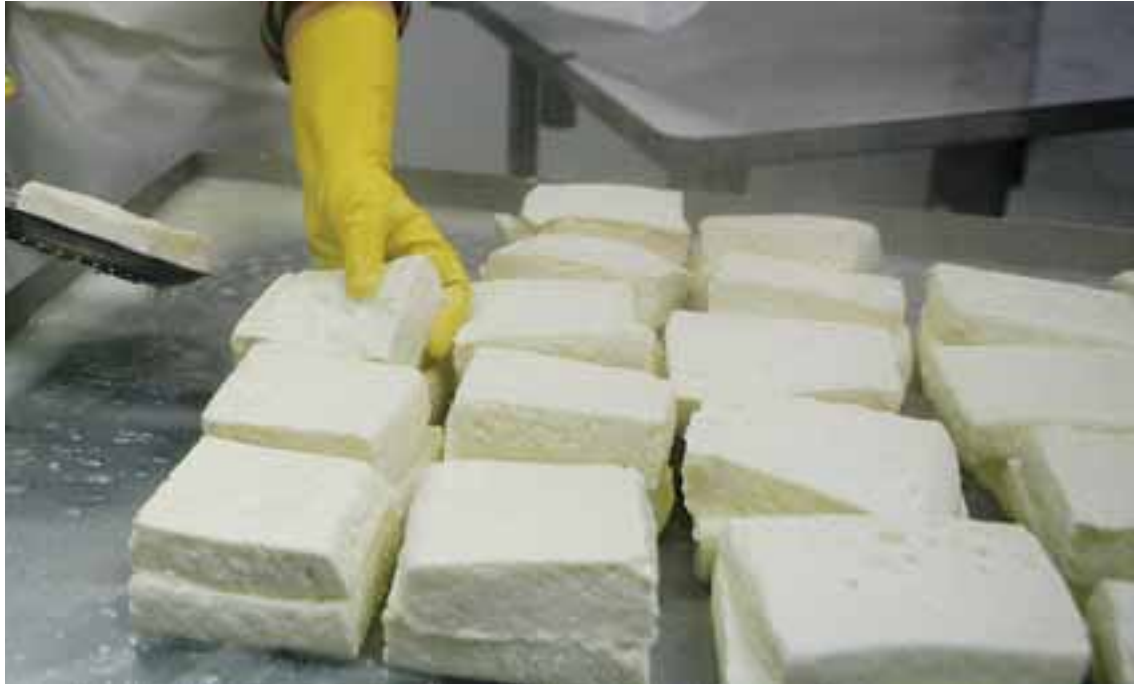
Τον Απρίλιο θα ανακοινωθούν ειδικά μέτρα για στήριξη επενδύσεων στην αιγοπροβατοτροφία με προϋπολογισμό αρκετών εκατομμυρίων, σημειώνει ο υπουργός Γεωργίας.

ϊόντος, ανοίγει η αγορά, ενισχύει το brand name του και αποτελεί αφετηρία για προσέλκυση επενδυτικού ενδιαφέροντος. Αυτή την άποψη συμμερίζονται Έλληνες παραγωγοί. Κάποιοι ήδη άρχισαν τη δραστηριότητά τους στην κυπριακή αγορά, κάποιοι άλλοι ετοιμάζονται, ενώ άλλοι το βλέπουν ακόμα σε θεωρητικό επίπεδο. Στα εσωτερικά της κυπριακής αγοράς, αυτό που θα πρέπει να περιμένουμε είναι επενδύσεις στον τομέα, στον κλάδο της αιγοπροβατοτροφίας. Προς αυτή την κατεύθυνση κινείται το πλάνο του Υπουργείου Γεωργίας με τον υπουργό Κώστα Καδή να δηλώνει στην «Κ» ότι «μέσα στις επόμενες προκηρύξεις του προγράμματος