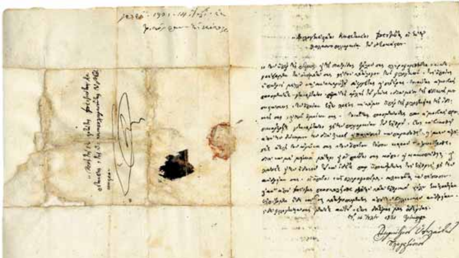
Ο Δημήτριος Υψηλάντης προτρέπει τους Σπετσιώτες καπετάνιους να συνεχίσουν την πολιορκία του Νεοκάστρου (Πύλος/Ναυαρίνο) επισμαίνοντας ότι η φιλογένεια (πατριωτισμός) και η ανδρεία τους θα ανταμειφθούν. Τρίκορφα, 14 Ιουλίου 1821.