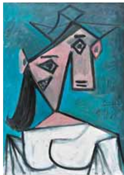
◀ Πικάσσο Πάμπλο (1881-1973), «Γυναικείο κεφάλι», 1939. Δωρεά του καλλιτέχνη στον ελληνικό λαό, τιμητική προσφορά για τη γενναία αντίστασή του στη διάρκεια της ναζιστικής Κατοχής