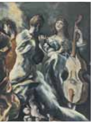
Γκόγια υ Λουθιέντες Φρανθίσκο (1746-1828), «Βάρβαροι!», 1823.