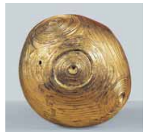
Τάκις (1925-2019), «Εσωτερικός χώρος», 1957. Δωρεά Αλέξανδρου Ιόλα.