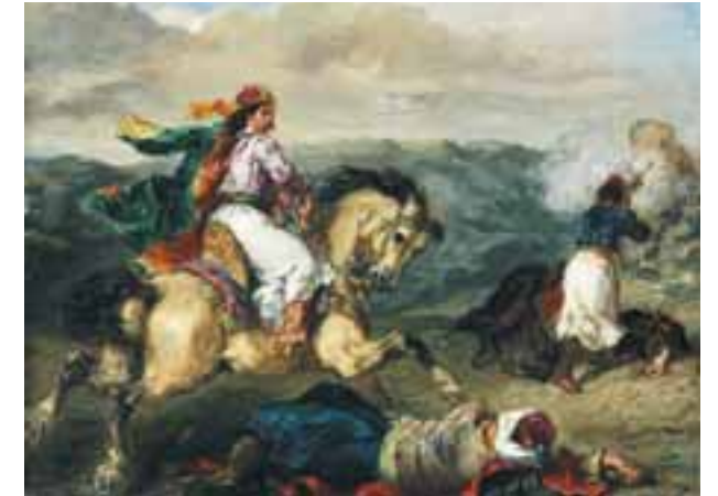
Ντελακρουά Εζέν (1798-1863), «Επεισόδιο του Ελληνικού Αγώνα», 1856.