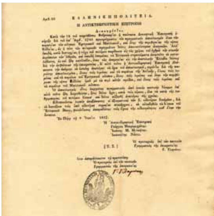
Διακήρυξη της Αντικυβερνητικής Επιτροπής για τον ναυτικό αποκλεισμό των λιμανιών και παραλίων της Αττικής, Πόρος, 9 Ιουνίου 1827.

ισχυρό εμπορικό στόλο, όπως ήταν ο ελληνικός των αρχών του 19ου αιώνα, σε αξιόμαχο πολεμικό προς έκπληξη των ξένων δυνάμεων.