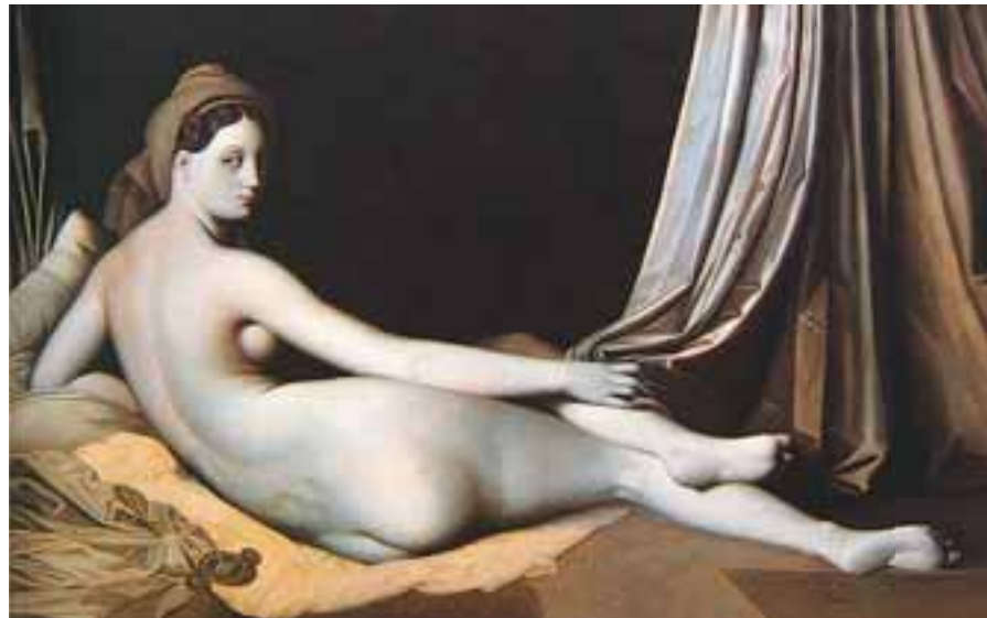
Ζαν Ογκύστ Ντομνίκ Ενγκρ (1780-1867), «Η μεγάλη οδάλισκ», 1814. Μουσείο του Λούβρου. Παρουσιάστηκε στην έκθεση «Από τον Θεοτοκόπουλο στον Σεζάν».

1992: Εγκαινιάζεται η περιοδική έκθεση «Από τον Θεοτοκόπουλο στον Σεζάν». Περιλαμβάνει 72 αριστουργήματα από το Μητροπολιτικό Μουσείο της Νέας Υόρκης και από την Εθνική Πινακοθήκη της Ουάσινγκτον και την επισκέπτονται πάνω από 600 χιλιάδες άτομα.