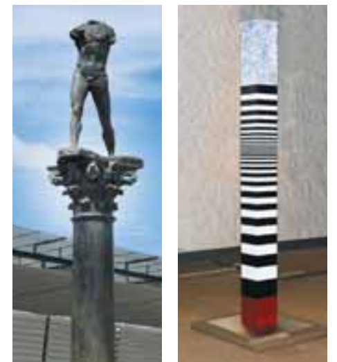
Ροντέν Ωγκύστ (1840-1917), «Ο άνθρωπος που βαδίζει πάνω σε κολόνα», 1900. Δωρεά Εθνικής Τράπεζας της Ελλάδος. Ζούνη Ου (1941-2008), «Λευκός κίονας», 1991. Δωρεά της καλλιτέχνης.