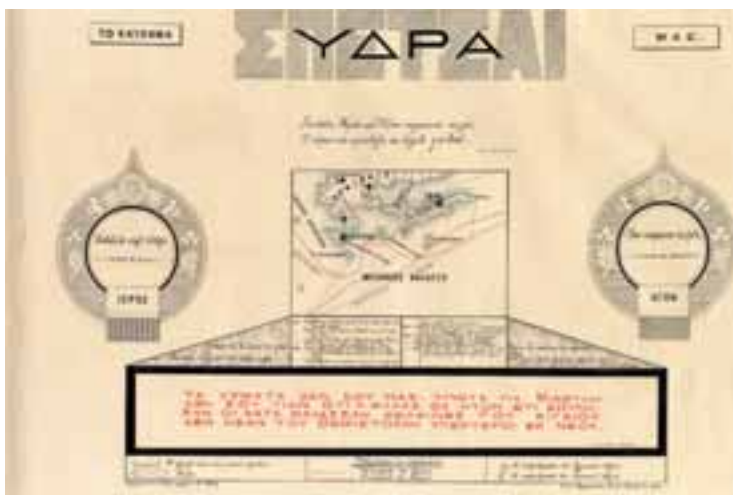
Ιστορικός χάρτης Υδρας και Σπετσιών με χρονολόγιο γεγονότων της επαναστατικής περιόδου. Λειψία, 1887.