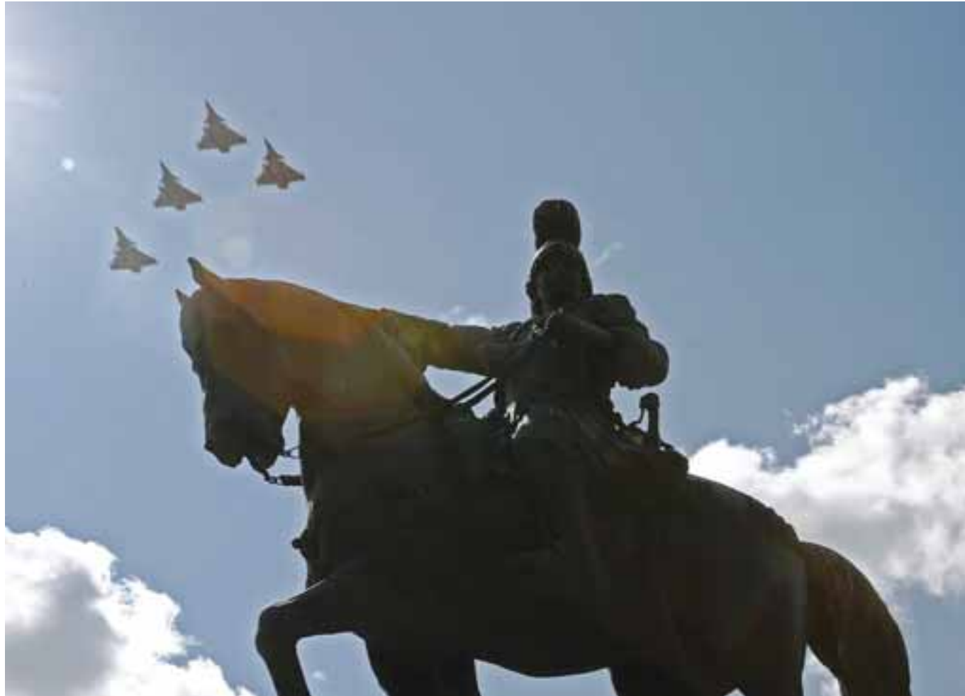
Από την Κύπρο έως το Καστελόριζο, τις Οινούσσες και τον Έβρο, από την Ήπειρο, τον Μοριά και την Κρήτη, τη μακρινή Αυστραλία έως και την Αμερική, όπου υπάρχουν Έλληνες το 1821 φάρος λαμπρός στην ψυχική και στις καρδιές.

Πάντως , από δημοσκοπήσεις αυτή την περίοδο δεν πρέπει να έχουμε παράπονο, όπως επίσης παράπονο δεν πρέπει να