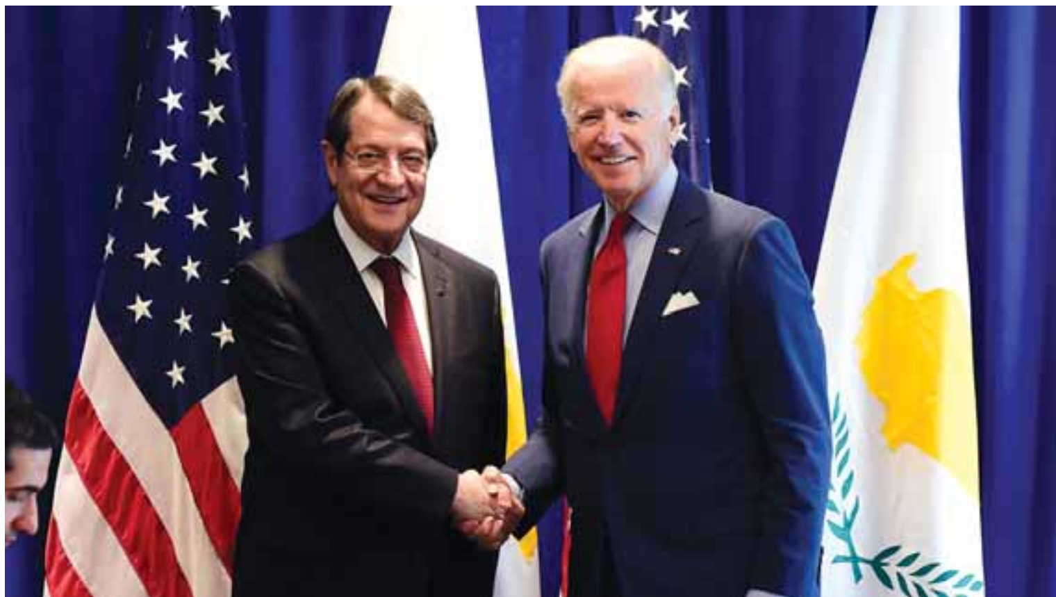
Τι προτιμάς τηλεφώνω ή επίσκεψη;

Άγχος, νεύρα, προσχέδια Πολύ ήταν το άγχος και του Νίκου Αναστασιάδη και του Νίκου Χριστοδουλίδη για τα τελικά συμπεράσμα-