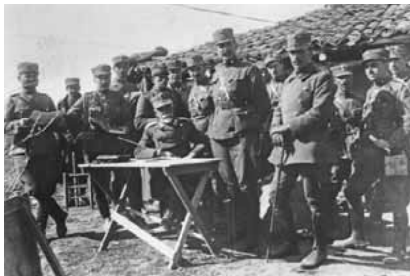
Ανώτατοι και ανώτεροι αξιωματικοί του Γ' Σώματος Στρατού, το οποίο σήκωσε το κυρίως βάρος της ειρηνικής επίθεσης τον Μάρτιο του 1921.

Αν το 1920 η απόφαση του τότε αρχηγού Στρατιάς Λεωνίδα Παρασκευόπουλου να καταλάβει την Προύσα είχε προκαλέσει την οργή του Βενιζέλου, στις αρχές του 1921 η διεύρυνση του μετώπου και, κυρίως, η διεύρυνση εντός της τουρκικής ενδοχώρας, πήρε δραματικές διαστάσεις. Στη μεγάλη ειρηνική επίθεση του Γ' Σώματος Στρατού τον Μάρτιο του 1921 βορείως του Εσκή Σεχίρ, για πρώτη φορά οι ελληνικές μονάδες υπέστησαν τεράστιες απώλειες δίχως να επιτευχθεί ο αντικειμενικός σκοπός. Επρόκειτο για την πρώτη, ουσιαστικά, ήττα της Στρατιάς Μικράς Ασίας.