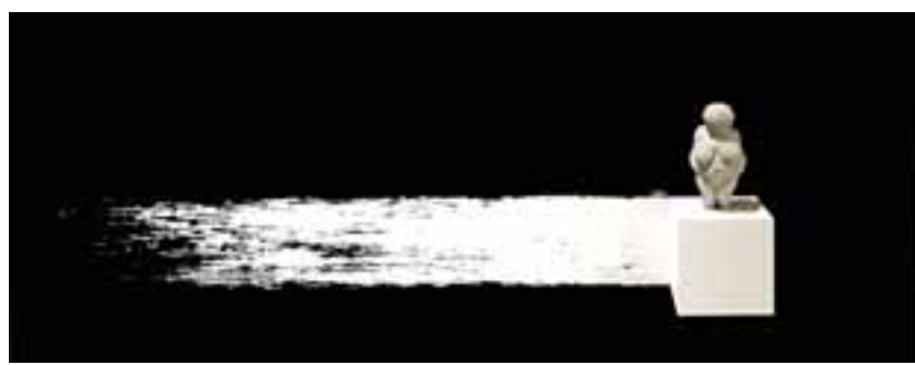
Έργο από την έκθεση, κβαντική θλιυκότητα.