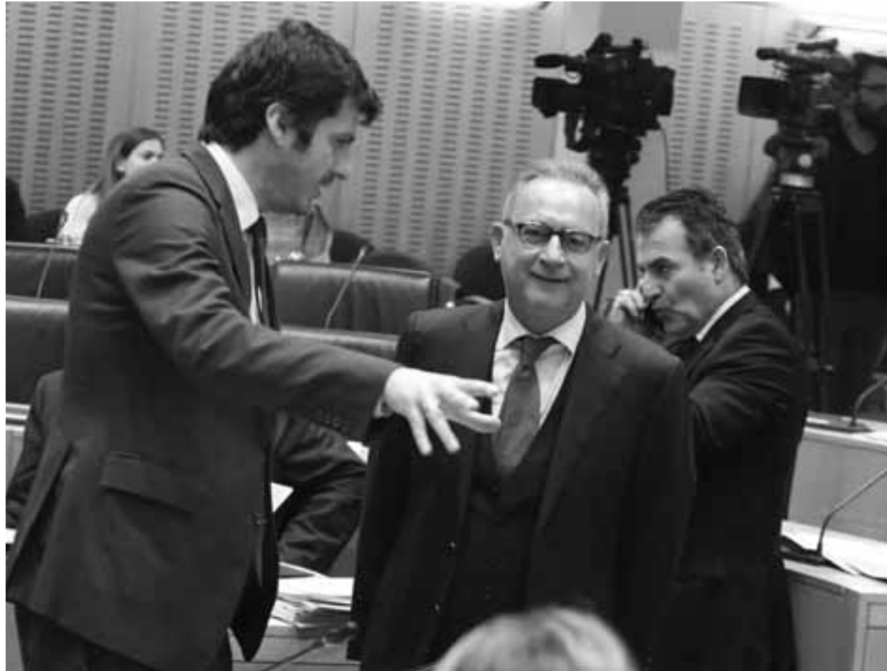
Ο ΔΗΣΥ από το 2013-2017 είχε δημιουργήσει ένα πολιτικό κεφάλαιο κυρίως λόγω της οικονομίας, το οποίο από τότε χρησιμοποιεί χωρίς να κεφαλαιοποιεί και τείνει να εξαντληθεί.