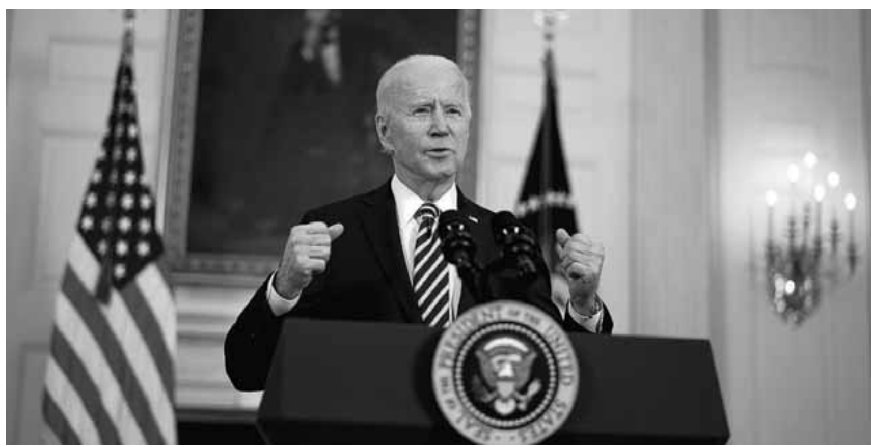
Η JPMorgan Chase εκτιμά πως «η δημοσιονομική ώθηση» που θα προσφέρουν στην αμερικανική οικονομία οι δαπάνες της κυβέρνησης θα προσθέσει 1,8% στο αμερικανικό ΑΕΠ φέτος. Για την Ευρώπη προβλέπει ότι οι αντίστοιχες πολιτικές θα μειώσουν το ΑΕΠ της κατά 0,1%.

Αν, όμως, δεν πάνε κατ' ευχήν, η Γηραιά Ήπειρος θα έχει προβλήματα για μεγάλο χρονικό διάστημα. «Το θέμα είναι τι θέλουμε να επιτύχουμε» δηλώνει ο Κάρστεν Μπρτζέσκι, οικονομολόγος της ING στη Γερμανία και διευκρινίζει, «θέλουμε αυτήν τη βραχυπρόθεσμη τόνωση ή να χρησιμοποίησουμε τα χρήματα για να βελτιώσουμε τη