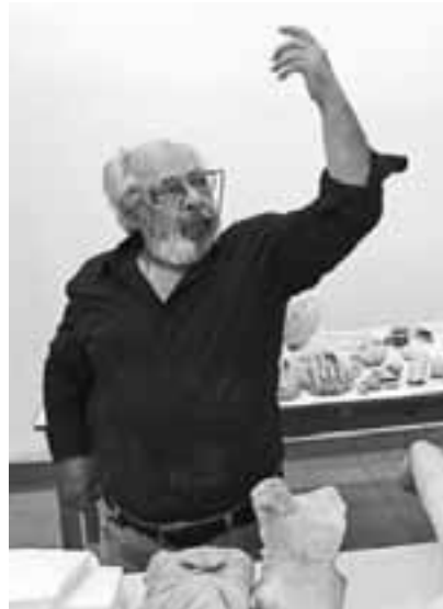
Ο Γ. Δεσπίνης στο εργαστήριο γλυπτών του Μουσείου Καλύμνου, στην προετοιμασία της έκθεσης του 2006.

Ο Γιώργος Δεσπίνης (1936-2014), ομότιμος καθηγητής της Κλασικής Αρχαιολογίας στο ΑΠΘ, υπήρξε ένας από τους σημαντικότερους μελετητές της αρχαίας ελληνικής πλαστικής στον κόσμο. Και παράλληλα ένας άνθρωπος σπάνιου ήθους, που αδιαφόρησε για την αυτοπροβολή και στάθηκε πάντοτε μακριά από σκοπιμότητες. Σπούδασε στην Ελλάδα και στη Γερμανία, δίδαξε, μελέτησε εις βάθος το αντικείμενό του, διακρίθηκε διεθνώς, και το 2007 βραβεύ-