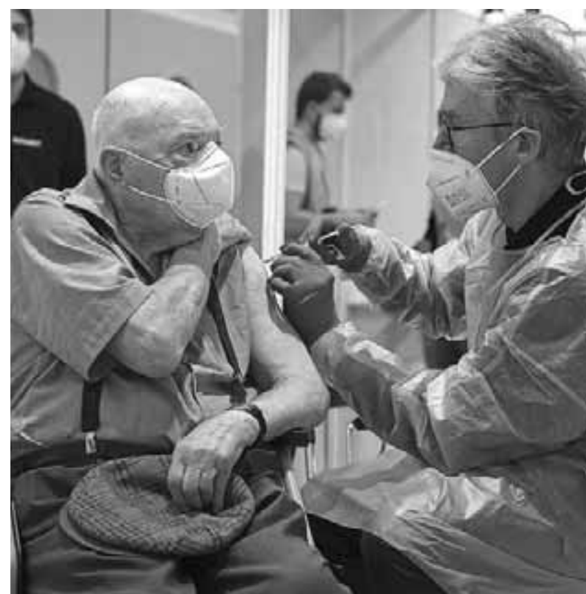
Η μετανάστευση εντός Ε.Ε. παίζει όλο και σημαντικότερο ρόλο στην κάλυψη της ζήτησης σε νέους εργαζομένους στον χώρο της Υγείας.

ρά πολιτικών πρωτοβουλιών για να στηρίξει τις χώρες της Ε.Ε. στην αντιμετώπιση των προκλήσεων της γήρανσης του πληθυσμού και των επιπτώσεων στους τομείς της υγείας και της μακροχρόνιας φροντίδας, συμπεριλαμβανομένων των πρώτων βημάτων προς μια Ευρωπαϊκή Ένωση Υγείας. Με την πρόσφατη «Πράσινη Βίβλο» που εξέδωσε η Επιτροπή για το θέμα ξεκίνησε μια ευρεία δημόσια διαβούλευση, μεταξύ άλλων, σχετικά με τον τρόπο ορισμού ανθεκτικών συστημάτων υγείας και μακροχρόνιας περίθαλψης. Μια άλλη σημαντική πρωτοβουλία που πρόκειται να παρουσιαστεί σύντομα είναι το σχέδιο δράσης για τον Ευρωπαϊκό Πύλο Κοινωνικών Δικαιωμάτων. Ο πυλώνας παρέχει μια πυξίδα για την αντιμετώπιση των κοινωνικών και οικονομικών προκλήσεων της εποχής μας, συμπεριλαμβανομένων της δημογραφικής αλλαγής.