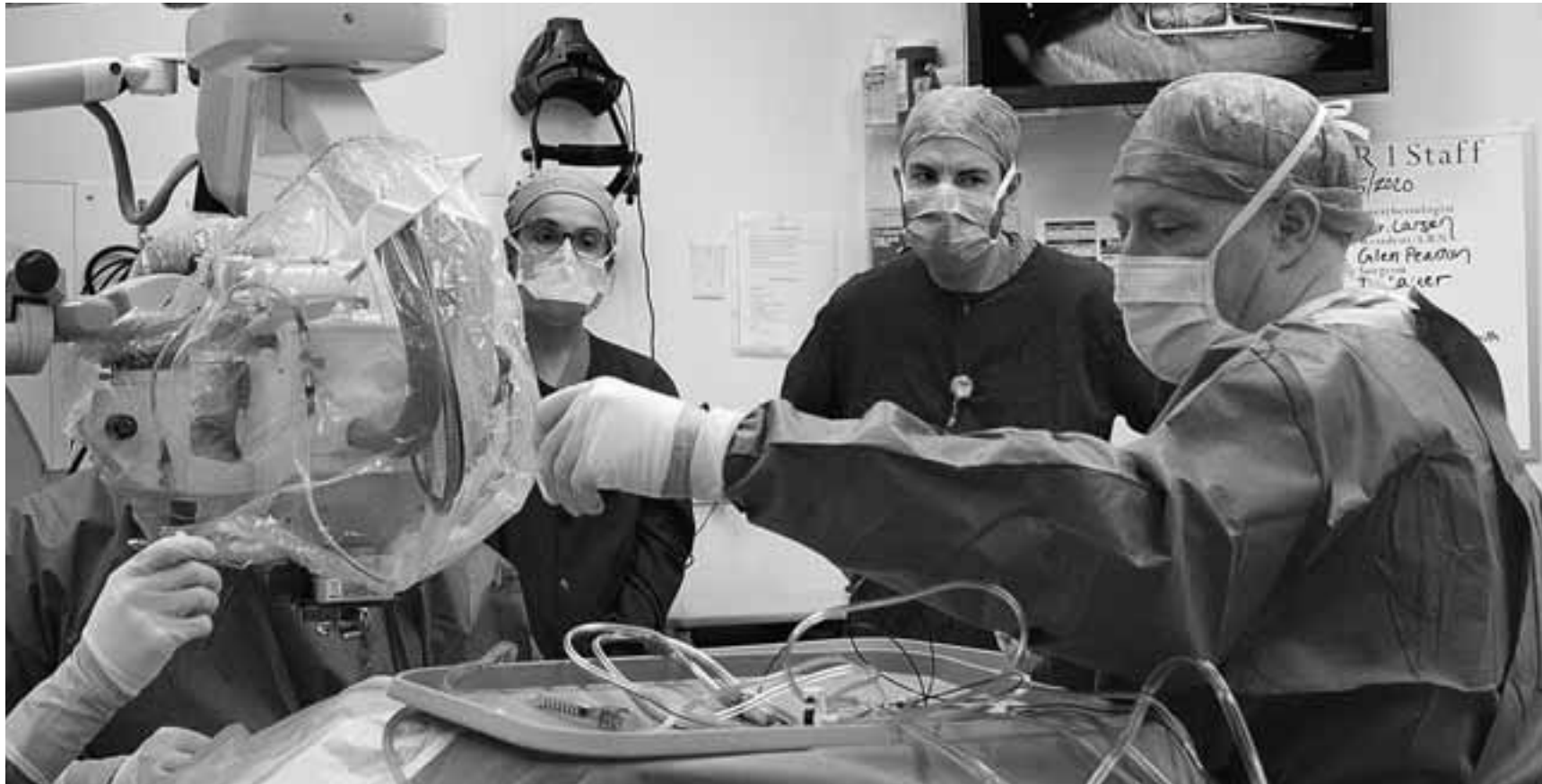
Επιστήμονες στο Ινστιτούτο Casey Eye, στο Πόρτλαντ του Ορεγκόν, επιχειρήσαν πριν από ένα χρόνο με την τεχνική Crispr να θεραπεύσουν και να επαναφέρουν την όραση ενός ασθενούς, που είχε μια σπάνια μορφή κληρονομικής τύφλωσης.

η αναζήτηση των γονιδίων που συμβάλλουν στην εμφάνιση νοσημάτων. Παρότι δεν έλαβαν την καθολική απάντηση που αναζητούσαν, εντόπισαν τα γενετικά αίτια κάποιων. Η επόμενη σκέψη λοιπόν ήταν η εξεύρεση τρόπου «επιδιόρθωσης» των ένοχων γονιδίων. Αυτό ακριβώς το πρόβλημα έλυσαν, περίπου το 2012, η βιοχημικός Τζέινερ Ντούντνα και η μικροβιολόγος Εμμανουέλ Σαρπαντιέ, οι οποίες πέρυσι βραβεύθηκαν με Νομπέλ Χημείας. Με την εργασία τους συνέβαλαν στην ανάπτυξη της γενετικής τεχνικής Crispr-Cas9, ενός «μοριακού ψαλιδιού», που επιτρέπει την κατά βούληση τροποποίηση του γενετικού μας υλικού. Στην πραγματικότητα, η Crispr-Cas9 είναι το μολύβι για να ξαναγράψουμε το «Βιβλίο της Ζωής», όπου είναι αναγκαίο, αλλά και όπως θέλουμε. Κατά πόσο η καινοτόμος μέθοδος θα ανοίξει ένα λαμπρό δρόμο για την εξάλειψη των γενετικών μας δεινών ή ένα υπερ-