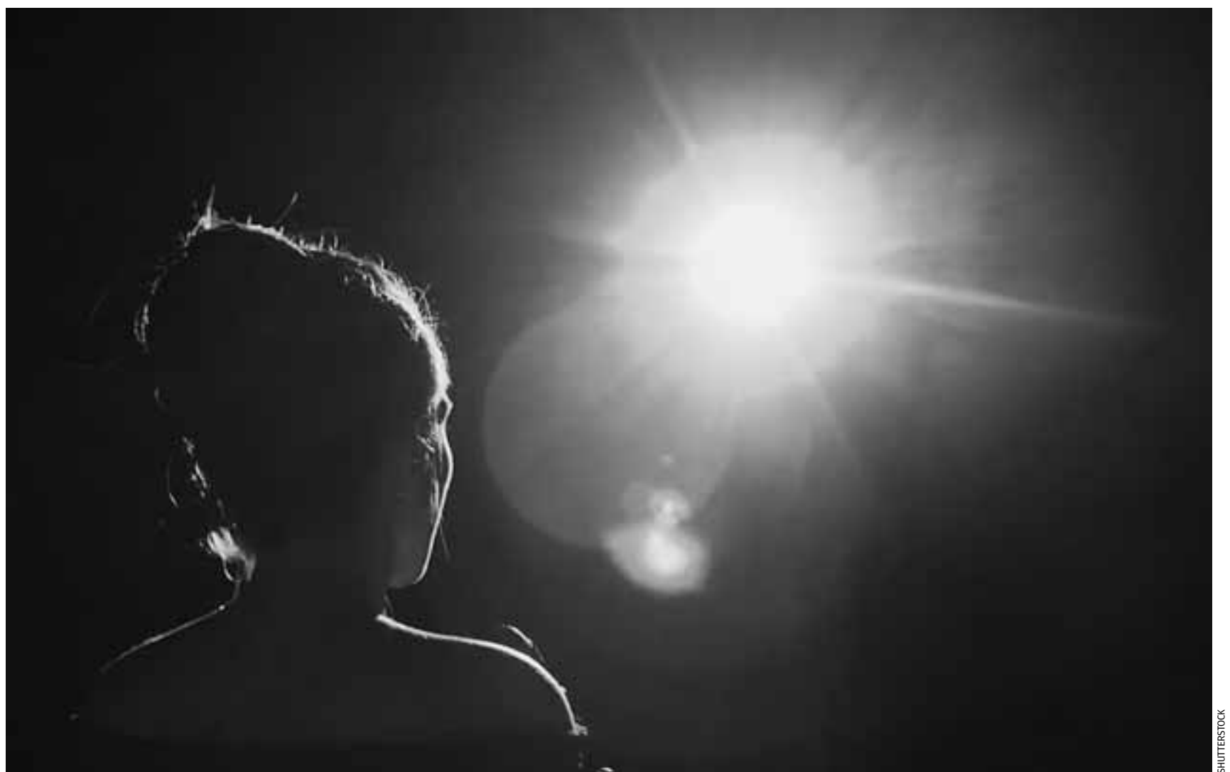
Φως και σε άλλες υποθέσεις στον χώρο του θεάτρου αναμένεται να πέσει το επόμενο διάστημα. Πολλά θύματα, γυναίκες και άνδρες, πλέον μιλούν.

Η περίπτωση Λιγνάδη, που απασχόλησε έντονα την κοινή γνώμη, φθάνοντας να αποτελέσει και αντικείμενο πολιτικής αντιπαράθεσης, παραμένει για τη Δικαιοσύνη ανοικτή και μετά την προσωρινή κράτησή του. Και τούτο, διότι πληροφορίες που φθάνουν στην Εισαγγελία της Αθήνας, αλλά και σε συνηγούς θυμάτων,