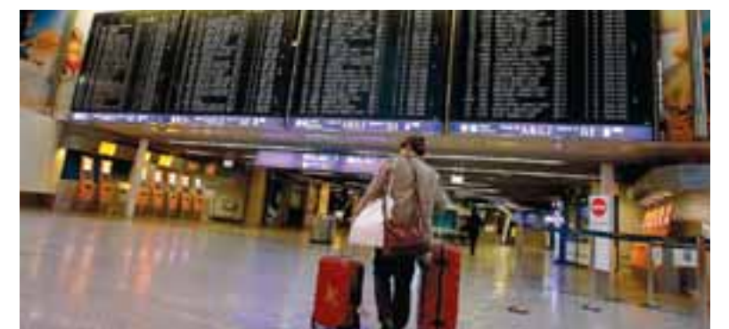
Τις πρώτες δύο εβδομάδες του Φεβρουαρίου η μείωση της κίνησης των επιβατών στα ευρωπαϊκά αεροδρόμια ήταν 89% έναντι του αντίστοιχου μήνα του 2020.

Μαζί με την πτώση της επιβατικής κίνησης, τον Φεβρουάριο καταγράφεται επίσης μια συνεχόμενη μείωση των αεροπορικών συνδέσεων: Ο αριθμός των αεροπορικών διαδρομών που «χάθηκαν» από/προς και εντός Ευρώπης αυξήθηκε περαιτέρω σε 6.914 αυτό τον μήνα, από 6.663 τον Ιανουάριο και 6.001 τον περασμένο Νοέμβριο.