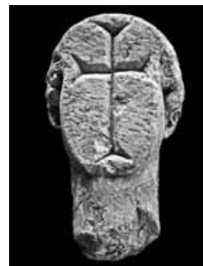
Μαρμάρινη κεφαλή από ανασκαφή στην αρχαία πόλη της Σάμου. Στη θέση του προσώπου, που αφαιρέθηκε, λαξεύτηκε σταυρός.

Ο Αγγελος Δελιβορριάς, αρχαιολόγος και λάτρης της ελληνιστικής γλυπτικής από την ίδια ερευνη-