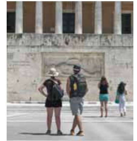
Θετική είναι η αξιολόγηση για τα αξιοθέατα, τα εστιατόρια και τα ταξί, όλα με βαθμό υψηλότερο από 8 στα 10.

Επιπλέον, οι ξένοι επισκέπτες της πρωτεύουσας αισθάνθηκαν, με βαθμολογία 7,6 στα 10, ότι ήταν αρκετά καλά ενημερωμένοι για τα μέτρα COVID-19 της Ελλάδας. Τόσο οι Έλληνες όσο και οι αλλοδαποί που ρωτήθηκαν, δήλωσαν πως νιώθουν πολύ ασφαλείς στο ξενοδοχείο, βαθμολογώντας με 8,9 και 9,2 αντίστοιχα. Παρόμοια αξιολόγηση έγινε και για τα αξιοθέατα, τα εστιατόρια και τα ταξί, όλα με βαθμό υψηλότερο από 8. Μικρότερη βαθμολογία πήρε η ασφάλεια στους δρόμους, στα καταστήματα και στα bar/cafe, ενώ οι αλλοδαποί αξιολόγησαν πολύ χαμηλά, με 6,9, τα μέσα μαζικής μεταφοράς. Οι Έλληνες δεν ένιωθαν ασφαλείς στις δημόσιες συγκοινωνίες με βαθμολογία 5,6 και επίσης αξιολόγησαν την ασφάλεια στα ταξί σημαντικά χαμηλότερα από τους ξένους, με βαθμό 7,2. Από την άλλη πλευρά, οι Έλληνες ένιωθαν ασφαλέστεροι στα εστιατόρια και στους δρόμους. Συνολικά, με βαθμό 7,3 οι αλλοδαποί πιστεύουν ότι τα μέτρα COVID-19 δεν επηρέασαν σε μεγάλο βαθμό την εμπειρία τους στην Αθήνα. Επίσης, προκύπτει ότι η πανδημία δεν είχε αντίκτυπο στις δαπάνες στην πόλη, που κυμάνθηκαν στα ίδια επίπεδα με το 2018 και το 2019, ήτοι 115 ευρώ ημερήσια δαπάνη ανά άτομο. Ετσι, ο συνολικός βαθ-