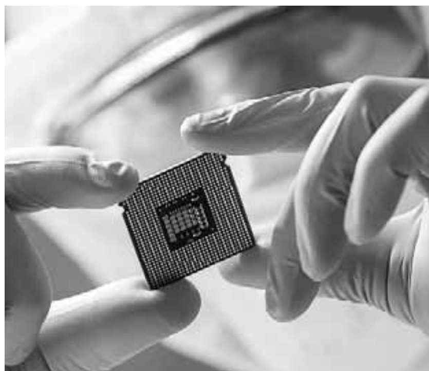
Τα σχέδια της Ευρώπης αρθρώνονται σε μια κρίσιμη περίοδο, κατά την οποία οι μεγάλες αυτοκινητοβιομηχανίες της Γηραιάς Ηπείρου βρίσκονται αντιμέτωπες με ελλείψεις ημιαγωγών.

Τα σχέδια αρθρώνονται σε μια κρίσιμη περίοδο, κατά την οποία οι μεγάλες αυτοκινητοβιομηχανίες της Γηραιάς Ηπείρου βρίσκονται αντιμέτωπες με ελλείψεις ημιαγωγών. Η μεγαλύτερη του κλάδου, η Volkswagen, μείωσε κατά χιλιάδες οχήματα την παραγωγή της, ενώ η Daimler AG δήλωσε πως κάνει ό,τι μπορεί για να ελαχιστοποιήσει τις συνέπειες από τη συμμόρφωση του