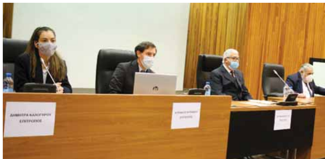
Η επανέναρξη των εργασιών της Ερευνητικής Επιτροπής, μετά την παράδοση του ενδιάμεσου πορίσματος, θα γίνει με τα πρόσωπα, τα οποία εμφανίζονται στο βίντεο του αραβικού δικτύου Al Jazeera.

Λαμβάνοντας υπόψη τους όρους εντολής, η Ερευνητική Επιτροπή μπορεί να καταλογίσει «ευθύνες σε οποιονδήποτε εμπλεκόμενο, οι οποίες προκύπτουν από πράξεις ή παραλείψεις του κατά την άσκηση των