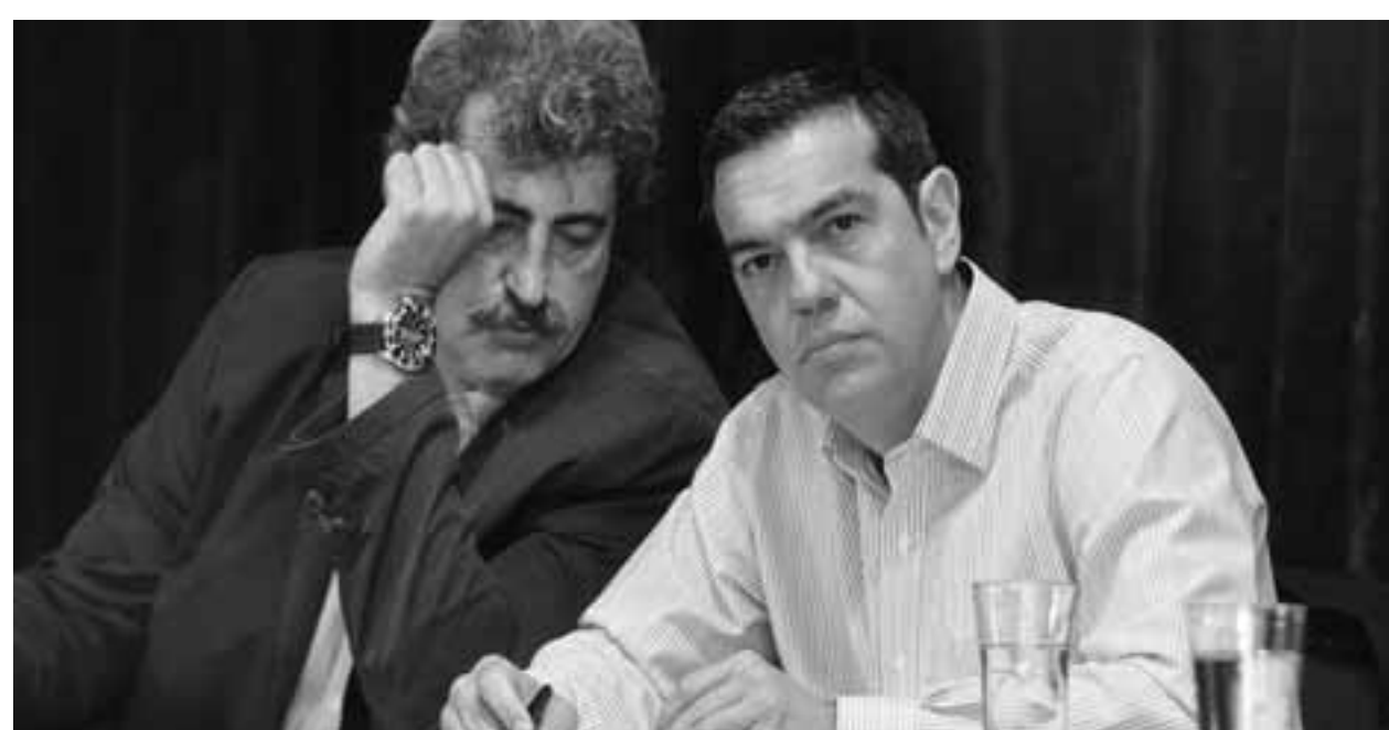
Για το τι σκοπεύει να κάνει με τον Παύλο Πολάκη ο Αλέξης Τσίπρας, γνώστης των ισορροπιών στην Κουμουνδούρου ξεκαθάριζε: «Απολύτως τίποτα. Μέχρι να γίνουν εκλογές, κανείς δεν θα τον πειράξει...».

ζε κοφτά: «Απολύτως τίποτα», και συμπλήρωσε πως «μέχρι να γίνουν εκλογές, κανείς δεν θα πειράξει τον Πολάκη». Υπονοούσε πως ο Αλέξης Τσίπρας περιμένει τις κάλπες για να τον θέσει απλώς εκτός ψηφοδελτίων; Κανείς δεν μπορεί να προδικάσει κάτι τέτοιο, γιατί μπορεί στην Κοινοβουλευτική Ομάδα οι φίλοι του να είναι λίγοι, όμως το ίδιο δεν ισχύει και με τους σκληροπυρηνικούς της βάσης του κόμματος. Το μόνο σίγουρο είναι ότι δεν είναι η κατάλληλη ώρα –εφόσον δεν υποτροπιάσει στον μέγιστο βαθμό– ο πρόεδρος του ΣΥΡΙΖΑ να κάνει το χατίρι της Ν.Δ. και να τιμωρήσει με κάποιον τρόπο τον Παύλο Πολάκη. Θα είναι μια ήττα, τη στιγμή που από την αξιωματική αντιπολίτευση επιμένουν στην απομάκρυνση της Λίνας Μενδώνη από το χαρτοφυλάκιο του υπουργείου Πολιτισμού. Αλ-