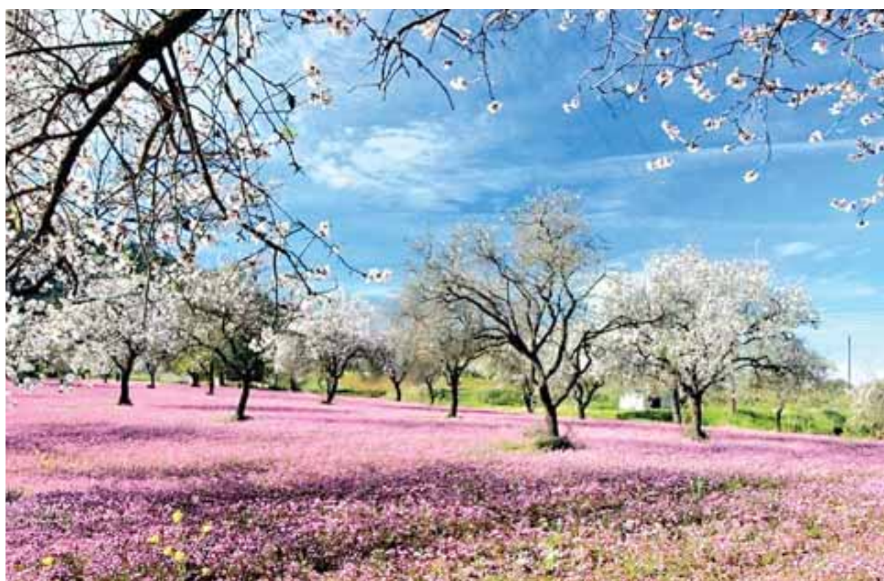
Αυτή η Άνοιξη είναι διαφορετική από την περσινή. Έχουμε να προσβλέπουμε σε νίκη. Μια νίκη που είναι βέβαιη και θέμα χρόνου να επικρατήσει.

σχετικά αργή διάθεση των εμβολίων. Όμως, αυτή η άνοιξη είναι διαφορετική από την περσινή. Έχουμε να προσβλέπουμε σε νίκη. Μια νίκη που είναι βέβαιη και θέμα χρόνου να επικρατήσει. Πρέπει να αντέξουμε όλοι ακόμη λίγο και το τέλος του μαρτυρίου είναι κοντά. Η χαλάρωση των μέτρων ως μην γίνει αιτία να ξεφύγουμε απροστά-