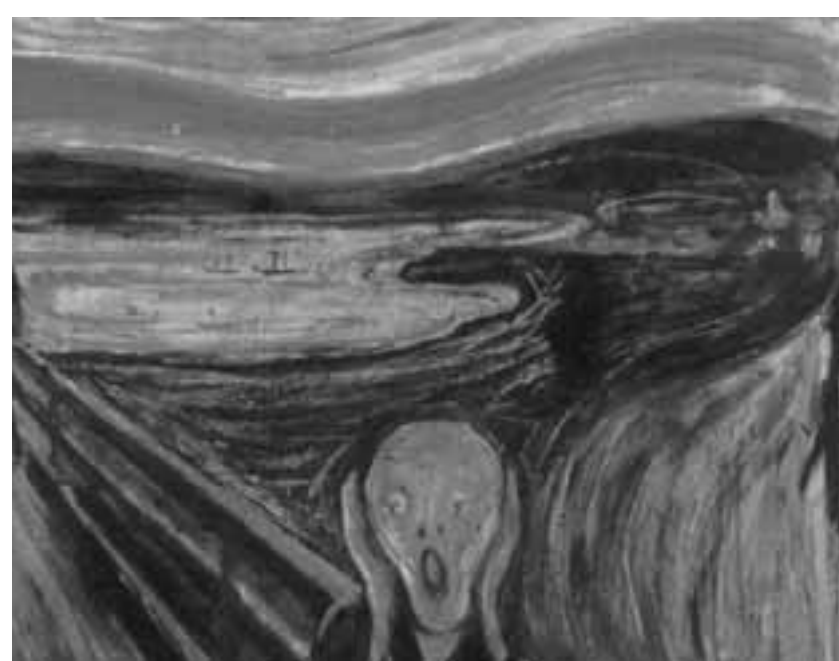
Οι ειδικοί έχουν αναγνωρίσει στην «Κραυγή» σπάνιο τύπο νεφών (noctilucent ή Nacreous Clouds), που ενίοτε εμφανίζονται λίγο πριν από το χάραμα ή με το δειλινό, όταν ο ήλιος βρίσκεται χαμηλά στον ορίζοντα.

Ωστόσο, ο πρόσφατος εντοπισμός «κρυφού» επιγράμματος πάνω στον πασίγνωστο πίνακα, το οποίο φέρει τον γραφικό χαρακτή-