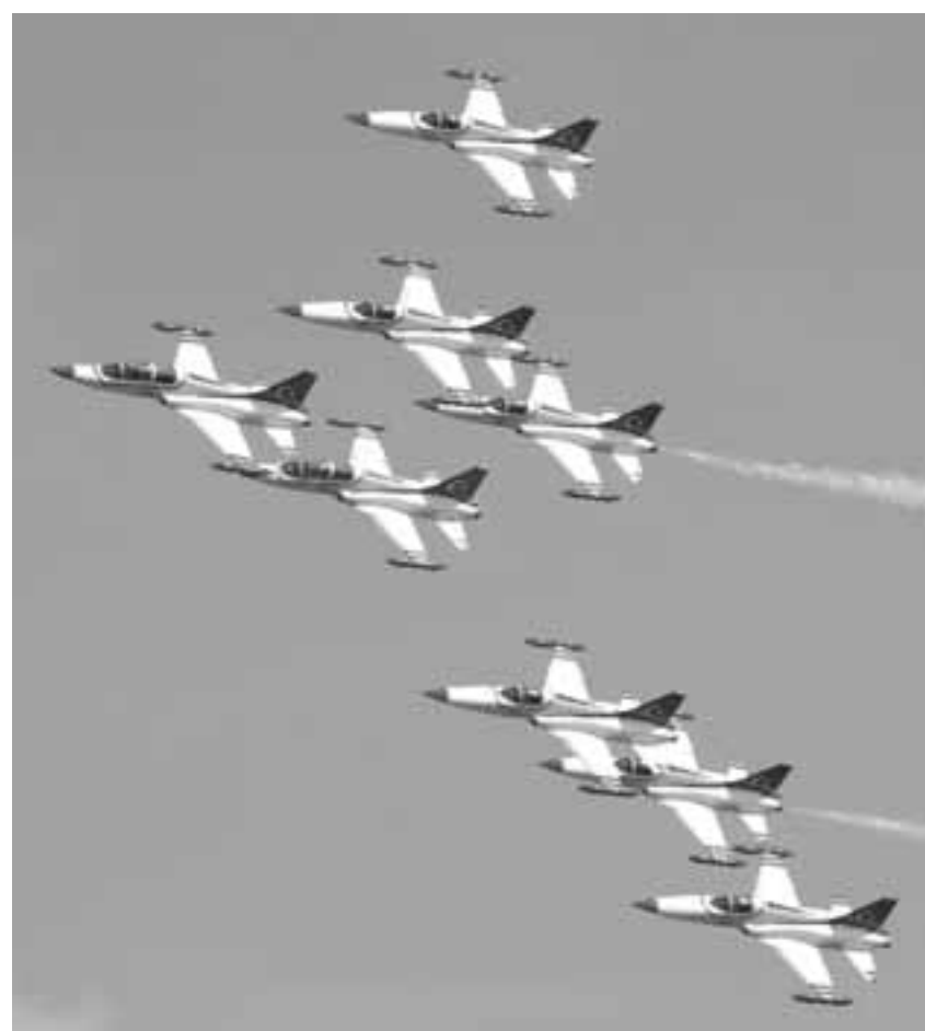
Για την εξασφάλιση στρατιωτικής και γεωστρατηγικής ισορροπίας στην Ανατολική Μεσόγειο κατά τη διάρκεια των δεκαετιών του 2020 και 2030, η Άγκυρα πρέπει να προχωρήσει στη ριζική αναθεώρηση της εξωτερικής και αμυντικής πολιτικής της, εισηγείται η νέα τουρκική έκθεση.

μαχητικών αεροσκαφών. Χώρες όπως οι ΗΠΑ, η Βρετανία και το Ισραήλ παραλαμβάνουν την πρώτη παρτίδα των αεροσκαφών τύπου F-35. Αναπτυσσόμενες χώρες, με πιο περιορισμένες δυνατότητες αλλά φιλόδοξα σχέδια για την περιοχή τους, ακολουθούν τα βήματα των προαναφερθέντων χωρών και μεταβαίνουν στη φάση-γενιά 4,5