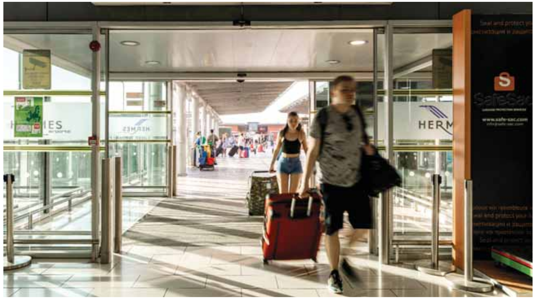
Μπορεί ο Μάρτιος να καταγράψει αύξηση στον προγραμματισμό των αεροπορικών θέσεων, ωστόσο ουσιαστική κινητικότητα αναμένεται από τον Μάη και μετά. Συγκεκριμένα τότε οι πτήσεις φτάνουν τις 350 την εβδομάδα από και προς το αεροδρόμιο Λάρνακα.

Παρά τις προσδοκίες ξενοδόχων και γενικότερα της τουριστικής βιομηχανίας να ξεκινήσουν τις μηχανές του τουρισμού, γιορτάζοντας το εβραϊκό Πάσχα (από τις 27 Μαρτίου - 4 Απριλίου), τα στοιχεία των προγραμματισμένων πτήσεων υποθετούν την άφιξη των πρώτων Ισραηλινών τουριστών τον Απρίλιο και όχι νωρίτερα. Σύμφωνα με τα στοιχεία που έχει στα χέρια της η Hermes Airports οι προσφερόμενες αεροπορικές θέσεις φτάνουν στο 50% στον προγραμματισμό του 2019, ενώ υπάρχουν πιθανότητες, οι αφίξεις από το Ισραήλ, να πλησιάσουν τους αριθμούς του 2019. Φυσικά όλα αυτά ενδέχεται να διαφοροποιηθούν