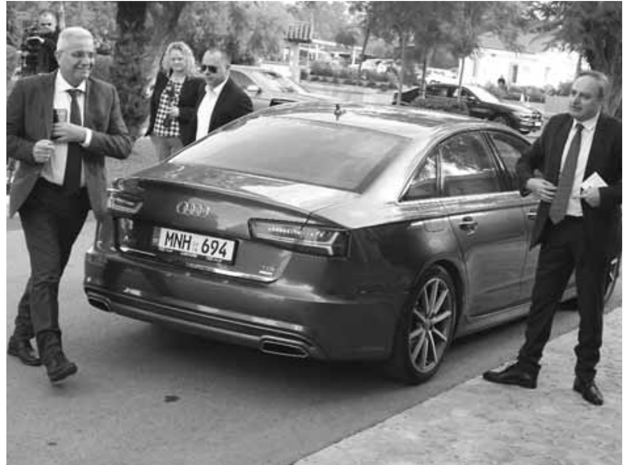
Οι εσωκομματικές διαδικασίες για το ψηφοδέλτιο κατέδειξαν πως στον σκληρό πυρήνα υπάρχουν τριβές, άλλα κίνητρα και κινήσεις τιμωρητικές με ορίζοντα το εκλογικό συνέδριο.