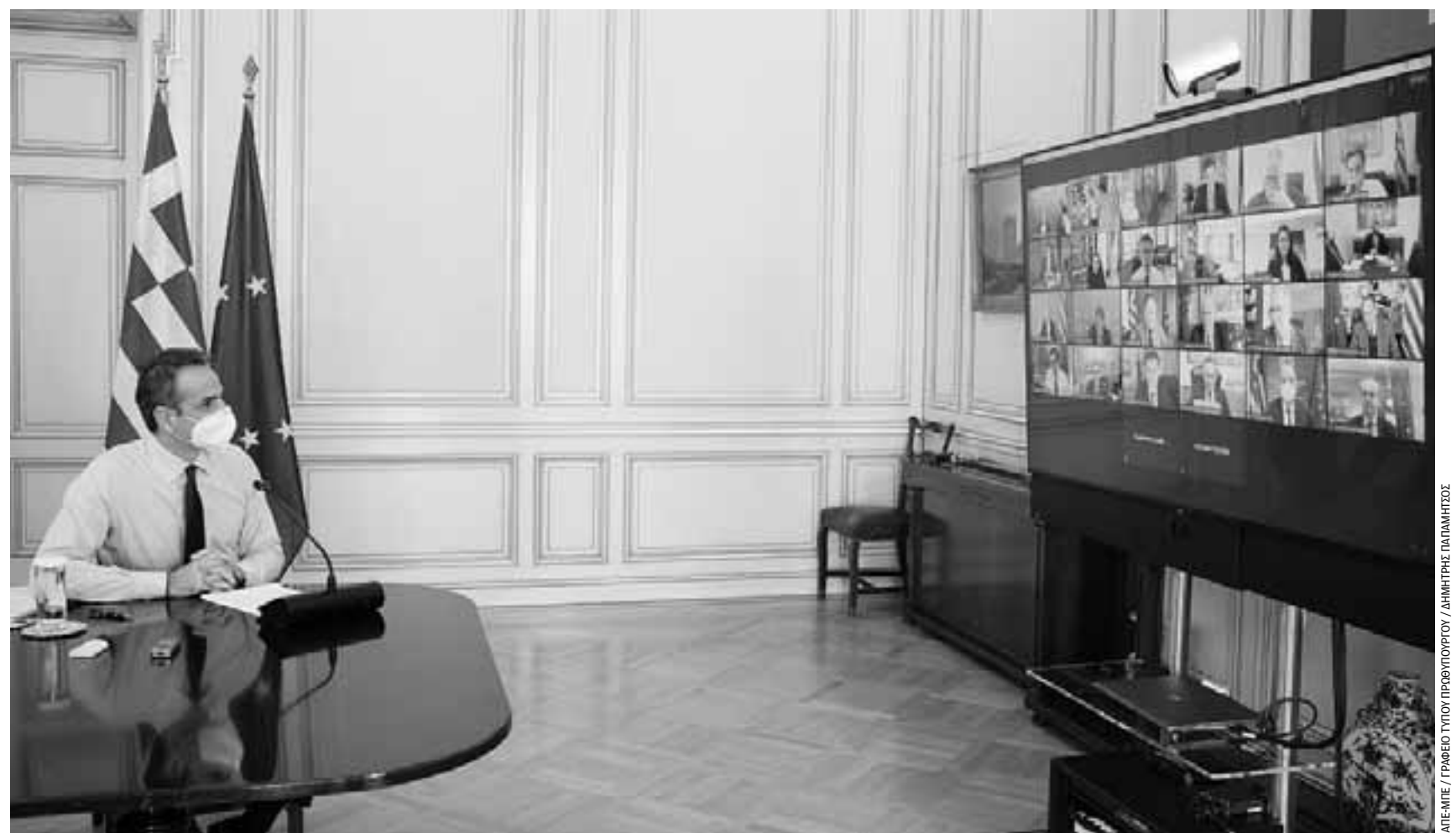
Την Παρασκευή έγινε σύσκεψη στο Μαξίμου για τα επόμενα βήματα, όπου παρουσιάστηκε στον πρωθυπουργό η πλήρης εικόνα της έκθεσης για την αξιοποίηση του Ταμείου Ανάκαμψης, που στόχος είναι να κατατεθεί στα τέλη Μαρτίου ή το αργότερο αρχές Απριλίου (φωτ. αρχείου).

χωράει ο εμβολιασμός τόσο θα ανοίγουν με μεγαλύτερη ασφάλεια οικονομικές και κοινωνικές δραστηριότητες. Στα τέλη Μαρτίου, βάσει του σχεδιασμού, θα έχουμε ξεπεράσει το 1,5 εκατ. εμβολιασμούς και θα δοθεί η δυνατότητα για περαιτέρω άνοιγμα.