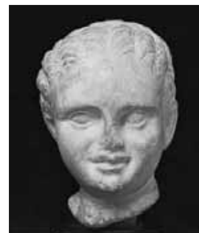
Κεφάλι κορπισιού. Ρώμη, ιδιωτική συλλογή.