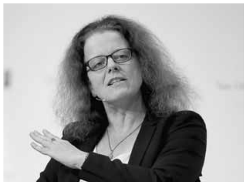
«Θα εξασφαλίσουμε πως δεν υπάρχει κάποια αδικαιολόγητη κίνηση για να αυστηροποιηθούν οι συνθήκες χρηματοδότησης», τόνισε η Ιζαμπέλ Σνάμπελ της ΕΚΤ.

εξαιρετικά χαλαρούς όρους χρηματοδότησης. Ετσι, όπως αναφέρει το Bloomberg, έχοντας διοχετίσει κεφάλαια πολλών τρις στις διεθνείς αγορές ως στήριξη για την αντιμετώπιση της πανδημίας, όσοι χαράσσουν πολιτική στις κεντρικές τράπεζες μεγάλων οικονομιών εξετάζουν να αντιδράσουν απέναντι στις αποδόσεις των ομολόγων οι οποίες, για τις οικονομίες τους, αυξάνονται με ταχείς ρυθμούς. Σύμφωνα με το Bloomberg, η κεντρική τράπεζα της Κορέας προειδοποιεί πως θα παρέμβει εάν το κόστος δανεισμού αυξηθεί, ενώ η κεντρική τράπεζα της Αυστραλίας υποχρέωθηκε να συνεχίσει το πρόγραμμα