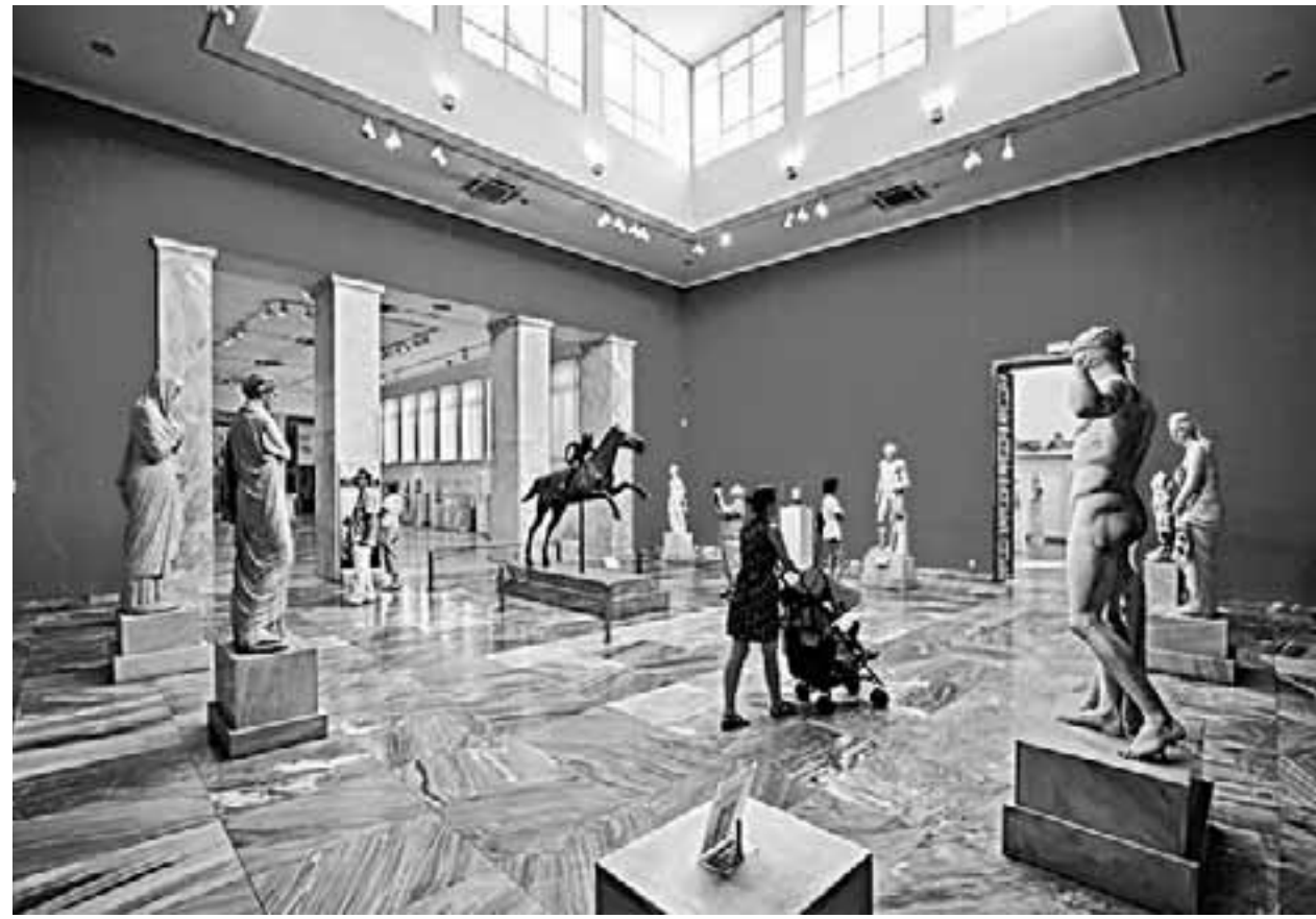
Το νομοσχέδιο μετατρέπει πέντε μουσεία (φωτ. το Εθνικό Αρχαιολογικό Αθηνών) σε νομικά πρόσωπα δημοσίου δικαίου. Τους δίνει αυτοτέλεια στη διαχείριση πόρων και στη χάραξη πολιτικής, αλλά τα αποσπά από την Αρχαιολογική Υπηρεσία.

Όμως η διαχείριση των μουσείων και η στελέχωση της Αρχαιολογικής Υπηρεσίας είναι δύο μόνο