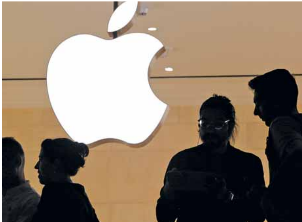
Αναφερόμενος στις εξαγορές, ο διευθύνων σύμβουλος της Apple Τιμ Κουκ είπε στη συνέλευση των μετόχων ότι αυτές αποσκοπούν κυρίως στην απόκτηση τεχνολογίας και ταλέντων.

Ποια, όμως, ήταν η μεγαλύτερη τέτοια επιχειρηματική κίνηση της Apple την τελευταία δεκαετία; Αυτή είχε να κάνει με την απόκτηση αντι 3 δισ. δολαρίων της Beats Electronics, της κατασκευάστριας ακουστικών, την οποία ίδρυσε ο ράπερ και παραγωγός Dr Dre. Το 2018, τώρα, ο αμερικανικός κολοσσός υψηλής τεχνολογίας απέκτησε ακόμα μία υψηλού προφίλ επιχείρηση. Ήταν η Shazam, δημιουργός λογισμικού για την αναγνώριση μουσικής αντί τιμήματος 400 εκατ. δολαρίων. Η πολιτική του Τιμ Κουκ και της Apple είναι να εξαγοράζει μικρότερες εταιρείες υψηλής τεχνολογίας, ούτως