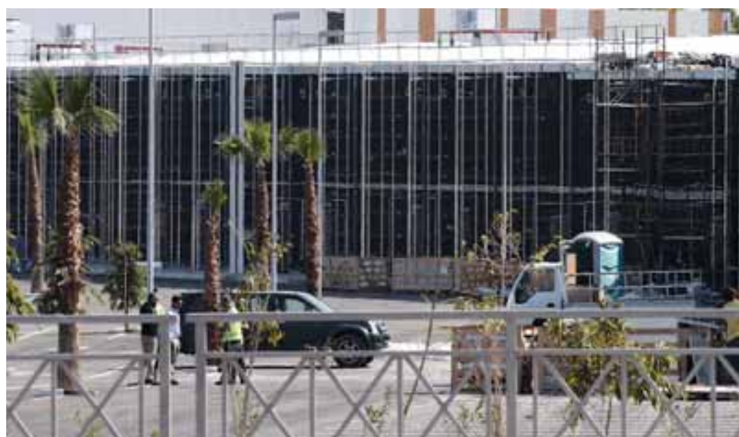
Η λειτουργία των εμπορικών κέντρων στις διάφορες πόλεις αποτελεί ένδειξη ότι η αγορά επανέρχεται στους κανονικούς της ρυθμούς μετά το κτύπημα που δέχθηκε από την πανδημία.

μος. Σύμφωνα με τον κ. Σιγάλα, οι εξωτερικές εργασίες αναμένεται ότι θα ολοκληρωθούν τους επόμενους τέσσερις μήνες ώστε το έργο να παραδοθεί εντός των νέων χρονικών πλαισίων. Στο μεταξύ έχουν κλειδωθεί όλοι οι ένοικοι στο κομμάτι του food court (McDonald's, KFC, BEER&BEER, Loukou, Papa-filiprou, Chopsticks, Caffè Nero, Mikel Coffee, Gelateria Da Vinci, Juice Bar, VOLTAFUNTOWN), ενώ συνεχίζονται οι συζητήσεις για τα καταστήματα ένδυσης και υπόδησης, με νέες ανακοινώσεις να αναμένονται τις επόμενες μέρες. Ήδη έχουν κλειδωθεί Prince Oliver, Dull+ Cream cosmetics, Best for-life philosophy και smarts hopping (όμιλος Ermes), που περιλαμβάνει μεταξύ άλλων τα brands CK jeans, Champion, Converse, Desigual, Diesel, DKNY, Tommy Hilfinger και Springfield, Orsay και Rebook. Πάντως, παρά το γενικότερο προβληματισμό από πλευράς των brands, ένεκα των εξελίξεων της πανδημίας, εκφράζεται ικανοποίηση για το ενδιαφέρον και την έκβαση των συζητήσεων.