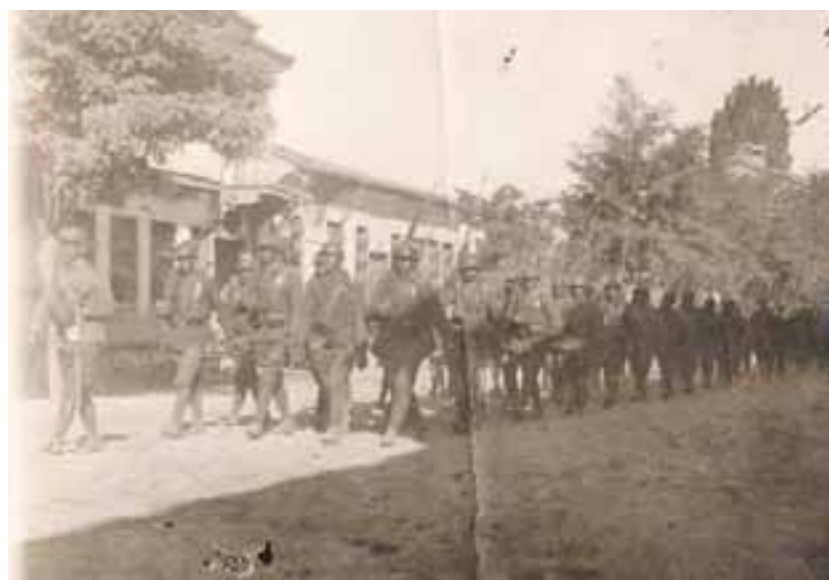
Ιούλιος 1921. Άνδρες του Γ' Σώματος Στρατού εισέρχονται στο Εσκή Σεχίρ.

Με αφορμή την άτυπη επέτειο, η «Κ» θα αφιερώσει καθ' όλη τη διάρκεια της χρονιάς σελίδες με μαρτυρίες, αφηγήσεις, κυρίως όμως κείμενα έγκριτων ιστορικών.