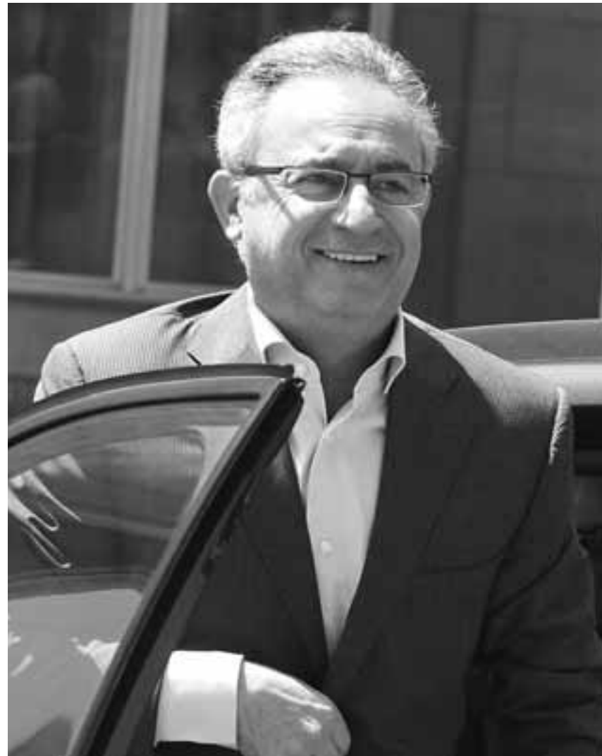
Ο Αβέρωφ Νεοφύτου είναι πρώτος σε ακόλουθους στο twitter με 20.400 followers και ακολουθεί ο Νικόλας Παπαδόπουλος με 14.000. Ο Άντρος Κυπριανού είναι τρίτος με περίπου 9.000, ενώ αποφεύγει να έχει λογαριασμό στο facebook.

twitter, είχε αυξημένα like στις αναρτήσεις της σε σχέση με τους άλλους δύο υποψηφίους, θετικά σχόλια, ωστόσο, δεν κατάφερε να κάνει τη διαφορά και να εκλεγεί, μείωσε, μάλιστα, τα ποσοστά της, καταδεικνύοντας πως άλλο η κάλπη και άλλο τα μέσα κοινωνικών δικτύωσης και αυτό είναι κάτι το οποίο πρέπει να λαμβάνεται υπόψη. Αξίζει να σημειωθεί πως μόλις το 17% θεωρεί αξιόπιστα τα όσα διαβάζει στο facebook, το 51% όχι και τόσο αξιόπιστα το 26% αναξιοπιστα, ενώ στο twitter το 24% θεωρεί πως είναι αξιόπιστα, 47% όχι και τόσο και το 25% αναξιοπιστα.