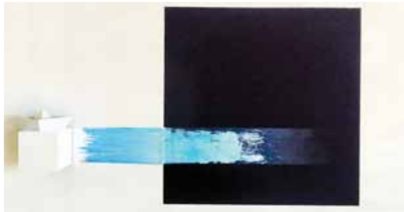
Έργο από την έκθεση, Βάρκα σε κβαντική σπράγγα - 2020 (002).

–Ποτέ δεν με έπεισε ο χρόνος. Δεν με απασχολεί αυτή η επινοημένη διάσταση που δεν αφορά κανένα άλλο παρά μόνο τον άνθρωπο. Αντίθετα με συγκινεί ο χώρος. Μόνο ο χώρος θυμάται, ο χρόνος ξεχνά. Ο χώρος είναι εξοικειωμένος με το ταυτόχρονο, με το παράλογο. Κρατάει μνήμες και συγκινήσεις. Επιστρέφεις σε έναν χώρο αιώνες μετά και νιώθεις τη συσσωρευμένη μνήμη που ακόμη αναβλύζει από μέσα του. Ο χρόνος παραμένει μονοδιάστατος, εγκλω-