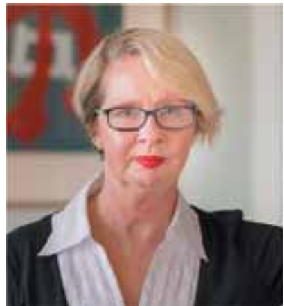
Η Τζοάνα Μπερκ είναι καθηγήτρια Ιστορίας στο Πανεπιστήμιο Μπίρμινγκ του Λονδίνου.

Η Μπερκ έγραψε την «Ιστορία του βιασμού» το 2008, πολύ πριν ξεσπάσει το κίνημα #MeToo στην Αμερική, ενώ δούλευε το νέο της βιβλίο την ώρα που ο Χάρβεϊ Βινστάϊν οδηγούνταν στις αμερικανικές αρχές. Κάθε φορά που μιλάει γι' αυτό, μας λέει, νιώθει την ανάγκη να υπενθυμίσει ότι το #MeToo ξεκίνησε από τη μαύρη ακτιβίστρια Τάρανα Μπερκ το 2006, αν και έγινε παγκοσμίως γνωστό από τη λευκή ηθοποιό Αλίσσα Μιλάνο μία δεκαετία