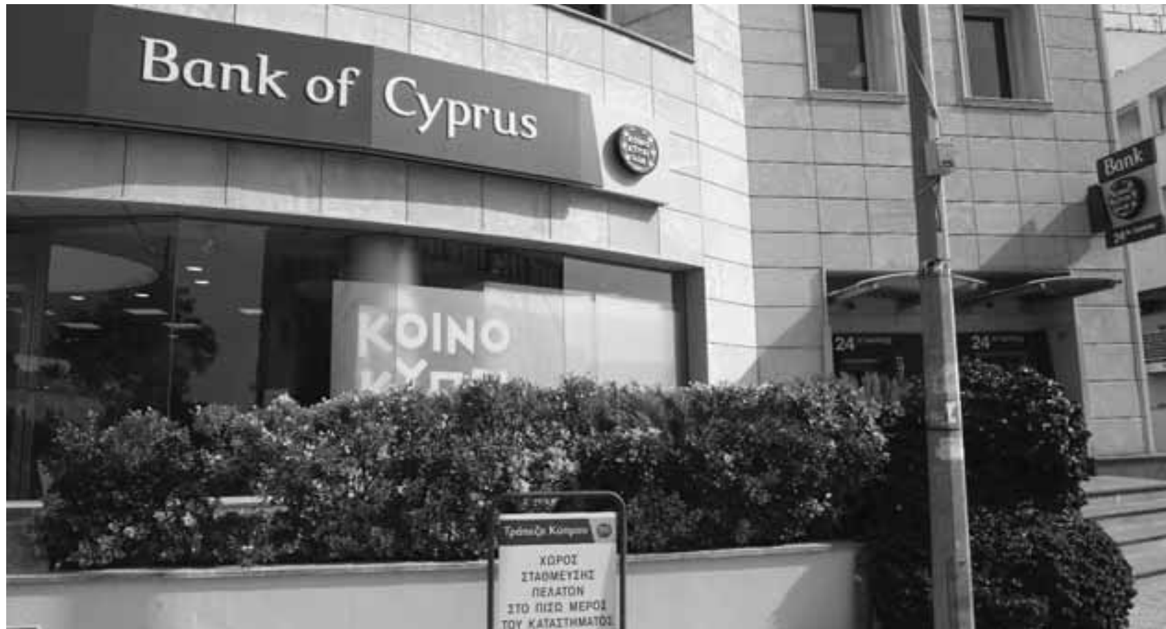
Η Remu διαχειρίζεται ακίνητα λογιστικής αξίας ύψους 1,45 δισ. ευρώ (αποτελούμενα από ακίνητα ύψους 1,35 δισ. ευρώ τα οποία κατηγοριοποιήθηκαν ως 'Αποθέματα ακινήτων' και 107 εκατ. ως 'Επενδύσεις σε Ακίνητα').

Στη σελίδα 14 των οικονομικών της αποτελεσμάτων αναφέρει πως «η Ευρωπαϊκή Κεντρική Τράπεζα, ως μέρος του εποπτικού της ρόλου, έχει ολοκληρώσει την επιτόπια επιθεώρηση και επανεξέταση που αφορούσε την αξία των περιουσιακών στοιχείων που περιέρχονται στην κυριότητα του Συγκροτήματος μέσω εκποιήσεων με ημερομηνία αναφοράς την 30 Ιουνίου 2019. Τα ευρήματα αφορούν εποπτική επιβάρυνση μέχρι 46 μ.β., η πλειονότητα της οποίας αναμένεται να ληφθεί στις 30 Ιουνίου 2021, ανάλογα με την πρόοδο που θα σημειώσει η Τράπεζα στην πώληση των ακινήτων που επηρεάζονται από την εποπτική επιβάρυνση». Η «Κ» είχε γράψει εντός Ιουλίου για την πρόθεση των εποπτών να βάλουν «εν είδει προβλέψεων» κάποιες ζημιές σε συγκεκριμένα ακίνητα της Τράπεζας Κύπρου, τα οποία είχαν μείνει αδιάθετα για αρκετό χρονικό διάστημα. Αυτή δε η πρακτική πιθανόν να εφαρμόζεται όχι μόνο στην περίπτωση της Τράπεζας Κύπρου, αλλά σε όλες τις τράπεζες οι οποίες