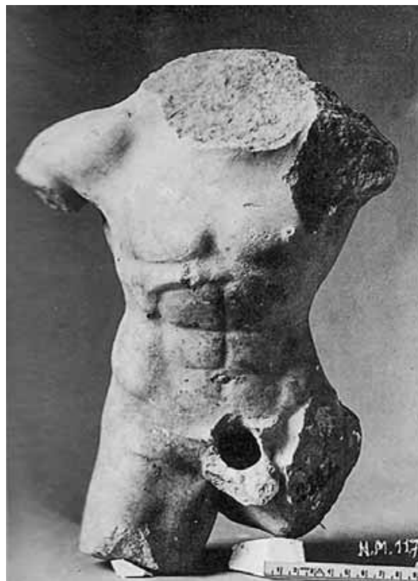
Μαρμάρινος κορμός. Εθνικό Αρχαιολογικό Μουσείο, αρ. ευρήματος 2.324.

τηρίνα. Και την πράσθη με έναν τρόπο ιδιόρρυθμο, εντελώς δικό του. Παθιασμένα, θα έλεγα, και σωματικά, χωρίς ίχνος από τις ρομαντικές αμφιταλαντεύσεις των ιδεαλιστικών διαφυγών και τις μεταφυσικές τους προεκτάσεις. Όχι ότι τον απωθεί η θεωρητική επότητα των αντικειμένων που κατά καιρούς σπουδάζει και παρατηρεί, σε μια εξουθενωτική προσπάθεια να σπάσει τον κρυπτογραφικό τους κώδικα. Αλλά πώς τον μαγντίζει