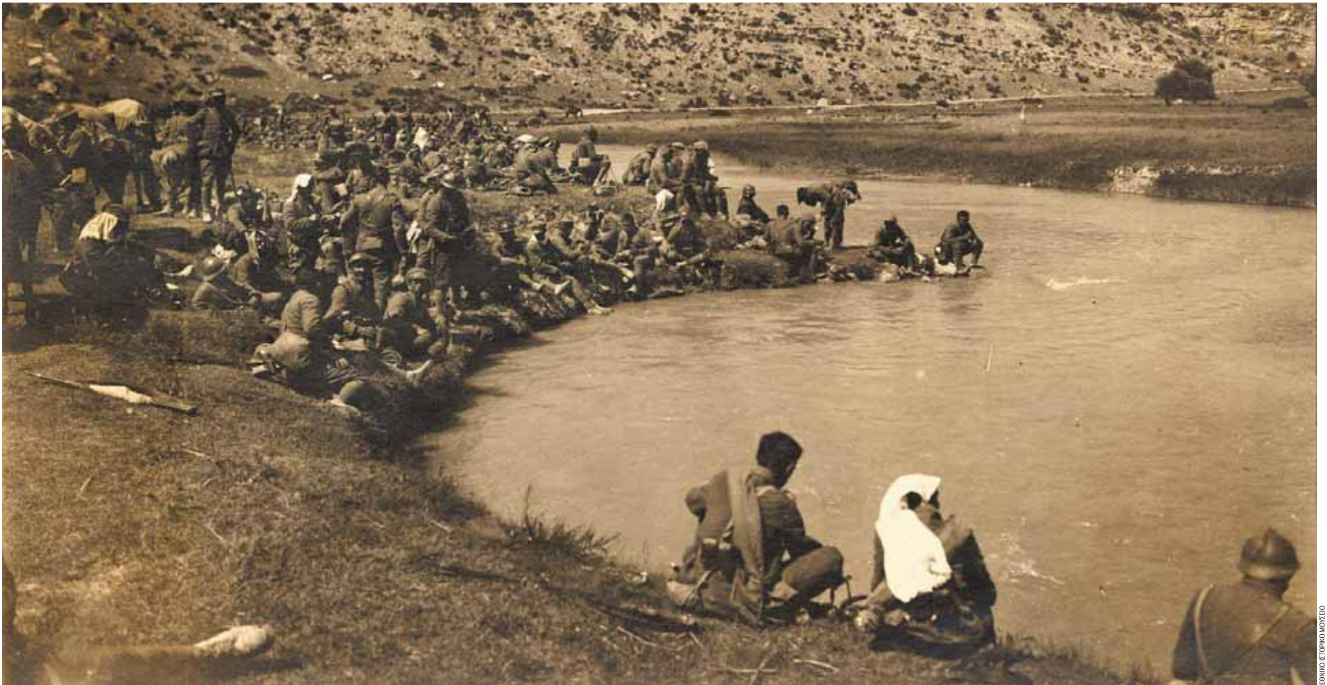
Καλοκαίρι του 1921. Έλληνες στρατιώτες ξεδιψούν στον ποταμό Πουρσάκ, παραπόταμο του Σαγγάριου.