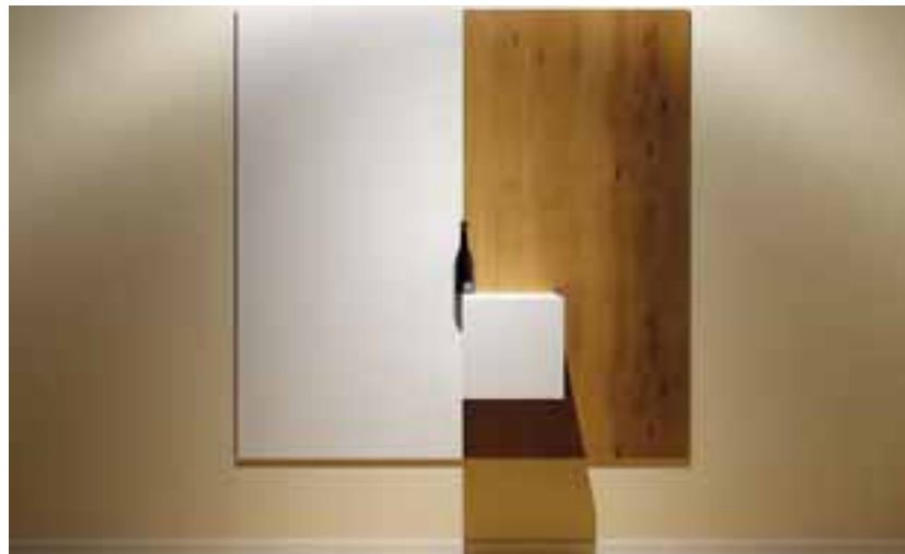
Έργο από την έκθεση, Εμσαούς - 2021.