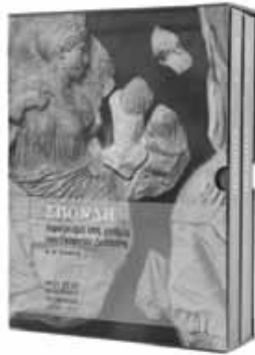
Η δίτομη έκδοση «Σπονδή, αφιέρωμα στη μνήμη του Γιώργου Δεσπίνης».

«“Εν μίαν ηράσθην, την Αρχαιολογία” θυμάμαι πως έλεγε στα νιάτα μας», έγραψε ο Αγγελος Δελιβορριάς.