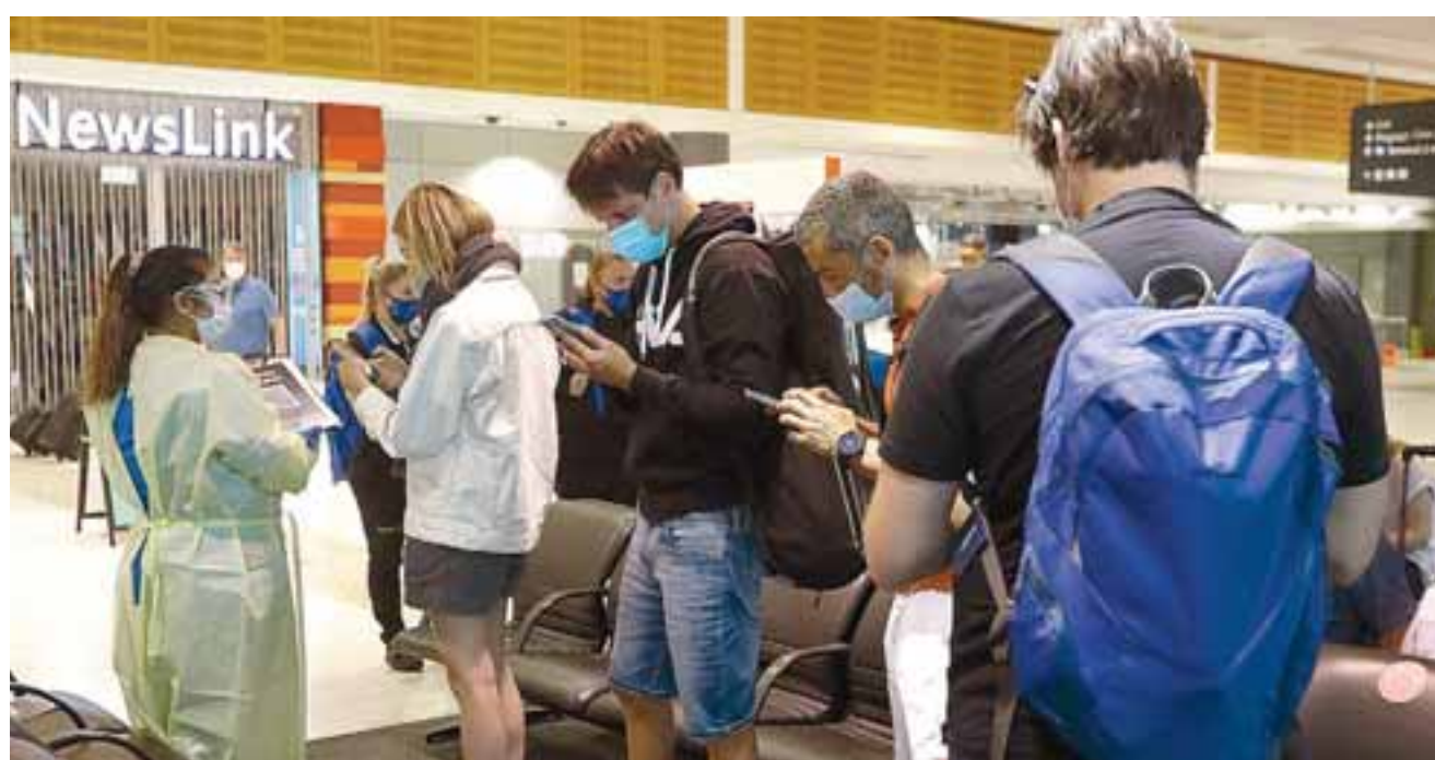
Η Ευρωπαϊκή Συμμαχία Τουρισμού (European Tourism Manifesto alliance), μια ομάδα περισσότερων από 60 δημόσιων και ιδιωτικών ταξιδιωτικών και τουριστικών οργανισμών, εισηγείται μια σειρά από συστάσεις για τα κράτη-μέλη της Ε.Ε. σχετικά με τον τρόπο επανέναρξης των ταξιδιών στην Ευρώπη εγκαίρως για το φετινό καλοκαίρι.

στην Ευρώπη στο Ευρωπαϊκό Συμβούλιο των υπουργών Τουρισμού. Η Ευρωπαϊκή Συμμαχία Τουρισμού (European Tourism Manifesto alliance), μια ομάδα περισσότερων από 60 δημόσιων και ιδιωτικών ταξιδιωτικών και τουριστικών οργανισμών, εισηγείται μια σειρά από συστάσεις για τα κράτη-μέλη της Ε.Ε. σχετικά με τον τρόπο επανέναρξης των ταξιδιών στην Ευρώπη εγκαίρως για το φετινό καλοκαίρι. Στόχος των συστάσεων είναι η ανάπτυξη ενός οδικού χάρτη της Ε.Ε. για την αποκατάσταση των ταξιδιών. Μια ειδική ομάδα εργασίας της Επιτροπής (Commission Task Force) για την αποκατάσταση της ελεύθερης κυκλοφορίας ατόμων προτείνεται