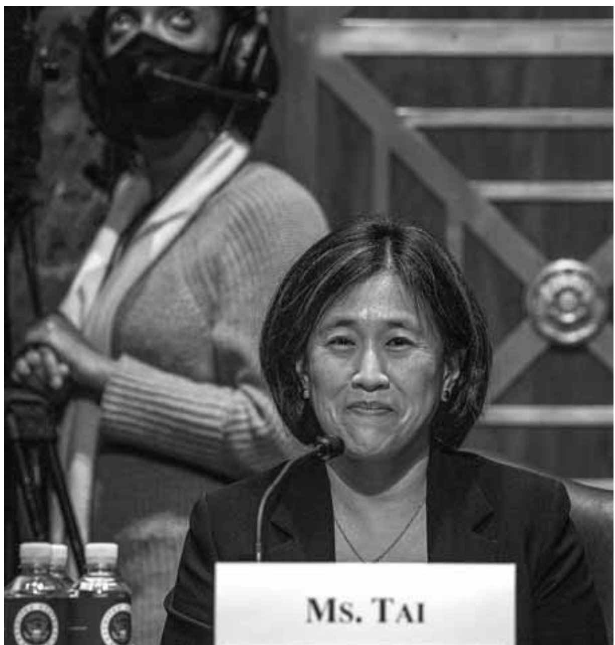
Η 47χρονη Κάθριν Τάι, παιδί Κινέζων μεταναστών και απόφοιτος του Γέιλ και της Νομικής Σχολής του Χάρβαρντ, ανήκει στην προοδευτική πτέρυγα των Δημοκρατικών, αλλά απολαμβάνει την εκτίμηση και των Ρεπουμπλικανών.

Όπως, όμως, τονίζουν αναλυτές του Bloomberg, προδίδει παράλληλα μια πολύ πιο μεθοδική και πρακτική προσέγγιση, που διαφοροποιεί την κυβέρνηση Μπάιντεν από τη χαοτική στάση της ομάδας που προκάτοχε του. Η 47χρονη κ. Τάι, παιδί Κινέζων μεταναστών και απόφοιτος του Γέιλ και της Νομικής Σχολής του