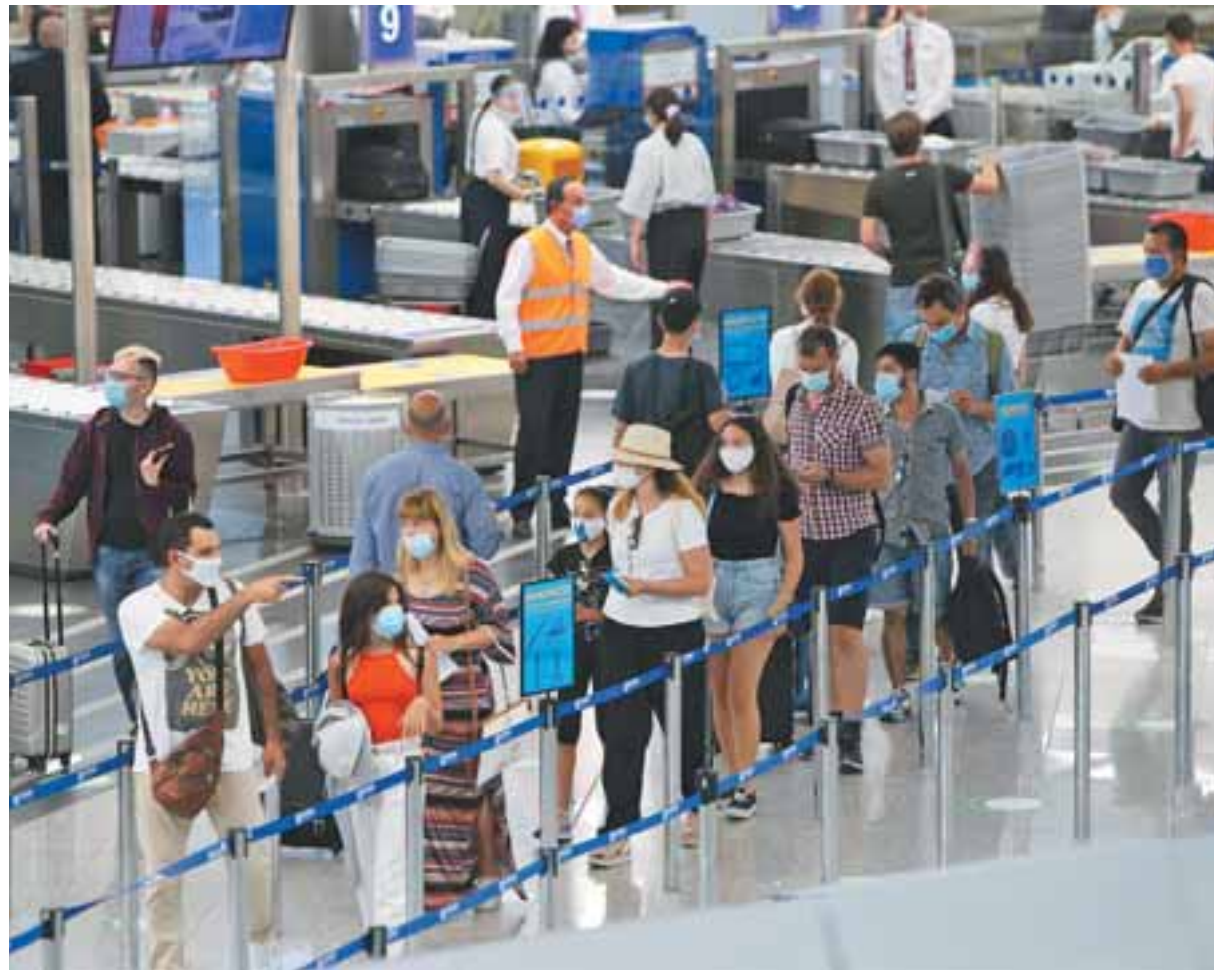
Η ελληνική κυβέρνηση βρίσκεται σε προχωρημένες συζητήσεις με το Λονδίνο προς επίτευξη διμερούς συμφωνίας - όπως αυτή με το Ισραήλ - για την ελεύθερη μετακίνηση τουριστών που έχουν εμβολιαστεί.

Οι εξελίξεις αυτές ενισχύουν την επιχειρηματολογία όσων πιστεύουν πως το brand name της Ελλάδας στον τουρισμό έχει ισχυροποιηθεί τα τελευταία χρό-