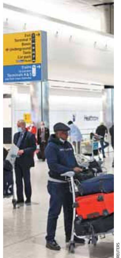
Η επιβατική κίνηση στο αεροδρόμιο της βρετανικής πρωτεύουσας υποχώρησε πέρυσι στα επίπεδα της δεκαετίας του 1970.

Οι προ φόρων και τόκων ζημιές του αερολιμένα ανήλθαν σε 2 δισ. λίρες επί εσόδων μειωμέ-