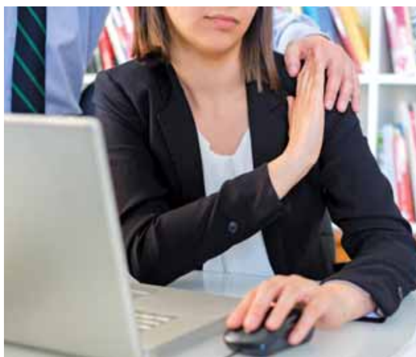
Στο Γραφείο της Επιτροπής Διοικήσεως τα τελευταία τρία χρόνια έχουν υποβληθεί 59 παράπονα παρενόχλησης και/η σεξουαλικής παρενόχλησης.

στην εργασία τους και σύμφωνα με πληροφορίες της «Κ» φαίνεται ότι οι διευθύνσεις σε αρκετές περιπτώσεις έχουν υποτιμήσει ή έχουν προβεί σε λανθασμένους χειρισμούς, με αποτέλεσμα οι γυναίκες εργαζόμενες να μένουν απροστάτευτες, και φυσικά οι παρενοχλητικές ή κακοποιητικές συμπεριφορές να διαιωνίζονται. Ενδεικτικό είναι το γεγονός ότι η σεξουαλική παρενόχληση δεν περιλαμβάνεται ρητά στα πειθαρχικά παραπτώματα που προβλέπονται στον Κανονισμό για το ωρομίσθιο κυβερνητικό προσωπικό, με αποτέλεσμα να εφαρμόζονται μόνον οι σχετικοί πειθαρχικοί κανονισμοί, αλλά να μην επιβάλλονται μεγάλες ποινές. Από το Γραφείο της Επιτροπής Διοικήσεως και Ανθρωπίνων Δικαιωμάτων έχει αναληφθεί το τελευταίο διάστημα εκστρατεία εν-