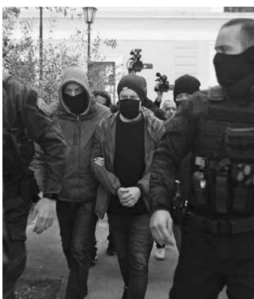
Ο γνωστός ηθοποιός και σκηνοθέτης Δημήτρης Λιγνάδης, κατά τη διάρκεια της απολογίας του, ισχυρίστηκε ότι οι καταγγελίες εις βάρος του είναι «κατασκευασμένες» και ότι οι καταγγέλλοντες ανέφεραν στις δικαστικές αρχές ψευδή και ανυπόστατα γεγονότα.

Στην ερώτηση του εισαγγελέα εάν είχε σεξουαλική σχέση με τον Δημήτρη Λιγνάδη, ο νεαρός απάντησε: «Ναι, οι συναντήσεις μας στο σπίτι του ήταν γενικά συχνές, είτε μόνοι μας είτε με παρέα. Οι σεξουαλικές σχέσεις μας ήταν στοματικός έρωτας που του έκανα εγώ, φιλιό στο στόμα, θωπείες και αυνανισμοί». Την 9η Αυγούστου 2015 και ενώ είχαν πάει διακοπές στην