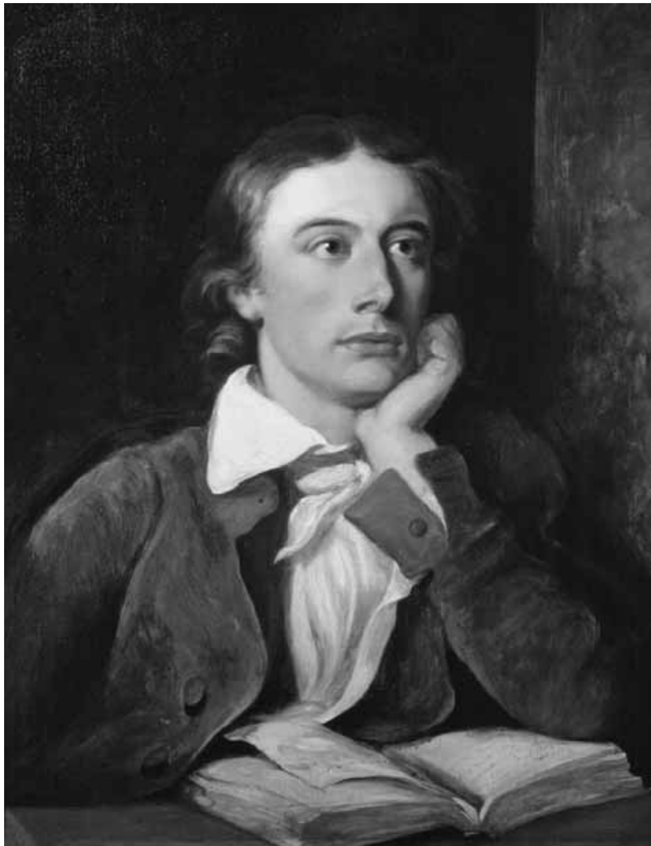
Ο Βρετανός ρομαντικός ποιητής Τζον Κιτς (1795-1821) σε έργο του Γουίλιαμ Χίλτον. Φέτος είναι η επέτειος των 200 χρόνων από τον θάνατό του.