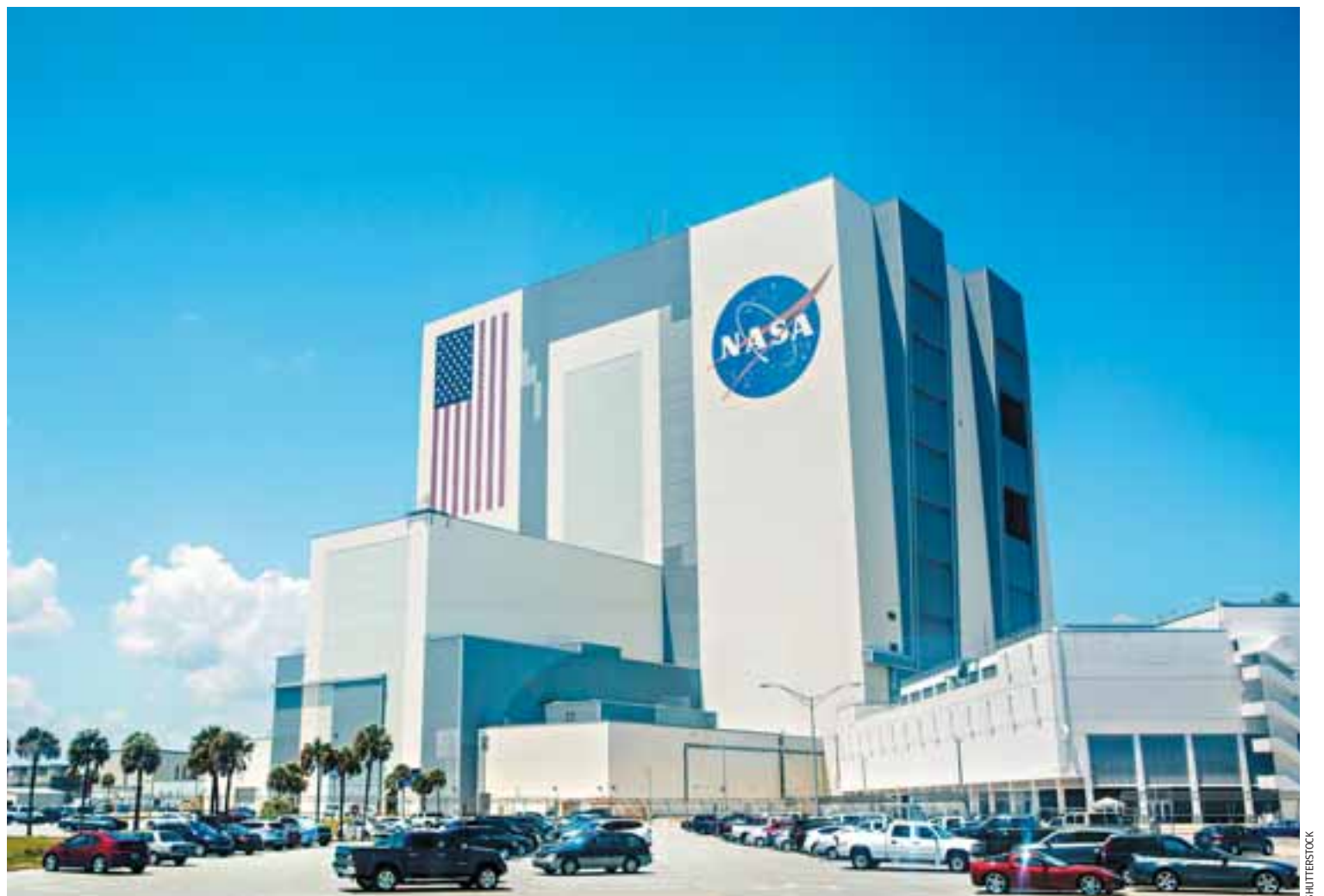
Σε οργανισμούς όπως η NASA, η ESA και πανεπιστήμια του εξωτερικού η ύπαρξη Ελλήνων επιστημόνων είναι μια «κανονικότητα» εδώ και πολλά χρόνια.

Η πρώτη του επαφή με ρουκέτες και προωθητήρες έγινε με τα παραδοσιακά έθιμα της Χίου όπου μεγάλωσε. Το 1956 φοίτησε στο Πανεπιστήμιο της Μινεσότας και μια συνάντηση με τον διάσημο καθηγητή Τζέιμς Βαν Αλεν, που έδωσε το όνομά του στις ραδιενεργές ζώνες γύρω από τη Γη, τον άλλαξε τζιζ. Ο νεαρός φοιτητής της Μινεσότας περιέγραφε στον Βαν Αλεν πώς κατασκεύαζε έναν μετρητή κοσμικών ακτίνων και έπειτα ο καθηγητής τον πήρε στο μεταπτυχιακό του πρόγραμμα. Λίγο αργότερα, ο