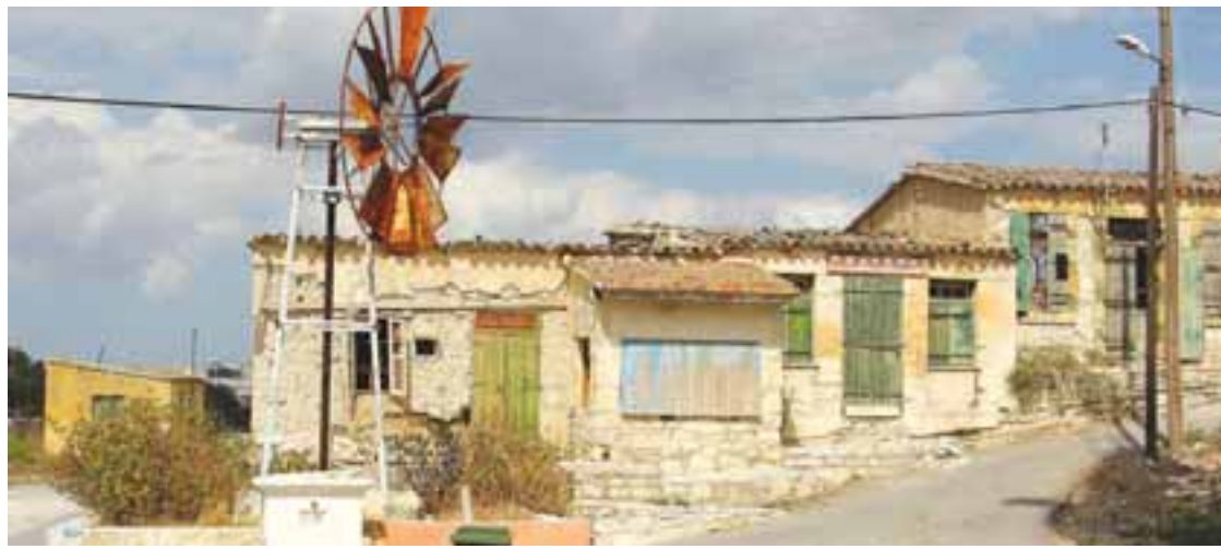
Ο συγγραφέας Κωστής Κοκκινόφτας διερευνά το ζήτημα των εξισλαμισμών, που απασχόλησε και συνεχίζει να ενδιαφέρει την επιστημονική κοινότητα αρκετά και τα ανοικτά πεδία έρευνας είναι ακόμη πολλά.

Για το ζήτημα αυτό ο συγγραφέας αντλεί πολύτιμες πληροφορίες από οθωμανικά και άλλα έγγραφα,