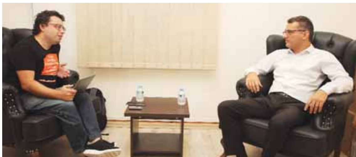
Η τ/κ κοινότητα όπως έχει μερίδιο στον φυσικό πλούτο έχει και λόγο σε ό,τι αφορά τη χρήση αυτού του πλούτου, δηλώνει στην «Κ» ο αρχηγός του Ρεπουμπλικανικού Τουρκικού Κόμματος.

—Η ένταξη στην Ευρωπαϊκή Ένωση ήταν έναν κίνητρο για τη λύση. Αν είχε τεθεί η πρόνοια ότι η Κύπρος θα ενταχθεί στην Ε.Ε. μετά τη λύση, ενδεχομένως θα είχαμε λύσει το Κυπριακό το 2004. Χάσαμε εκείνη ευκαιρία. Τώρα έχουμε την ευκαιρία που μας παρέχουν οι υδρογονάνθρακες. Δυστυχώς το όλο ζήτημα εγκλωβίζεται μέσα σε νομικά πλαίσια. Ωστόσο, η τ/κ κοινότητα όπως έχει μερίδιο στον φυσικό πλούτο έχει και λόγο σε ό,τι αφορά τη χρήση αυτού του πλούτου. Σε κάθε περίπτωση πρέπει να απαντήσουμε στο εξής ερώτημα: Θα χρησιμοποιήσουμε αυτόν τον πλούτο για να πάμε μια ώρα αρχύτερα στη λύση, λ.χ. με μια επιτροπή όπως πρότεινε ο πρόεδρος μας, η οποία θα μετεξελιεσώταν σε ένα είδος μέτρου οικοδόμησης εμπιστοσύνης ή θα τον χρησιμοποιήσουμε για να αυξήσουμε την ένταση στην περιοχή. Δυστυχώς, παρατηρώ ότι η