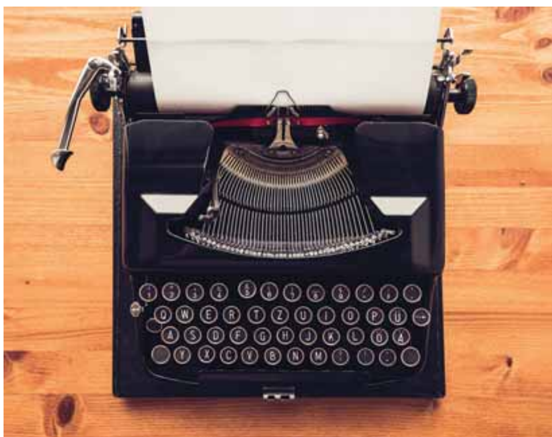
«Θα ήθελα να γράφω μόνο ένα προσχέδιο και να τελειώνω εκεί, αλλά αυτό συμβαίνει σπανιότατα. Δεν είμαι απ' αυτές τις ιδιοφυΐες που το πετυχαίνουν με την πρώτη», έχει πει ο Μαρκ Στραντ.

Η πραγματικότητα στην ποίησή του είναι φευγαλέα. Το καθημερινό, το ρεαλιστικό στοιχείο