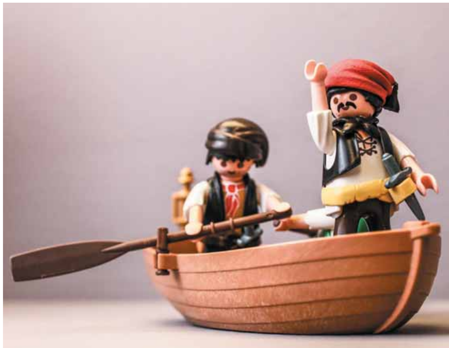
Ο Κωνσταντίνος Κανάρης, σύμφωνα με τον πίνακα του Νικηφόρου Λύτρα «Η πυρπόληση της τουρκικής ναυαρχίδας από τον Κανάρη» (περ. 1866-1870).

Όλα αυτά συμβαίνουν μπροστά στα μάτια μου. Οχι, δεν έχω μπει σε χρονομηχανή. Είμαι στον πρώτο όροφο του Εθνικού Ιστορικού Μουσείου, στην οδό Σταδίου, και «Οι πρόσφυγες της Πάργας» είναι μία από τις ιστορίες που θα αφηγηθεί η έκθεση «Το '21 αλλιώς: Η Ελληνική Επανάσταση σε διοράματα Playmobil». Η έκθεση αποτελεί μέρος της σειράς εκδηλώσεων «1821: απηχάσεις στο σήμερα», οι οποίες εντάσσονται στις δράσεις που οργανώνει το μουσείο για τον εορτασμό των 200 ετών από την Ελληνική Επανάσταση του 1821. Στόχος της είναι μια πρωτότυπη, εντυπωσιακή και ιστορικά τεκμηριωμένη προσέγγιση της συγκεκριμένης ιστορικής περιόδου. Θα απευθύνεται πρωτίστως στα παιδιά, αλλά θα μπορούν να την παρακολουθήσουν ευχάριστα και οι ενήλικοι. Κι αν κρίνω από