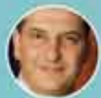
NIKOLAOS LAKKOTOMARIS Minister of Energy, Commerce, Industry and Tourism