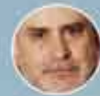
GEORGE NOUNESIS National Centre "Demokritos" (Testa Greece)