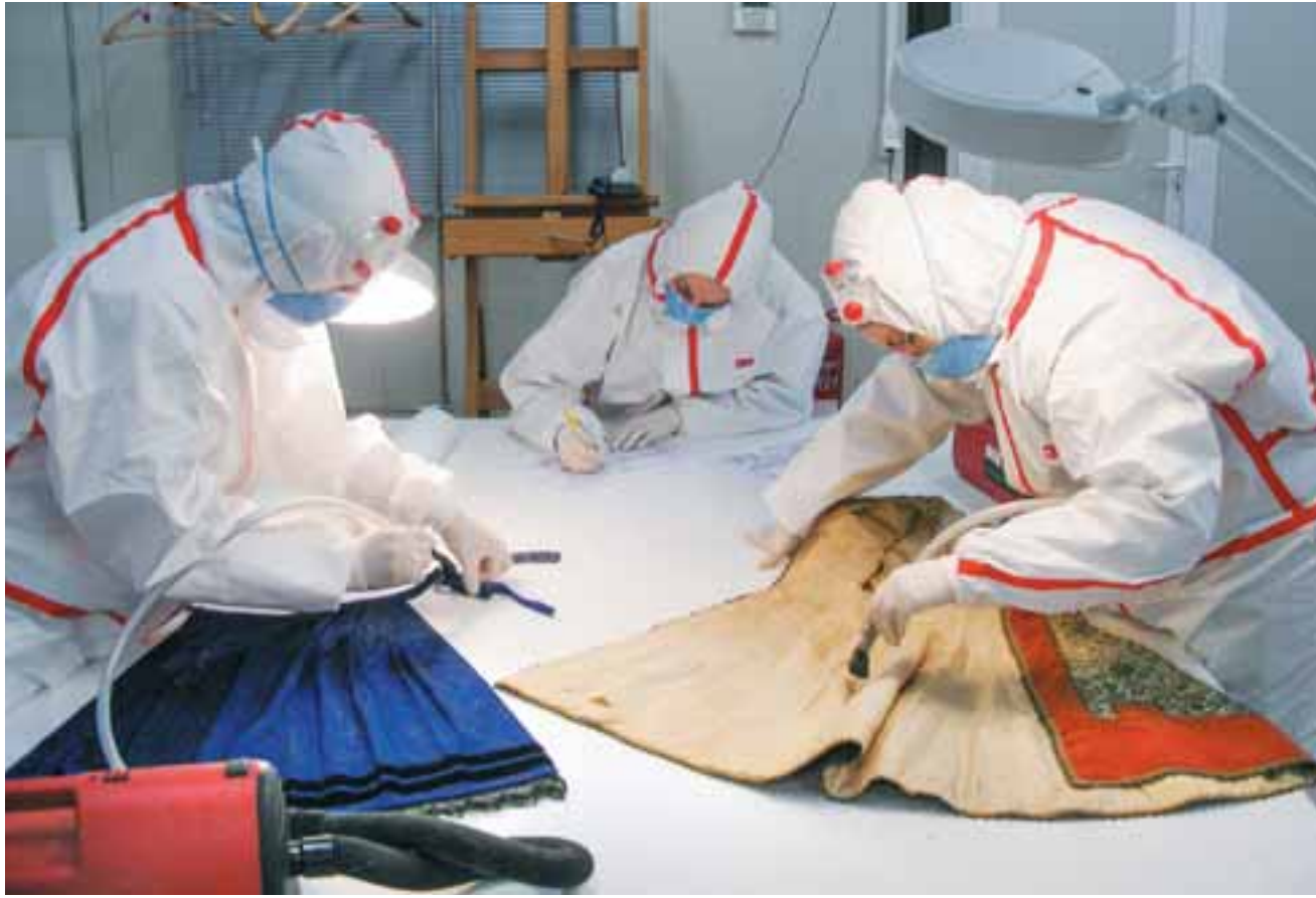
Συντηρητές με ειδικές στολές δίνουν τις «πρώτες βοήθειες» σε ένα φόρεμα.

Το φωτογραφικό υλικό του υπουργείου Πολιτισμού από τις εργασίες συντήρησης αναδεικνύει την πολυπλοκότητα, αλλά και τη σημασία της δουλειάς που έγινε τα προηγούμενα έτη. «Από το 2004 που τα κτίρια και το περιεχόμε-