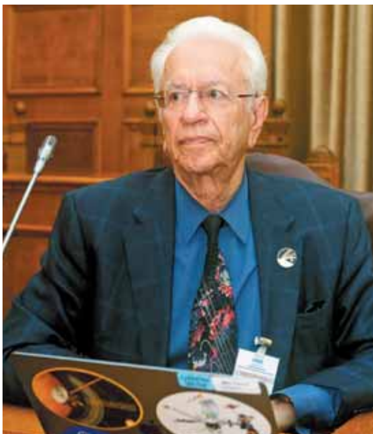
«Η ανάδειξη των επιστημόνων γίνεται στον επιστημονικό κόσμο και όχι στα σόσιαλ μίντια», επισημαίνει στην «Κ» ο διεθνούς φήμης επιστήμονας και ακαδημαϊκός Σταμάτης Κριμιζής.

Σταμάτης Κριμιζής κατασκεύαζε ένα από τα επιστημονικά όργανα που θα είχε πάνω του το διαστημόπλοιο «Mariner 4» για τον Άρη. Σήμερα, ο ακαδημαϊκός Σταμάτης Κριμιζής είναι άμισθος σύμβουλος του υπουργού Επικρατείας και Ψηφιακής Διακυβέρνησης Κυριάκου Πιερρακάκη και συνεχίζει την προσπάθειά του να φέρει πιο κοντά την Ελλάδα στο πρόσοφο,