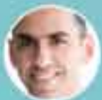
NIKOS CHRISTODOUIDES Minister of Finance of the Republic of Cyprus