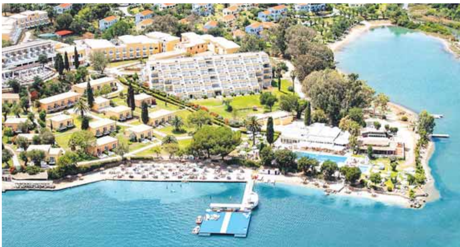
Ποσό ύψους 178,6 εκατομμυρίων ευρώ θα εισπράξει βάσει της συμφωνίας ο όμιλος από την συμφωνία με την Blackstone, για πώληση πέντε ξενοδοχείων στην Ελλάδα.

Το τρίτο σημείο το οποίο προκύπτει από την συμφωνία είναι ίσως το σημαντικότερο, μιας και αποτελεί δείγμα των προανατολισμών και των πλάνων του ομίλου. Πλέον ο Louis plc αποδεσμεύεται από το ιδιοκτησιακό καθεστώς των ξενοδοχείων και στρέφεται σχεδόν εξ ολοκλήρου στον τομέα της διαχείρισης των μονάδων τόσο σε Ελλάδα όσο και στην Κύπρο. Βάσει της συμφωνίας, πέντε ξενοδοχεία σε Κέρκυρα, Ζάκυνθο και Κρήτη, συνολικής δυναμικότητας 1.464 δωματίων περιέρχονται στα χέρια της Blackstone, ενώ ο όμιλος Louis παραμένει ο διαχειριστής των ξενοδοχειακών μονάδων. Πρόκειται για το Grand Resort και το Corcyra Beach στην Κέρκυρα, το Zante Beach και το Plagos Beach στην Ζάκυνθο, και το Creta Princess Beach στην Κρήτη. Πηγές