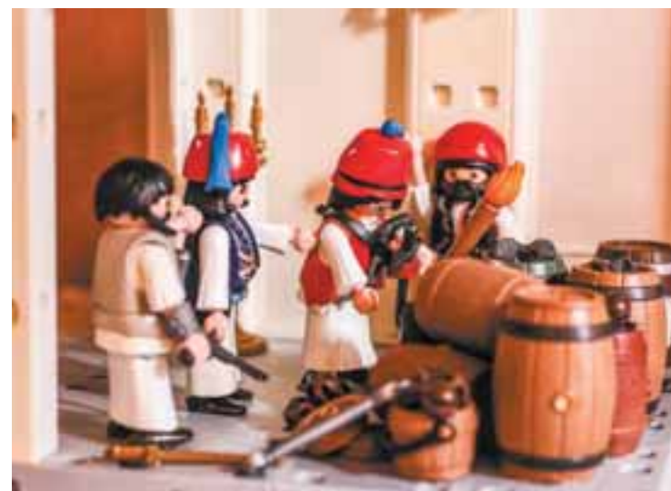
Η ανατίναξη της Μονής Σέκου, την οποία πολιορκούσαν 6.000 Τούρκοι, στις 9 Σεπτεμβρίου 1821. Διόραμα της Βασιλικής Φατί.