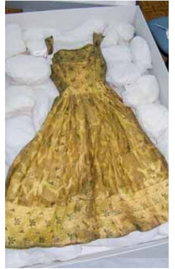
Φόρεμα αποθηκευμένο μετά τη συντήρηση.

Εκτός από τον μεγάλο αριθμό αντικειμένων από το ανάκτορο που παραμένουν ασυντήρητα, άγνωστος αριθμός τους παραμένει κλειστός σε ακόμα δύο κτίρια.