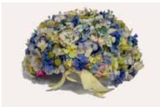
Τα υφασμάτινα αντικείμενα απαιτούν ειδική φροντίδα.