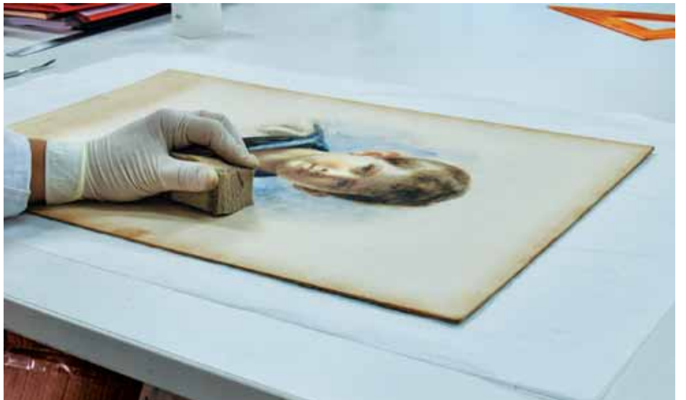
Συντήρηση πορτρέτου παιδιού που βρέθηκε στο ανάκτορο.

στο Μουσείο Νεότερου Ελληνικού Πολιτισμού στην Πλάκα (σ.σ.: είναι σήμερα κλειστό, καθώς βρίσκεται υπό μετεγκατάσταση). Η εντολή δόθηκε για την προστασία τους. Εμείς όμως διαφωνήσαμε με αυτή την απόφαση γιατί πιστεύουμε ότι η διάσπαση ενός συνόλου αντικειμένων δεν είναι σωστή και η μεταφορά τους ενέχει κινδύνους. Επιπλέον, τα αντικείμενα που μεταφέρθηκαν προέρχονταν από φυλασσομένους χώρους και όχι από τα «κλειστά» κτίρια. Ανα-