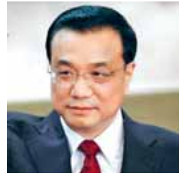
Απαισιόδοξος εμφανίστηκε ο Κινέζος πρωθυπουργός Λι Κεκιάνγκ.

Παρά την εφαρμογή μιας σειράς επεκτατικών μέτρων το τελευταίο έτος, πολλοί αναλυτές εκτιμούν ότι το Πεκίνο πρέπει να διοχετεύσει ακόμη περισσότερο χρήμα στην οικονομία, προκειμένου να αποτρέψει το ενδεχόμενο μεγαλύτερης επιβράδυνσης, σύμφωνα με το Reuters. Χθες, τέθηκε σε ισχύ η μείωση των ελάχιστων υποχρεωτικών αποθεματικών στις τράπεζες για τρίτη φορά φέτος, κάνοντας ένεση ρευστότητας στην οικονομία αξίας 126,35 δισ. δολαρίων. Η βιομηχανική παραγωγή αυξήθηκε