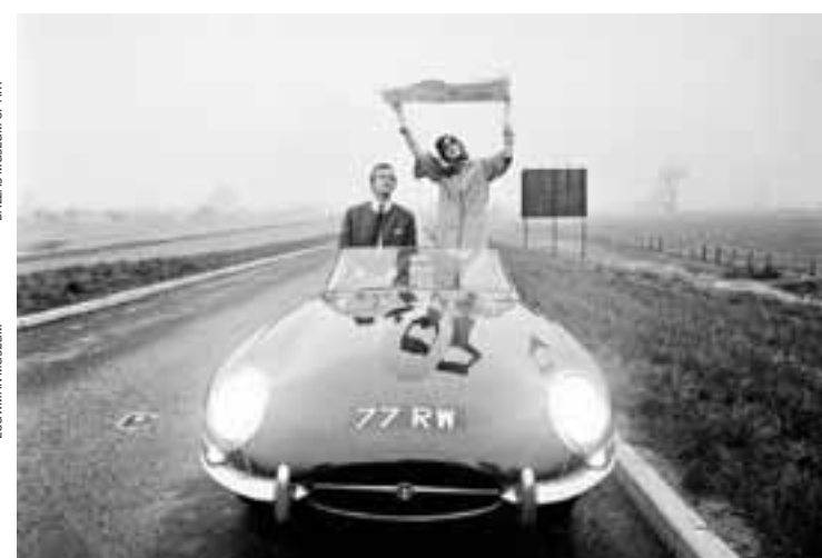
Ντόλτσε βίτα σε ένα ιστορικό αυτοκίνητο, μια Jaguar E-Type.

Γυναικείο καπέλο (1928-1929), ανεμιστήρας του 1937 επηρεασμένο από το ντιζίν των αυτοκινήτων και το τριών τροχών Messerschmitt KR200 του 1959.