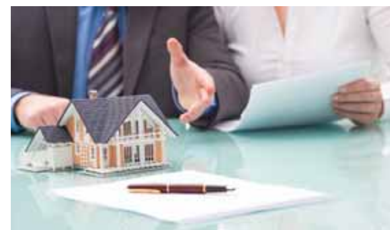
Στη σημερινή εποχή, οι πωλητές που ανταμείβονται είναι αυτοί που βάζουν πρώτα τους πελάτες τους.

Σαν πρώτο παράδειγμα, είναι η τακτική του να προσπαθεί ο πωλητής να πείσει τον πελάτη του να προχωρήσει σε πρόταση αγοράς πριν να είναι 100% έτοιμος. Αυτό ισχύει περισσότερο σε περιόδους που υπάρχει έντονη κινητικότητα στην αγορά. Από τη μια είναι κατανοητό πως σε τέτοιες συνθήκες μια περίπτωση δεν θα στέκει εκεί για πάντα. Όμως αυτός δεν είναι λόγος να ασκεί μεγάλη πίεση. Αντί των αφόρητων πιέσεων, είναι καλύτερα να ακολουθηθεί μια τακτική που να μεν να δηλώνει πως η περίπτωση δεν θα είναι εκεί για μεγάλο