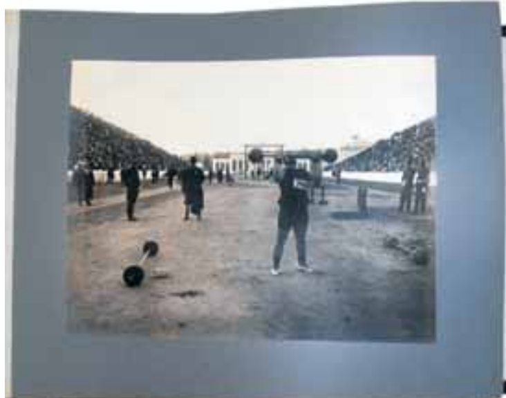
Φωτογραφία από αναμνηστικό λεύκιμμα για τους Ολυμπιακούς Αγώνες (Μεσολυμπιάδα) του 1906 στην Αθήνα.

Υπάρχει βέβαια και η άποψη ότι εφόσον δεν υπάρχει χώρος στο Τατόι, πρέπει τα 3.500 τ.μ. να αναζητηθούν αλλού. Υπάρχουν όμως πολλά ζητήματα και με αυτή την επιλογή, από την εξεύρεση του χώρου και το κόστος ενοικίασης έως την καταλληλότητα και τη φύλαξή του. Προσωπικά εκτιμώ ότι τα αντικείμενα δεν πρέπει να φεύγουν από