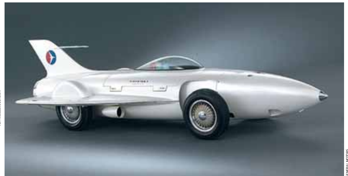
Το Firebird 1 του 1953 της General Motors. Θύμιζε μαχητικό αλλά... δεν πέταξε ποτέ.