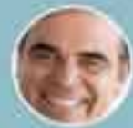
MARGARITA SCHINAS Chief Spokesperson of the European Commission