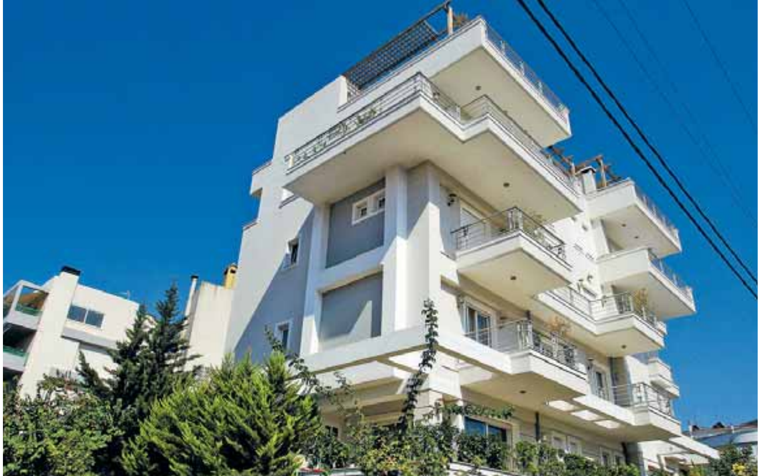
Από τον Φεβρουάριο του 2017 έως και τους πρώτους μήνες του 2019 στο Μητρώο Συναλλαγών Ακινήτων της ΑΑΔΕ είχαν καταχωρηθεί σχεδόν 40.000 πράξεις μεταβίβασης ακινήτων.

Ως εκ τούτου, όλοι οι παράγοντες συγκλίνουν υπέρ της διατήρησης της ανοδικής πορείας των