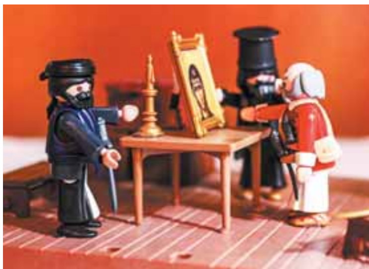
«Ορκος Φιλικού» (πιθανότατα του Κολοκοτρώνη), σκηνή εμπνευσμένη από την ομώνυμη ελαιογραφία του Διονυσίου Τσόκου (1849).