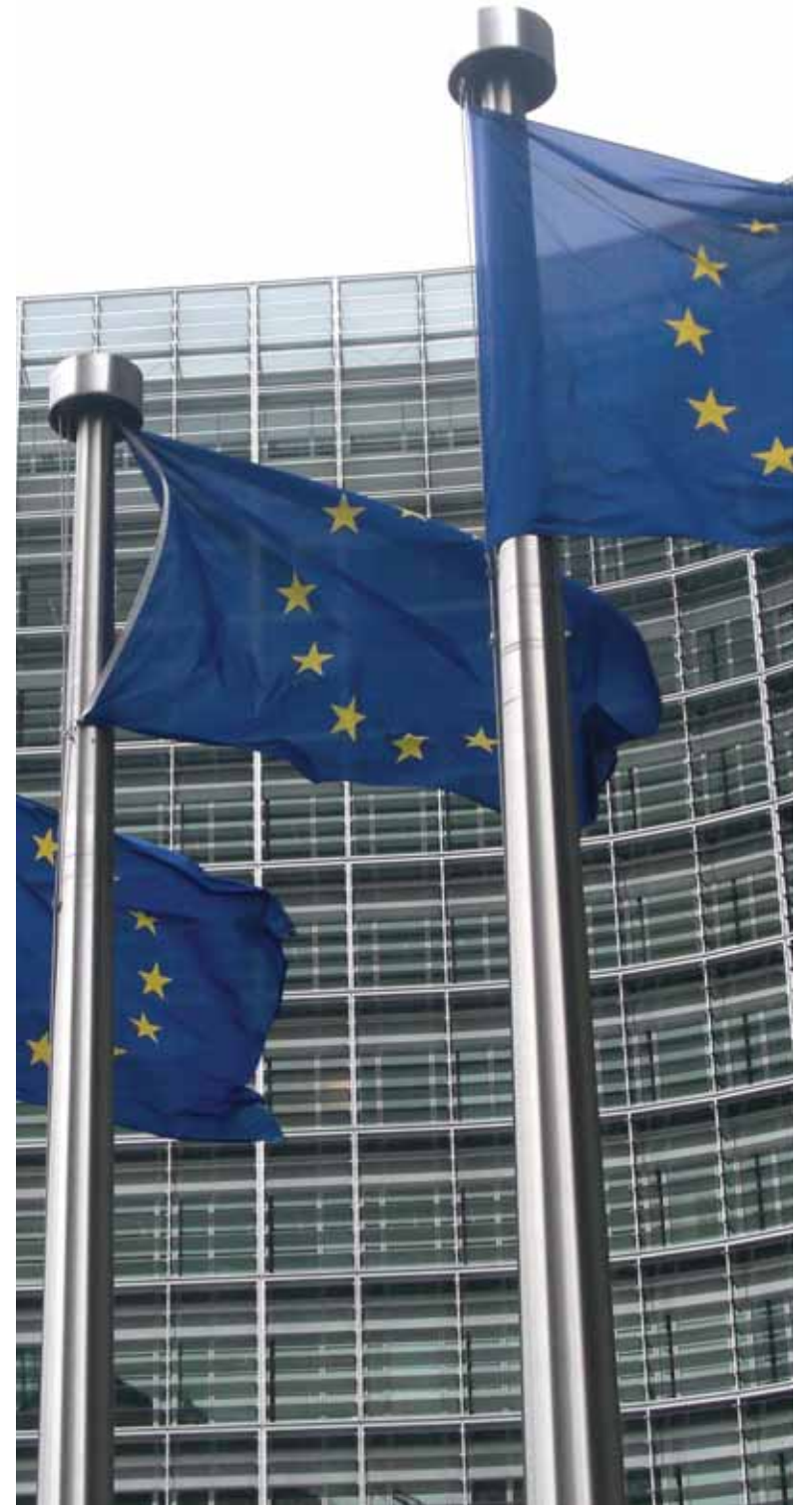
Πολύ αυστηρότερη από την αντίστοιχη πρωτοβουλία του ΟΟΣΑ είναι μέχρι στιγμής η υπό διαμόρφωση ευρωπαϊκή Οδηγία για την πάταξη της φοροαποφυγής.

Προσχέδια της Οδηγίας με διαφοροποιήσεις αποστέλλονται συνεχώς, με το τελευταίο να έχει ημερομηνία 15 Απριλίου και να περιλαμβάνει αρκετές τροποποιήσεις που μπορούν να εκληφθούν και ως χαλαρώσεις, ωστόσο, δεν επηρεάζουν την ουσία των βασικών προβληματικών προνοιών της.