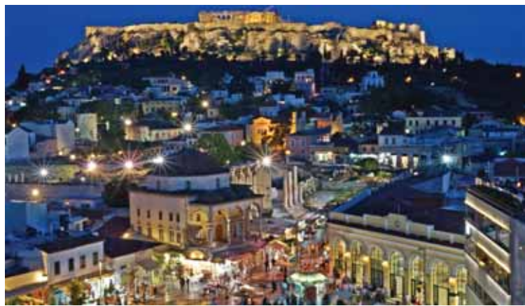
Ακόμα μία επιβάρυνση για τα νοικοκυριά.

Η επιβάρυνση των 103 εκατ. ευρώ ετησίως από την αύξηση του ΦΠΑ στα είδη παντοπωλείου από 23% σε 24% μεταφράζεται σύμφωνα με το Ινστιτούτο Έρευνας Λιανεμπορίου Καταναλωτικών Αγαθών (ΙΕΛΚΑ) σε πρόσθετη επιβάρυνση ύψους 2,1 ευρώ τον μήνα. Το ποσό μπορεί να φαίνεται μικρό, όμως δεν είναι. Πρώτον, διότι η προτεινόμενη αύξηση του συντελεστή ΦΠΑ από το 23% στο 24% θα αφορά και σειρά άλλων προϊόντων και υπηρεσιών. Δεύτερον, κάθε αύξηση, μικρή ή μεγάλη στις τιμές των τροφίμων επηρεάζει το βαλάντιο του Έλληνα καταναλωτή πολύ περισσότερο σε σύγκριση με τα προηγούμενα χρόνια, ακριβώς