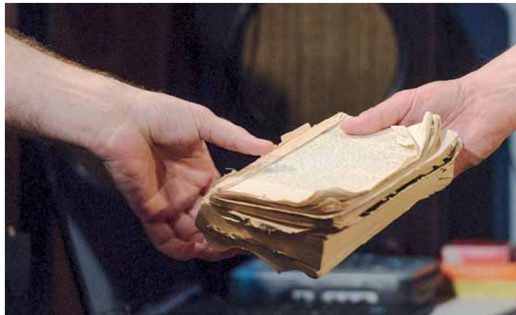
Η «Βίβλος» του Αδόλφου Χίτλερ με κρινισμένες και σκισμένες σελίδες αλλάζει χέρια στη σκηνή, όπως κάνει συνεχώς από την πρωτότυπη έκδοσή της. Οι Rimini Protokoll απομυθοποιούν το βιβλίο που στοιχειώνει τη γερμανική κοινωνία.

Είναι μια πρόκληση. Ελπίζουμε ότι θα γίνει διάλογος, ότι θα συζητήσουμε γι' αυτό», τονίζει. Σε κάθε πόλη που επισκέπτονται, δύο από τα μέλη του θιάσου αναλαμβάνουν να βρουν ένα αντίτυπο από την τοπική αγορά. Συ-