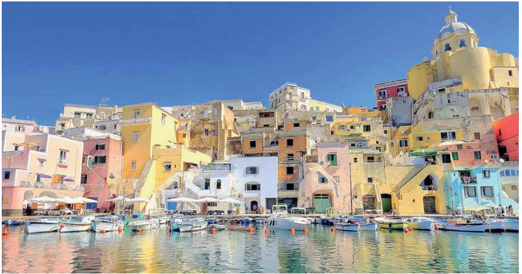
Κλασική ομορφιά της Costa Amalfitana με τους παραθαλάσσιους οικισμούς και τη μαγευτική διαδρομή, που χρειάζεται ιωτόσο προσοχή στο οδήγημα.

Θα μπορούσε να είναι το Αιγαίο ή το Ιόνιο, έχει αυτό το συγκεκριμένο κομπάλ χρώμα που κάνει τους Βορειοευρωπαίους πράσινους από τη ζήλια.