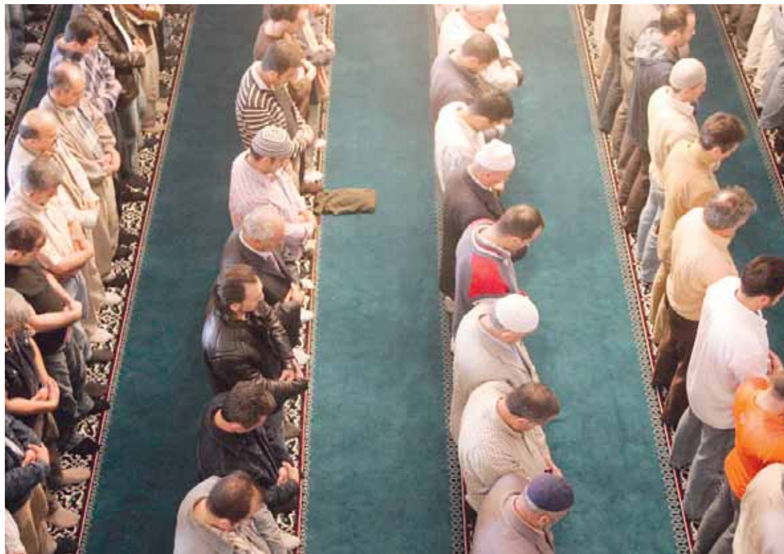
Υπάρχουν σε όλη την Ευρώπη τζαμιά και «πολιτιστικά κέντρα» που λειτουργούν ως εκκολλητήρια τζιχαντιστών.

ταγμα, δεν μπορεί να μη γνώριζε ότι το σύνταγμα προστατεύει όλες τις θρησκείες, περιλαμβανομένης της μουσουλμανικής. Ήθελε όμως να κάνει θόρυβο, ώστε να υπάρξει δημοσιότητα γύρω από το κόμμα της - έστω και αρνητική. Αντίστοιχη τακτική είχε χρησιμοποιήσει η επικεφαλής του κόμματος, Φράουκε Πέτρι, δηλώνοντας πριν από μερικούς μήνες ότι ως ύστατη λύση, οι συνοριοφύλακες έχουν δικαίωμα να πυροβολούν πρόσφυγες, μόνο και μόνο για να αποσύρει τη δήλωση, αφού πρώτα είχαν ασχοληθεί μαζί της όλα τα μέσα ενημέρωσης της χώρας της και αρκετά του εξωτερικού.