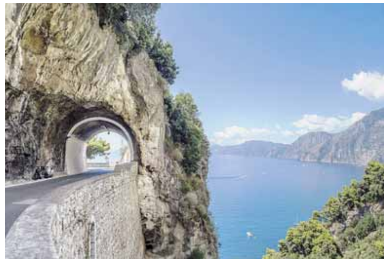
Ο δρόμος που οδηγεί στο Αμάλφι έχει άπειρες στροφές που αποκαλύπτουν ωραίες εκκλησίες, βίλες και σπιτάκια, καθώς και μικρές πόλεις. Η διαδρομή είναι μαγευτική, αν και απαιτεί προσοχή στην οδήγηση

Μη φύγετε αν δεν δοκιμάσετε τα gelati, όχι γιατί είναι τόσο ωραία αλλά γιατί το να κρατάς ένα παγωτό στο χέρι είναι μέρος του ταξιδιωτικού τελετουργικού της Ιταλίας. Επίσης, είναι ωραία όλα τα γλυκά που έχουν λεμόνι ή κρέμα λεμονιού. Οι ντόπιοι είναι πολύ ζεστοί, αλλά αν δεν μιλάτε ιταλικά θα ταλαιπωρηθείτε. Το duty free της Νάπολης δεν είχε πολλά καλούδια, οπότε μην περιμένετε να ψωνίσετε εκεί.