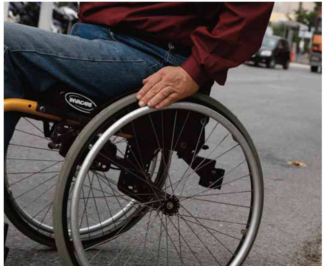
Γραφεία υποψηφίων βουλευτών και πολιτικά κόμματα χωρίς τις κατάλληλες υποδομές για την πρόσβαση ατόμων με κινητικές αναπηρίες.

Ουκ ολίγες φορές, η Παγκύπρια Συνομοσπονδία Οργανώσεων Αναπήρων επεχείρησε να θέσει τα αιτήματα των μελών της ενώπιον των κοινοβουλευτικών κομμάτων και του υπουργείου Εσωτερικών, ωστόσο, όπως τονίζουν, η ανταπόκριση ήταν σχεδόν ανύπαρκτη.