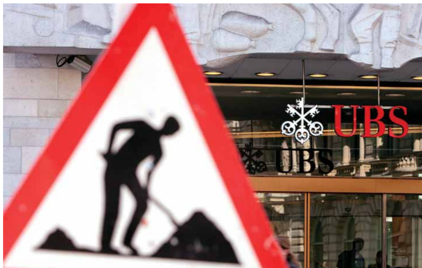
Ο ιστορικός χαρακτηρίστηκε η συμφωνία της περασμένης Τετάρτης μεταξύ των αμερικανικών αρχών και του ελβετικού τραπεζικού κολοσσού UBS...