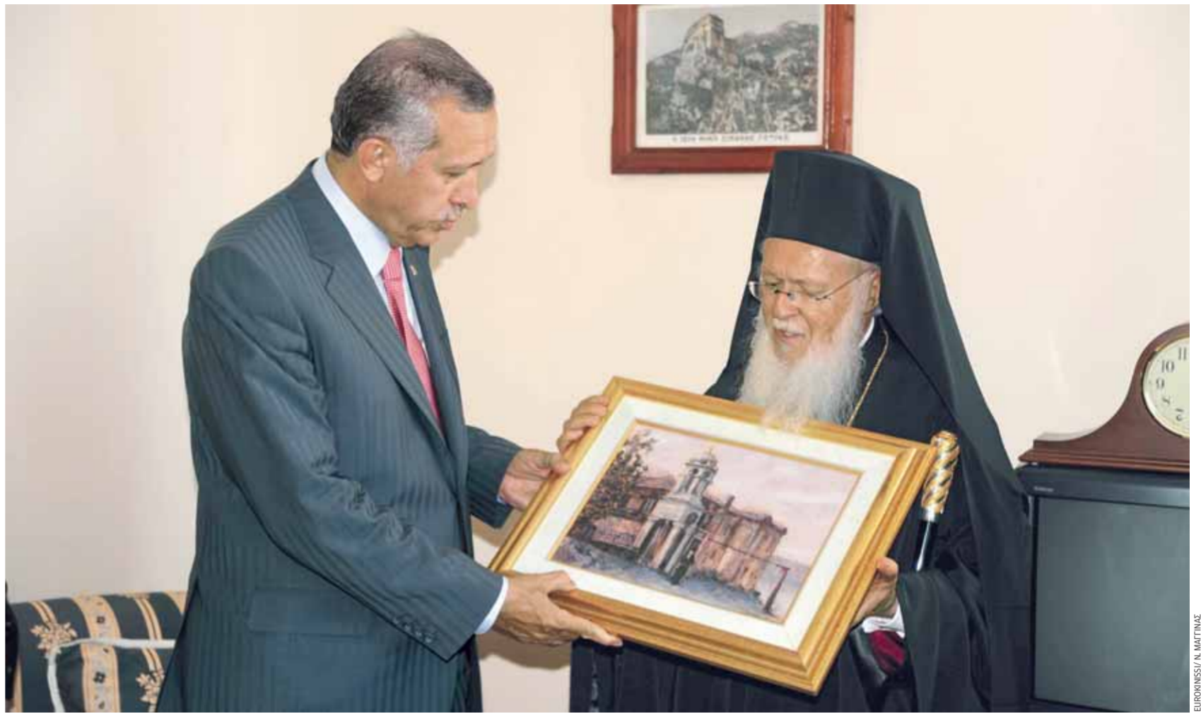
Επάνω: Ο Οικουμενικός Πατριάρχης προσφέρει στον κ. Ερντογάν έναν πίνακα με παράσταση της ιστορικής μονής του Αγ. Γεωργίου Κουδούνα. Κάτω: Ο κ. Βαρθολομαίος ξενάγει τον Τούρκο πρωθυπουργό στο Ορφανοτροφείο της Πρίγκηπου. Το Φανάρι θεωρεί ότι με την επίσκεψή του ο κ. Ερντογάν εμμέσως αναγνωρίζει την κυριότητα του Οικουμενικού Πατριαρχείου στα δύο ιστορικά ιδρύματα.

Καλός και ισχυρός ο συμβολισμός και η αξιοποίησή του, είναι όμως αρ-