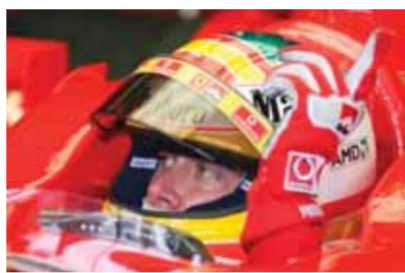
Ο Luca Badoer θα πραγματοποιήσει σήμερα στη Valencia αυτό που ονειρεύεται κάθε Ιταλός πολίτης.

που βρίσκεται στη μικρή πόλη Biassono, όχι πολύ μακριά από την εξακουστή πίστα.