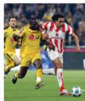
Αθηνών περιμένει στο δικαιοματικό...