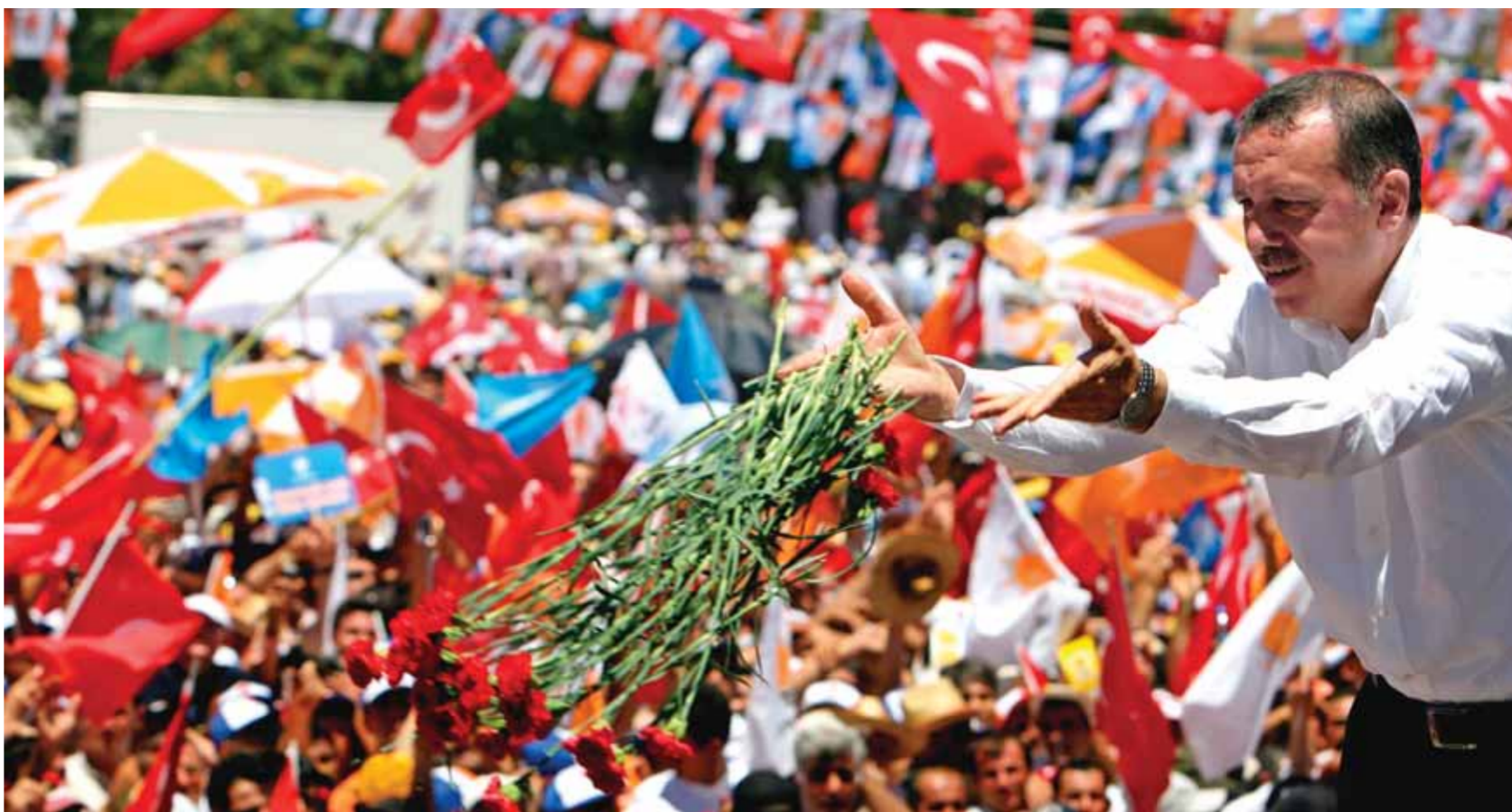
Παρά τις ισλαμικές του ρίζες, το Κόμμα Δικαιοσύνης και Ανάπτυξης του Ταγίπ Ερντογάν κατόρθωσε να κερδίσει τις γενικές εκλογές του 2002 με μεγάλη πλειοψηφία, εμφανιζόμενο ως ένα συντηρητικό δημοκρατικό κόμμα.

Το 2003 απονεμήθηκε στον Νταβούτογλου ο τίτλος του πρέσβη και διορίστηκε σύμβουλος του πρωθυπουργού Ερντογάν για θέματα εξωτερικής πολιτικής. Έκτοτε θεωρείται ο αρχιτέκτονας της εξωτερικής πολιτικής του ΚΔΑ και ακόμα από άλλους ως «Κιςινγκερ της τουρκικής διπλωματίας» για την ενεργητική και πολυδιάστατη εξωτερική πολιτική που σχεδίασε και