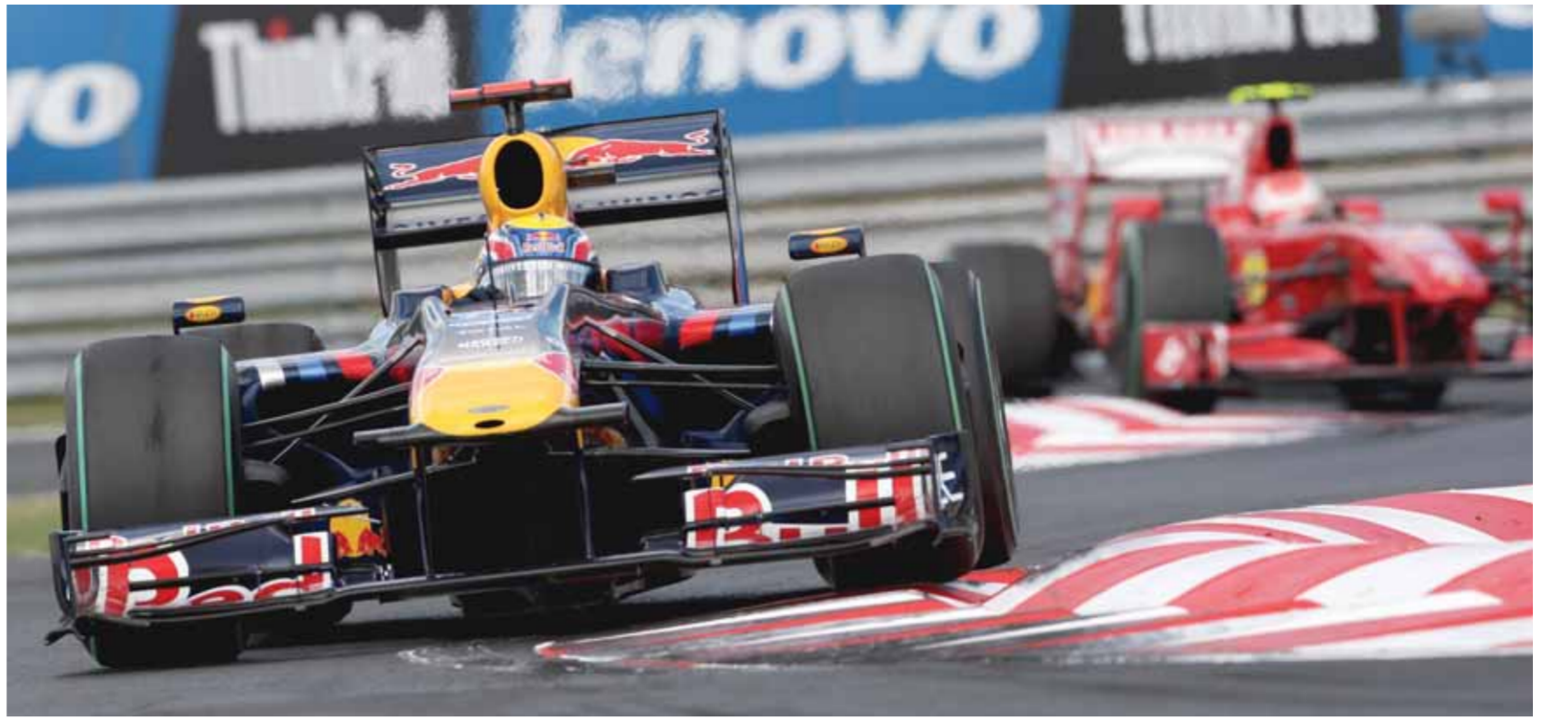
Κόκκινο στον καθρέφτη! Οι μέχρι τώρα πρωταγωνιστές αρχίζουν σιγά-σιγά να νιώθουν την πίεση.

Πριν από δέκα ακριβώς χρόνια, κατά τη διάρκεια της επισκεψής μου στη Monza, για το ιταλικό Grand Prix, βρέθηκα, λίγο μετά τα δοκιμαστικά της Παρασκευής, συντροφιά με ορισμένους φίλους στο εστιατόριο «El Cordobes»,